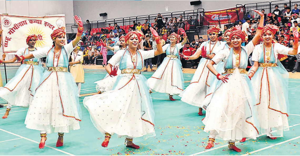
स्पোর্ट्स स्टेडियम में 69 वीं प्रदेशीय विद्यालयीय बैडमिंटन एवं टेबल टेनिस प्रतियोगिता के समापन पर सांस्कृतिक कार्यक्रम की प्रस्तुति देती छात्राएं। (संबंधित खबर पेज IV पर)।