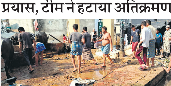
नगर निगम की भूमि से कब्जा हटवाती टीम।

बरेली, अमृत विचार : शहर में वार्ड 42 के मोहल्ला चौधरी में मस्जिद के पास नगर निगम की जमीन है, यहां ट्यूबवेल लगाया गया है, लेकिन बीते दिनों से पास ही रहने वाले राजा डेयरी वालों ने निगम की जमीन पर तिरपाल डालकर भैंस बांधना और नाद का