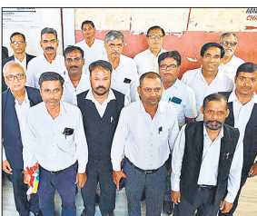
अधिवक्ता परिषद ब्रज का 34 वां स्थापना दिवस मनाते पदाधिकारी।