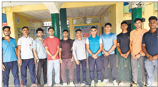
कुश्ती की मंडलीय टीम के चयनित खिलाड़ी।