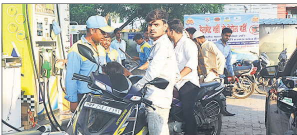
मालियों की पुलिसिया के पास पेट्रोल पंप पर बिना हेलमेट के पेट्रोल देते हुए। ● अमृत विचार