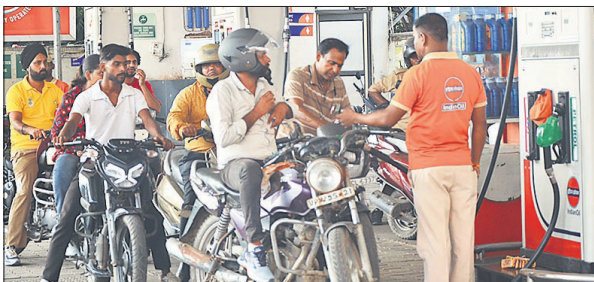
सिविल लाइंस स्थित पेट्रोल पंप पर बिना हेलमेट के बाइक सवार को पेट्रोल देते हुए।

प्रभा टाकेज के पास पेट्रोल पंप पर नो हेलमेट, नो फ्यूल का अनुपालन नहीं किया जा रहा था। जबकि अभियान शुरू होने के एक सप्ताह तक यहां काफी सख्ती देखने को मिली थी। बिना हेलमेट वालों को एंटी तक नहीं दी जा रही थी। बुधवार को यहां घड़ल्ले से बिना हेलमेट सभी को पेट्रोल मिल रहा था।