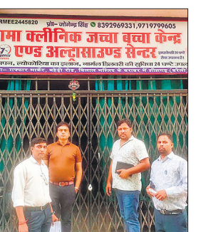
अस्पताल को सील करती स्वास्थ्य विभाग की टीम। ● अमृत विचार

जच्चा बच्चा केंद्र एवं अल्ट्रासाउंड सेंटर पर दो मरीजों को भर्ती कर इलाज चल रहा था। इस पर टीम ने अस्पताल के पंजीयन संबंधी दस्तावेज मांगे तो स्टाफ नहीं दिखा सका। इस पर दोनों मरीजों को स्थानीय सीएचसी पर शिफ्ट करने के बाद अस्पताल को सील कर दिया गया। आदेश क्लिनिक