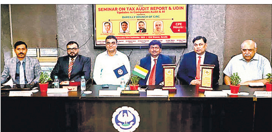
आईसीएआई भवन में आयोजित सेमिनार में मौजूद सीए।

नहीं था। पंजीयन दस्तावेज भी मौजूद नहीं मिले। इस पर हॉस्पिटल को सील किया गया। वहीं स्वास्थ्य विभाग की टीम के आने की सूचना पाकर उस इलाके संचालक क्लीनिक और अस्पताल बंद कर फरार हो गए।