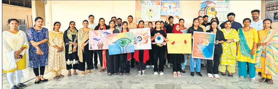
पोस्टर के माध्यम से जागरूक करते विद्यार्थी।