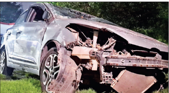
दरोगा की क्षतिग्रस्त कार (फाइल फोटो)। ● अमृत विचार

जानकारी के अनुसार कोतवाली इलाके की रंपुरा बस्ती में तैनात