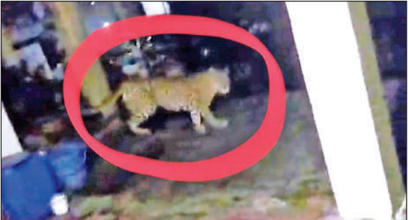
चीनाखान में शुक्रवार तड़के एक साथ दो गुलदार चहल कदमी करते दिखाई दिए।

अल्मोड़ा नगर में ही कई स्थानों पर गुलदार आएदिन सीसीटीवी कैमरे में कैद हो रहा है। स्थिति यह है कि ग्रामीण क्षेत्रों में लोग अंधेरा होते ही घरों में दुबकने को मजबूर हैं। वहीं, स्कूल जाने वाले बच्चों में भी गुलदार का भय बना रहता