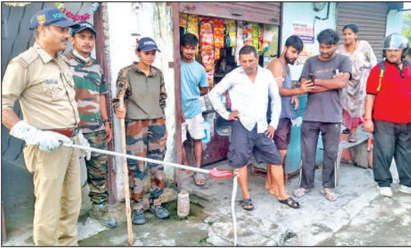
शांतिपुरी में कोबरा सांप को पकड़ते वन कर्मी।