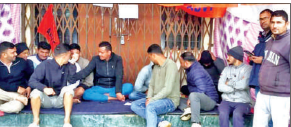
देवीधुरा महाविद्यालय में धरना देते छात्र।