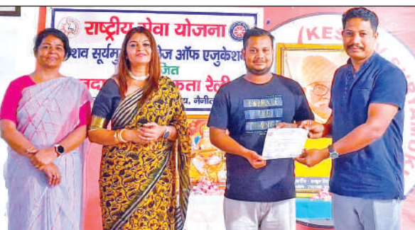
प्रमाण पत्र वितरित करते महाविद्यालय के प्रबंधक व प्राचार्य।