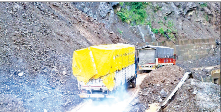
टनकपुर पिथौरागढ़ एनएच खुलने के बाद शुरू हुई वाहनों की आवाजाही।