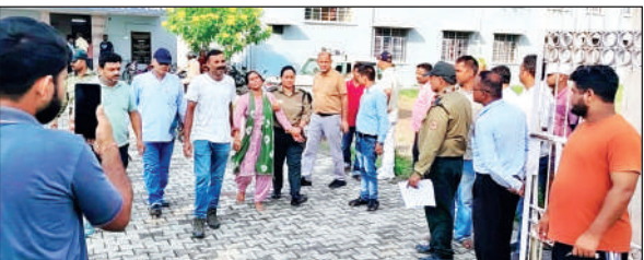
घटना के बाद विपिन सिंह रावत भवन के बाहर लगी भीड़।