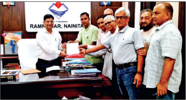
उपजिलाधिकारी को ज्ञापन देते वरिष्ठ नागरिक।