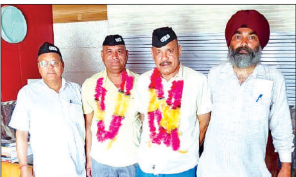
काशीपुर में उक्रंद के नवनियुक्त पदाधिकारी।