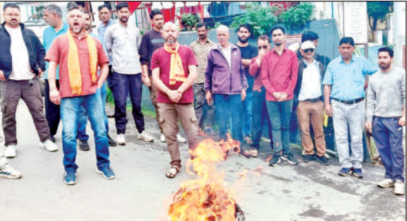
गांधी चौक पर पुतला दहन करते विध्व हिंदू परिषद के सदस्य। ● अमृत विचार

उधर, टनकपुर- पूर्णागिरि राज्य मार्ग एवं अमोड़ी- छतकोट और गल्लागांव- देवलीमाफी मोटर ग्रामीण मोटर मार्ग शाम तक भी नहीं खुल पाए थे।