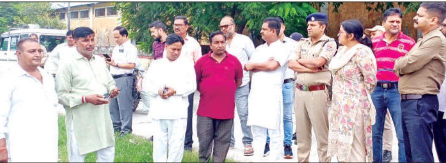
बाजपुर में कृषि उत्पादन मंडी समिति परिसर का निरीक्षण करते स्थानीय प्रशासनिक अधिकारी एवं रामलीला कमेटी के लोग।