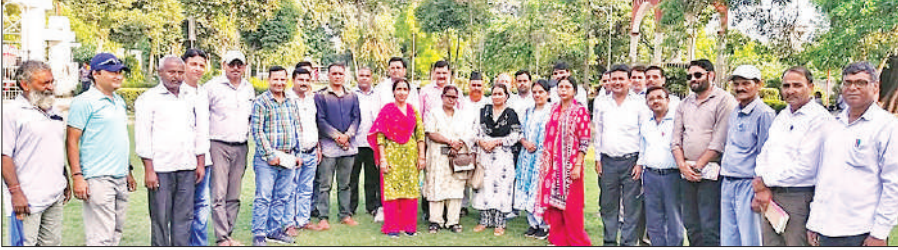
उत्तर प्रदेशीय प्राथमिक संघ की बैठक के दौरान एकत्र शिक्षक।

पुलिस ने परिजनों को समझा बुझाकर शांत कराया। शव कब्जे में कर पोस्टमार्टम के बाद परिजनों को सौंप दिया। परिजनों ने गुरुवार को शव का अंतिम संस्कार कर दिया। पुलिस ने मृतक के भाई की और से ससुरालियों के खिलाफ संबंधित धाराओं में रिपोर्ट दर्ज की है।