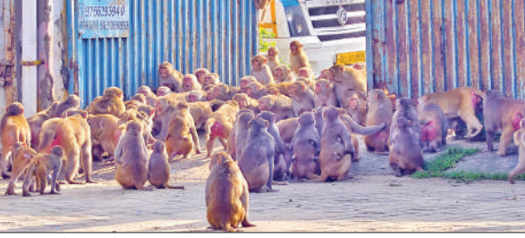
सड़क पर बैठा बंदरो का झुंड।

नगर में बंदरों से गृहणियों ही नहीं, आम आदमी परेशान हैं। पिछले कुछ दिनों से बंदरों का इस कदर आतंक बना हुआ है कि इनके डर से न सिर्फ गृहणियों ने छत पर कपड़े सुखाने बंद कर दिए। लोगों का कहना है कि छत पर सूखने के लिए डाले