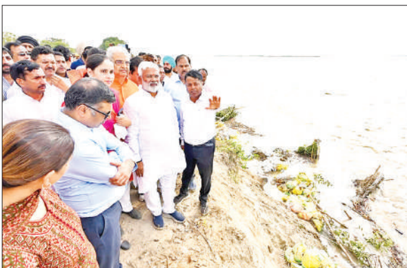
रावली तटबंध का निरीक्षण करते मंत्री स्वतंत्र देव सिंह।

बता दें कि 1984 में निर्मित गंगा बैराज से रावली तक का अपलेक्स बांध आसपास के गांवों को गंगा के पानी से बचाव प्रदान करता है। 7 सितंबर को तटबंध के किलोमीटर 6 पर कटान शुरू हुआ, जो बढ़कर करीब 800 मीटर तक पहुंच गया। इस कटान के कारण तटबंध पर बनी पक्की सड़क का बड़ा हिस्सा गंगा में समा गया। खतरे को देखते हुए रविवार से ही प्रशासन ने कटान करने के प्रयास शुरू कर दिए थे। लखनऊ से सिंचाई विभाग के वरिष्ठ अधिकारी, नेशनल हाईवे की टीम और विभिन्न जिलों के अफसर भी मौके पर पहुंचे। ग्रामीणों ने ट्रैक्टर-ट्राली और मशीनरी लगाकर प्रशासन की