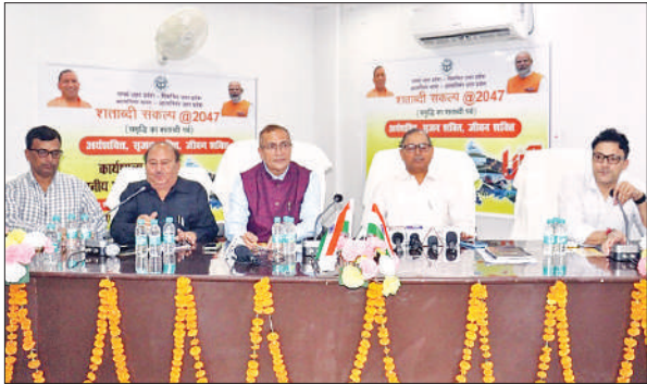
विकास भवन में हुए संवाद के दौरान मौजूद अधिकारी।

उन्होंने कहा कि 12वें पायदान से देश की अर्थव्यवस्था चौथे पायदान पर आ गई है। आत्मनिर्भर भारत, आत्मनिर्भर उत्तर प्रदेश बनाने के लिए संवाद के जरिए व्यापारियों, उद्यमियों, किसानों, बुद्धिजीवियों पत्रकारों, किसानों, महिलाओं और एनजीओ से संवाद के जरिए सुझाव लिए गए। पत्रकारों से भी संवाद किया।