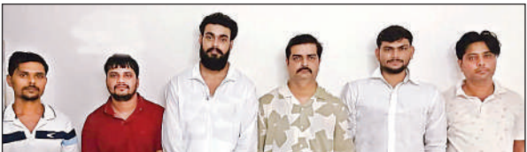
एसटीएफ की गिरफ्त में आए साइबर जालसाज।