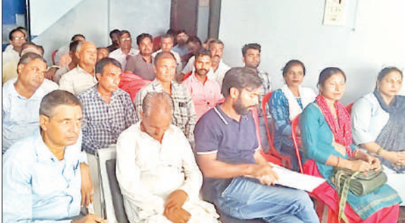
ठाकुरद्वारा में अभियान की कार्यशाला में मौजूद भाजपा कार्यकर्ता।