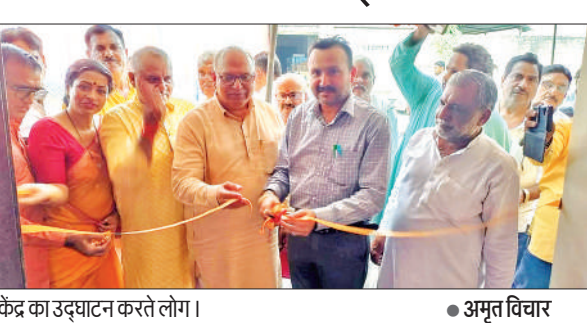
केंद्र का उद्घाटन करते लोग।