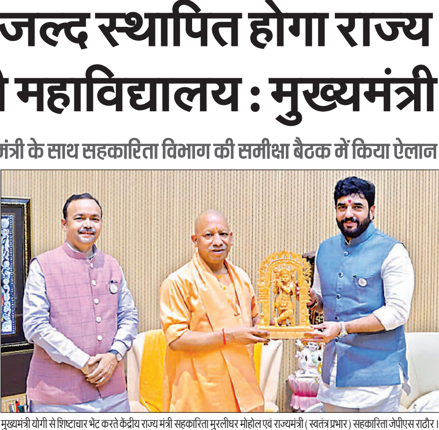
मुख्यमंत्री योगी से शिष्टाचार भेंट करते केंद्रीय राज्य मंत्री सहकारिता मुरलीधर मोहोले एवं राज्यमंत्री ( स्वतंत्र प्रभार) सहकारिता जेपीएस राठौड़।

न केवल परिवहन बुनियादी ढांचे को बेहतर बनाएगी, बल्कि रोजगार, उद्यमिता और क्षेत्रीय विकास को भी मजबूती देगी। टोकन मनी योजना छोटे-बड़े सभी उद्यमियों के लिए एक सुलभ और व्यावहारिक रास्ता खोल रही है। सरकार का मानना है कि बड़ी निवेश परियोजनाओं के साथ-साथ छोटे उद्यमों को भी जमीन