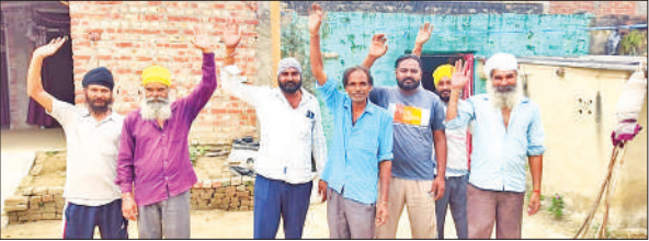
आबकारी विभाग के खिलाफ प्रदर्शन करते ग्रामीण।