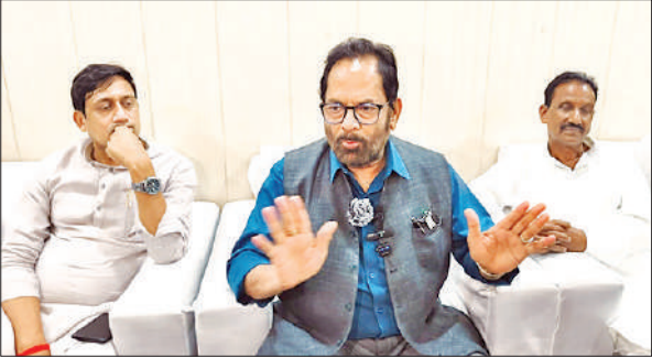
पत्रकार वार्ता के दौरान बोलते मुख्तार अब्बास नकवी।

पूर्व केंद्रीय मंत्री नकवी का भाजपाइयों ने कोसी पुल पर स्वागत किया। उसके बाद वह आंबेडकर पार्क के सामने स्थित निरीक्षण भवन में पहुंचे। पत्रकारों से बातचीत में उन्होंने कहा कि कुछ लोग, हाथ में संविधान की किताब, हरकत में व्यवधान की करतूत से काल्पनिक भय-भ्रम के