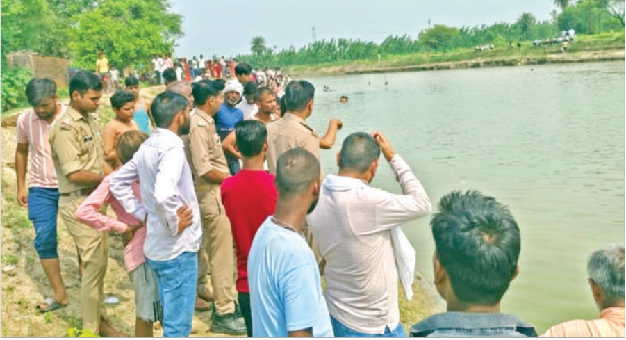
संभल के बेरनी गांव में तालाब में युवक को खोजते गोताखोर व तालाब किनारे खड़े ग्रामीण।