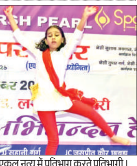
एकल नृत्य में प्रतिभाग करते प्रतिभागी।