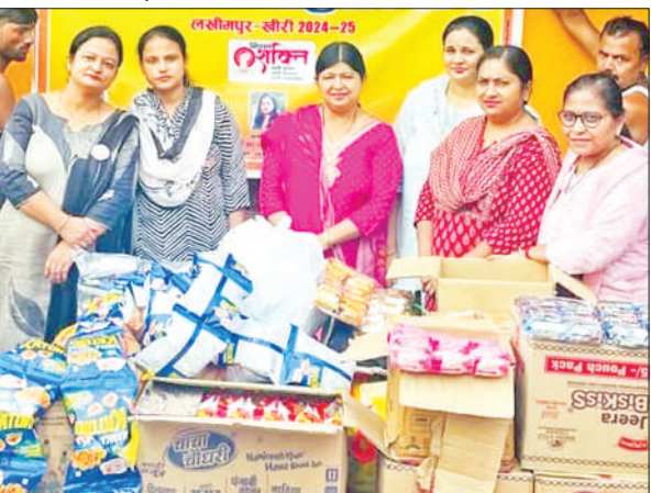
बाढ़ पीड़ितों को राहत सामग्री भेजती अग्रवाल महिला संघ महिलाएं।