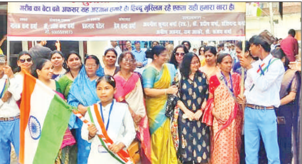
कवियत्री महाकुंभ के लिए जागरुकता रैली निकालते सरदार पटेल कॉलेज के विद्यार्थी।

कवियत्री महाकुम्भ साहित्य और संस्कृति का जीवंत संगम है। यह मंच कवियत्रियों को अपनी प्रतिभा व्यक्त करने का अवसर देकर नारी शक्ति, संवेदना और काव्य परंपरा का गौरव बढ़ाता है। यहां शब्द केवल कविता नहीं, बल्कि समाज के लिए प्रेरणा और नवचेतना बनकर गुंजते हैं।