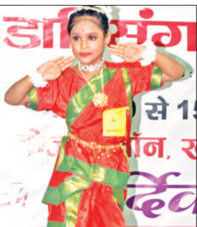
एकल नृत्य में प्रतिभाग करते प्रतिभागी।