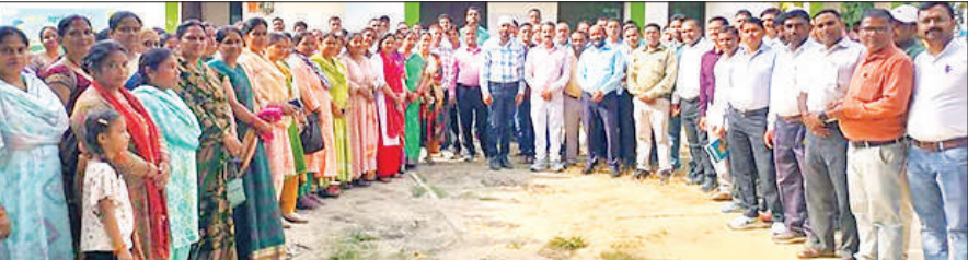
बीआरसी केंजा पर प्रशिक्षण समापन में मौजूद शिक्षक।

कुत्ते व शियार के पगचिह्न मिले हैं। बाघ के पगचिह्न बड़े होते। उन्होंने बताया कि बछड़ा पहले से बीमार था किसी जानवर ने उसको नोच डाला है। खेत में मिले वन्य जंतु के पग चिह्न घटना स्थल पर वन विभाग की टीम व ग्रामीण पहुंचे। वहीं ग्रामीणों ने वन विभाग से जंगली जानवरों को पकड़ने की मांग की है। ग्रामीणों का कहना कि जंगली जानवरों से उनके पशुओं को खतरा है। फिलहाल वनरक्षक ने ग्रामीणों को सतर्कता बरतने की सलाह दी है। अपने पशुओं को सुरक्षित स्थान पर रखने की बात कही है।