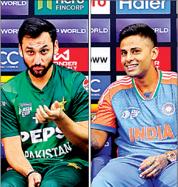
पाकिस्तान के कप्तान सलमान अली आगा व भारत के कप्तान सूर्य कुमार यादव।

अपने पहले मैच में हांगकांग पर आसान जीत से उत्साहित बांग्लादेश की टीम शुक्रवार को यहां एशिया कप के ग्रुप बी मुकाबले में छह बार के चैम्पियन श्रीलंका से भिड़ेगी, जो इस मुकदले का भाग्य तय करने में अहम भूमिका निभा सकता है। एशिया कप खिताब की तलाश में लगे बांग्लादेश के अभियान की शुरुआत अच्छी रही। कप्तान लदन दास ने 59 रन की पारी की मदद से बांग्लादेश ने हांगकांग पर सात विकेट से जीत दर्ज की। बांग्लादेश ने इस मैच में भले ही आसानी से जीत हासिल की लेकिन कुछ ऐसे विभाग हैं जिनमें उसकी