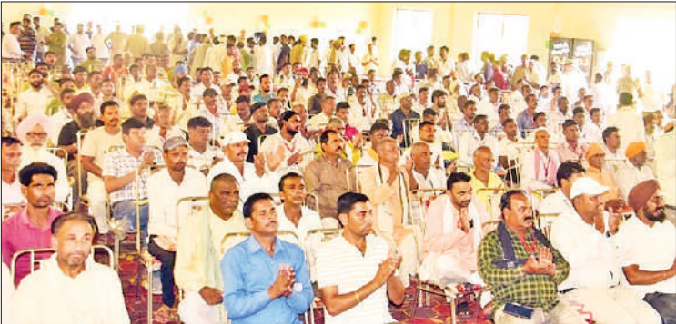
सामान्य निकाय की बैठक में मौजूद किसान।