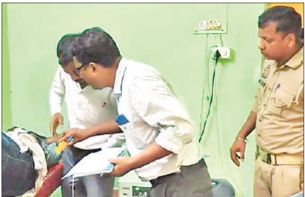
बिलसंडा सीएचसी में घायल का इलाज करती टीम।