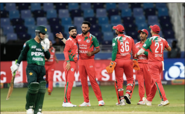
पाकिस्तान के सैम अयूब को आउट करने का जश्न मनाते हुए ओमान के खिलाड़ी।

मीटर का आंकड़ा नीरज चोपड़ा ने इस साल की शुरुआत में दोहा डायमंड लीग में हासिल किया था, लेकिन पूरे साल में उनका प्रदर्शन औसत ही रहा है।