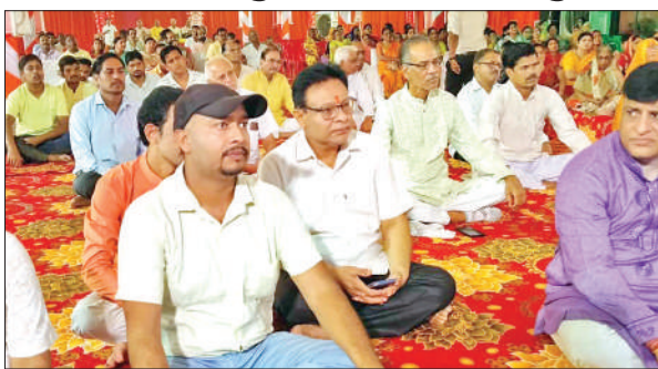
अग्रवाल सभा भवन में चल रही श्रीमद भागवत कथा सुनने पहुंचे श्रद्धालु।