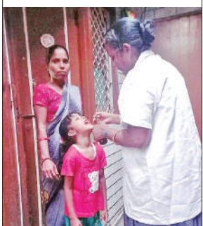
बुखार से पीड़ित बच्चों को विटामिन ए की खुराक पिलानी स्वास्थ्य कर्मी।

जानकारी मिलने के बाद स्वास्थ्य विभाग की टीम अगले ही दिन गांव गई लेकिन जलभराव के चलते टीम ने मरीज और उसके परिजनों को सीएचसी बुलाया। उसकी जांच रिपोर्ट और अन्य जांच की गई। जिसमें खसरा की पुष्टि हुई। इसके बाद शुक्रवार को जिला प्रतिरक्षण