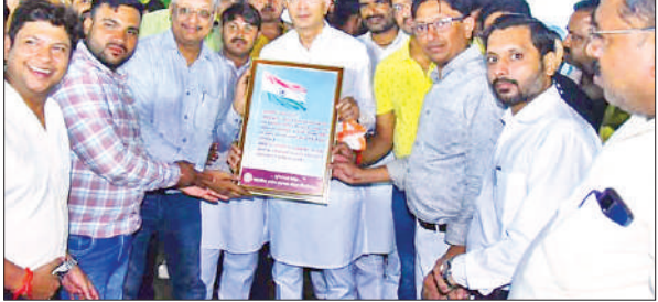
केंद्रीय राज्यमंत्री जितिन प्रसाद को व्यापार मंडल की तरफ से स्मृति चिन्ह देते व्यापारी।

अतिथियों का व्यापारियों ने कार्यक्रम स्थल पर पहुंचते ही स्वागत किया। इसके बाद स्थानीय जरूरतों और भविष्य की योजनाओं पर गंभीरता से चर्चा की गई। किराना, केमिस्ट, खाद्य थोक विक्रेता, सर्राफ, राइस