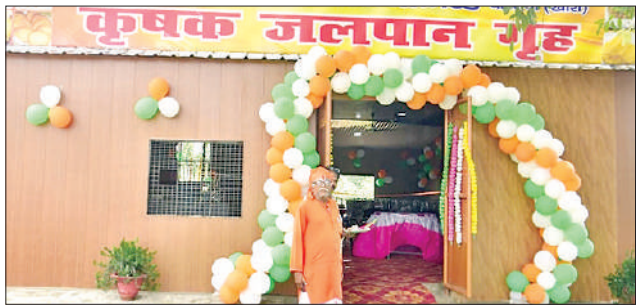
चीनी मिल में बनाया गया किसान जलपान गृह।

किसानों ने इस पहल को किसान हित में बड़ा कदम बताते हुए डीएम और विधायक का आभार जताया। उनका कहना था कि इस कैटीन से गन्ना लाने वाले किसानों को उचित दाम पर समय से भोजन मिल सकेगा और उनका समय व मेहनत दोनों बचेगे।