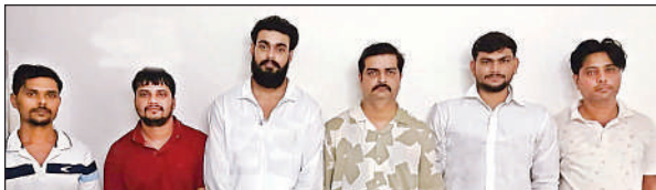
एसटीएफ की गिरफ्त में आए साइबर जालसाज।