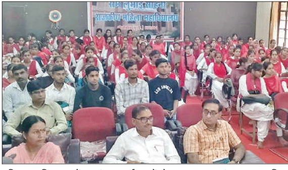
महिला महाविद्यालय में हुए संवाद कार्यक्रम में मौजूद छात्र-छात्राएं।