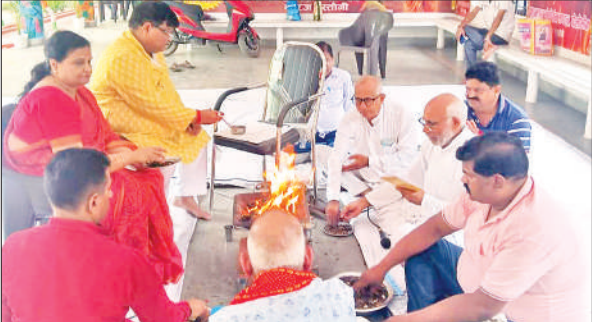
मुक्तिधाम परिसर में हवन पूजन में शामिल समिति के सदस्य।

बता दें कि 7 सितंबर से पितृपक्ष शुरू हो चुके हैं, जो 21 तक चलेंगे। पितृपक्ष को श्राद्ध भी कहा जाता है। पूर्वजों की आत्मा शांति के लिए पिंडदान, तर्पण और ब्रह्मभोज