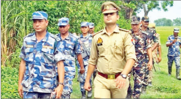
गश्त करती एपीएफ ( नेपाल पुलिस ), एसएसबी व हजारा पुलिस।