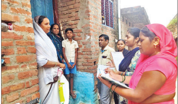
घर-घर जाकर सर्वे करती स्वास्थ्य विभाग की टीम।