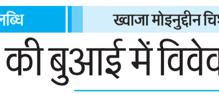
कार्यालय संवाददाता, लखनऊ