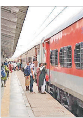
अवैध वेंडर ट्रेन के अंदर सामान बेचते हैं।