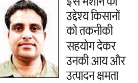
इस मशीन का उद्देश्य किसानों को तकनीकी सहयोग देकर उनकी आय और उत्पादन क्षमता बढ़ाना है।आधुनिक खेती के इस युग में सरसों जैसी महत्वपूर्ण फसल को वैज्ञानिक ढंग से बोने की यह मशीन एक नया अध्याय लिखेगी।

की खपत होती थी, बल्कि समय और श्रम की भी बर्बादी होती थी। इस नई मशीन की मदद से सरसों के बीजों की रो-टू-रो दूरी 30 सेंटीमीटर तथा प्लांट-टू-प्लांट दूरी 12 से 15 सेंटीमीटर के हिसाब से बुआई की जा सकती है। साथ ही बीजों को 1 से 2 सेंटीमीटर गहराई में सटीक रूप से डाला जा सकता है। यह मशीन प्रिसाइज फार्मिंग की दिशा में एक