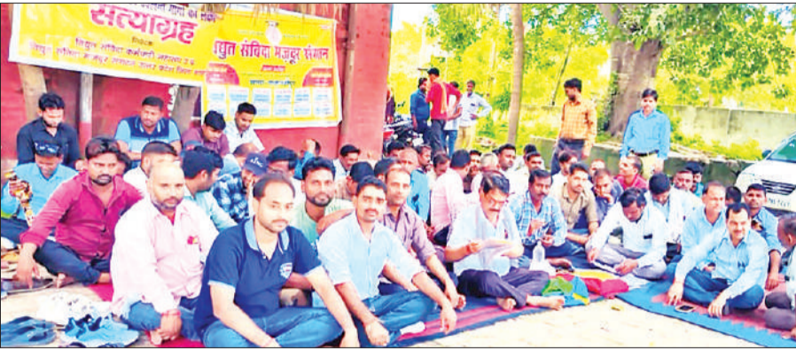
अधीक्षण अभियंता कार्यालय में धरने पर बैठे संविदा कर्मी।