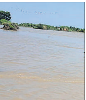
गंगा में कम हो रहा जलस्तर।

सहसवान क्षेत्र में वह रही महावा नदी शुक्रवार को शांत दिखी। नदी का पानी बांध के नीचे उतर रहा है जिससे क्षेत्रीय लोगों ने राहत महसूस की है। संभावना है कि यदि दो दिन तक पानी कम आया तो नदी अपने मूल स्वरूप में आ जाएगी। खागी नगला और वीर सहाय नगला के लोग अपने घरों को लौट रहे हैं। बाढ़ का पानी कम होने से क्षेत्र में फिर से जिंदगी पटरी पर लौट रही है।