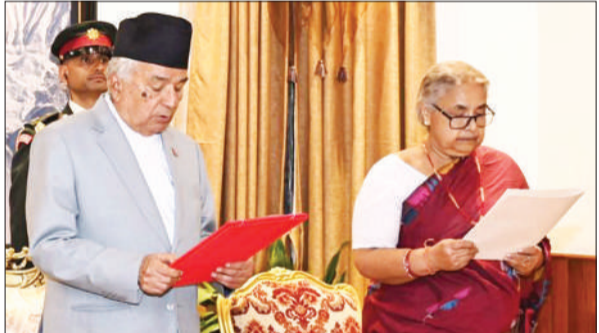
सुशीला कार्की को प्रधानमंत्री पद की शपथ दिलाते राष्ट्रपति रामचन्द्र पौडेल।

के साथ-साथ, अधिकारी उनके मौजूदा लाइसेंस भी रद्द कर रहे हैं। पीठ ने टिप्पणी की कि अधिकारियों द्वारा पटाखों के लाइसेंस रद्द करने के संबंध में यथास्थिति बनी रहेगी और उन्होंने मामले की सुनवाई 22 सितंबर के लिए स्थगित कर दी।