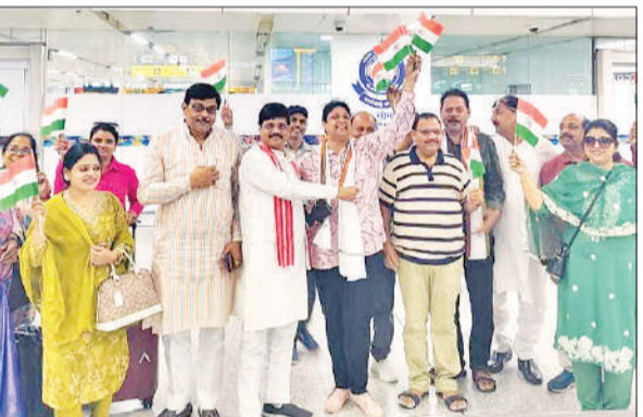
दिल्ली एयरपोर्ट पर लोगों का स्वागत करते भाजपा नेता। ● अमृत विचार

वापस आए लोगों का एयरपोर्ट पर मिलने बीजेपी नेताओं ने उनका स्वागत किया और तिरंगा भेंट किया। परिजन अपने प्रियजनों को देखकर