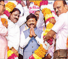
महाधिवेशन के दौरान नंद गोपाल गुप्ता नंदी।

अमृत विचार : औद्योगिक विकास मंत्री नन्द गोपाल गुप्ता नन्दी ने कहा कि एक समय था, जब व्यापारियों को माफिया की धमकियों और गुंडों के भय के सामने आत्मसमर्पण करना पड़ता था। प्रदेश में माफियाओं के काले साम्राज्य पर योगी सरकार के सुशासन का बुलडोजर चल रहा है। कानून को चुनौती देने वाले कुछ माफिया दूर चले गये हैं और कुछ बहुत दूर चले गये, जहां से वापस लौटना असम्भव है। व्यापारी बेखौफ