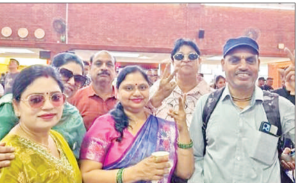
काटमांडू स्थित एयरपोर्ट पर भारत आने की खुशी जताते लोग।

7 सितंबर को कस्बा इस्लामनगर सहित जिले से 23 लोग नेपाल घूमने गए थे। यहां पशुपतिनाथ मंदिर में दर्शन करने के बाद हिंसा भड़क गई। हिंसा के दौरान सभी लोग एक होटल में फंस गए थे। अनहोनी घटना की आशंका जताते हुए नेपाल में फंसे लोगों ने प्रधानमंत्री से सुरक्षित भारत लाने के लिए हाथ जोड़कर गुहार लगाते हुए वीडियो जारी किया था। वीडियो जारी होने के बाद अगले दिन प्रशासन की टीम नेपाल में फंसे लोगों के घर पहुंची थी। परिजनों ने नेपाल में फंसे लोगों को सुरक्षित लाने का आश्वासन दिया था। इसके बाद से उनके भारत वापस आने की कवायद शुरू हो गई थी। शुक्रवार की सुबह नेपाल में फंसे लोगों की फ्लाइट से दिल्ली इंदिरा गांधी एयरपोर्ट पर सुरक्षित पहुंचे। नेपाल से सुरक्षित