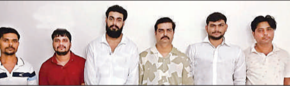
एसटीएफ की गिरफ्त में आए साइबर जालसाज।