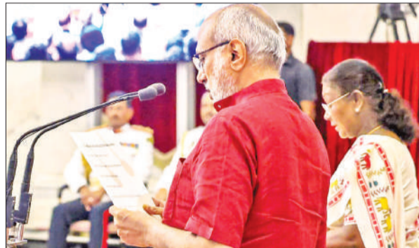
राधाकृष्णन को उपराष्ट्रपति पद की शपथ दिलाती राष्ट्रपति द्रौपदी मुर्मू।

राधाकृष्णन ने मंगलवार को हुए उपराष्ट्रपति चुनाव में संयुक्त विपक्ष के उम्मीदवार बी सुदर्शन रेड्डी को 152 मतों के अंतर से हराकर जीत हासिल की थी। जगदीप धनखड़ के 21 जुलाई को स्वास्थ्य कारणों से अचानक उपराष्ट्रपति पद से इस्तीफा देने के कारण यह चुनाव हुआ। धनखड़ भी