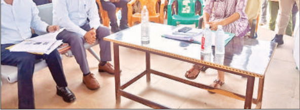
बरेली से जांच करने पहुंची टीम के सदस्य।

● किसानों को किसी प्रकार की परेशानी न होने के डीएम ने दिए निर्देश