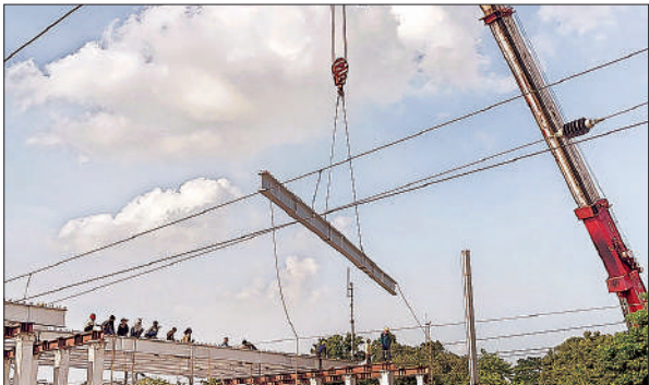
फुटओवर ब्रिज पर लगाए गए गर्डर।

अमृत विचार। रेलवे स्टेशन पर नए फुटओवर ब्रिज के निर्माण का कार्य तेजी से चल रहा है। इसी क्रम में डाउन ट्रेक पर विशाल गर्डर रखने का काम किया गया। यह कार्य शुक्रवार को किया गया, जिसके लिए रेलवे प्रशासन को करीब तीन घंटे का पावर ब्लॉक लेना पड़ा। गर्डर की लंबाई काफी अधिक थी, जिस कारण इसे रखने में भारी मशीनों की सहायता ली गई। सुरक्षा के दृष्टिकोण से काम को निर्धारित समय में पूरा करने के लिए रेलवे कर्मचारियों और इंजीनियरों की टीम मौके पर मौजूद रही। गर्डर रखने के दौरान ट्रेनों का संचालन आंशिक रूप से प्रभावित हुआ और यात्रियों को देरी का सामना करना पड़ा। रेलवे