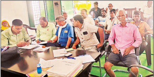
पुरासी ग्राम सभा में आयोजित चौपाल में मौजूद लोग।

तक शासन का कोई भी अधिकारी तथा कर्मचारी यहां देखने तक नहीं आया है। हालात दिनोंदिन बेकाबू होते जा रहे हैं।