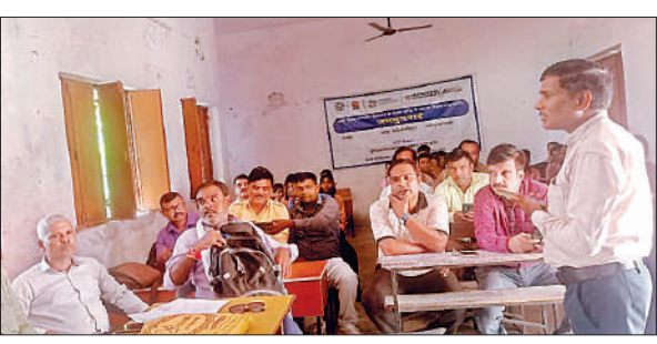
जनसुनवाई कार्यक्रम में जानकारी देते सोशल ऑडिटर।