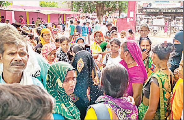
परिसर में जमा मरीज और तीमारदारों की भीड़।

दरअसल, इन दिनों जिला अस्पताल में बड़ी संख्या में मरीज कुत्ते के साथ-साथ बंदर और बुत्तों के काटने के भी आ रहे हैं। शुक्रवार सुबह लगभग 8:30 बजे का समय था, बंदर के काटने के बाद परिवार एक किशोर को लेकर पहुंचा। इमर्जेंसी कक्ष में पहुंचते ही उन्हें दुर्व्यवहार का सामना करना पड़ा। कक्ष में पिसावां से हादसे में घायल युवक का उपचार देर से होने