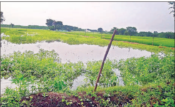
बाढ़ के पानी में डूबी फसल।

कठिनाइयों के दौर से भी गुजरना पड़ रहा है। ग्रामीण पशु अवस्थी,