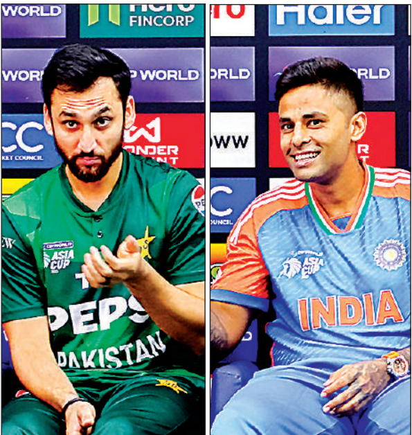
पाकिस्तान के कप्तान सलमान अली आगा व भारत के कप्तान सूर्य कुमार यादव।

अपने पहले मैच में हांगकांग पर आसान जीत से उत्साहित बांग्लादेश की टीम शुक्रवार को यहां एशिया कप के ग्रुप बी मुकाबले में छह बार के चैम्पियन श्रीलंका से भिड़ेगी, जो इस मुकदले का भाग्य तय करने में अहम भूमिका निभा सकता है। एशिया कप खिताब की तलाश में लगे बांग्लादेश के अभियान की शुरुआत अच्छी रही। कप्तान लिवन दास ने 59 रन की पारी की मदद से बांग्लादेश ने हांगकांग पर सात विकेट से जीत दर्ज की। बांग्लादेश ने इस मैच में भले ही आसानी से जीत हासिल की लेकिन कुछ ऐसे विभाग हैं जिनमें उसकी