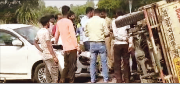
दुर्घटनास्थल पर लगी लोगों की भीड़।

अमृत विचार। थाना क्षेत्र के अंतर्गत चुरूवा पश्चिम गांव बाईपास पर झाम खेड़ा मोड़ के पास एक तेज रफ्तार अनियंत्रित कार ने एक छोटा हाथी डाला को जोरदार टक्कर मार दी। टक्कर इतनी तेज थी कि कार का अगला हिस्सा क्षतिग्रस्त हो गया, तो वहीं छोटा हाथी डाला सड़क पर पलट गया। हादसे में घायल हुए लोगों का निजी अस्पताल में इलाज कराया गया है। फिलहाल एक बड़ी अनहोनी होने से बच गई। जानकारी के अनुसार आपको बताते चलें की शुक्रवार दोपहर तकरीबन 2:00 के आसपास चुरूवा पश्चिम गांव बाईपास पर झामखेड़ा मोड़ के पास एक तेज रफ्तार कार सवार