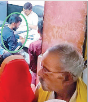
सीएचसी में बैठा प्राइवेट कर्मचारी।

अमृत विचार। कस्बा स्थित सामुदायिक स्वास्थ्य केंद्र में मरीजों के स्वास्थ्य से खिलवाड़ का मामला सामने आया है। यहां डॉक्टरों की अनुपस्थिति में प्राइवेट कर्मचारी मरीजों को दवाइयां लिख रहे हैं। ये कर्मचारी खुद को डॉक्टर बताकर मरीजों को गुमराह कर रहे हैं। प्राइवेट कर्मचारी डॉक्टर के चेंबर में बैठकर दो तह से दवाइयां लिख