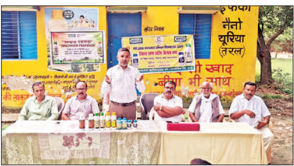
कृषक गोष्ठी को संबोधित करते अतिथि।