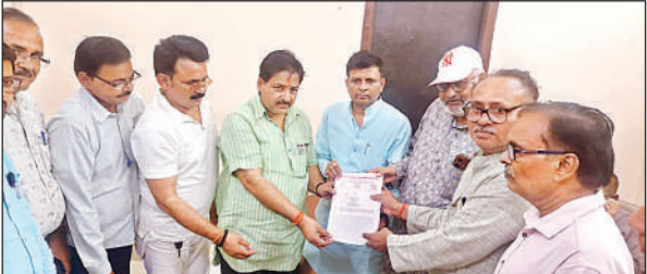
भाजपा जिलाध्यक्ष व विधायक को ज्ञापन देते संघ के पदाधिकारी।