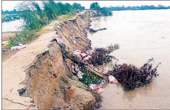
गंगा नदी पर बनी सड़क अब पगडंडी में तब्दील।