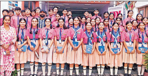
एफडीडीआई संस्थान का भ्रमण करने वाले रायन के बच्चे।

दिन में चौराहे पर हो रही पुलिस और पब्लिक के बीच मारपीट का किसी ने