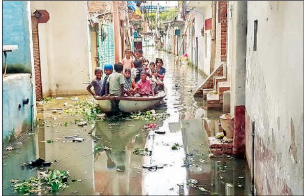
राजीव नगर खंती में भरा बाढ़ का पानी।