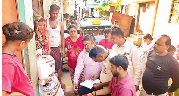
बाढ़ पीड़ितों को राशन किट देते प्रधान प्रतिनिधि।

पगडंडी बना कानपुर को जोड़ने वाला प्रमुख मार्ग फतेहपुर चौरासी । कानपुर को जोड़ने वाला क्षेत्र का काली मिट्टी मार्ग गंगा के बढ़ते जलस्तर से क्षतिग्रस्त होकर टूट चुका है। जलस्तर बढ़ने से किसानों की फसलें नष्ट हो चुकी हैं और ग्रामीण पलायन कर रहे हैं। बाढ़ प्रभावित क्षेत्र में लोगों का जीवन खतरे में है। इसके अलावा काली मिट्टी-शिवराजपुर मार्ग से आने-जाने वालों को करीब 40 किमी धूमकर सफर करना पड़ रहा है। मार्ग क्षतिग्रस्त होने से कानपुर जाने वाले शिक्षक, व्यापारी, किसान, मजदूर आदि को दिक्कत का सामना करना पड़ रहा है। ग्रामीणों ने बताया कि इसी मार्ग पर हिंदुपुर गांव के पास बनी पुलिया वर्ष 2018 में आई बाढ़ में बह गई थी। इसके बाद दोबारा वह पुलिया बनने में चार साल लग गए थे। अब गंगा पुल के पास से 250 मीटर सड़क क्षतिग्रस्त होकर पगडंडी में तब्दील हो गई है। अगर यह मार्ग जल्द से जल्द सही नहीं हुआ तो राहगीरों व व्यापारियों को परेशानी का सामना करना पड़ेगा।