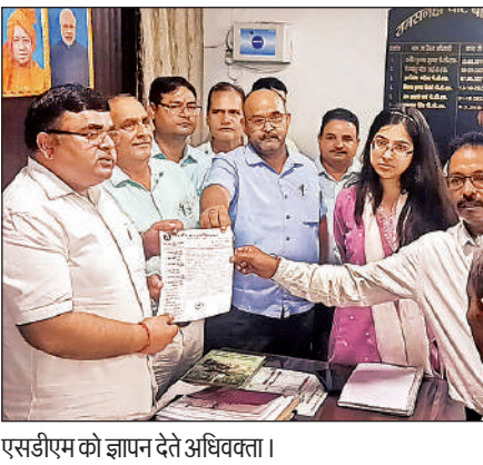
एसडीएम को ज्ञापन देते अधिवक्ता।