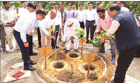
पौधरोपण करते प्रभारी मंत्री स्वतंत्र देव सिंह।