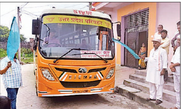
बस को हरी झण्डी देकर रवाना करते विधायक प्रतिनिधि।