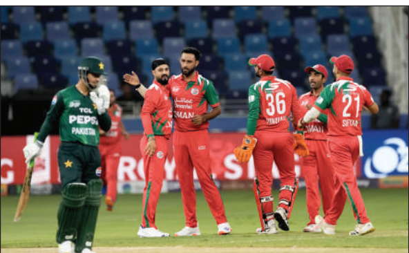
पाकिस्तान के सैम अयूब को आउट करने का जश्न मनाते हुए के खिलाड़ी।