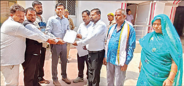
कलेक्ट्रेट में ज्ञापन देते जय किसान आंदोलन के पदाधिकारी।