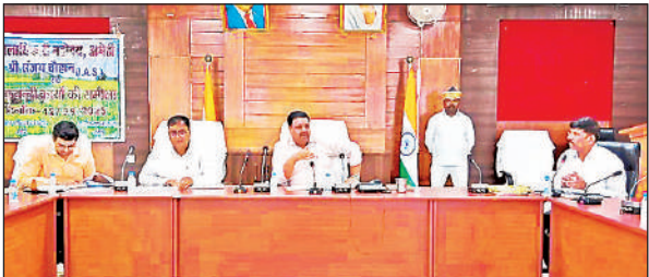
चकबंदी विभाग की बैठक करते जिलाधिकारी।