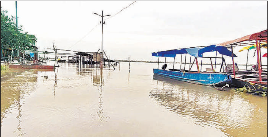
डलमऊ में गंगा स्नान घाट की डूबी सीढ़ियां।

मवेशियों को नहीं मिल रहा हरा चारा: सबसे बड़ी परेशानी किसानों को जानवरों के चारा की हो रही है। चारागाह में पानी भर जाने से गंगा कटरी क्षेत्र में हरा चारा नष्ट हो गया है। इससे आसपास बसे गांव धूता, पूरे लौनियन, नारायण भीट, मुलाहीबाद, गुलरिहा, मिश्रापुर, पूरे मुराइन, मंझलेपुर, पूरे ठकुराइन, सेदलीपुर आदि गांवों के किसानों के