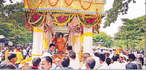
रथ यात्रा में शामिल श्रद्धालु।