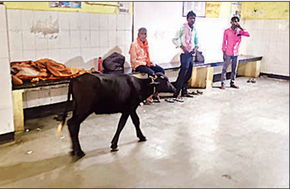
इमरजेंसी कक्ष के बाहर मौजूद छुट्टा मवेशी।