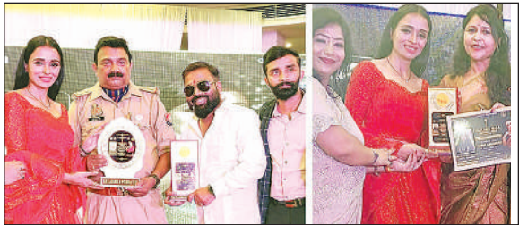
सम्मानित किये जाते शिक्षक व दरोगा।