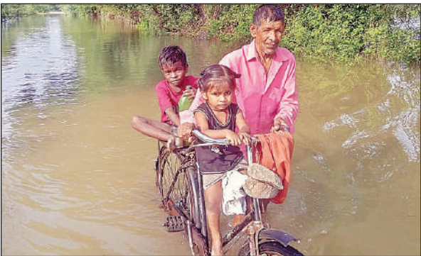
पानी के बीच साइकिल से बच्चों को ले जाता ग्रामीण।