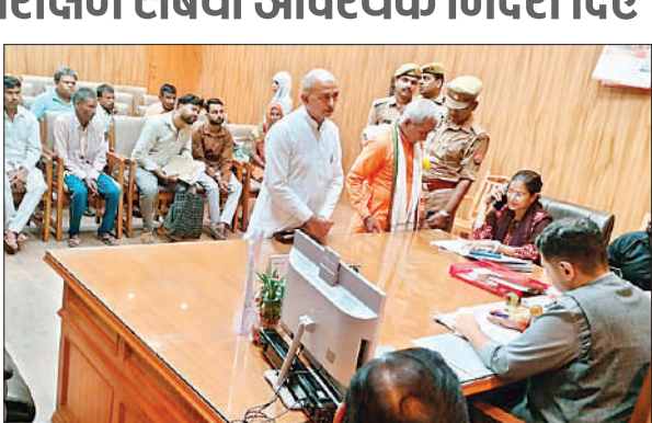
पीड़ितों की शिकायतें सुनते डीएम अनुनय झा।

हरदोई, अमृत विचार। कलेक्ट्रेट कक्ष में जन सुनवाई के दौरान जिलाधिकारी अनुनय झा ने आमजन की समस्याओं को सुना। जन सुनवाई में कुल 84 शिकायतें प्राप्त हुईं, जिनके त्वरित निस्तारण के निर्देश जिलाधिकारी ने सम्बंधित अधिकारियों को दिए। पात्रों का वृद्धावस्था पेंशन, निराश्रित महिला पेंशन व दिव्यांग पेंशन हेतु मौके पर ही पंजीकरण कराया गया। शुक्रवार को जन सुनवाई में दो व्यक्तियों का राशन कार्ड बनाया गया, 03 लोगों को दिव्यांग पेंशन योजना से जोड़ा गया तथा दो बच्चों को स्नाश्शरशिप योजना से जोड़ा गया। जिलाधिकारी