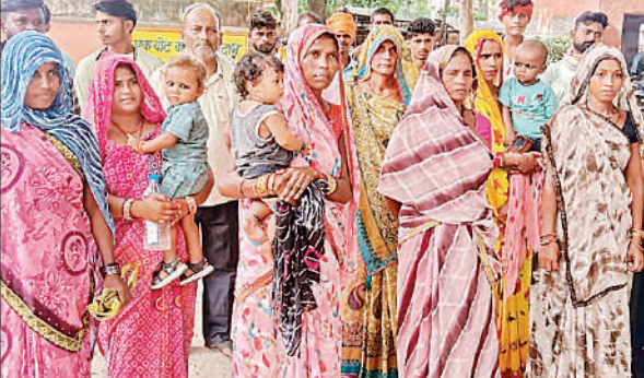
डलमऊ तहसील परिसर में ज्ञापन देने के लिए मौजूद ग्रामीण।