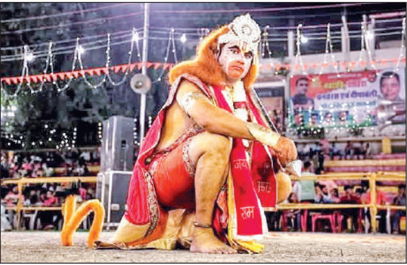
रामलीला मंचन के दौरान हनुमान के पात्र में मौजूद कलाकार ।