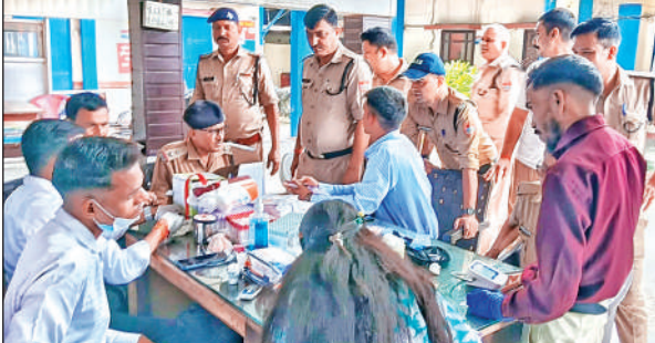
किच्छा कोतवाली में पुलिसकर्मियों की जांच करते स्वास्थ्य कर्मी।

शिविर में चिकित्सालय के तमाम विशेषज्ञ चिकित्सक एवं तकनीकी कर्मचारी मौजूद रहे। स्वास्थ्य कर्मियों की टीम द्वारा स्वास्थ्य जांच के साथ-साथ आवश्यक परामर्श भी दिया गया। पुलिसकर्मियों ने पहल को सराहनीय बताते हुए कहा कि ड्यूटी