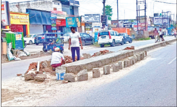
किच्छा में डिवाइडर की मरम्मत करते कर्मचारी।

अमृत विचार: नगर के दीनदयाल चौक पर परेशानी का सबब बने क्षतिग्रस्त डिवाइडर के मामले में विरोध प्रदर्शन के बाद लोनिवि ने नींद अब खुलती नजर आ रही है। मामले को लेकर अमृत विचार ने 11 सितंबर के अंक में क्षतिग्रस्त डिवाइडर के कारण एम्बुलेंस दुर्घटनाग्रस्त होने की खबर को प्रमुखता से प्रकाशित किया था। जिसके बाद जागे विभाग ने क्षतिग्रस्त डिवाइडरों को दुरुस्त करने का कार्य शुरू कर दिया।