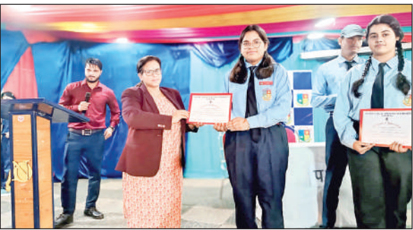
हिन्दी दिवस के मौके पर प्रतिभागियों को सम्मानित करती अतिथि ।