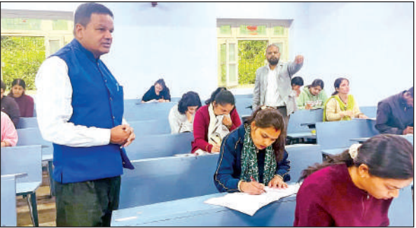
डीएसबी परिसर में बीएड प्रवेश परीक्षा देते अभ्यर्थी।