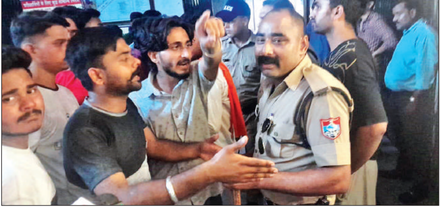
राजकीय स्नातकोत्तर महाविद्यालय में हंगामा कर रहे छात्र नेताओं को समझाती पुलिस।