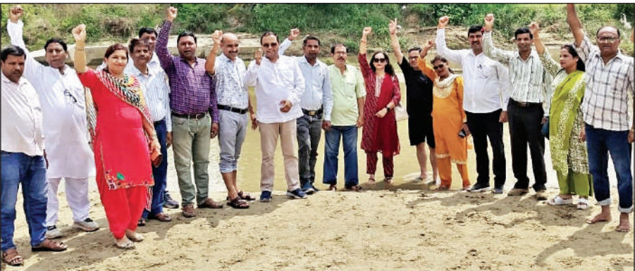
काशीपुर में प्रधानाचार्य सीधी भर्ती नियमावली के तर्पण कार्यक्रम के दौरान प्रदर्शन करते शिक्षक।