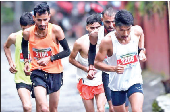
नैनीताल में आयोजित मैराथन में प्रतिभाग करते धावक।