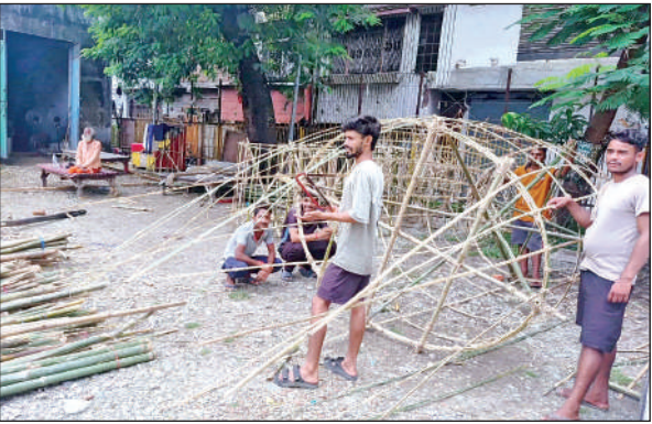
रामलीला मैदान में पुतलों का निर्माण करते कारीगर ।