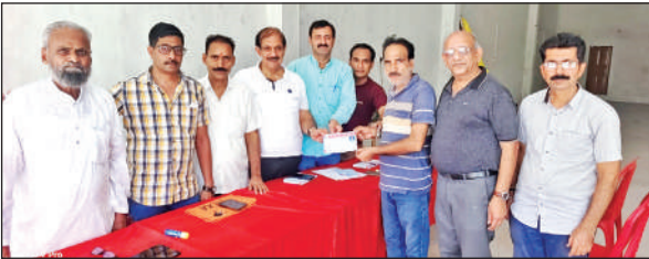
खटीमा में सदस्यता ग्रहण करते व्यापारी।