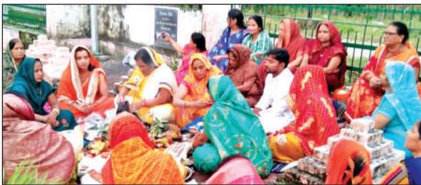
संजय रेलवे पार्क के सरोवर पर पूजा अर्चना करती पूर्वांचल समाज की महिलाएं।

पूर्वांचल समाज में छठ पूजा की भांति ही अश्विन मास के कृष्ण पक्ष की अष्टमी को ज्युतिया पर्व का व्रत रखा जाता है और नवमी के सुबह पाण के साथ व्रत समाप्त होता और व्रत रखने वाली महिलाएं अन्न जल ग्रहण करती हैं। यह पर्व मान्यता के साथ ही भावनात्मक भी है जिसमें महिलाएं अपने पुत्र के दीर्घायु होने की