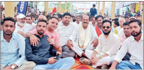
जसपुर में स्टेडियम के निर्माण की मांग को लेकर सामूहिक उपवास पर बैठे युवा।