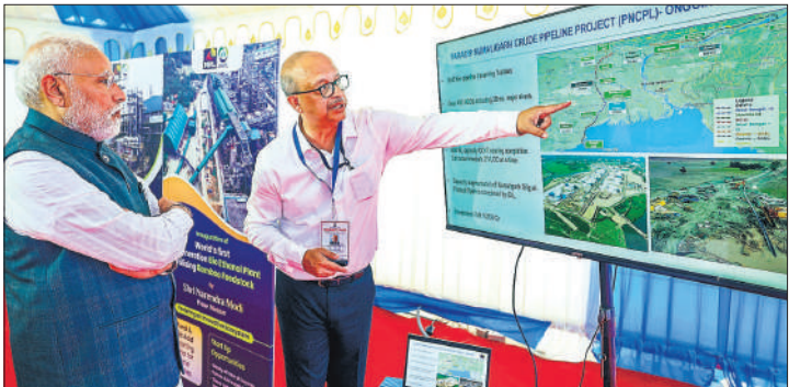
असम के नुमालीगढ़ में एथेनॉल प्लांट का उद्घाटन करने के बाद जानकारी लेते प्रधानमंत्री मोदी।

मोदी ने एक जनसभा को संबोधित करते हुए कहा कि कांग्रेस भारतीय सेना का समर्थन करने के बजाय पाकिस्तान द्वारा पाले गए आतंकवादियों का समर्थन करती है। कांग्रेस 'ऑपरेशन सिंदूर' के दौरान पाकिस्तान में आतंकवादी ढांचे को नष्ट करने वाले हमारे साथ कुछ स्थानों पर भारी वर्षा होने की संभावना है। वहीं, अलर्ट को देखते हुए पिथौरागढ़ जिला प्रशासन ने आदि केलशा यात्रा पर 17 सितंबर के बाद ही निर्णय लेने को कहा है। अधिकारियों के अनुसार, यात्रा मार्ग के संवेदनशील हिस्सों पर भूस्खलन और चट्टान गिरने का खतरा बढ़ने व यात्रियों की सुरक्षा को ध्यान में रखते हुए यह कदम उठाया गया है। यात्रा का दूसरा चरण सामान्यतः सितंबर के मध्य अथवा अंत में शुरू होता है। रविवार को राज्य के कई जिलों में झमाझम बारिश हुई। हालांकि दोपहर में हल्की धूप खिली लेकिन फिर से बारिश का मौसम बन गया। वहीं, बारिश और भूस्खलन से टिहरी गढ़वाल स्थित नेशनल हाइवे-707ए कैम्पटी-यमुनापुल के जीवन आश्रम के समीप मार्ग बह गया। राज्य में रविवार शाम तक नेशनल, स्टेट हाइवे, बॉर्डर और मोटर मार्ग समेत 122 मार्ग बाधित चल रहे थे, जिन्हें खोलने के प्रयास जारी थे।