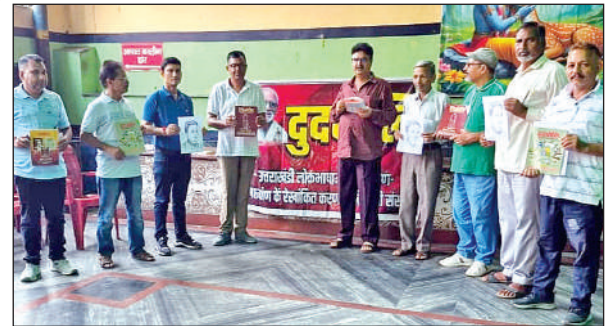
पर्वतीय सभा लखनपुर में कवि चंद्रकुंवर को श्रद्धांजलि देते लोग।