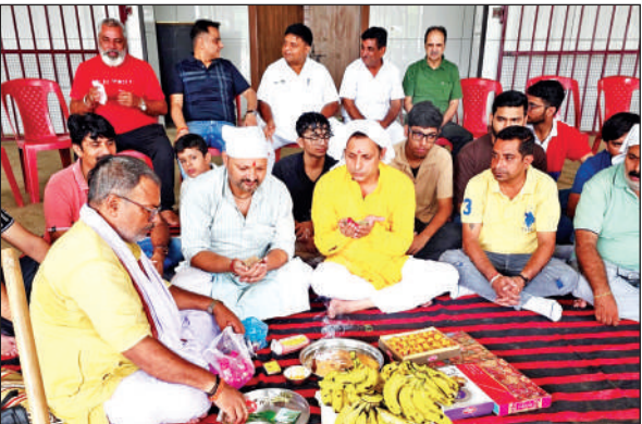
रुद्रपुर में भूमि पूजन में शामिल रामलीला कमेट्री के पदाधिकारी।

रविवार को भूमि पूजन के दौरान श्री रामलीला कमेट्री के अध्यक्ष