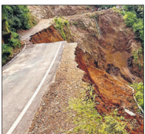
टिहरी में बारिश-भूस्खलन से बड़ा नेशनल हाइवे-707ए।