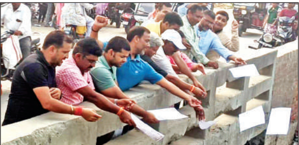
बाजपुर लेवड़ा नदी में नियमावली की प्रतियां प्रवाहित कर तर्पण करते शिक्षक।