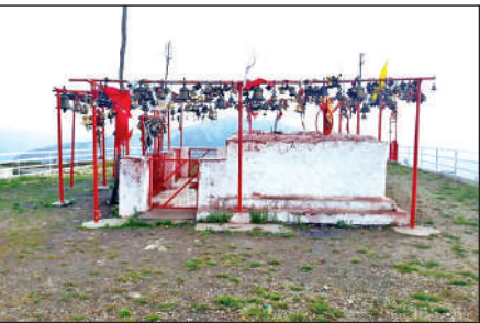
छोटा कैलाश मंदिर। ● अमृत विचार

ठीक नहीं हैं। जंगलिया गांव से पिनरौ तक जाने वाली सड़क भारी भूस्खलन की चपेट में है। वहीं, वर्तमान में नियमित रूप से पेयजल की समस्या भी बनी रहती है। बताया कि छोटा कैलाश में वर्तमान में प्रतिदिन दर्जनों की संख्या में श्रद्धालु पहुंचते हैं। पर