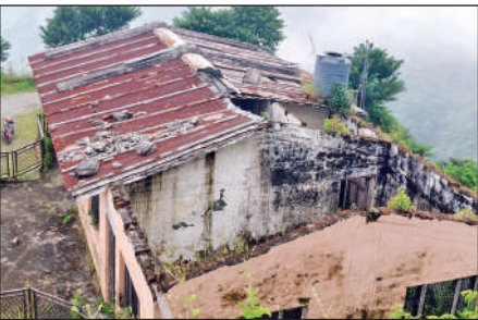
खंडहर भवन।

इस दौरान उपस्थित ग्रामीणों ने कहा कि वर्तमान में ग्राम सभा को जोड़ने वाली सड़कों की हालत