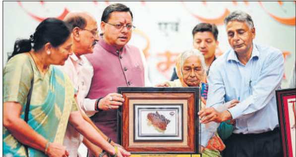
उत्तराखंड दीर्घकालीन साहित्य सेवा सम्मान प्रदान करते मुख्यमंत्री धामी।

नईदिल्ली। रक्षा मंत्री राजनाथ सिंह ने सेना के लिए खरीद प्रक्रिया को सुव्यवस्थित, सरल और युक्तिसंगत बनाने के लिए एक नए ढांचे को मंजूरी दी है। रविवार को जारी एक आधिकारिक बयान में कहा गया कि रक्षा खरीद नियमावली ( डीपीएम ) 2025 का उद्देश्य तीनों सेनाओं के बीच एकजुटता को बढ़ावा देना और राजस्व खरीद के लिए त्वरित निर्णय प्रक्रिया के माध्यम से सैन्य तैयारियों के उच्चतम स्तर को बनाए रखने में मदद करना है।