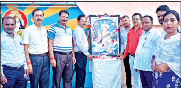
काशीपुर में हिन्दी दिवस पर आयोजित कार्यक्रम का उद्घाटन करते अतिथि।