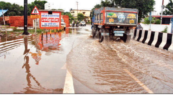
तेज बारिश के कारण रामपुर रोड स्थित पंचायत घर के पास सड़क पर हुआ जलभराव।

अमृत विचार : सरोवर नगरी में शनिवार रात्रि से रिमझिम बारिश रविवार सुबह तक जारी रही। दिन के समय मौसम सुहावना बना रहा। नगर में सुबह कुछ देर के लिए तेज बारिश हुई। इससे पूर्व शनिवार रात्रि मध्यम बारिश का दौर जारी रहा। दोपहर में पुनः बारिश शुरू हो गई, जो कुछ देर बरसने के बाद थम गई। देर शाम आसमान घने बादलों से ढका हुआ था। जिस कारण वर्षा की संभावना बनी हुई थी। इधर बारिश के चलते नैनी झील का जल स्तर 88 फीट पहुंच गया है। मौसम विभाग ने अगले तीन दिन वर्षा की संभावना जताई है। यलों अलर्ट जारी रखा गया है और 18 सितंबर तक मानसून सक्रिय रहने की संभावना जताई है।