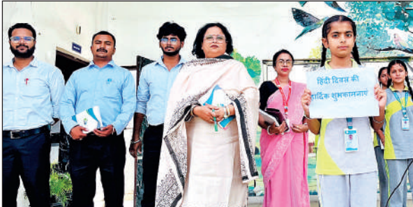
दिनेशपुर में हिन्दी दिवस पर कार्यक्रम प्रस्तुत करती छात्राएं व उपस्थित अतिथि।