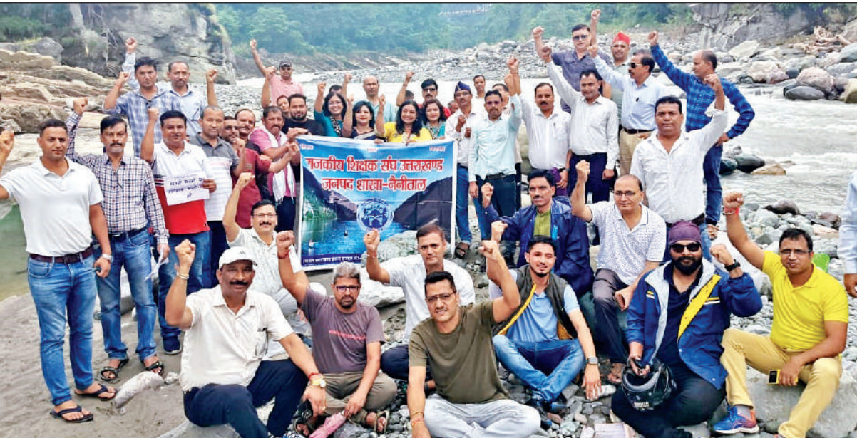
रानीबाग स्थित चित्रशिला घाट पर गार्गी नदी के किनारे तर्पण कार्यक्रम के दौरान प्रदर्शन करते हुए शिक्षक।