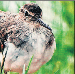
शरदकालीन कॉमन सेंड पाइपर।

रस आने लगी हैं। पक्षी प्रजातियों की बात करें तो टाइगर रिजर्व के आंकड़ों के मुताबिक यहां पक्षियों की 300 से अधिक प्रजातियां पाई जाती हैं। पक्षियों के इस अद्भुत संसार में अब दूर-दराज देशों के अलावा अन्य