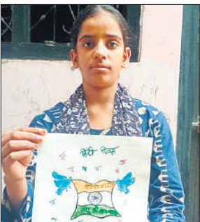
प्रतियोगिता में बनाया पोस्टर दिखाती छात्रा।

देवनागरी लिपि में लिखी गई, हिंदी भारत गणराज्य में कामकाज की अधिकारिक भाषा होगी। तत्कालीन प्रधानमंत्री पंडित जवाहरलाल नेहरू ने 1953 में 14 सितंबर को हिंदी दिवस मनाने की घोषणा की थी।