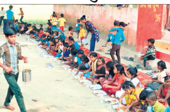
भंडारे का प्रसाद ग्रहण करते श्रद्धालु।