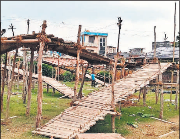
बजाज चीनी मिल की पुरानी कॉलोनी में बनाया जा रहा मां वैष्णो दरबार।

बजाज चीनी मिल की पुरानी कॉलोनी में 29वें मां वैष्णो देवी के कृत्रिम दरबार को श्रमिकों द्वारा सजाना शुरू कर दिया गया है। मां दुर्गा पूजा समिति के आयोजकों ने बताया कि 29वें मां वैष्णो देवी दरबार की शुरुआत पहले नवरात्र के दिन 22 सितंबर सोमवार को कलश, मूर्ति स्थापना से की जाएगी। 23 सितंबर को हवन पूजन सुंदरकांड पाठ, 24 को स्कूली बच्चों द्वारा पदयात्रा, 25 को हवन पूजन,