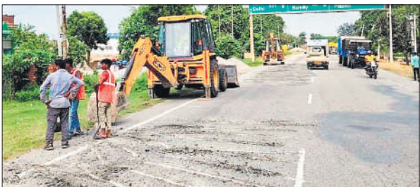
पीलीभीत-पूरनपुर हाईवे पर मरम्मत कार्य करते कर्मचारी।