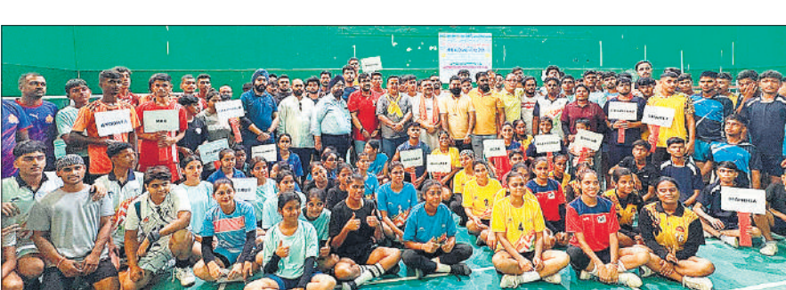
राज्य स्तरीय सेपक टाकरा की चैपियनशिप में भाग लेने वाले खिलाड़ी।