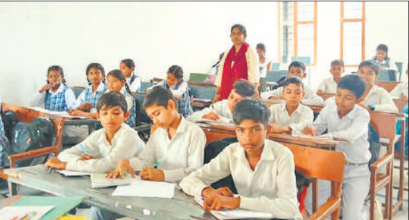
निबंध प्रतियोगिता में भाग लेते बच्चे।

गवाल बालों से अपने लकड़िया पर्वत के नीचे लगाने को कहा। बताया कि भाव यह है कि करता तो भगवान ही है लेकिन माध्यम दूसरों को बनाता है। उन्होंने पर्वत को स्वयं उठाया लेकिन गोकुल वासियों के सहयोग से लकड़िया लगाकर ऐसा दिखाया जैसे मेरे नहीं उनके सहयोग से यह पर्वत उनकी