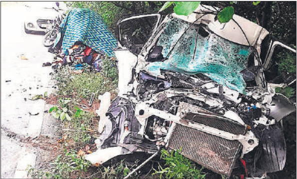
हादसे में क्षतिग्रस्त कार।