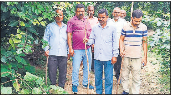
मौके पर पगमार्क ट्रेस करती वन विभाग की टीम।

ब्लॉक बरखेड़ा क्षेत्र के गांव रामनगर जगतपुर जंगल से सटा इलाका है। गांव के बाहर की तरफ गोशाला बनी हुई है। गोशाला में आश्रित पशुओं की सुरक्षा के लिए चारों तरफ तार फेंसिंग की गई है। बाहर की तरफ छुट्टा गोवंशीय पशु भी विचरण करते रहते हैं। बताते हैं शनिवार रात जंगल से निकले तेंदुआ ने गोशाला के नजदीक पहुंचकर