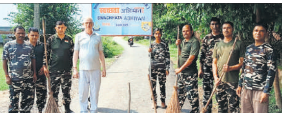
सूडा मंडी में सफाई अभियान चलाते एसएसबी जवान।