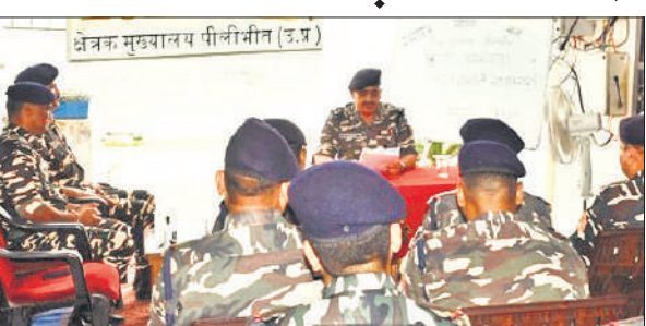
कार्यक्रम में मौजूद एसएसबी जवान।