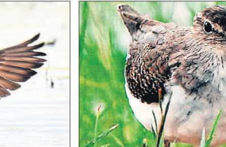
शरदकालीन कॉमन सेंड पाइपर।

कई अन्य दुर्लभ स्तनधारी वन्यजीव भी है, जो शेड्यूल वन की श्रेणी में आते हैं। बेहतर संरक्षण से यहां के जंगलों में विलुप्त हो रही प्रजातियां भी दिखने लगी हैं। इन सबके बीच कुछ साल से मेहमान परिंदों को भी पीलीभीत टाइगर रिजर्व की आबोहवा