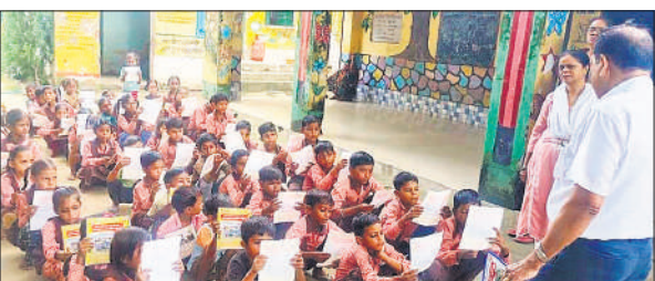
परिषदीय विद्यालयों में बच्चों को सुरक्षा संबंधी जानकारी देते कर्मचारी।