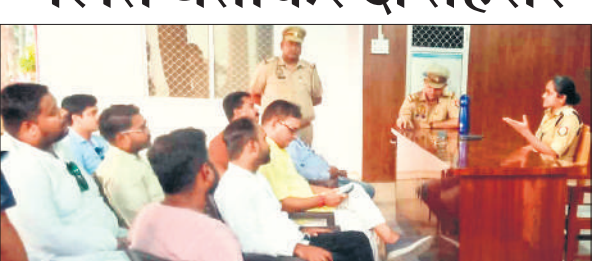
न्यूरिया थाने पहुंचे विश्व हिंदू रक्षा परिषद जिलाध्यक्ष व अन्य।