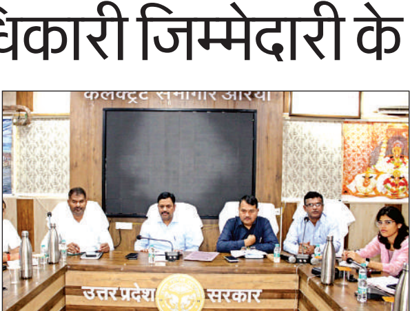
बैठक के दौरान निर्देश देते डीएम डॉ. इंद्रमणि त्रिपाठी।

अमृत विचार। सेवा पखवाड़ा अभियान 2025 का मुख्य उद्देश्य स्वच्छता के बारे में जागरूकता पैदा करना है। स्वच्छता के बारे में व्यवहार परिवर्तन लाना तथा स्थानीय स्तर पर क्षमता वृद्धि/निर्माण करना है। इसके अलावा ठोस और तरल कचरे के प्रबंधन में सुधार करना है, साथ ही सफाई कर्मचारियों के जीवन को बेहतर बनाने के लिए भी काम करना है। उक्त निर्देश जिलाधिकारी डॉ. इन्द्रमणि त्रिपाठी ने जनपद में 17 सितम्बर से 2 अक्टूबर तक चलाए जाने वाले सेवा पखवाड़ा अभियान 2025 के तहत दिए। मुख्य चिकित्साधिकारी को निर्देश दिये कि स्वस्थ नारी सशक्त परिवार अभियान के संदर्भ में 17