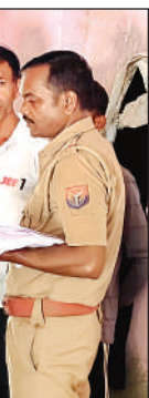
जानकारी होने पर घर के बाहर मौजूद लोग।