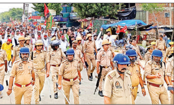
सपा कार्यालय से नारेवाजी करते हुए पुलिस की अगुवाई में कलक्ट्रेट जाते सपाईं।