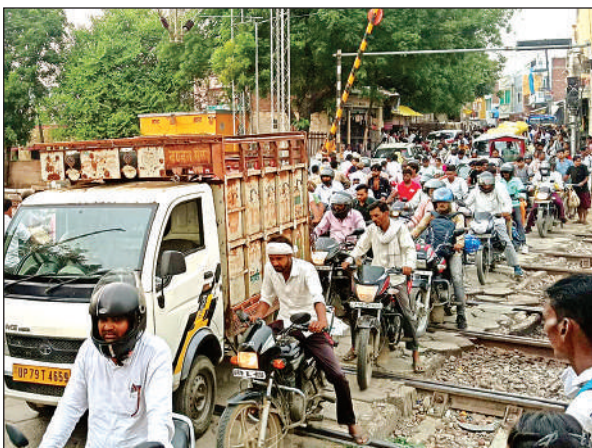
क्रॉसिंग खुलने के बाद रेंगते वाहन।

मंदिर के पुजारी का कहना है कि नल खराब हुए काफी समय हो गया है, लेकिन आज तक उसकी मरम्मत नहीं कराई गई। कई बार शिकायत करने के बावजूद किसी भी जिम्मेदार ने ध्यान नहीं दिया। मंदिर परिसर में पानी की व्यवस्था न होने से गर्मी के मौसम में सबसे ज्यादा दिक्कत आती है। लोग दूर-दराज से दर्शन करने आते हैं, लेकिन नल खराब होने से उन्हें इधर-उधर भटकना पड़ता है। ग्रामीणों ने प्रशासन और जल निगम विभाग से जल्द से जल्द नल की मरम्मत कराए जाने की मांग की है, ताकि श्रद्धालुओं को राहत मिल सके।