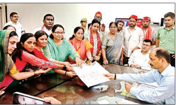
जिलाधिकारी को खून से लिखा ज्ञापन सौंपती महिला मोर्चा की पदाधिकारी व कार्यकर्ता।