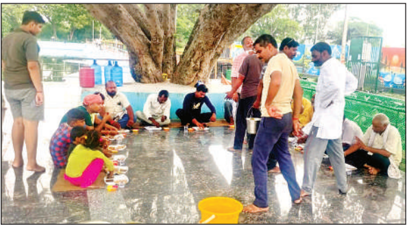
भंडारे का प्रसाद ग्रहण करते लोग।

इसमें सभी आत्माओं को मोक्ष प्राप्ति के लिए भगवान से प्रर्थना करने के साथ भोग लगाकर भंडारा शुरू किया गया। भंडारा दोपहर से शुरू होकर देर रात्रि तक चलता रहा। नगर के ककोर मार्ग पर श्मशानेश्वर महादेव मंदिर के पास में स्थित श्मशान घाट पर अज्ञात लोगों का हर वर्ष अंतिम संस्कार होता है, जिसमें से कुछ लोगों का पित्र पक्ष में श्राद्ध नहीं हो पाता है। इसी को लेकर पित्रपक्ष की नवमी के दिन सोमवार को श्मशानेश्वर महादेव मंदिर कमेटी के द्वारा