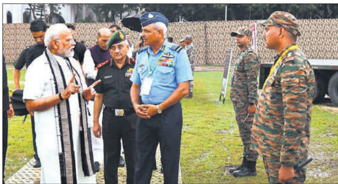
सम्मेलन के दौरान सैन्य कमांडरों से बातचीत करते प्रधानमंत्री नरेंद्र मोदी।

ऑपरेशन सिंदूर के बाद सशस्त्र बलों के शीर्ष सैन्य कमांडरों से पहली बार मुखातिब होते हुए प्रधानमंत्री नरेन्द्र मोदी ने बढ़ती वैश्विक अनिश्चितताओं और न्यू नॉर्मल के बीच किसी भी अप्रत्याशित स्थिति से निपटने के लिए तीनों सेनाओं में एकीकरण, आत्मनिर्भरता और नवाचार के क्षेत्र में तेजी से आगे बढ़ने को कहा है। मोदी ने सोमवार को यहां विजय दुर्ग (पूर्व में फोर्ट विलियम) स्थित सेना के पूर्वी कमान मुख्यालय में संयुक्त कमांडरों के 16 वें सम्मेलन का उद्घाटन किया। उन्होंने तीन दिन तक चलने वाले सम्मेलन के पहले दिन शीर्ष कमांडरों को संबोधित भी