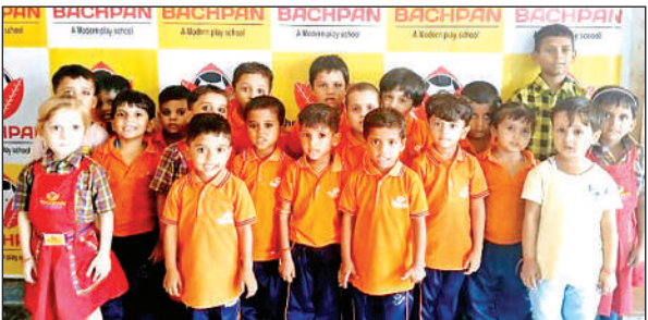
प्रतियोगिता में शामिल बच्चे।

यहां अस्पताल से चिकित्सकों ने प्राथमिक उपचार के बाद हालात गंभीर होने पर उन्हें को कानपुर के लिए रेफर कर दिया। बताया कि उन्हें निजी अस्पताल में लाया गया।