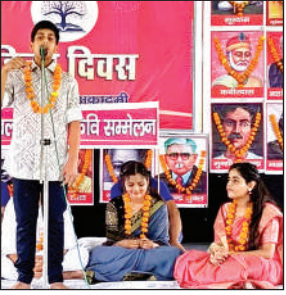
हिंदी दिवस पर कविता सुनाता छात्र।