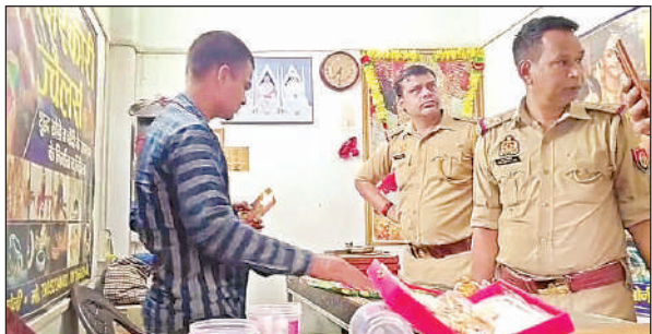
मौके पर जांच पड़ताल करती गंगाघाट पुलिस।