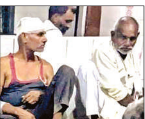
अस्पताल में बैठे घायल।