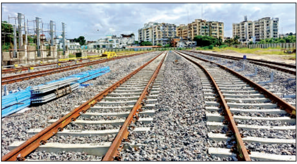
मेट्रो कॉरिडोर -2 डिपो में पटरियों को बिछा दिया गया है, यहीं नई ट्रेन खड़ी होगी।

अमृत विचार। मेट्रो के दूसरे कॉरिडोर की पहली ट्रेन इसी सप्ताह शहर आनी है लेकिन, खोदाई रोड़ा बनी हुई है। रावतपुर-कंपनीबाग रोड पर ट्रंच लाइन की खोदाई ट्रेन का रास्ता रोक सकती है। यूपीएमआरसी के अधिकारियों ने जलकल से जल्द खोदाई को बंद कर सड़क मोटरबुल करने को कहा है, ताकि ट्रेलर से कॉरिडोर-2 की पहली ट्रेन को शहर लाया जा सके। यूपीएमआरसी के सीएसए मेट्रो डिपो में पहली ट्रेन के स्वागत की तैयारियां शुरू हो गई हैं। अधिकारियों के अनुसार इसी सप्ताह ट्रेन को शहर लाया जाना है। लेकिन, कंपनीबाग से रावतपुर जाने वाली वीआईपी रोड पर खुदी हुई ट्रेंच को बंद किए बिना नहीं लाया जा सकता है। इसलिए मेट्रो ने जलकल को नियुक्त कार्यदायी संस्था द्वारा