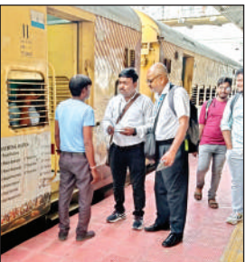
ट्रेनों में चेंकिंग की गई।