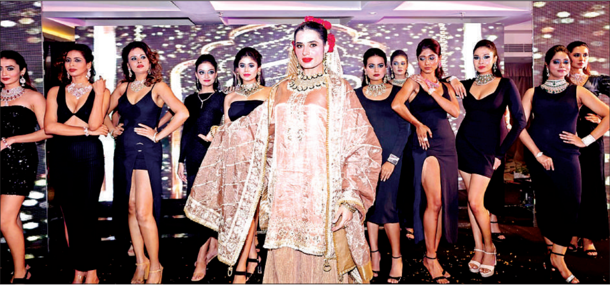
रैंप पर वॉक करती मॉडलों ने जलवा बिखेरा।