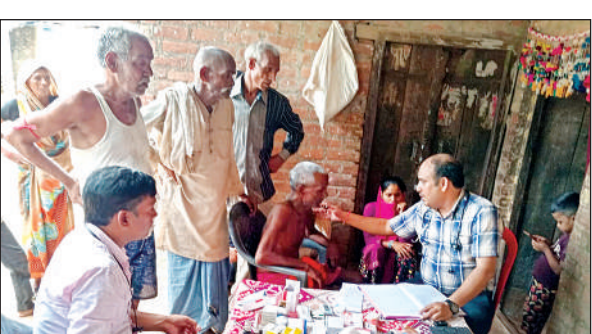
मेट्रोपैर में लोगों की जांच करती स्वास्थ्य टीम।