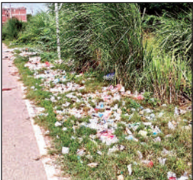
मैथा रनियां मुख्यमार्ग किनारे पड़ा कूड़ा।