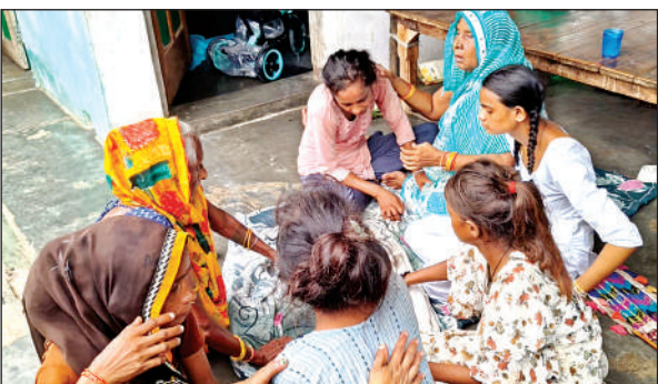
रोते- बिलखते बच्चे के परिजन।