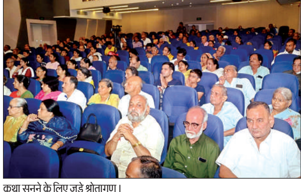
कथा सुनने के लिए जुड़े श्रोतागण।

उन्होंने कहा कि भक्ति के प्रादुर्भाव के लिए श्रोता व वक्ता में आदर्श गुण की स्थिति हो तब भगवान के गुण को स्वयं भगवान का स्वरूप है वह व्यक्ति के हृदय में कथा श्रवण के द्वारा प्रवेश करके भक्ति को जन्म देता है। आज भगवान की कथा प्रभु