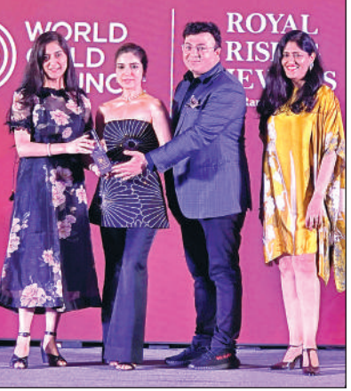
काशी ज्वेलर्स को मिला पुरस्कार।