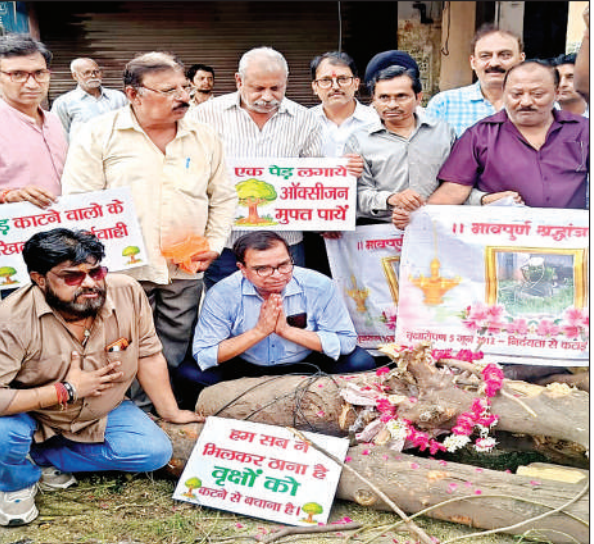
काटे गए पेड़ों पर लोगों ने फूल चढ़ाए।