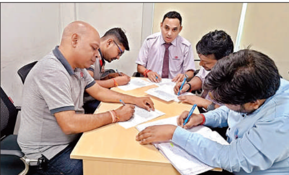
मेट्रो कार्यालय परिसर में प्रतियोगिता में भाग लेते कर्मचारी।

अमृत विचार। कानपुर मेट्रो के अधिकारियों एवं कर्मचारियों ने गुरुदेव चौराहा स्थित कानपुर मेट्रो डिपो कार्यालय में सोमवार को हिंदी दिवस पर कई प्रतियोगिताएं आयोजित कीं। 14 सितंबर से 28 सितंबर तक चलने वाले हिंदी पखवाड़ा में हिंदी सुलेख, प्रश्नोत्तरी एवं अनुवाद से जुड़ी प्रतियोगिताओं का आयोजन किया गया। मेट्रो के विभिन्न विभागों से जुड़े अधिकारी एवं कर्मचारी पहुंचे। हिंदी पखवाड़ा के दौरान इन प्रतियोगिताओं के अलावा निबंध एवं भाषण प्रतियोगिताओं का भी आयोजन किया जा रहा है। 26 सितंबर को इन प्रतियोगिताओं के विजेताओं को पुरस्कृत किया जाएगा।