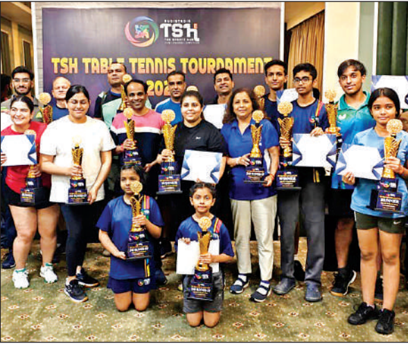
टूर्नामेंट में विजयी बच्चे ट्राफी के साथ।