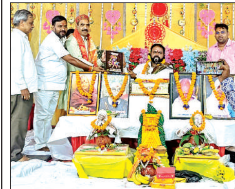
भागवत कथा वाचक का स्वागत करते लोग।