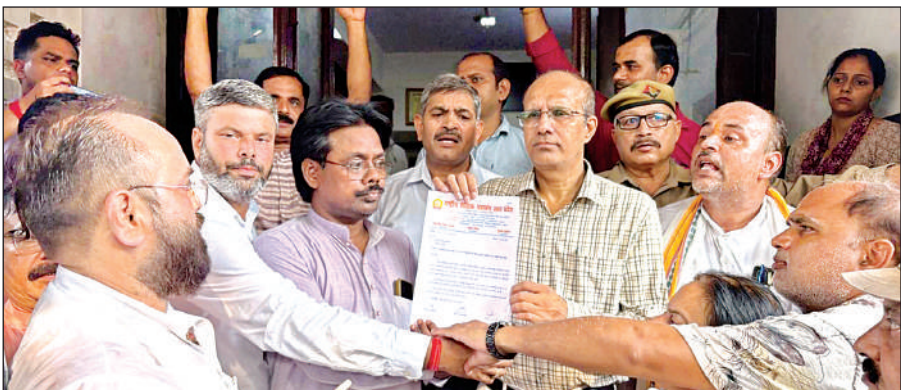
जिलाधिकारी कार्यालय में अधिकारियों को ज्ञापन देते शिक्षक।

शिक्षक पहले जीएनके कॉलेज पहुंचे। वहां पर एकत्रित होकर वे जिलाधिकारी कार्यालय तक पहुंचे। रास्ते में शिक्षकों ने अपनी मांगों से संबंधित नारे भी लगाए। जिलाधिकारी कार्यालय पहुंचने पर शिक्षकों ज्ञापन देते हुए अधिकारियों