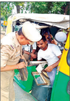
आँटो रिवशा की जांच करते हुए।