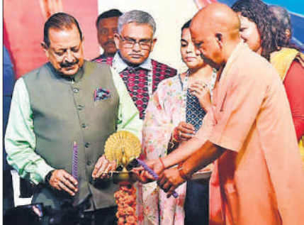
दीपप्रज्वलन करते मुख्यमंत्री योगी व केंद्रीय मंत्री जितेंद्र सिंह।

अमृत विचार : मुख्यमंत्री योगी आदित्यनाथ ने सोमवार को राजधानी लखनऊ में आयोजित सीएसआईआर स्टार्टअप कॉन्क्लेव-2025 के समापन समारोह में कहा कि प्रदेश अब भयमुक्त व्यापार का नया केंद्र बन चुका है। बीते साढ़े आठ वर्षों में प्रदेश ने सुरक्षा, सुगमता और मजबूत इकोसिस्टम का वह वातावरण तैयार किया है, जिसकी बदौलत यहां न केवल उद्योगों को विश्वास मिला है, बल्कि स्टार्टअप इकोसिस्टम भी नई ऊंचाई पर पहुंचा है।