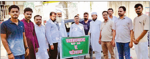
पंजाब पीड़ितों की मदद के लिए जाते मुस्लिम युवक ।