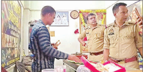
मौके पर जांच पड़ताल करती गंगाघाट पुलिस।