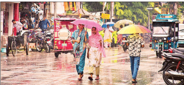
बरसात से बचने के लिए छाता बना सहारा ।

अमृत विचार : भीषण उमस से बेहाल आमजन को सोमवार सुबह हुई बारिश ने निहाल कर दिया। पारा करीब तीन डिग्री लुढ़क गया और पूरे दिन मौसम सुहाना बना रहा। वहीं यह बारिश उन किसानों के लिए भी काफी फायदेमंद साबित हुई जो धान की फसल में पिछड़ गए थे। सोमवार की सुबह उमस की मौजूदगी को कुछ ही पलों में आसमान पर छाए बादलों ने हटाने का काम किया। सुबह सात बजे