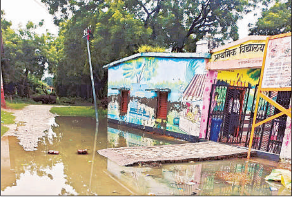
प्राथमिक विद्यालय के सामने जमा बरसात का पानी।

अमृत, विचार। सिंहपुर के फूला गांव में बाबा फूलेश्वर को जाने वाला रास्ते में बारिश के बाद गलियों में जलभराव हो जाता है। परेशान ग्रामीणों का आरोप है की कि जो नाली का निर्माण कराया गया है वो खड़जे से लगभग दो फिट ऊंचे बनायीं गयी है। जिससे कारण गांव का पानी नाली में नहीं जा रहा है और बारिश का पानी गलियों में जमा हो जाता है। हाल ही में बनाई गई नाली खड़जे से ऊपर बनायी गई, इसके चलते गलियों मे पानी भर जाता है। जलभराव होने से पानी नालियों में जाने की बजाय गलियों में ही जमा रहता है। ग्रामीणों का कहना है कि बारिश का पानी गांव