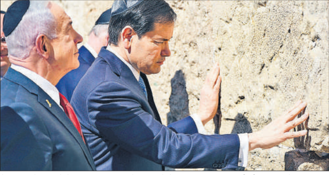
नेतन्याहू ने रुबियो के साथ यरुशलम में यहूदियों के पवित्र स्थान पश्चिमी दीवार का दौरा किया।

हमास के नेताओं पर यह हमला ऐसे समय में हुआ है, जब कतर इजराइल और हमास के बीच जारी युद्ध में संघर्ष विराम करवाने के लिए एक प्रमुख मध्यस्थ की भूमिका निभा रहा है। कतर ने इस बात पर जोर दिया कि वह इस हमले के बावजूद दोनों के बीच संघर्ष विराम करवाने के लिए प्रयास करता रहेगा। कतर के प्रधानमंत्री और विदेश मंत्री शेख मोहम्मद बिन अब्दुलरहमान अल थानी ने रविवार को एक बैठक में कहा, अब समय आ गया है कि अंतरराष्ट्रीय समुदाय दोहरे मापदंड अपनाना बंद करे और इजराइल को उसके सभी अपराधों के लिए दंडित करे। हालांकि यह स्पष्ट नहीं है कि शिखर सम्मेलन से क्या हासिल हो पाएगा, क्योंकि कुछ देशों के पहले से ही इजराइल के साथ कूटनीतिक संबंध हैं और वे अपने संबंध तोड़ने में संकोच कर सकते हैं।