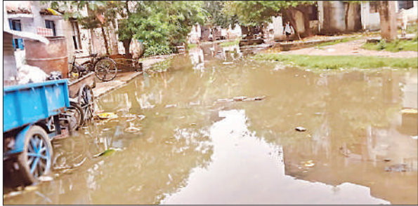
काशीराम कालोनी में सड़कों पर जलभराव व गंदगी।

बसपा प्रमुख मायावती ने साल 2008 में अपने इसी ड्रीम प्रोजेक्ट की बुनियाद रखी थी। कांशीराम कालोनी बनकर तैयार हुई, उस वक्त का दौर ऐसा था कि कालोनी से सुनाई देने वाली ‘खट’ की आवाज़ से लखनऊ तक के अफसरों की नींद टूट जाती थी, लेकिन आज वही कॉलोनी अपनी बदहाली पर रो रही है, उसकी कोई सुनने वाला नहीं है। गंदगी की बात करें तो वहां के लोग बीमारियों के पैर