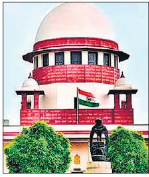
●केंद्रीय बोर्ड में 4 और राज्य में 3 से ज्यादा गैर-मुस्लिम सदस्य नहीं होंगे

उच्चतम न्यायालय ने सोमवार को वक्फ (संशोधन) अधिनियम, 2025 के कुछ महत्वपूर्ण प्रावधानों पर रोक लगा दी, जिनमें यह भी शामिल है कि केवल वे लोग ही किसी संपत्ति को वक्फ के रूप में दे सकते हैं जो पिछले पांच साल से इस्लाम का पालन कर रहे हैं। हालांकि, शीर्ष अदालत ने पूरे कानून पर स्थगन से इनकार कर दिया। प्रधान न्यायाधीश बीआर गवई और न्यायमूर्ति ऑगस्टीन जॉर्ज मसीह की पीठ ने इस विवादस्थ मुद्दे पर 128 पन्नों के अपने अंतरिम आदेश में कहा कि पूर्व धारणा हमेशा कानून की संवैधानिकता के पक्ष में होती है और हस्तक्षेप केवल दुर्लभ से दुर्लभतम मामलों में किया जा सकता है। पीठ ने कहा कि हमें ऐसा नहीं लगता कि पूरे कानून के प्रावधानों पर रोक का कोई मामला बनता है। इसलिए, अधिनियम पर रोक के अनुरोध को खारिज किया जाता है। हालांकि, पक्षों के हितों की रक्षा और बैलेंसिंग द इक्विटीज के लिए न्यायालय ने जिलाधिकारी को वक्फ