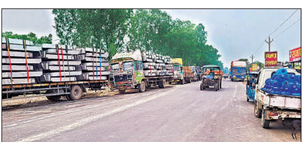
रेल कोच के सामने नेशनल हाईवे की सड़क पर खड़े रेल कोच के ट्रक। अमृत विचार

अमृत विचार। रेल कोच के महाप्रबंधक और उनके जनसंपर्क अधिकारियों ने बुधवार को रेल कोच के सामने सड़क दुर्घटना में एक जान चली जाने से कोई अब तक कोई सबक लिया है। तभी तो रेल कोच के सामने ट्रक फिर से सड़क पर खड़े होने लगे हैं। यदि जिम्मेदारों की ऐसी ही लापरवाही बनी रही तो यहां पर फिर किसी न किसी की एक्सीडेंट में मौत होने से इंकार नहीं किया जा सकता। ऐसे में व्यापार मंडल के अध्यक्ष व लोगों ने रेल मंत्री से सड़क पर ट्रक खड़े करने पर रोक लगाने की मांग की है।