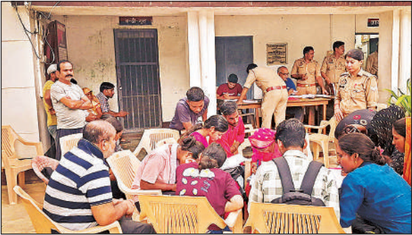
कोतवाली में एक साथ बैठकर तहरीर लिखती छात्राएं।

जानकारी के मुताबिक अमेठी इंस्टीट्यूट ऑफ पैरामेडिकल साइंस में पढ़ने वाली छात्राओं ने प्रबंधक और सहयोगियों पर भारी वित्तीय गड़बड़ी और धोखाधड़ी का आरोप लगाया है। छात्राओं का कहना है कि एडमिशन के नाम पर उनसे 80-80 हजार रुपये तक वसूले गए, लेकिन किसी मान्यता प्राप्त कॉलेज में रजिस्ट्रेशन नहीं कराया गया। छात्राओं ने पुलिस की तहरीर में