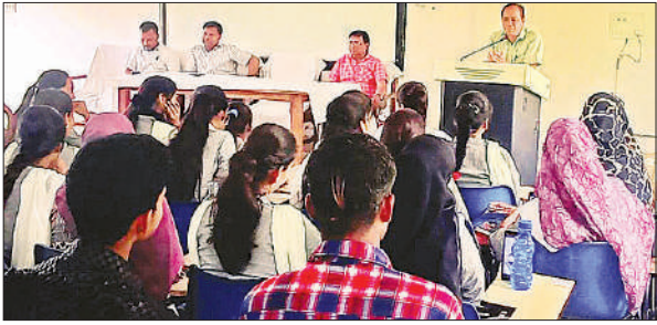
महाविद्यालय में आयोजित कार्यक्रम में बोलते अतिथि व मौजूद छात्र-छात्राएं।