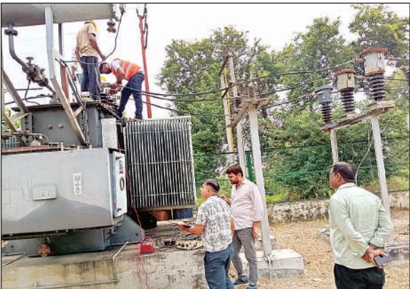
सब स्टेशन पर मरम्मत कार्य करते कर्मचारी।

सुबह से शुरू हुए रूटीन मेंटीनैस में दही चौकी स्थित पावर हाउस से आए अधिकारियों ने सबसे पहले ब्रेकरों की बारीकी से जांच की। इसके बाद दस एमवीए के ट्रांसफार्मरों का निरीक्षण किया गया। पावर हाउस में काम चलने के कारण नगर की अधिकांश बस्तियां समय पर विद्युत उपकेंद्रों पर लगे घंटों अंधेरे और गर्मी में तरसती