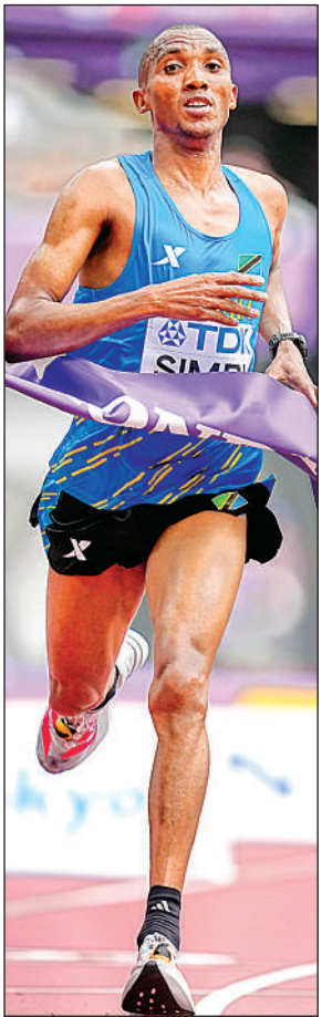
तंजानिया के अल्फोंसे फेलिक्स सिम्बू ने पुरुषों की मैराथन का स्वर्ण पदक जीता।

2023 में महिला एकल मैच के बाद यूक्रेन की एलिना स्विटोलिना ने बेलारूस की विक्टोरिया अजरेंका से हाथ नहीं मिलाया था। स्विटोलिना ने कहा था कि वह रूस या बेलारूस के किसी खिलाड़ी से हाथ नहीं मिलायेगी क्योंकि इन देशों ने उनके देश पर हमला किया है। विम्बलडन अधिकारियों ने स्विटोलिना और अजरेंका पर कोई दंड नहीं लगाया।