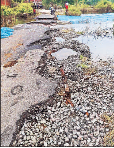
सफीपुर से कटरी क्षेत्र आवागमन के लिए मुख्य मार्ग बाढ़ प्रभावित होकर हुआ बुरी तरह क्षतिग्रस्त।

ग्रामीणों का कहना है कि जलभराव और कटान से जगह-जगह सड़कों पर गहरे गड्ढे बन गए हैं। इब्राहिमाबाद से लोनारी जाने वाला मुख्य मार्ग पूरी तरह से खराब हो गया है। राहगीरों का निकलना दूबर हो गया है और कई बार लोग गड्ढों में फिसलकर चोटिल भी हो चुके हैं। महिलाओं और बच्चों को सबसे ज्यादा दिक्कत उठानी पड़ रही