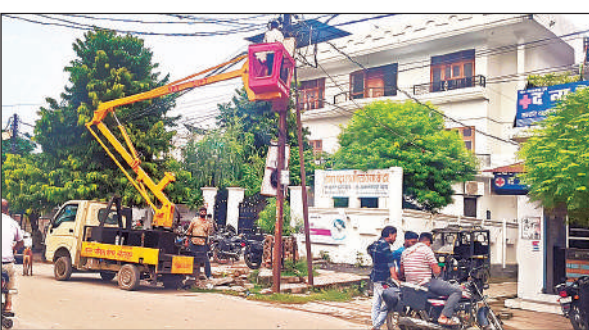
सिविल लाइन इलाके में तारों की मरम्मत करता विद्युतकर्म।

रविवार देर रात से शुरू हुई बारिश दिन भर रुक-रुक कर हुई। ऐसे में शहर से लेकर ग्रामीण क्षेत्रों में बिजली गुल रही। जिला अस्पताल में जनरेटर का इस्तेमाल हुआ। दोपहर बाद जनरेट बंद होने पर कुछ वाडों में समस्या देखने को मिली। कलेक्टर परिसर स्थित विकास भवन में कई कार्यालयों