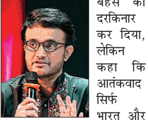
बहस को दरकिनार कर दिया, लेकिन कहा कि आतंकवाद सिर्फ भारत और

कोलकाता : भारतीय क्रिकेट बोर्ड (बीसीसीआई) के पूर्व अध्यक्ष और महान बल्लेबाज सौरव गांगुली ने दुबई में एशिया कप मैच के बाद भारतीय खिलाड़ियों द्वारा पाकिस्तानी क्रिकेटर्स से हाथ मिलाने से इन्कार करने पर चल रही