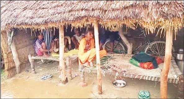
कटान से विस्थापित हुए घरों में घुसा बारिश का पानी।

रामपुर मथुरा विकास खण्ड क्षेत्र के शुकुल पुरवा के मजरा सुंदरपुरवा, भूषण पुरवा, महाजन पुरवा, लोधन पुरवा, रामरूप पुरवा, महाजन पुरवा, नया पुरवा, बुचऊ पुरवा, घाघरा नदी में समाहित हो चुके हैं। यहां के अधिकतर निवासी बांध व घाघरा नदी के बीच बचें खेतों में शरण लिये हैं। दो दिनों से घाघरा ने कटान तेज कर दी। रात से हो रही लगातार बारिश के