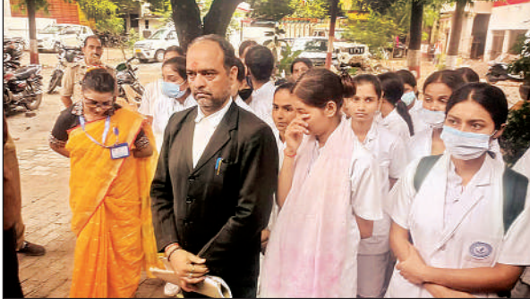
कोतवाली में प्राथमिकी दर्ज कराने पहुंचे नर्सिंग कॉलेज के शिक्षक एवं छात्राएं।