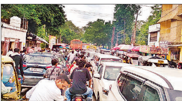
बड़ा डाकघर-आंख अस्पताल मार्ग पर लगा जाम।

दुकानों पर अपेक्षाकृत कम लोग ही दिखे। भवानीपुर, रामकोट सहित अन्य उपकेंद्रों में विद्युत बाधा रही। सायंकाल तक फाल्ट को दुरुस्त किया जाता रहा। उधर, ग्रामीण क्षेत्रों