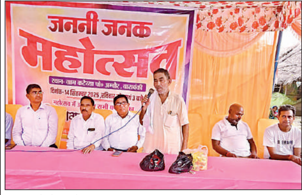
कार्यक्रम में मौजूद लोग ।

हैदरगढ़, बाराबंकीख अमृत विचार : नगर क्षेत्र में नई बिजली लाइन डालने का कार्य तो तेजी से चल रहा है, लेकिन सुरक्षा मानकों की खुलेआम अनदेखी की जा रही है। बिना लिफ्टर और सेफ्टी किट के कर्मचारियों को खंभों पर चढ़कर काम करते देखा जा रहा है। सोमवार को बछरांवा रोड पर इसी तरह काम करते कर्मचारियों का वीडियो सोशल मीडिया पर वायरल हो गया, जिससे विभागीय लापरवाही पर सवाल उठने लगे हैं। भौड़भाड़ वाले क्षेत्रों में बिना सुरक्षा उपकरणों के काम न सिर्फ कर्मियों की जान के लिए खतरा है, बल्कि यातायात व्यवस्था भी बाधित हो रही है।