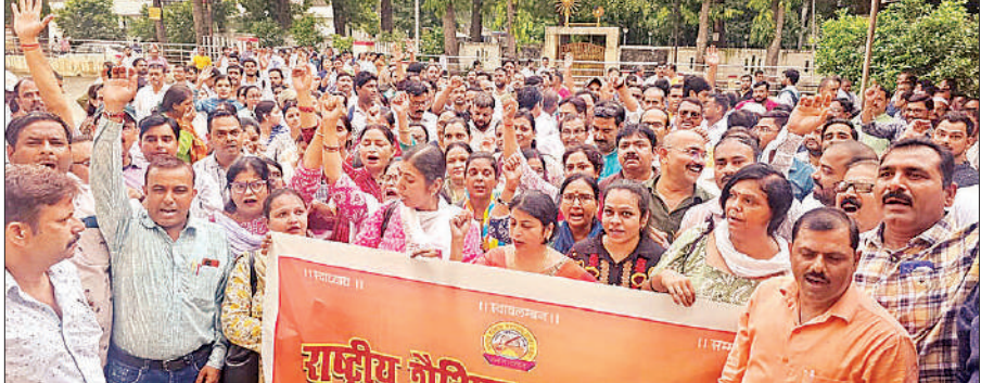
टीईटी की अनिवार्यता के विरोध में प्रदर्शन करते शिक्षक ।