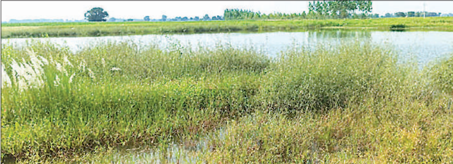
तारा तालाब जिसकी खुदाई पर लगभग डेढ़ लाख खर्च किया गया ।

अमृत विचार । गरीबों को रोजगार देने के लिए सरकार की महत्वाकांक्षी मनरेगा योजना भ्रष्टाचार की भेंट चढ़कर रह गई है । विकास खंड शाहाबाद की ग्राम पंचायत रामपुर हमजा में प्रधान, सेक्रेटरी और ब्लॉक के अधिकारी योजना के धन की बंदरबांट कर रहे हैं । ग्रामीणों का आरोप है कि ग्राम प्रधान और पंचायत सचिव योजनाओं में मनमानी कर रहे हैं । ग्रामीणों के अनुसार वेक आईडी बनाकर रामपुर रोड से तारा तालाब तक मिट्टी कार्य दिखाकर भुगतान कर लिया गया, जबकि मौके पर कोई काम नहीं हुआ । इसी तरह, तारा तालाब की 2024-25 में कांथित खुदाई दिखाकर 1,44,570 रुपये खर्च दर्शाए गए हैं, जबकि हकीकत में तालाब जस का तस है । तालाब में