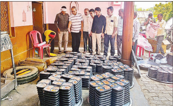
बाढ़ पीड़ितों के लिये लंच पैकेट तैयार करवाते पूर्व विधायक।

अमृत विचार। गंगा का जलस्तर खतरों के निशान पार करने के बाद लगातार घट रहा है। केन्द्रीय जल आयोग के अनुसार रविवार शाम 6 बजे गंगा का जलस्तर 112.370 मीटर था, जो सोमवार शाम 6 बजे 112.210 मीटर पर आ गया। इस तरह केवल चौबीस घंटे में 16 सेंटीमीटर की गिरावट दर्ज की गई। जलस्तर घटने के बावजूद जिन इलाकों में बाढ़ का पानी पहुंचा था, वहां चारों ओर गंदगी और कीचड़ का अंबार है। ग्रामीणों का कहना है कि निचले इलाके और खाली प्लाट में पानी अब भी रुका हुआ है, जिससे संक्रामक बीमारियों का खतरा बढ़ गया है। स्थानीय प्रशासन ने लोगों से सतर्क रहने और गंदगी के संपर्क में आने से बचने की अपील की है। वहीं बाढ़ प्रभावित क्षेत्रों से धीरे-धीरे पानी निकलने लगा है, जिससे कुछ राहत मिल रही है, लेकिन सफाई और स्वास्थ्य की स्थिति चिंताजनक बनी हुई है। बाढ़ प्रभावित क्षेत्रों में जरूरत है कि संक्रामक रोग न फैले और मच्छर जनित बीमारियां का फैलाव भी रुके।