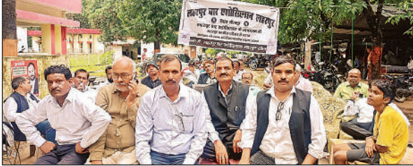
तहसील परिसर में हड़ताल करते अधिवक्ता।