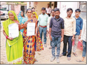
शिकायती पत्र देने जाते ग्रामीण।

जानकारी नहीं दी गई, जो कि नियत: गलत है। शिकायती पत्र में ग्रामीणों ने बताया कि क्षेत्रीय लेखपाल द्वारा गांव के आबादी और बंजर भूमि पर लगभग 20 साल से अधिक पुराने बने आवासीय मकान के परिजनों के साथ अभद्रता करते हुए मकान गिरवा देने की धमकी दी जा रही है। ग्रामीणों का आरोप है कि ग्राम प्रधान के संरक्षण में ग्राम सभा की सुरक्षित भूमि खेल के मैदान और बंजर भूमि पर उनके चहेतों द्वारा अवैध कब्जा किया जा रहा है। उनका कहना है कि जब इसकी शिकायत क्षेत्रीय लेखपाल से की तो उन्होंने इस पर कार्रवाई करने के बजाय मुंह फेर लिया। डलमऊ तहसील