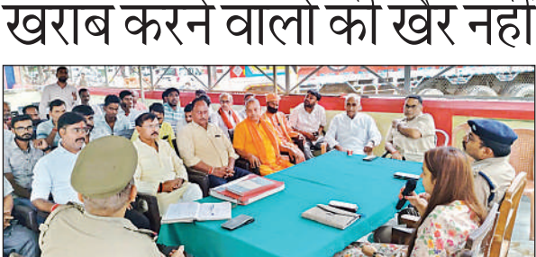
पीस कमेटी की बैठक के दौरान एसडीएम व अन्य।