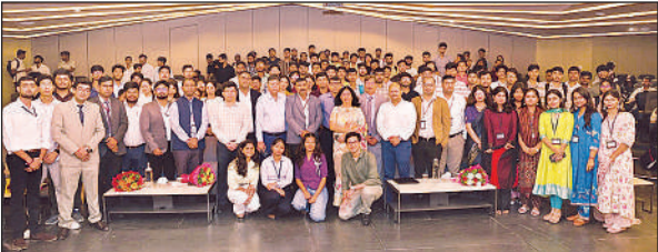
चंडीगढ़ यूनिवर्सिटी, यूपी में इंजीनियर्स डे के अवसर पर मौजूद छात्र-छात्राएं।