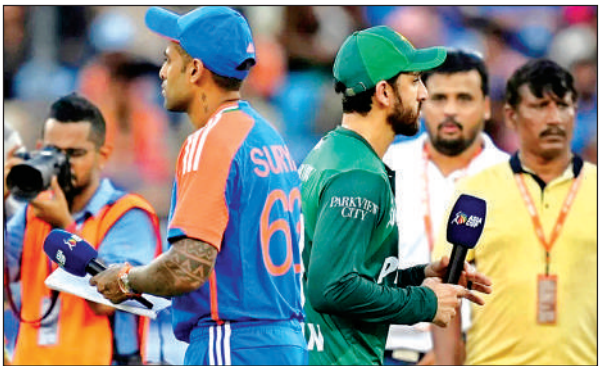
भारत-पाकिस्तान मैच से पहले टॉस के दौरान कुछ तरह विपरीत दिशा में नजर आए थे दोनों कप्तान सूर्यकुमार यादव व सलमान अगा।