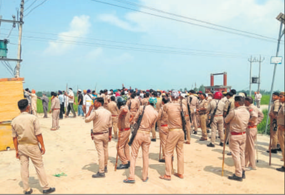
गुरुद्वारे के पास मौजूद पुलिस बल।