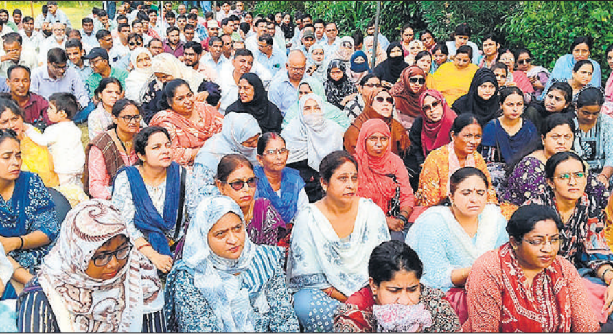
आंबेडकर पार्क में धरने के दौरान मौजूद शिक्षिकाएं।