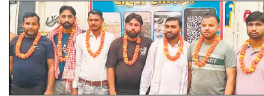
हसनपुर, अमृत विचार : तहसील क्षेत्र के एक गांव के ग्रामीणों ने पंजाब के बाढ़ पीड़ितों के लिए राहत सामग्री एवं आर्थिक सहायता भेजी गई है । हसनपुर तहसील क्षेत्र के गांव पोरारा के ग्रामीणों ने सोमवार को पंजाब के बाढ़ पीड़ितों की सहायता करने हेतु राहत सामग्री से भरा एक वाहन रवाना किया । इसी के साथ