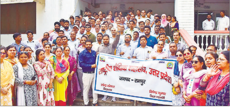
कलेक्ट्रेट में प्रदर्शन करते शिक्षक।