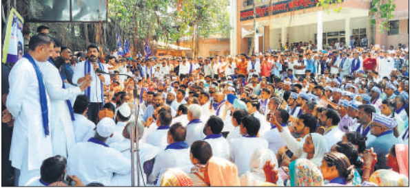
कलेक्ट्रेट में कार्यकर्ताओं के साथ धरना देते सांसद चन्द्रशेखर ।