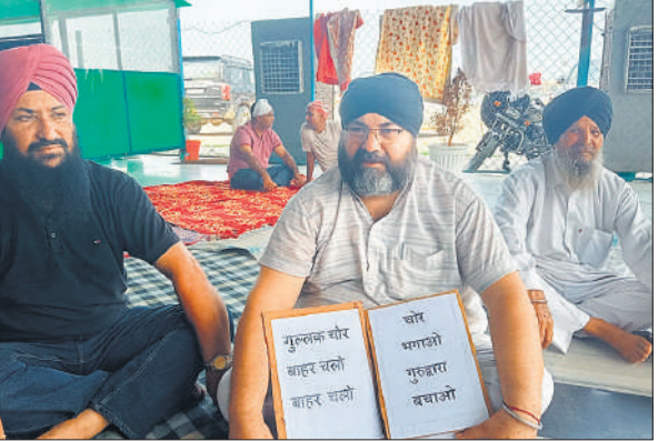
धरने पर बैठा सिख।

को गैस में आग लगाकर जलाने का प्रयास किया। इस संबंध में सिविल लाइंस थाने में रिपोर्ट दर्ज करा दी गई। छह दिन बीतने के बाद भी दोषियों पर कार्रवाई नहीं की गई। पीड़ित ने इन लोगों से जान का खतरा बताया है। आरोपियों को शीघ्र गिरफ्तार किया जाए।