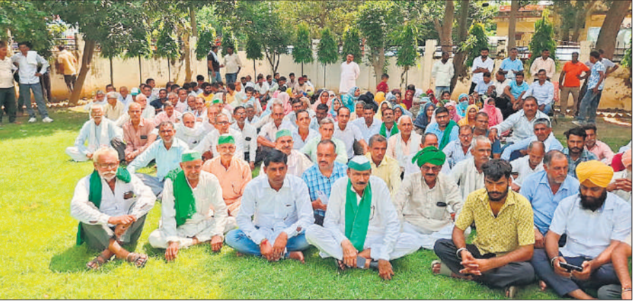
आरोपियों की गिरफ्तारी को लेकर धरना देते परिजन व अन्य लोग ।