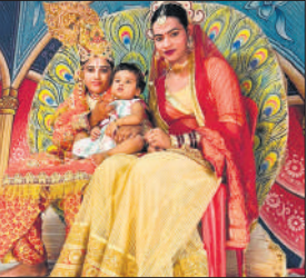
कृष्णलीला में मंचन करते कलाकार।