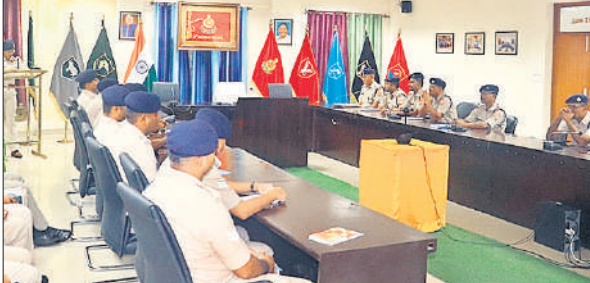
39वीं वाहिनी एसएसबी में हिंदी दिवस पर आयोजित कार्यक्रम में मौजूद अधिकारी।