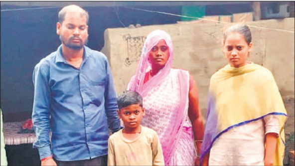
मृतक के माता-पिता, भाई व बहन ।