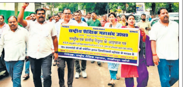
प्रदर्शन कर जुलूस की शकल में डीएम कार्यालय जाते शिक्षक ।

महासंघ ने ज्ञापन में कहा कि 1 सितंबर 2025 को उच्चतम न्यायालय ने शिक्षकों की नियुक्ति से पहले शिक्षक पात्रता परीक्षा (टीईटी) को अनिवार्य करने का आदेश दिया है। इससे 2010 के बाद नियुक्त लाखों शिक्षकों की नौकरा पर संकट खड़ा हो गया है। संगठन ने इसे सेवा-सुरक्षा के लिए बेहद गंभीर परिस्थिति बताते हुए तत्काल