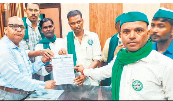
बीडीओ को जापन सौंपते भाकियू अराजनैतिक कार्यकर्ता।