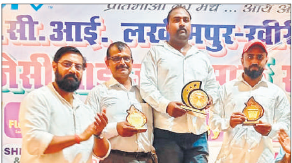
पॉवर लिफ्टिंग चैंपियनशिप में विजेता प्रतिभागी।

महिलाओं की ओवरआल टीम चैंपियनशिप में फतेहपुर की टीम विजेता, सीतापुर की टीम उपविजेता व कानपुर की टीम तीसरे स्थान पर रही। बेंच प्रेस टीम चैंपियनशिप में सीतापुर विजेता, फतेहपुर व कानपुर क्रमशः द्वितीय व तृतीय स्थान पर रहे। ओवरआल टीम डेडलिफ्ट चैंपियनशिप में फतेहपुर की टीम