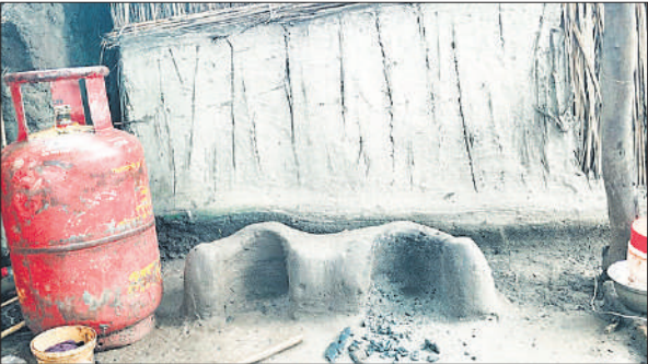
कई दिनों से नहीं जला चूल्हा ।