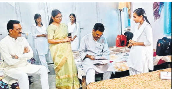
सर्वोदय विद्यालय में बालिका से जानकारी करते समाज कल्याण मंत्री व मोहम्मदी विधायक ।