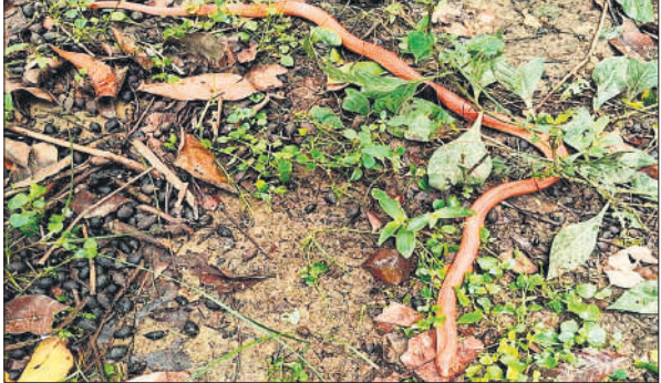
दुर्लभ रेड कोरल कुकरी सांप।