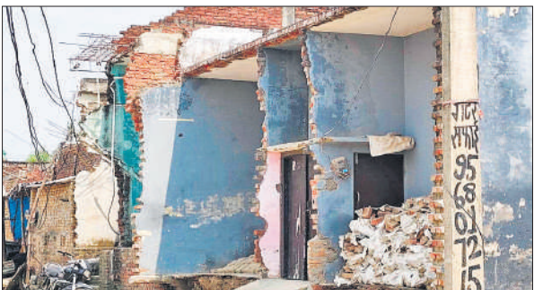
चौड़ीकरण कार्य के दौरान अवैध पाए जाने पर तोड़े गए मकान दुकान के आगे के हिस्से।

कर दी गई। बकायदा नगर पंचायत का काम शुरू हो गया। बजट की भी कोई कमी अभी तक आई नहीं आ सकी है। नगर पंचायत स्तर पर बरात घर, गोशाला समेत कई सुविधाएं दी जा चुकी है। मगर, गलियों का हाल अभी भी लंबे समय बाद बदतर है। वार्ड की कई सक्री गलियां उखड़ी हैं। जिसमें कूड़े के ढेर भी लगे रहते हैं। खाली प्लाटों में गंदगी जमा है। वहीं बात अगर सड़कों की करें तो बरेली हाईवे से नगर पंचायत कार्यालय को जाने वाली 500 मीटर की सड़क काफी समय से नौगवां वासियों को दर्द दे रही है। इस सड़क का चौड़ीकरण