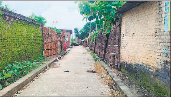
गांव की गलियों में पसरा सन्नाटा ।