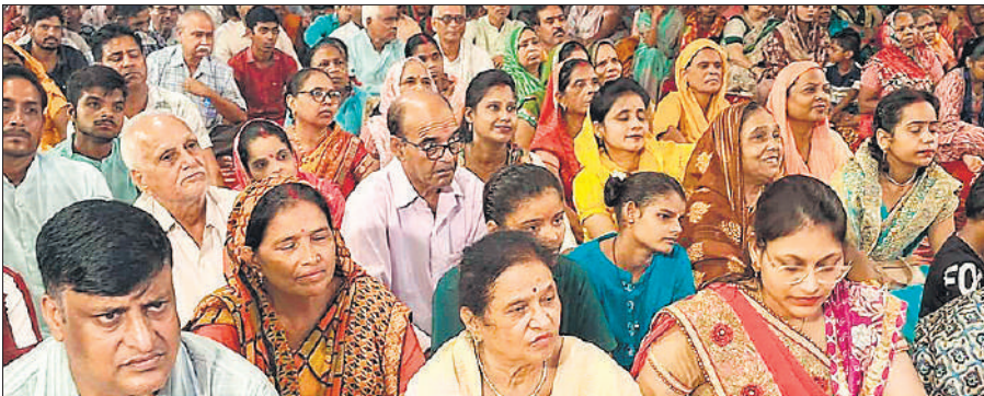
अग्रवाल सभा में श्रीमद भागवत कथा सुनने पहुंचे श्रद्धालु।