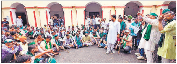
कलेक्ट्रेट में डीएम कार्यालय के बाहर धरना देते कार्यकर्ता।