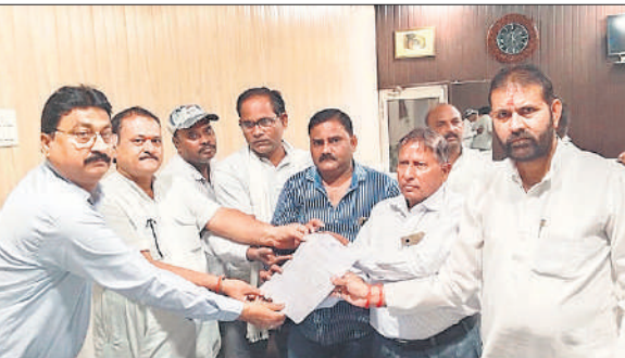
डीएम कार्यालय पर ज्ञापन देते विहिप कार्यकर्ता व सभासद ।