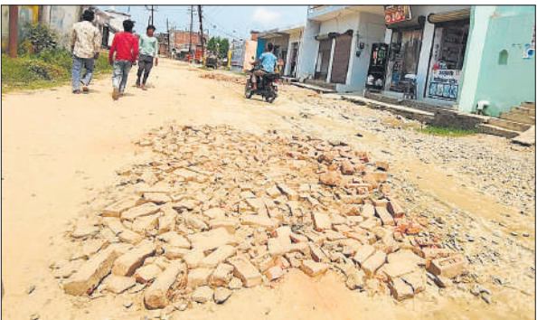
नगर पंचायत नौगवां पकड़िया जाने वाले मार्ग पर कई जगह इस तरह बिछी हैं ईंटें ।

शहर से सटी ग्राम पंचायत नौगवां पकड़िया को करीब छह साल पहले नगर पंचायत का दर्जा मिला। यहां की 35 हजार आबादी को शहरी क्षेत्र जैसी मूलभूत सुविधाएं मिलने की आस जागी। इस बार नौगवां पकड़िया को पहला चेंयरमेन मिला। नगर पंचायत का कार्यालय बनाने साथ ही यहां पर स्टॉफ की तैनाती