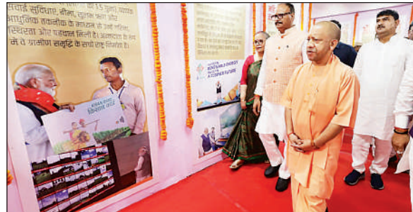
प्रधानमंत्री के जीवन पर आधारित प्रदर्शनी देखते मुख्यमंत्री योगी।

अमृत विचार : प्रधानमंत्री नरेंद्र मोदी के 75वें जन्मदिन पर बुधवार को मुख्यमंत्री योगी आदित्यनाथ ने लखनऊ से सेवा पखवाड़ा 2025 की शुरुआत की। उन्होंने कहा कि मोदी के नेतृत्व में भारत ने बीते 11 वर्षों में हर क्षेत्र में नई ऊंचाइयों को छुआ है। जो भारत कभी पिछलग्र्य माना जाता था, वही आज आत्मविश्वास और विकास का प्रतीक बनकर दुनिया को नई दिशा दे रहा है। गरीबी से विरासत तक और महामारी प्रबंधन से कूटनीति तक मोदी मॉडल मिसाल है। प्रधानमंत्री को प्रदेश की ढाई करोड़ जनता की ओर से बधाई देते हुए योगी ने कहा कि मोदी मॉडल ने गरीबी उन्मूलन, स्वास्थ्य, कूटनीति, आस्था और विरासत से लेकर इंफ्रास्ट्रक्चर और निवेश