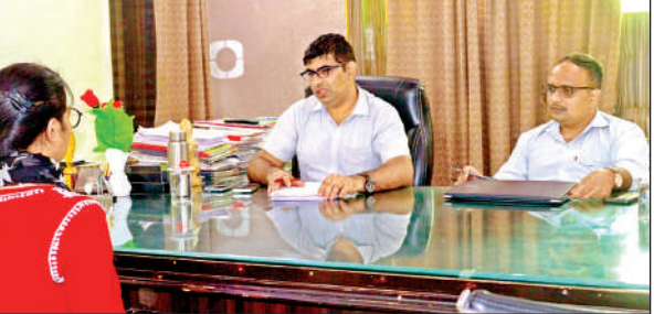
स्टूडेंट का इंटरव्यू लेते कंपनी पैनलिस्ट ।

चौ सुघर सिंह महाविद्यालय के अध्यक्षनरत विद्यार्थियों में भी इससे अपने भविष्य के प्रति विश्वास जाग्रत हुआ है। उल्लेखनीय है कि पिछले महीने भी इस संस्था के 60 से ज्यादा विद्यार्थियों को कैपस सिलेक्शन के जरिये प्लेसमेंट मिला था। इस बार सहज मिल्क फैसिलिटेड लिमिटेड, आगरा कंपनी में 19 छात्र केमिस्ट तथा 20 छात्र मिलक सुपरवाइजर के पदों पर चयनित हुए