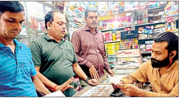
दुकानदारों को पंपलेट देकर जानकारी देते संगठन के लोग

अमृत विचार। आये दिन साइबर क्राइम से जुड़ी खबरें आती रहती हैं जिसमें सबसे ज्यादा प्रभावित व्यापारी होते हैं। कभी नकली स्क्रीन शॉट दिखाकर ग्राहक धोखाधड़ी कर जाता है तो कभी लोन का लालच देकर स्पैम ओटीपी भेजा जाता है और हैकर्स के द्वारा बैंक से पैसे उड़ा दिये जाते हैं। साइबर क्राइम से बचने के लिये जागरूकता ही बचाव है, जिसके लिये व्यापारियों ने कमर कस ली