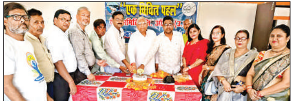
केक काटते संगठन के पदाधिकारी।