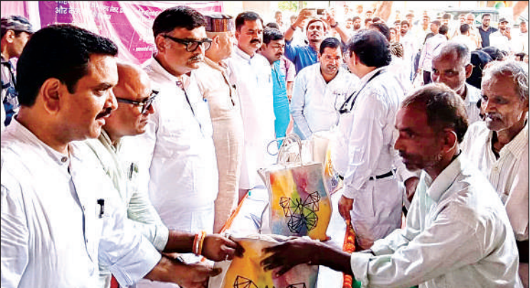
जिला अस्पताल में सेवा पखवाड़ा पर कार्यक्रम में मौजूद मंत्री, पूर्वसांसद, भाजपा जिलाध्यक्ष व अन्य लोग।

जिला अस्पताल में सेवा पखवाड़ा के तहत आयोजित हुए कार्यक्रम , स्वास्थ्य कैंप लगा कर मरीजों की जांच व उपचार दिया गया