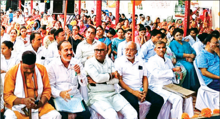
कार्यक्रम के दौरान मौजूद लोग।