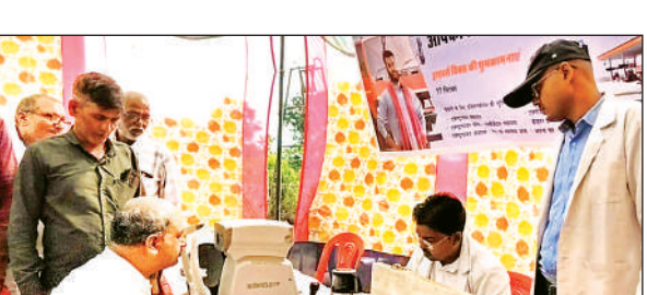
वाहन चालकों का नेत्र परीक्षण करते चिकित्सक ।