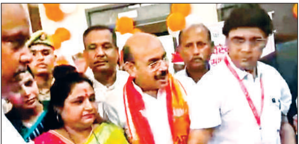
कार्यक्रम में मौजूद भाजपा नेता व अन्य ।