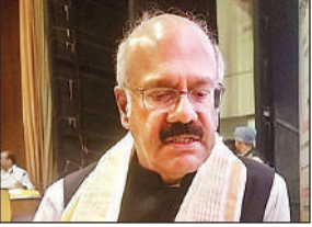
प्रो. डी. नागेश्वर रेड्डी

संस्थापक और अध्यक्ष प्रो. डी. नागेश्वर रेड्डी का। वे मंगलवार को एसजीपीजीआई के दीक्षांत समारोह में मुख्य अतिथि शामिल हुए। इस मौके पर अमृत विचार ने उनसे फैटी लिवर सहित इलाज में आर्टिफिशियल इंटेलिजेंस (एआई) की भूमिका पर बातचीत की। डी. नागेश्वर एक प्रख्यात भारतीय गैस्ट्रोएंटेरोलॉजिस्ट हैं, जिन्हें पद्म श्री (2002), पद्म भूषण (2016) और पद्म विभूषण (2025) पुरस्कारों से सम्मानित किया जा