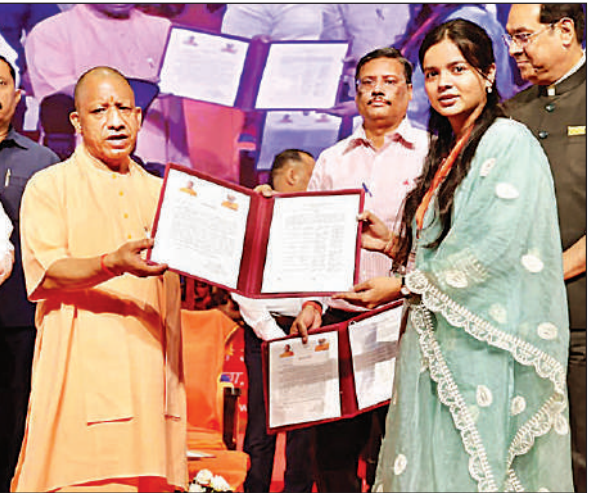
नव चयनित महिला कार्मिक को नियुक्ति पत्र देते मुख्यमंत्री योगी आदित्यनाथ।

अमृत विचार : भगवान विश्वकर्मा जयंती के अवसर पर मुख्यमंत्री योगी आदित्यनाथ ने कारीगरों और शिल्पकारों को बड़ी सौगात देते हुए घोषणा की कि परंपरागत 11 ट्रेड्स के साथ 12 नए ट्रेड्स को विश्वकर्मा श्रम सम्मान योजना में शामिल किया गया है। अब मोबाइल रिपेयरिंग, ऑटोमोबाइल रिपेयरिंग, इलेक्ट्रॉनिक गुड्स रिपेयरिंग, इलेक्ट्रिकल गुड्स रिपेयरिंग, प्लंबर, कंप्यूटर रिपेयरिंग, सोलर पैनल रिपेयरिंग, डिजिटल फोटोग्राफी, ब्यूटी एंड वेलनेस जैसे क्षेत्रों के कारीगर भी योजना से लाभान्वित होंगे। मुख्यमंत्री ने कहा कि इससे युवाओं को आधुनिक तकनीक, आत्मनिर्भरता और वैश्विक बाजार