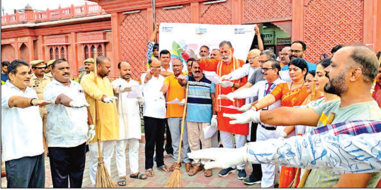
स्टेशन परिसर की स्वच्छता संबंधी शपथ ग्रहण करते जिला प्रभारी मंत्री मनोहर लाल व अन्य।