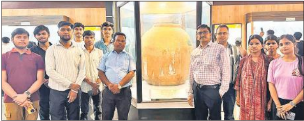
कैपस भ्रमण के दौरान पांचाल संग्रहालय में मौजूद शिक्षक व छात्र। ● अमृत विचार

देने के लिए प्रतिबद्ध है। कार्यक्रम में छात्र-छात्राओं से भारतीय परंपराओं, वेदों, उपनिषदों और गीता जैसे ग्रंथों से प्रेरणा लेकर जीवन में सकारात्मकता और राष्ट्र सेवा की भावना को अपनाने पर जोर दिया गया। वहीं, कैम्पस में विश्वकर्मा जयंती पर हवन पूजन हुआ। मुख्य वक्ता को सम्मानित किया गया।