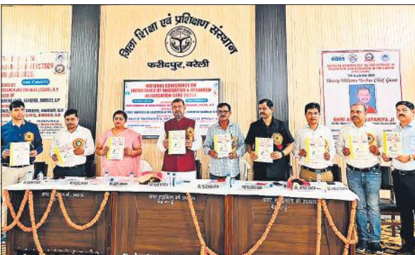
कार्यक्रम के दौरान पुस्तक का विमोचन करते अतिथि व अन्य।