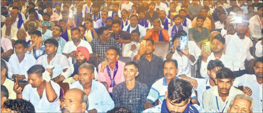
संजय कम्युनिटी हॉल में प्रबुद्धजन सम्मेलन में जुटे आजाद समाज पार्टी (कांशीराम) के कार्यकर्ता।

कि जनता का भरोसा लगातार कम हो रहा है, इसलिए चुनाव बैलेट पेपर से कराए जाने चाहिए। प्राकृतिक आपदा, छुट्टा पशुओं और गुलदारा के हमलों से किसान त्रस्त हैं। नेपाल जैसे हालात उत्तर प्रदेश में भी दिखाई दे रहे हैं। उन्होंने कहा कि हिन्दू-मुस्लिम राजनीति का भाजपा का नया केंद्र उत्तराखंड बना है। इस राज्य में मदरसा बोर्ड खत्म करने के साथ ही सरकार ने समान नागरिक संहिता (यूनिकॉम सिविल कोड)