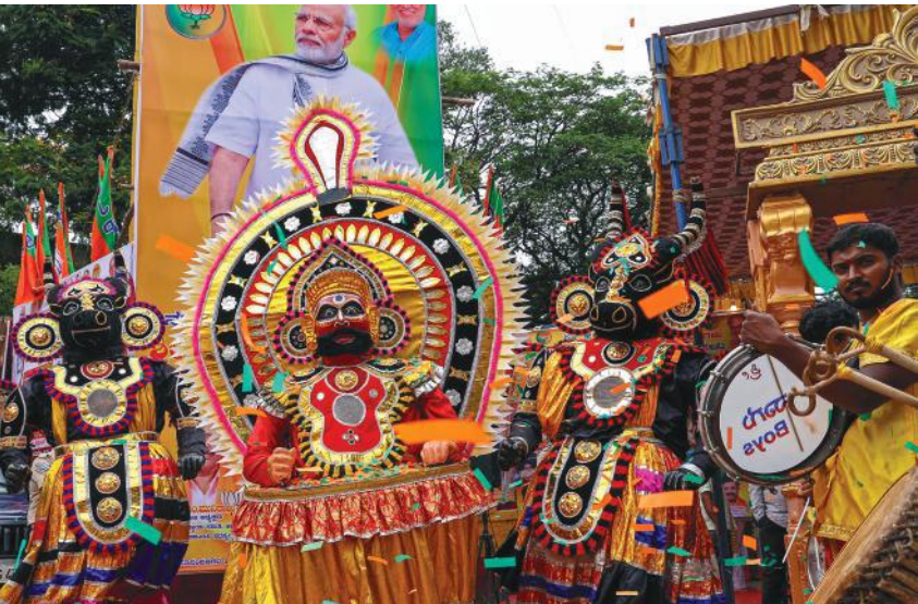
बेंगलुरु : प्रधानमंत्री नरेंद्र मोदी के जन्मदिन के अवसर पर बुधवार को भाजपा युवा मोर्चा द्वारा आयोजित कार्यक्रम के दौरान लोक कलाकार प्रस्तुति देते हुए।

गेमिंग एप्स से जासूसी एक गंभीर चिंता का विषय है, जो डेटा सुरक्षा और उपयोगकर्ता गोपनीयता को खतरे में डालता है। कई गेमिंग एप्स उपयोगकर्ताओं के डेटा को इकट्ठा करते हैं, जिसमें व्यक्तिगत जानकारी, स्थान डेटा, और डिवाइस की जानकारी शामिल हो सकती है। जासूसी करने में चीन कई देशों से आगे है, लेकिन जासूसी के लिए जिस तरह से वह इंटरनेट का प्रयोग करता है उससे बड़े देश भी सतर्क रहते हैं। चीन आनलाइन सब पर निगाह रखता है। एक ऑस्ट्रेलियाई अध्ययन में दावा किया गया है कि वैश्विक इंटरनेट उपयोगकर्ताओं की ऑनलाइन आदतों पर चीन नजर रख रहा है। टिक टॉक इसीलिए विवादस्पद हो गया था।