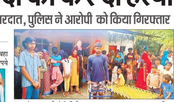
मृतका के घर पर लगी लोगों की भीड़।

नृत्य और लखनऊ घराने की कथक प्रस्तुतियां होंगी। यह पवेलियन राज्य की विविधता और परंपरा को अंतरराष्ट्रीय मंच पर प्रदर्शित करेगा।