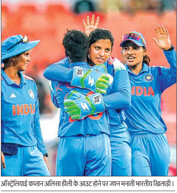
ऑस्ट्रेलियाई कप्तान अलिसा हीली के आउट होने पर जश्न मनाती भारतीय खिलाड़ी।