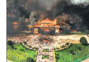
प्रदर्शन के दौरान जला संसद भवन।

● क्षतिग्रस्त भवनों की मरम्मत का दिया निर्देश