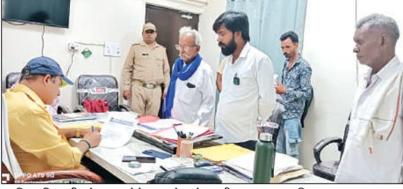
उपजिलाधिकारी को ज्ञापन देते ग्राम गोठा के ग्रामीण।