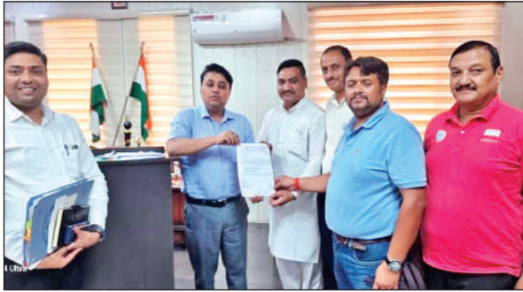
डीएम को ज्ञापन सौंपते ओमेक्स व मेट्रोपोलिस कॉलोनी के लोग।

वहीं जिलाधिकारी ने कहा कि अगर दोनों कॉलोनियों की