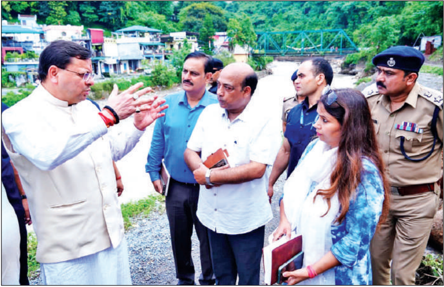
आपदाग्रस्त क्षेत्र में निरीक्षण के दौरान अधिकारियों को निर्देश देते मुख्यमंत्री पुष्कर सिंह धामी।