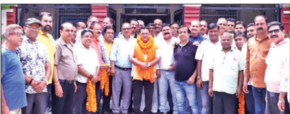
काशीपुर में नगर निगम कार्यालय के बाहर महापौर का स्वागत करते व्यापारी।

गुरुवार को नगर निगम कार्यालय पहुंचे व्यापारियों ने कहा कि इस बार बरसात तो काफी हुई, लेकिन महापौर ने नाले नालियों की रात रात भर खड़े होकर जिस तरह से सफाई कराई उसके चलते-जल भराव नहीं हुआ और उसी का नतीजा है कि हर वर्ष दुकानदारों को दुकानों में पानी भर जाने से होने वाली करोड़ों