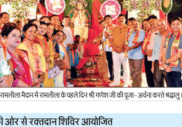
रामलीला मैदान में रामलीला के पहले दिन श्री गणेश जी की पूजा- अर्चना करते श्रद्धाु।