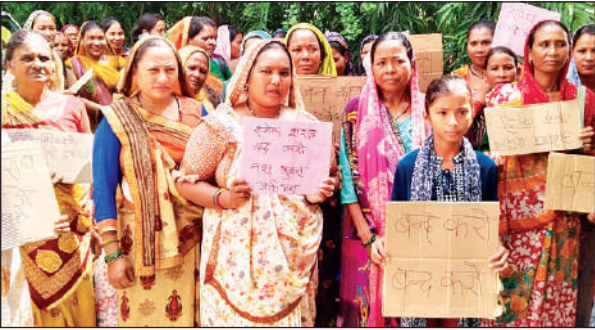
खटीमा में नशे के अवैध कारोबार के विरोध में प्रदर्शन करती महिलाएं।