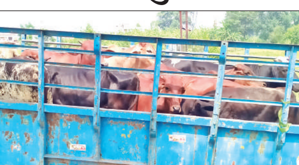
दिनेशपुर के ग्रामीण क्षेत्र से ट्रैक्टर-ट्रॉली में भरे आवारा पशु। ● अमृत विचार

किसानों ने कई बार प्रशासन से आवारा पशुओं की रोकथाम की गुहार लगाई लेकिन कोई सुनवाई नहीं हुई। क्षेत्र के परेशान किसानों ने आवारा पशुओं को एकत्र कर निकटवर्ती जंगलों में पहुंचाया। गुरुवार को क्षेत्र में किसानों ने आवारा पशुओं को रामलीला