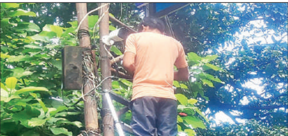
शहर को सीसीटीवी से लैस करता कर्मी।