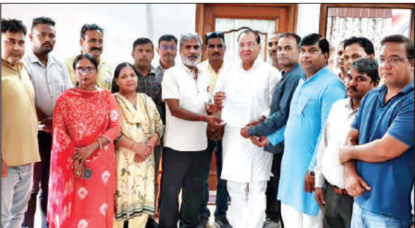
बाजपुर में कैप कार्यालय में नेता प्रतिपक्ष यशपाल आर्य को ज्ञापन सौंपते शिक्षक।