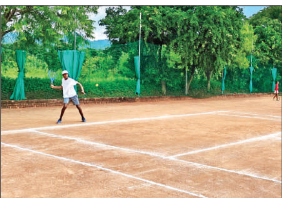
आटिमम टेनिस टूर्नामेंट मेंप्रतिभाग करताखिलाड़ी। ● अमृत विचार

खास बात यह है कि भारत से रिकॉर्ड 145 खिलाड़ी इस प्रतियोगिता में अपने हुनर का प्रदर्शन करेंगे। इससे भारतीय खिलाड़ियों को न केवल एशियाई स्तर पर प्रतिस्पर्धा का मौका मिलेगा, बल्कि भविष्य के लिए अंतरराष्ट्रीय अनुभव भी जुटेगा। खेल को निष्पक्ष और उच्च स्तर पर संपन्न कराने के लिए 14 इंटरनेशनल रेफरी के साथ-साथ अनुभवी भारतीय रेफरी भी मौजूद रहेंगे। प्रतियोगिता को पोडियम पिस्ट पर कराया जाएगा, जो अंतरराष्ट्रीय मानकों के अनुरूप है। आयोजकों के मुताबिक, इस प्रतियोगिता में वे सभी नेशनल