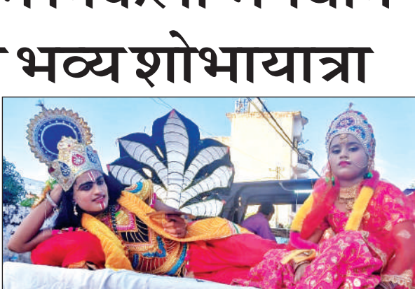
कुंडेश्वरी में निकली शोभायात्रा में शामिल झांकी।