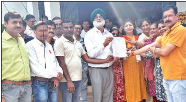
काशीपुर में विधायक को ज्ञापन सौंपते शिक्षक।