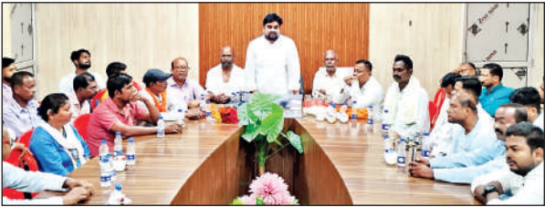
नगर पंचायत सभागार में बैठक करते बंगाली समुदाय के प्रबुद्ध लोग।

नगर पंचायत सभागार में बंगाली समुदाय के प्रबुद्ध लोगों की अहम बैठक संपन्न हुई। बैठक में बंगाली बाहुल्य क्षेत्र में बांग्ला भाषा लागू करने, बंगाली समुदाय को ओबीसी का दर्जा दिए जाने एवं बंगाली छात्रों को दिए जाने वाले गुरु चांद छात्रवृत्ति को पुनः बहाल किए जाने