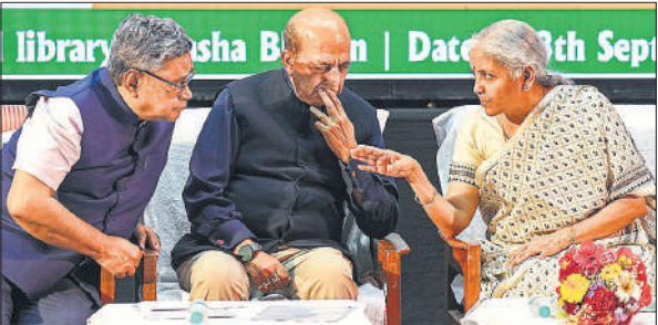
अगली पीढ़ी के जीएसटी सुधारों पर चर्चा में शामिल केंद्रीय वित्त मंत्री निर्मला सीतारमण