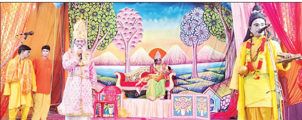
चौधरी तालाब में रामलीला का मंचन करते कलाकार।