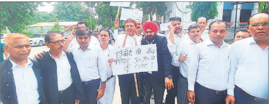
हाईकोर्ट बेंच के लिए कलेक्ट्रेट में प्रदर्शन करते अधिवक्ता।

अधिवक्ताओं ने कहा कि इलाहाबाद हाईकोर्ट प्रयागराज में है, जिसकी एक बेंच प्रदेश की राजधानी लखनऊ में है। लखनऊ बेंच में आसपास के 15 जिलों का क्षेत्राधिकार दिया गया है। लेकिन पश्चिमी उत्तर प्रदेश के सभी 22 जिलों का क्षेत्राधिकार इलाहाबाद हाईकोर्ट को दिया गया है। सुगम और सुलभ न्याय पाना प्रत्येक नागरिक का अधिकार है। लेकिन उप के सहारनपुर जनपद से इलाहाबाद हाईकोर्ट की दूरी 800 किमी. से अधिक है। ऐसे में वादकारियों का अपने मुकदमे में इलाहाबाद जाकर पैरवी करना बहुत