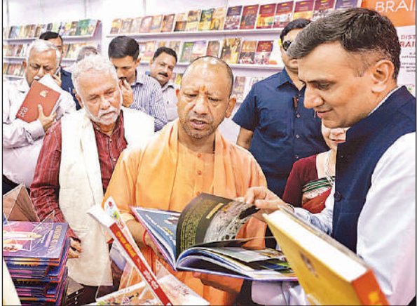
लखनऊ विश्वविद्यालय में लगे पुस्तक मेले में किताबें देखते मुख्यमंत्री योगी।

युवाओं को स्मार्टफोन से दूरी और पुस्तकों का महत्व बताया। उन्हें प्रधानमंत्री नरेंद्र मोदी की लिखी पुस्तक ‘परीक्षा योद्धा’ भेंट की। मुख्यमंत्री ने कहा कि अच्छी पुस्तक सदैव जीवन की योग्य मार्गदर्शक होती है, जो हर परिस्थिति में पथप्रदर्शक बनकर हमें आगे बढ़ने की प्रेरणा देती है। उन्होंने हर छात्र से कम से कम एक पुस्तक खरीदने की