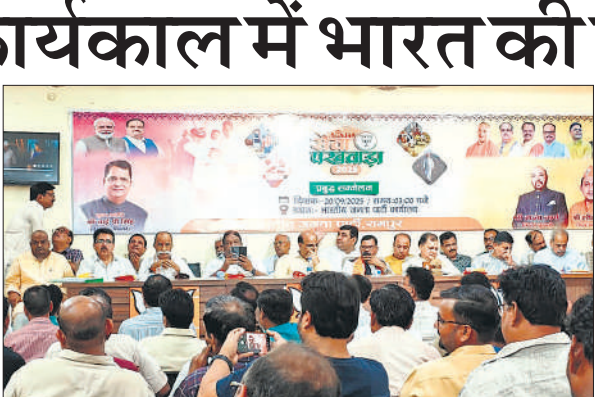
प्रबुद्ध सम्मेलन के दौरान मंच पर मौजूद मुख्य अतिथि।