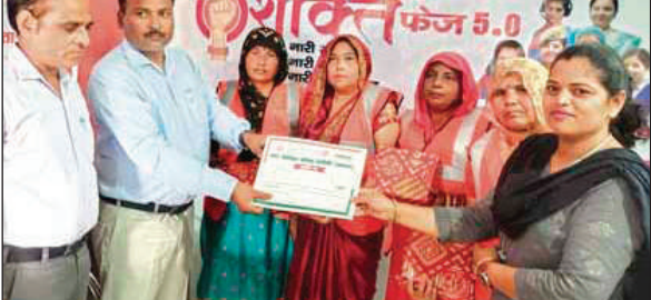
महिला सफाई कर्मियों को सम्मानित करते ईओ।