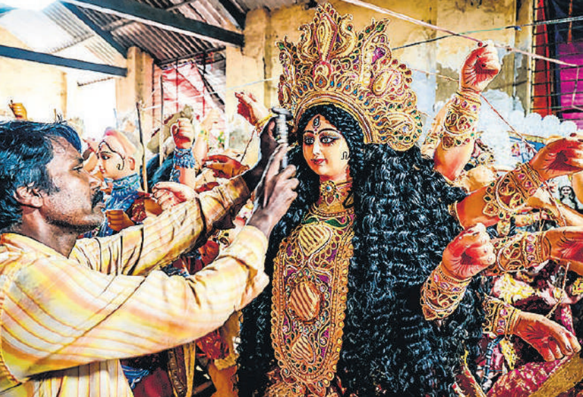
चेन्नई में शनिवार को एक कार्यशाला में दुर्गा पूजा उत्सव से पहले एक कारीगर देवी दुर्गा की मूर्ति को अंतिम रूप देता हुआ।

वाशिंगटन। अमेरिका के राष्ट्रपति डोनाल्ड ट्रंप ने कहा है कि उनका देश रूस-यूक्रेन की जंग से पैसे कमा रहा है। उनका यह बयान उनके पहले के कीव के विपरीत है, जिसमें उन्होंने कीव को बिना शर्त सैन्य समर्थन देने की बात कही थी, जिसके तहत अमेरिका उसे हथियारों की आपूर्ति करता रहा है। आरटी की रिपोर्ट के अनुसार शुक्रवार को व्हाइट हाउस में मीडिया से बात करते हुए ट्रंप ने जुलाई में उस हस्ताक्षरित समझौते की प्रशंसा की, जिसके तहत अमेरिका अपने साथी नाटो सदस्यों को हथियार बेचता है, जो बाद में वे यूक्रेन को सौंप देते हैं।