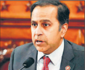
अमेरिकी सांसद राजा कृष्णमूर्ति।

सांसद राजा कृष्णमूर्ति ने कहा कि एच-1बी वीजा पर 1,00,000 डॉलर का शुल्क लगाने का ट्रंप का फैसला बेहद कुशल कामगारों को अमेरिका से दूर करने का एक भयावह प्रयास है, जिन्होंने लंबे समय से हमारे कार्यबल को मजबूत किया है, नवाचार को बढ़ावा दिया है और लाखों अमेरिकियों को मजबूत बनाते