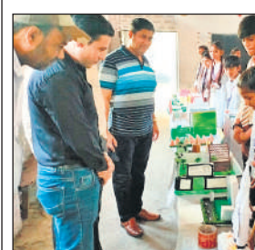
बालाजी स्कूल में बच्चों के बनाये मॉडल देखते अतिथि।