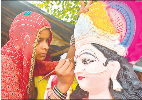
खुशालपुर में मां की मूर्ति को रंग करती महिला मूर्तिकार।

बाजार में हर तरफ रंग-बिरंगी चुनरियां, श्रृंगार सामग्री और सजावटी वस्तुएं भक्तों को अपनी ओर आकर्षित कर रही हैं। ताड़ीखाना पर एक दुकान पर विक्रेता शुभल दास ने बताया कि इस बार बाजार में मुरादाबाद के पीतल के साथ ही जयपुर के मार्बल डस्ट से बनी दुर्गा प्रतिमाओं की खूब डिमांड है। पसंद के अनुसार अलग-अलग आकार और डिजाइनों में प्रतिमाएं उपलब्ध हैं। उन्होंने बताया कि मार्बल डस्ट से बनी प्रतिमाएं 600 रुपये से लेकर सात