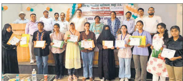
प्रशस्ति पत्र के साथ छात्राएं एवं अतिथि।