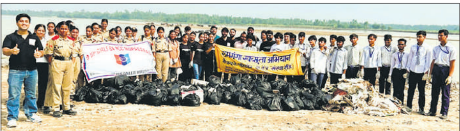
रामगंगा तट पर सफाई करते एनसीसी कैडेट्स और संस्थाओं के स्वयंसेवक।