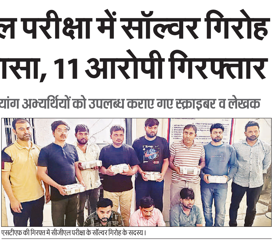
एसटीएफ की गिरफ्त में सीजीएल परीक्षा के सॉल्वर गिरोह के सदस्य।

निगम को कंपनी अधिनियम-2013 की धारा-8 के तहत नॉन-प्रॉफिट संस्था के रूप में पंजीकृत किया जा रहा है। लेकिन इसकी नियमावली को अंतिम रूप देने में अब विभागों और आउटसोर्स निगम के बीच अधिकारों की रस्साकसी शुरू हो गई है। यदि विभागों को फिर से एजेंसी चयन का अधिकार मिला तो पुरानी विसंगतियां जैसे