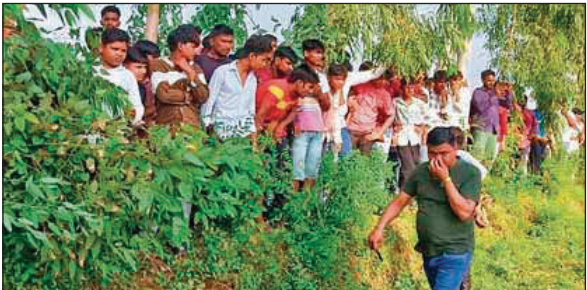
मोनू का शव बरामद होने के बाद इकट्ठा ग्रामीण।

गुन्नौर-नरोरा रोड स्थित काली मंदिर के पास सड़क पर एक मृत सांड पड़ा हुआ था। शुक्रवार देर रात सूचना मिलने पर डायल-112 पुलिस वैन मौके पर पहुंची। पुलिस वाले मृत सांड को हटाने का प्रयास कर रहे थे। इसी दौरान आगरा की ओर से आ रही एक तेज रफ्तार डबल डेकर बस मृत सांड को रौंदते हुए पुलिसकर्मियों से टकरा गई और अनियंत्रित होकर सड़क किनारे खाई में जा गिरी। बस की टक्कर से पुलिस