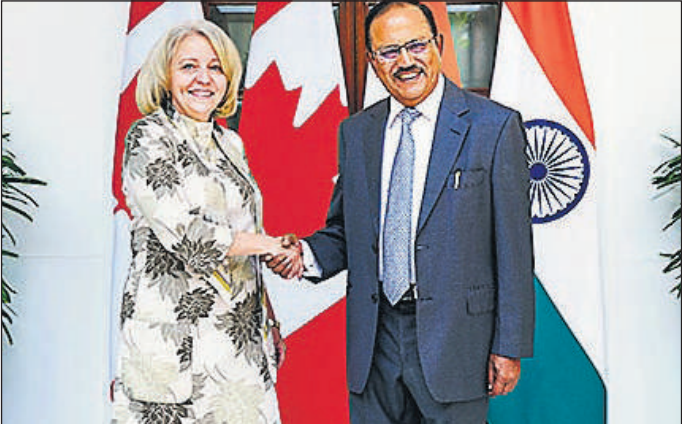
भारत के राष्ट्रीय सुरक्षा सलाहकार अजीत डोभाल कनाडाई समकक्ष के साथ।

विदेश मंत्रालय (एमईए) ने शनिवार को कहा कि भारत और कनाडा द्विपक्षीय संबंधों में एक नया अध्याय जोड़ने के लिए एक सहयोगात्मक दृष्टिकोण अपनाने पर सहमत हुए हैं, जिसमें आतंकवाद और अंतरराष्ट्रीय अपराधों से निपटने के लिए मिलकर काम करना शामिल है। राष्ट्रीय सुरक्षा सलाहकार (एनएसए) अजीत डोभाल और उनकी कनाडाई समकक्ष नथाली ड्रोइन ने वृहस्पतिवार को नयी दिल्ली में व्यापक मुद्दों पर वार्ता की जिसका मुख्य उद्देश्य 2023 में एक सिख अलगाववादी की हत्या को लेकर हुए राजनयिक विवाद के बाद गंभीर तनाव से गुजर रहे द्विपक्षीय संबंधों को सुधारना था। विदेश मंत्रालय