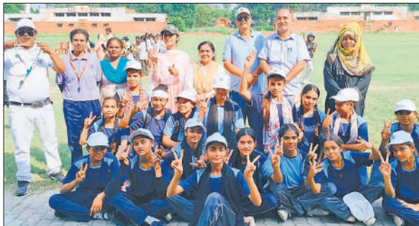
खो-खो की विजेता नवाब गंज इंटर कॉलेज की टीम।

अंडर 19 बालिका वर्ग का फाइनल राजकीय इंटर कॉलेज काशीपुर ने नवाब गंज इंटर कॉलेज को 12-7 से हराकर फाइनल जीत लिया। कस्तूरबा गांधी मिलक की टीम ने बिलासपुर को 5-4 से शिकस्त दी। खो-खो प्रतियोगिता में बालिका वर्ग में अंडर 14, 17 और अंडर-19 के विभिन्न विद्यालयों के प्रतिभागियों ने प्रतिभाग किया। प्रतियोगिता में कन्या इंटर कॉलेज खारी कुआं, राजकीय उच्चतर माध्यमिक विद्यालय नौगावां मिलक, राजकीय उच्चतर माध्यमिक विद्यालय धनुपुरा, राजकीय इंटर कॉलेज काशीपुर, हसरत इंटर कॉलेज खोद, नवाब गंज इंटर कॉलेज नवाबगंज, राजकीय इंटर कॉलेज टांडा, ग्रीन गार्डन स्कूल, राजकीय खुर्शौद कन्या