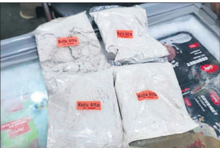
शहर की एक दुकान पर रखा कुट्टू का आटा।

● खाद्य सुरक्षा विभाग ने मिलावटखोरों पर नकेल कसने को शुरू किया अभियान, पुराने कुट्टू आटे को नष्ट करने की दी हिदायत