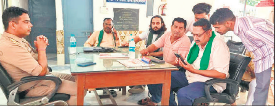
भाकियू नेता की धरपकड़ का पता लगने के बाद कोतवाली पहुंचे मंडल अध्यक्ष व अन्य पदाधिकारी।