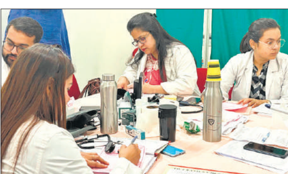
शिविर में मरीजों का चेकअप करती मेडिकल कॉलेज की टीम।