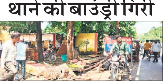
बारिश के बाद ढही महिला थाना की दीवार।