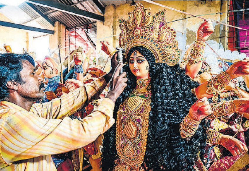
चेन्नई में शनिवार को एक कार्यशाला में दुर्गा पूजा उत्सव से पहले एक कारीगर देवी दुर्गा की मूर्ति को अंतिम रूप देता हुआ।

एच1बी वीजा अमेरिकी राष्ट्रपति डोनाल्ड ट्रंप के एक फैसले के कारण भारतीयों के लिए एक बड़ा झटका बन गया है। ट्रंप ने एच1बी वीजा की सालाना फीस बढ़ाकर 1 लाख डॉलर ( लगभग 88 लाख रुपये) कर दी है, जिसका सबसे ज्यादा असर भारतीय कामगारों पर पड़ने की संभावना है। पढ़ाई पूरी करने के बाद अमेरिका में सीमित अवसर होंगे। अगर आप पढ़ाई करने गए और वहां पर आप नौकरी का अवसर तलाशते हैं तो वो भी सीमित हो जाएंगे क्योंकि वरीयता होगी अमेरिका के लोगों को लिया जाए। अमेरिकी यूनिवर्सिटी में मास्टर या पीएचडी करने वाले छात्रों पर असर पड़ेगा।