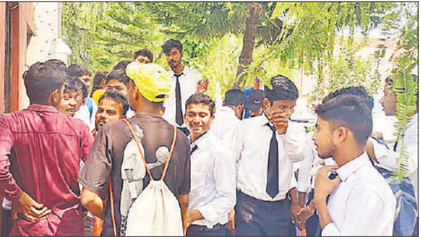
रोजगार मेले में उमड़ी युवाओं की भीड़।