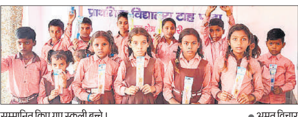
सम्मानित किए गए स्कूली बच्चे।