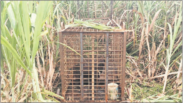
बाधिन पकड़ने को गन्ने के खेत में लगाया गया पिंजड़ा। ● अमृत विचार

बाधिन को स्वास्थ्य परीक्षण के बाद रेडियो कॉलर लगाकर कोर एरिया में छोड़ा गया था, लेकिन बरसात के कारण दुधवा जंगलों में पानी और कीचड़ भरने से वहां शिकार कठिन हो गया है। इसी वजह से वह जंगल से बाहर आकर कंपनी फॉर्म, देवीपुर, मुजहा, ऐठपुर सहित कई गांवों के आसपास घूम रही है और कई