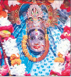
शहर के मंदिर में स्थापित माता संकटा देवी की प्रतिमा।

नवरात्र के चलते मंदिर के बाहर सजने लगीं नारियल और चुनरी की दुकानें