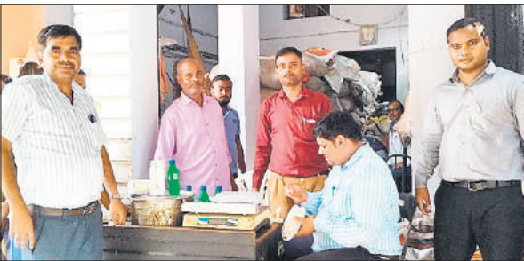
शहर में एक प्रतिष्ठान पर सैपलिंग की कार्यवाही करती एफएसडीए टीम।

बात करें तो कुट्टू का आटा इन दिनों 250 ग्राम और 500 ग्राम और एक किलोग्राम के पैकेट में बिक्री किया जा रहा है। हालांकि बाजार में कुट्टू का खुला आटा भी मौजूद है, मगर दुकानदार इसे भी पैकिंग का रूप देकर बिक्री कर रहे हैं।