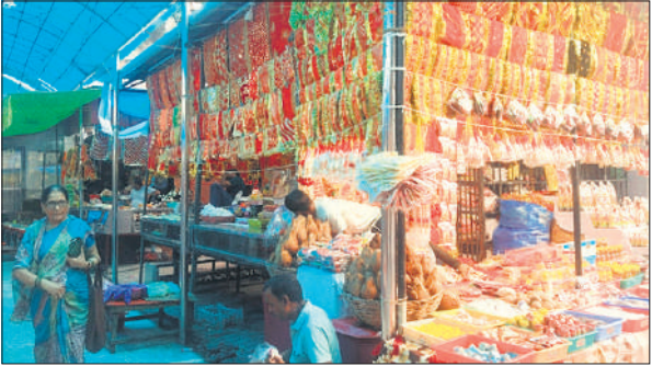
माता संकटा देवी मंदिर परिसर में सजी चुनरी और प्रसाद की दुकान। ● अमृत विचार

की लाइटों से सजाया जा रहा है। मंदिरों के बाहर फल-फूल, नारियल, और चुनरी की भी दुकानें सजने लगी हैं। नवरात्र में प्रतिदिन मां के नौ स्वरूपों की पूजा, अर्चना कर उपवास रखे जाते हैं। दुकानों पर माता के सोलह श्रृंगार का सामान बिकना शुरू हो गया है।