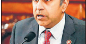
अमेरिकी सांसद राजा कृष्णमूर्ति।

सांसद राजा कृष्णमूर्ति ने कहा कि एच-1बी वीजा पर 1,00,000 डॉलर का शुल्क लगाने का ट्रंप का फैसला बेहद कुशल कामगारों को अमेरिका से दूर करने का एक भयावह प्रयास है, जिन्होंने लंबे समय से हमारे कार्यबल को मजबूत किया है, नवाचार को बढ़ावा दिया है और लाखों अमेरिकियों को मजबूत बनाते