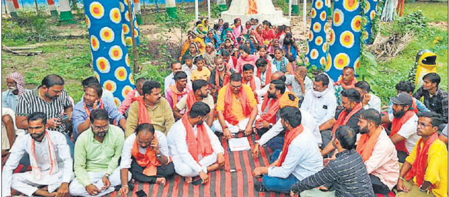
नेहरू पार्क में धरना प्रदर्शन करते पदाधिकारी और कार्यकर्ता।