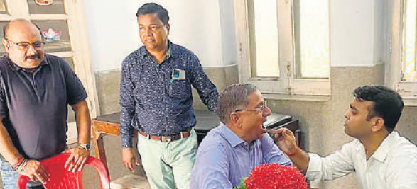
बजाज चीनी मिल के शिविर में दांतों का परीक्षण करते डॉक्टर।