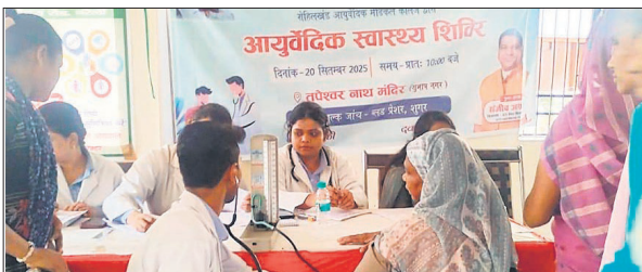
शिविर में लोगों की जांच करते चिकित्सक और कर्मी।