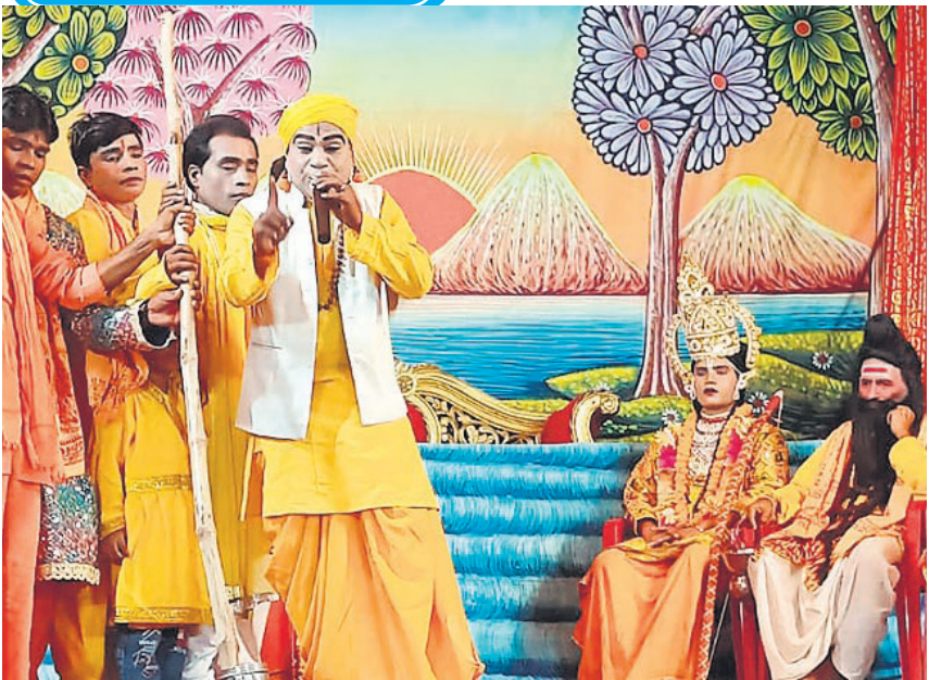
चौधरी तालाब मैदान में रामलीला का मंचन करते कलाकार। (संबंधित खबर पेज IV पर)