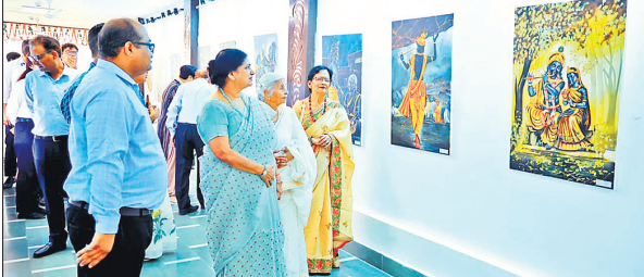
रिद्धिमा में कला प्रदर्शनी का अवलोकन करते लोग।