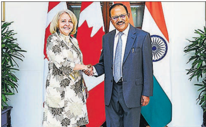
भारत के राष्ट्रीय सुरक्षा सलाहकार अजीत डोभाल कनाडाई समकक्ष के साथ।

विदेश मंत्रालय (एमईए) ने शनिवार को कहा कि भारत और कनाडा द्विपक्षीय संबंधों में एक नया अध्याय जोड़ने के लिए एक सहयोगात्मक दृष्टिकोण अपनाने पर सहमत हुए हैं, जिसमें आतंकवाद और अंतरराष्ट्रीय अपराधों से निपटने के लिए मिलकर काम करना शामिल है। राष्ट्रीय सुरक्षा सलाहकार (एनएसए) अजीत डोभाल और उनकी कनाडाई समकक्ष नथाली ड्रोइन ने वृहस्पतिवार को नयी दिल्ली में व्यापक मुद्दों पर वार्ता की जिसका मुख्य उद्देश्य 2023 में एक सिख अलगाववादी की हत्या को लेकर हुए राजनयिक विवाद के बाद गंभीर तनाव से गुजर रहे द्विपक्षीय संबंधों को सुधारना था। विदेश मंत्रालय