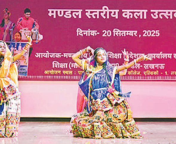
मन के दौरान प्रतिभा का प्रदर्शन करते प्रतिभागी।