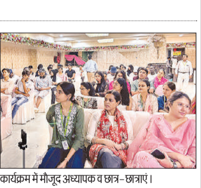
कार्यक्रम में मौजूद अध्यापक व छात्र-छात्राएं।

अमृत विचार, लखनऊ : पॉवर ग्रिड उत्तरी क्षेत्र-तृतीय क्षेत्रीय मुख्यालय की देखरेख में आयोजित पॉवर ग्रिड अंतर क्षेत्रीय वॉलीबॉल प्रतियोगिता में शनिवार को सेमीफाइनल की तस्वीर साफ हो गई।केडी सिंह बाबू स्टेडियम स्थित वॉलीबॉल कोर्ट पर दिन भर चले लोग मुकाबलों के बाद सेमीफाइनल की चारों टीमें तय हो गईं।पूल ए से दक्षिणी क्षेत्र द्वितीय और पश्चिमी क्षेत्र प्रथम, जबकि पूल बी से पश्चिमी क्षेत्र द्वितीय और केंद्रीय कार्यालय की टीमें सेमीफाइनल में अपनी जगह बनाने में कामयाब रहीं।मुकाबलों के दौरान खिलाड़ियों के बीच जबरदस्त प्रतिस्पर्धा देखने को मिली।हर अंश के लिए कड़ा संघर्ष हुआ, जिससे दर्शकों को भी मैच में रोमांच देखने को मिला।टूर्नामेंट का संचालन जिला वॉलीबॉल एसोसिएशन की देखरेख में किया जा रहा है।