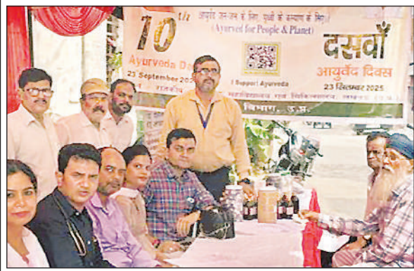
शिविर में मौजूद चिकित्सक व मरीज।

स्वास्थ्य व नेत्र परीक्षण शिविर आयोजित अमृत विचार, लखनऊ : आलमबाग बस टर्मिनल पर भारत पेट्रोलियम के सहयोग से उत्तर प्रदेश परिवहन निगम की ओर से शनिवार को एक विशेष मेडिकल हेल्थ व नेत्र परीक्षण शिविर का आयोजन किया गया। इस शिविर का उद्देश्य बालकों, परिवारकों व परिवहन विभाग के अन्य अधिकारियों,कर्मचारियों के स्वास्थ्य की जांच कर उन्हें आवश्यक परामर्श प्रदान करना था। शिविर में अनुभवी चिकित्सकों की एक विशेष टीम द्वारा कुल 145 बालकों, परिवारकों का स्वास्थ्य परीक्षण व नेत्र जांच की गई। इस स्वास्थ्य परीक्षण में सामान्य स्वास्थ्य जांच, ब्लड प्रेशर, शुगर लेवल, नेत्रों की रोशनी तथा दृष्टि संबंधी समस्याओं का परीक्षण किया गया। इसके अतिरिक्त, आपातकालीन स्थितियों में जीवन रक्षक प्रक्रिया सीपीआर की जानकारी दी गई।