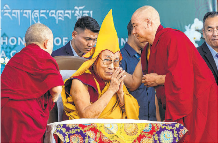
तिब्बती आध्यात्मिक नेता दलाई लामा शनिवार को हिमाचल प्रदेश के कांगड़ा जिले के मैकलोडगंज स्थित त्सुगलागखांग मंदिर में अपने 90वें जन्मदिन समारोह के तहत आयोजित एक कार्यक्रम के दौरान ।

वाशिंगटन। अमेरिका के राष्ट्रपति डोनाल्ड ट्रंप ने कहा है कि उनका देश रूस-यूक्रेन की जंग से पैसे कमा रहा है। उनका यह बयान उनके पहले के क्रुख के विपरीत है, जिसमें उन्होंने कीव को बिना शर्त सैन्य समर्थन देने की बात कही थी, जिसके तहत अमेरिका उसे हथियारों की आपूर्ति करता रहा है। आरटी की रिपोर्ट के अनुसार शुक्रवार को व्हाइट हाउस में मीडिया से बात करते हुए ट्रंप ने जुलाई में उस हस्ताक्षरित समझौते की प्रशंसा की, जिसके तहत अमेरिका अपने साथी नाटो सदस्यों को हथियार बेचता है, जो बाद में वे यूक्रेन को सौंप देते हैं।