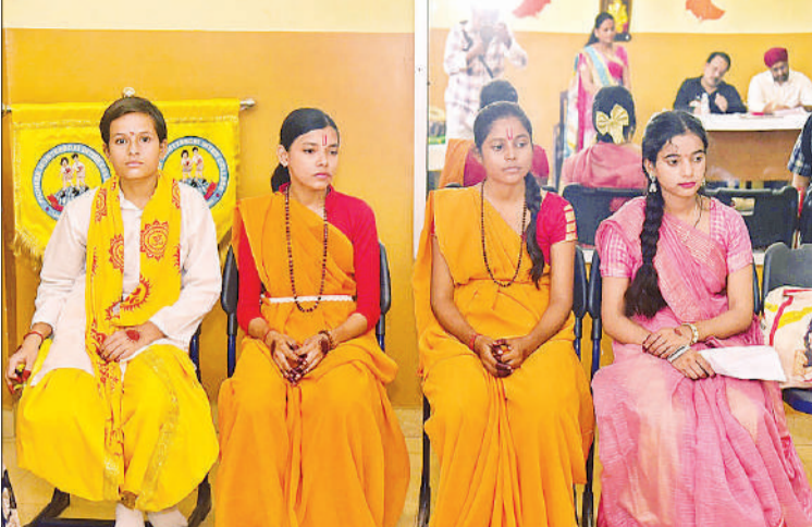
मन से पूर्व साज सज्जा करते कलाकार।

प्रतियोगिता के पहले दिन पेट्रोलियम स्पोर्ट्स प्रमोशन बोर्ड (पीएसपीबी) ने शानदार खेल