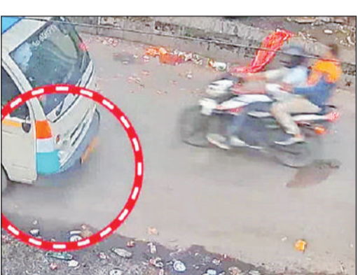
सीसीटीवी कैमरे में कैद बाइक सवार बदमाश।