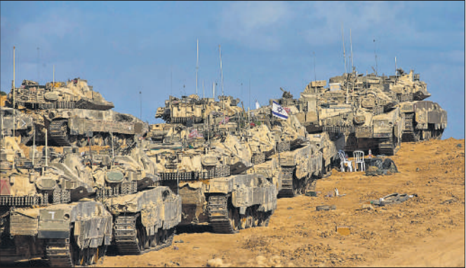
गाजा पर हमले तेज करने के लिए दक्षिणी इजराइल में सीमा के पास टैंक भेजे गए हैं ।

ब्रिटेन ने अमेरिका के विरोध को दरकिनार करते हुए यह कदम उठाया है । कुछ दिन पहले अमेरिकी राष्ट्रपति डोनाल्ड ट्रंप ने ब्रिटेन की यात्रा के दौरान इस योजना से असहमति जताई थी । ट्रंप ने कहा था, इस मामले पर