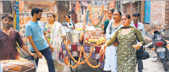
बहुचारा माता की शोभायात्रा निकालते किन्नर ।