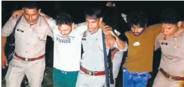
मुठभेड़ के बाद गिरफ्त में गोतस्कर ।