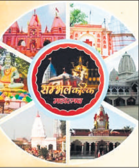
महोत्सव का लोगो।