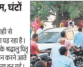
गंगा पुल पर दूर तक वाहनों की कतारें लगने से पुलिस के पसीने छूट गए हैं ।

जाम खुलवाया लेकिन इसके बाद भी शाम तक वाहन रंगते नजर