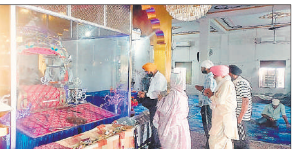
गुरुद्वारे में माथा टेकते लोग।