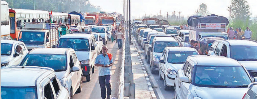
नेशनल हाईवे के दोनों लेन में फंसे वाहन ।

पितृ विसर्जन अमावस्या पर लाखों श्रद्धालुओं के उमड़ने के मद्देनजर पुलिस कई दिन से तैयारी कर रही थी। जाम न लगे इसके लिए भी इंतजाम किए गए थे। पुलिस ने नेशनल हाईवे पर रूट डायवर्जन की प्लानिंग भी की थी लेकिन आस्था के सामने पुलिस के इंतजाम फेल साबित दिखाई दिए। रविवार की सुबह तड़के से ही दिल्ली-लखनऊ नेशनल हाईवे पर कई किलोमीटर लंबा जाम लग गया। हालात बेकाबू होने पर पुलिस ने ट्रैफिक वन-वे करते हुए मुरादाबाद की दिशा से दिल्ली जाने वाले वाहनों को हसनपुर की तरफ डायवर्ट कर दिया। जिसके चलते