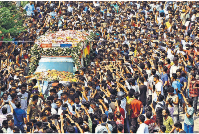
असम के गायक जुबीन गर्ग का पार्थिव शरीर रविवार को गुवाहाटी हवाई अड्डे से उनके आवास पर ले जाया गया तो उनके अंतिम दर्शन के लिए जनसैलाब उमड़ पड़ा ।