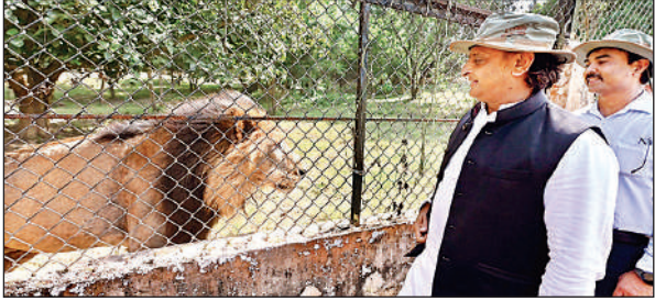
इटवा में लॉयन सफारी का भ्रमण करते पूर्व मुख्यमंत्री अखिलेश यादव।

सपा प्रमुख ने रविवार को सोशल मीडिया पर केन्द्र सरकार पर भोजपुरी भाषा में तंज कसते हुए कहा कि झूठी हुई हर बतिया, एच वन वीजा हुआ लखटिकिया। उन्होंने जारी बयान में स्पष्ट करते हुए कहा