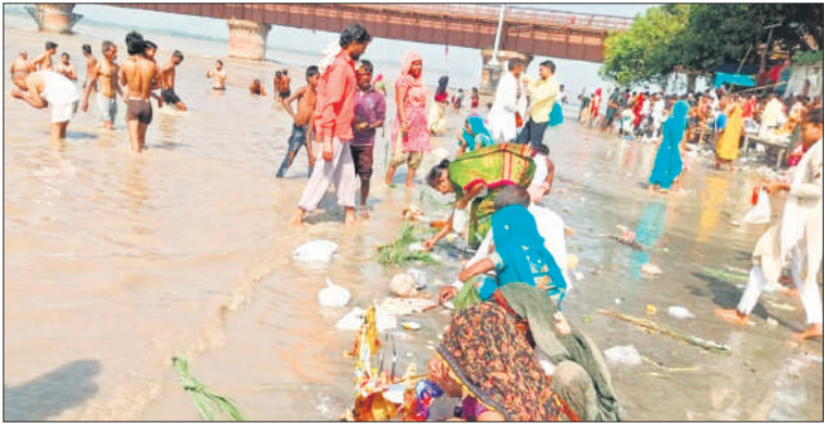
राजघाट गंगा तट पर तर्पण व पूजा करते श्रद्धालु।

पर इतनी भीड़ थी कि तिल रखने को भी जगह नहीं थी। गंगा घाटों पर श्रद्धालुओं की आवाजाही की वजह से रास्तों पर भी जाम लग रहे थे। जनपद के साधुमणि घाट,हरिबाबा धाम गंगा घाट,सिसौना डांडा गंगा घाट व बबराला राजघाट गंगा तट पर श्रद्धालुओं के गंगा स्नान करने का सिलसिला शुरू हो गया था। सुबह के छह बजने तक गंगा घाटों