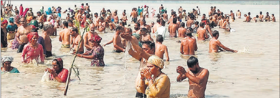
गंगा में स्नान कर सूर्य को अर्घ्य देते बड़ी संख्या में श्रद्धालु ।

पहले ही गंगा में स्नान शुरू कर दिया। हर-हर गंगे के उद्घोष संग पतित पावनी में डुबकी लगाई। गंगा मैया के जयकारे और हर-हर गंगे के उद्घोष से ब्रजघाट और तिगरी गंगा तट गूंज उठे। गंगा में स्नान करने के बाद श्रद्धालुओं ने पितरों का तर्पण किया। सुबह शुरु हुआ स्नान का सिलसिला दोपहर बाद तक का चलता रहा। श्रद्धालुओं की सुरक्षा के लिए दोनों जगह पुलिस बल तैनात रहा।