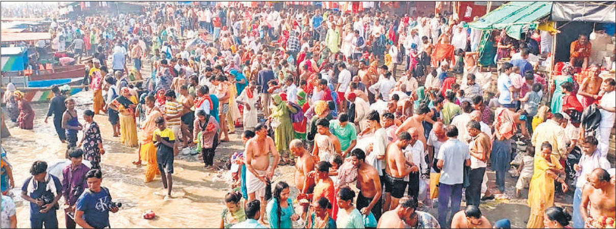
तिगरी गंगा में स्नान के लिए उमड़ी श्रद्धालुओं की भीड़ ।