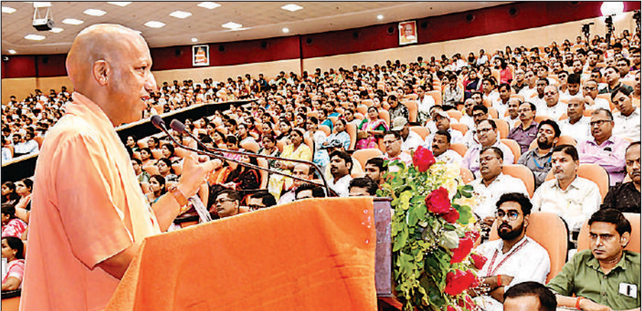
महायोगी गोरखनाथ विश्वविद्यालय के ऑडिटोरियम में कार्यशाला के दौरान लोगों को संबोधित करते मुख्यमंत्री योगी।

हर नागरिक अपनी भूमिका निभा सकता है। उन्होंने आह्वान किया कि लोग सरकार द्वारा जारी क्यूआर कोड स्कैन कर अपने सुझाव साझा करें। प्रदेश के विकास का रोडमैप जनता की भागीदारी से बनेगा। वे रविवार को महायोगी गोरखनाथ विश्वविद्यालय के ऑडिटोरियम में महाराणा प्रताप शिक्षा परिषद की ओर से आयोजित ‘विकसित भारत-विकसित उत्तर प्रदेश विजन-2047’ विषय पर आयोजित कार्यशाला को संबोधित कर रहे थे। मुख्यमंत्री ने कहा कि 1947 में देश की अर्थव्यवस्था में यूपी का योगदान 14 प्रतिशत था, जो लगातार घटता गया। 2017 में उनकी सरकार बनने के बाद विकास की रफ्तार बढ़ी और अब प्रदेश की