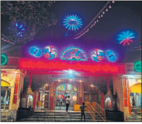
श्री सिद्धिदात्री नवदुर्गा मंदिर।