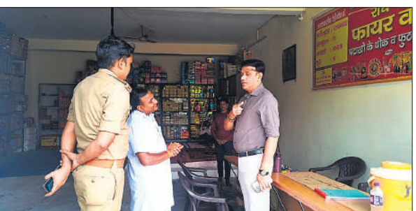
दुकान स्वामी से पूछताछ करते अधिकारी।