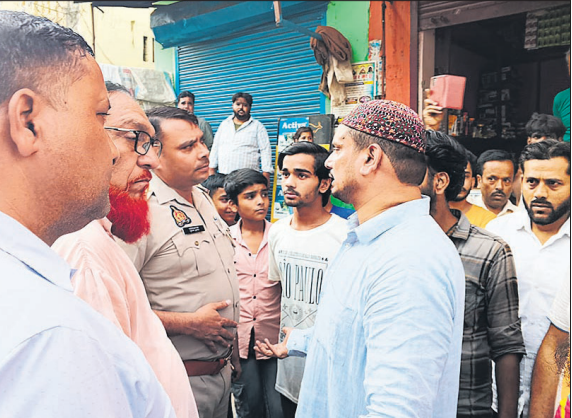
जखीरा में मौजूद पुलिस व जमात रजा-ए-मुस्तफा के पदाधिकारी। ● अमृत विचार

बारादरी पुलिस ने चार लोगों को हिरासत में लिया :