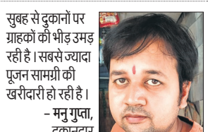
सुबह से दुकानों पर ग्राहकों की भीड़ उमड़ रही है। सबसे ज्यादा पूजन सामग्री खरीदकर ले जा रहे हैं।

व हरियाणा से माल नहीं आने के कारण माता की चुनरियों के दाम में 35 प्रतिशत तक इजाफा हुआ है। छोटी चुनरी जो पहले 30 रुपये में