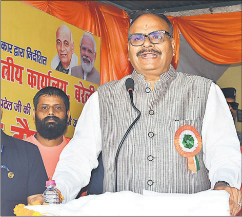
कार्यक्रम को संबोधित करते डिप्टी सीएम बृजेश पाठक।

डिप्टी सीएम ने स्टेडियम के मंच से अभिनेत्री दिशा पाटनी को बरेली की बेटी और हमारी बहन कहते हुए कहा कि फायरिंग प्रकरण में अपराधियों को उनकी औकात दिखा दी। दो बदमाश एनकाउंटर में ढेर कर दिए गए, बाकी जेल में हैं। साफ कहा कि योगी सरकार में अपराध और अराजकता के लिए कोई जगह नहीं है। उन्होंने कांग्रेस नेता राहुल गांधी और सपा मुखिया अखिलेश यादव पर जमकर हमला बोला। उन्होंने राहुल गांधी को कम्यून्स नेता बताते हुए कहा कि उन्हें खुद नहीं पता कि वे करना क्या चाहते हैं और कहाँ खड़े हैं। वहीं, अखिलेश यादव को आड़े हाथों लेते हुए तंज कसा कि उनकी सरकार में जंगलराज था, गुंडे और माफिया बेलगाम थे। जब-जब सूबे में सपा की सरकार रही, गुंडों को फलने फूलने का मौका मिला है। भाजपा सरकार में अपराधी और माफिया प्रदेश छोड़ने को मजबूर हुए। भाजपा सरकार ने प्रदेश में कानून-व्यवस्था कायम की है और अपराधियों को जेल या प्रदेश से