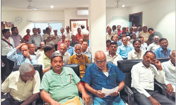
रामपुर गार्डन में कैट विधायक के कार्यालय में बैठे रबड़ फैक्ट्री के पीड़ित कर्मचारी।