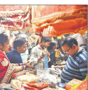
दुकान पर दिखाी ग्राहकों की भीड़।

मिलती, थी वह 50 रुपये में मिल रही है। बड़ी चुनरी ग्राहक कम खरीद रहे हैं। नारियल के दाम में करीब 40 प्रतिशत की तेजी आई है।