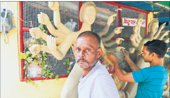
मां दुर्गा की मूर्ति तैयार करते मूर्तिकार।