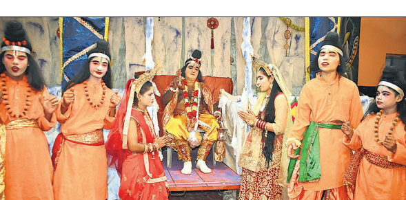
सुभाषनगर रामलीला में मंचन करते कलाकार।

कामदेव ने अप्सराओं को नारद को लुभाने के लिए भेजा लेकिन अप्सराएं नारद की तपस्या भंग रही कर सकी, आखिर में कामदेव खुद जाकर उनकी तपस्या को भंग करने का प्रयास