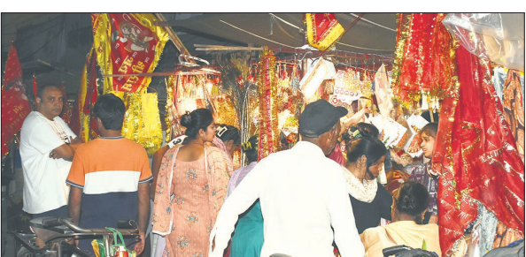
शहामतगंज में दुकान से पूजन सामग्री खरीदते ग्राहक।

दुकानदारों के अनुसार 100 से 450 रुपये तक की माता रानी की मूर्तियां की मांग अधिक रही। माता की पोशाक, ध्वजा भी खूब बिकी। कलश स्थापना के लिए शहर में कई जगह मिट्टी के कलश विक्रत रहे। हरियाणा व पंजाब में बाढ़ के चलते वहां से माल नहीं आने पर दुकानदार स्थानीय और दिल्ली से आई हुई चुनरी बेच रहे हैं। दुकानदारों ने बताया कि पंजाब