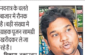
नवरात्र के चलते बाजार में रौनक है। बड़ी संख्या में ग्राहक पूजन सामग्री खरीदकर ले जा रहे हैं।