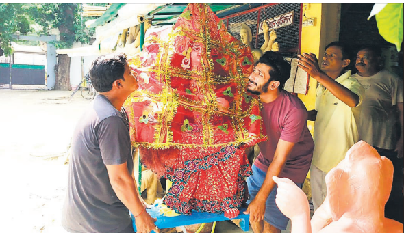
सिविल लाईंस स्थित दुकान से मां दुर्गा की मूर्ति ले जाते श्रद्धालु।