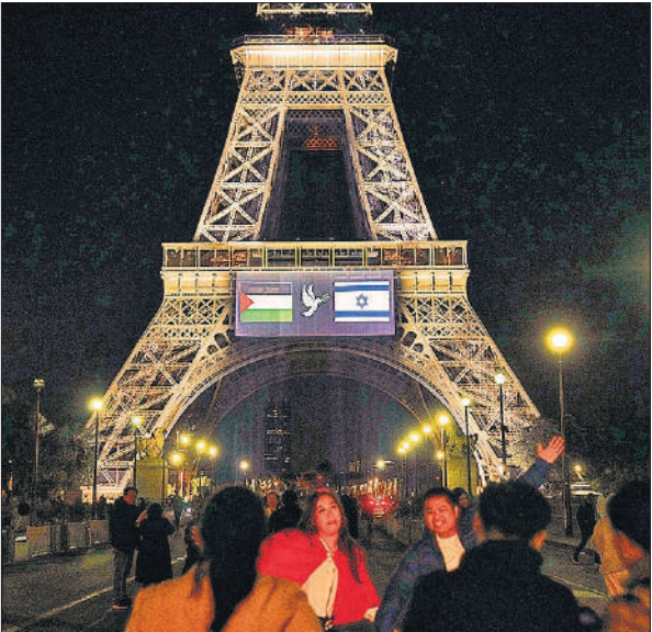
फलस्तीन को मान्यता देने की तैयारी, एफिल टॉवर पर फलस्तीनी-इजराइली झंडे।

पुर्तगाल ने अपने एलान में कहा कि द्विराष्ट्र समाधान ही न्यायसंगत और स्थाई शांति का एकमात्र मार्ग है। यह भी आशा की जा रही है कि फ्रांस समेत कई और देश इस सप्ताह संयुक्त राष्ट्र महासभा में ऐसा ही करेंगे। दशकों से इजराइल के मजबूत सहयोगी रहे इन पश्चिमी देशों ने द्विराष्ट्र समाधान की दिशा में प्रगति न होने पर गहरी निराशा भी व्यक्त की है। इजराइल ने इन कदमों की कड़ी निंदा करते हुए कहा है कि ये हवाई अड्डे, अक्टूबर, 2023 को हुए आतंकवादी हमले के लिए पुरस्कृत और प्रोत्साहित करेंगे, जिसमें लगभग 1,200 लोग मारे गए थे और लगभग 250 अन्य बंधक बनाए गए थे।