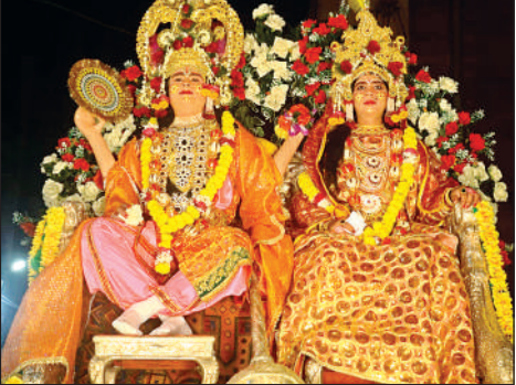
शोभायात्रा में भगवान विष्णु और लक्ष्मी जी की झांकी।

लीला की शुरुआत देवर्षि नारद के मोह से हुई। देवर्षि हिमालय में भ्रमण कर रहे थे तभी उनका मन तपस्या करने को हुआ। तपस्या शुरू होते ही देवराज इंद्र परेशान हो गए। उन्होंने कामदेव को तपस्या भंग करने के लिए भेजा। तपस्या भंग