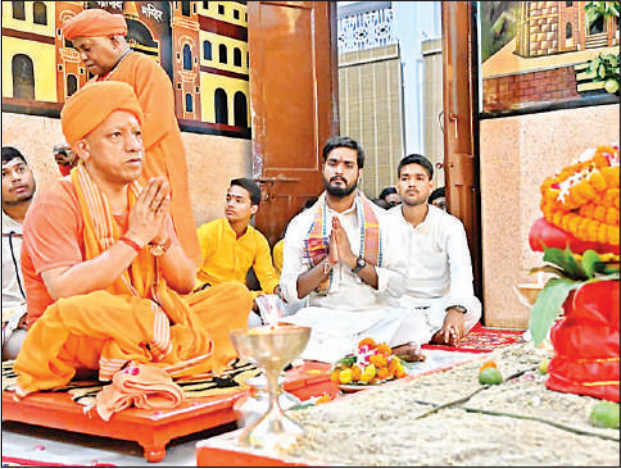
शारदीय नवरात्र के पहले दिन गोरक्षपीठ में अनुष्ठान की शुरुआत करते मुख्यमंत्री योगी।

अमृत विचार, लखनऊ : शारदीय नवरात्र के पहले दिन गोरक्षपीठ में मां जगतजननी की उपासना के विशेष अनुष्ठान की शुरुआत गोरक्षपीठाधीश्वर व मुख्यमंत्री योगी आदित्यनाथ के सानिध्य में पीठ की परंपरा के अनुसार हुआ। सोमवार सायंकाल गोरक्षपीठाधीश्वर ने मठ के प्रथम तल पर स्थित शक्तिपीठ में वैदिक मंत्रोच्चार के बीच कलश स्थापना कर प्रथम दिन मां शैलपुत्री की विधि विधान से पूजा अर्चना की। शारदीय नवरात्र प्रतिपदा का अनुष्ठान मां जगतजननी की आराधना, देवी पाठ, आरती और क्षमा प्रार्थना के साथ पूर्ण हुआ। कलश स्थापना के पूर्व गोरखनाथ मंदिर परिसर में भव्य कलश शोभायात्रा पारंपरिक तरीके और श्रद्धाभाव से निकाली गई।