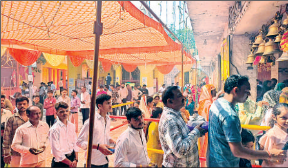
मंदिर में माता के दर्शन को लगी श्रद्धालुओं की कतार।