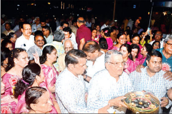
शोभायात्रा की आरती की गई।