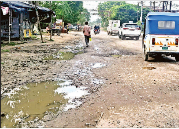
श्याम नगर में टूटी सड़क से निकलते राहगीर।

शहर में अधिकांश सड़कें टूटी हैं। कुछ खोदाई के चलते तो कुछ जलभराव के चलते उधड़ गई हैं। शासन के निर्देश पर नगर निगम ऐसी सड़कों को बनाने में जुटा है। कई सड़कों को पूरा बनाया जा रहा