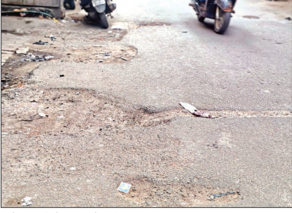
यतीमखाना में भी सड़क टूटी हुई है।