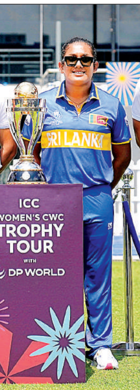
श्रीलंकाई महिला क्रिकेट कप्तान चमारी अथापथु सोमवार को कोलंबो में ट्रोफी के साथ तस्वीरें खिंचवाते हुए।