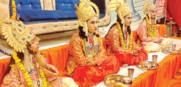
चंद्रिका देवी में लीला का मंचन हुआ।