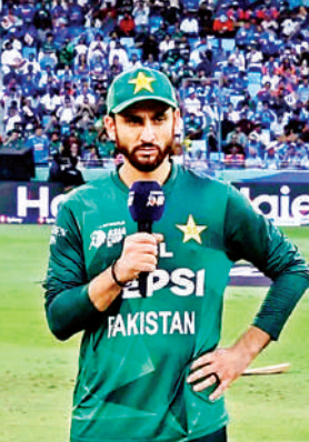
पाकिस्तान के कप्तान सलमान आगा।

दुबई : पाकिस्तानी कप्तान सलमान अली आगा ने स्वीकार किया कि उनकी टीम भारत के खिलाफ एशिया कप सुपर 4 मैच में हर विभाग में उन्नीस साबित हुई और पहले दस ओवर के बाद बल्लेबाजी करना मुश्किल हो गया था। पहले दस ओवर में 91 रन बनाने के बाद पाकिस्तान अगले दस ओवर में 80 रन ही बना सके। शिवम दुबे ने शानदार गेंदबाजी करते हुए तीन ओवर में 16 रन देकर दो विकेट लिए। आगा ने कहा बल्लेबाजी में हमने बेहतर प्रदर्शन किया जो अच्छी बात है। हमने जिस तरह से शुरूआत की थी, 15 रन और बनाने चाहिये थे लेकिन पहले दस ओवर के बाद गेंद नरम हो गई और बल्लेबाजी करना आसान नहीं रहा। उन्होंने कहा हमने पावरप्ले में अच्छी गेंदबाजी नहीं की और इसका खामियाजा भुगतना पड़ा। उन्होंने कहा आपको पर्फेक्ट मैच खेलना होता है और जीत के लिए तीनों विभाग में अच्छे प्रदर्शन की जरूरत है।