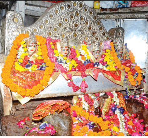
तपेश्वरी देवी को फूलों से सजाया गया।

बारादेवी मंदिर में भक्तों ने मनौती की ईंट भी देवी मां के समक्ष रखी। चंद्रिका देवी मंदिर में कमल के फूल का श्रृंगार हुआ। तपेश्वरी देवी मंदिर में भक्तों की ओर से नारियल फोड़कर मुराद मांगी। जंगली देवी मंदिर में भी नीबू व लौंग