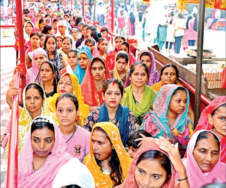
बारादेवी मंदिर में लगी भक्तों की कतार।