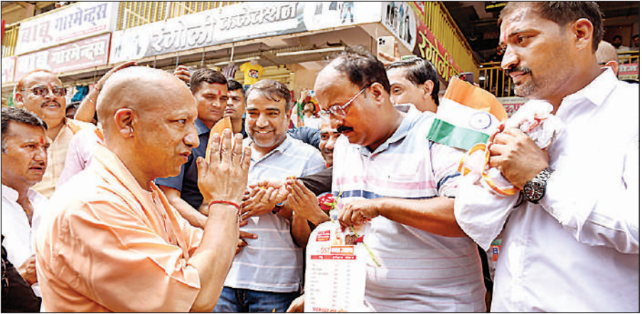
गोरखपुर में जीएसटी रिफॉर्म को लेकर व्यापारियों से मिलते मुख्यमंत्री योगी आदित्यनाथ।

मुख्यमंत्री ने झुलैलाल मंदिर से गोरखनाथ मंदिर मार्ग तक पदयात्रा की। इस दौरान वे कई प्रतिष्ठानों पर गए और कारोबारियों से संवाद