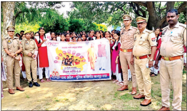
छात्राओं व शिक्षिकाओं के साथ मौजूद पुलिस अधिकारी।

मिशन शक्ति फेज 5 के शुभारम्भ पर नारी सुरक्षा, नारी सम्मान, नारी स्वावलंबन को बढ़ावा देने हेतु सरकार द्वारा जारी किए गए विभिन्न हेल्पलाइन नंबर 1090 ,1076, 1098, 112, 181 आदि के विषय में छात्राओं व शिक्षिकाओं को जानकारी दी गई।