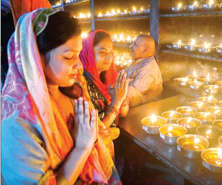
तपेश्वरी देवी मंदिर में दीपक जलाकर मनोकामना की।