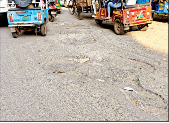
अति व्यस्त एक्सप्रेस रोड पर सड़क उधड़ गई है। गड्डे हैं और मैनहोल खुला पड़ा है। यहां पर खरीदारी के लिए प्रदेशभर से व्यापारी आते हैं।