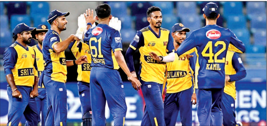
एशिया कप में एक मैच के दौरान श्रीलंका की टीम।

● हारने वाली टीम की फाइनल में पहुंचने की संभावना होगी खत्म