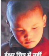
इश्वर चित्र में नहीं जय धयाल ब्लॉगर

एक बहुत बड़ा विचारक था। एक दिन वह सुबह-सुबह अपने गांव के तेली के घर तेल खरीदने गया। उसने देखा कि उसके पीछे ही तेली का कोल्हू चल रहा था। बैल की आंखों पर पट्टियां बंधी थीं और वह बैल कोल्हू को चला रहा था। कोई चलाने वाला नहीं था। उसने उस तेली से पूछा, “कोई चला नहीं रहा है, फिर भी ये बैल चल रहा है, बात क्या है?” उस तेली ने बड़े मतलब की बात कही।