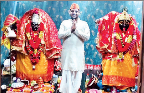
हल्द्वानी के गोलापार स्थित कालीचौड़ मंदिर |● अमृत विचार

अमृत विचार: काठगोदाम से कुछ ही दूरी पर गौलापार स्थित कालीचौड़ मंदिर न सिर्फ आस्था का प्रतीक है, बल्कि यह जगह रहस्यों और पौराणिक कथाओं से भी ओतप्रोत है। स्थानीय किंवदंती के अनुसार कभी पश्चिम बंगाल के एक भक्त को स्वप्न में मां काली के दर्शन हुए। देवी ने उसे संकेत दिया कि उनकी प्रतिमा जंगल की गहराइयों में, धरती के भीतर छिपी हुई है। भक्त ने सपने को सच्चा मानकर खोजबीन शुरू की और आश्चर्यजनक रूप से वही जगह मिली। खुदाई करने पर मां काली समेत अन्य देव प्रतिमाएं प्रकट हुईं,