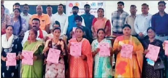
कार्यक्रम में मौजूद ब्लॉक प्रमुख, ग्राम प्रधान और अन्य। • अमृत विचार