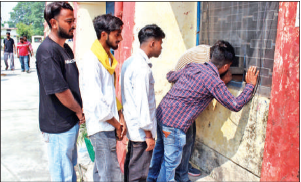
एसबीएस महाविद्यालय में नामांकन पत्र खरीदते छात्र नेता। • अमृत विचार