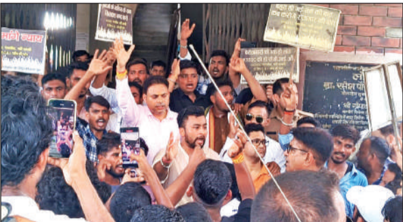
खटीमा में नारेबाजी करते कांग्रेसी और बेरोजगार युवा।

कहा कि, यदि शिक्षित युवाओं को न्याय नहीं मिला तो कांग्रेस प्रदेश व्यापी आंदोलन कर प्रदेश सरकार के खिलाफ मोर्चा खोलेगी।