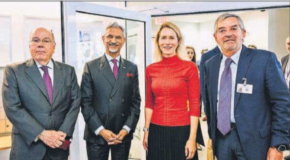
न्यूयॉर्क: यूरोपीय संघ के विदेश मामलों के उच्च प्रतिनिधि काजा क्लालास के साथ जयशंकर।

अमेरिका के विदेश मंत्री मार्को रूबियो ने विदेश मंत्री एस. जयशंकर से मुलाकात के दौरान कहा कि भारत के साथ संबंध अमेरिका के लिए अत्यंत महत्वपूर्ण हैं। उन्होंने व्यापार, रक्षा और ऊर्जा सहित द्विपक्षीय मुद्दों पर नई दिल्ली की निरंतर भागीदारी की सराहना की थी।