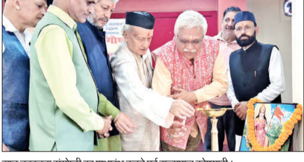
राष्ट्र नवरचना संगोष्ठी का शुभारंभ करते पूर्व राज्यपाल कोश्यारी।

नगर के एक होटल सभागार में आयोजित कार्यक्रम को संबोधित करते हुए पूर्व मुख्यमंत्री और पूर्व राज्यपाल कोश्यारी ने कहा कि उत्तराखंड में सामाजिक, आर्थिक, कृषि, उद्यान, उद्योग और पर्यटन सहित कई क्षेत्रों में व्यापक काम और विकास की आवश्यकता है। साथ ही राज्य की संस्कृति को संरक्षित कर उसे विश्व पटल पर