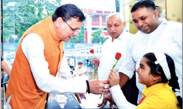
जीएसटी बचत उत्सव के दौरान एक बच्ची को फूल देते मुख्यमंत्री पुष्कर सिंह धामी।