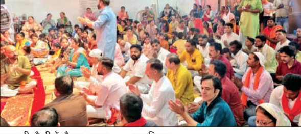
माता की चौकी में मौजूद श्रद्धालु।