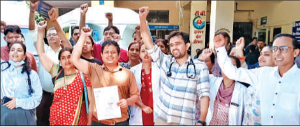
जिला चिकित्सालय में प्रदर्शन करते चिकित्सक।