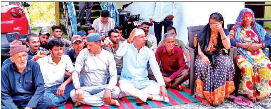
खनस्यू थाने में धरना के दौरान नारेबाजी करते लोग।