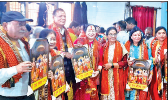
राम सेवक सभा में महिलाओं व समाजसेवियों को सम्मानित करती मुख्य अतिथि व अन्य।