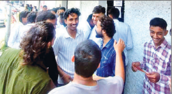
एमबीपीजी कॉलेज में नामांकन पत्र खरीदने के लिए लगी प्रत्याशियों की भीड़।