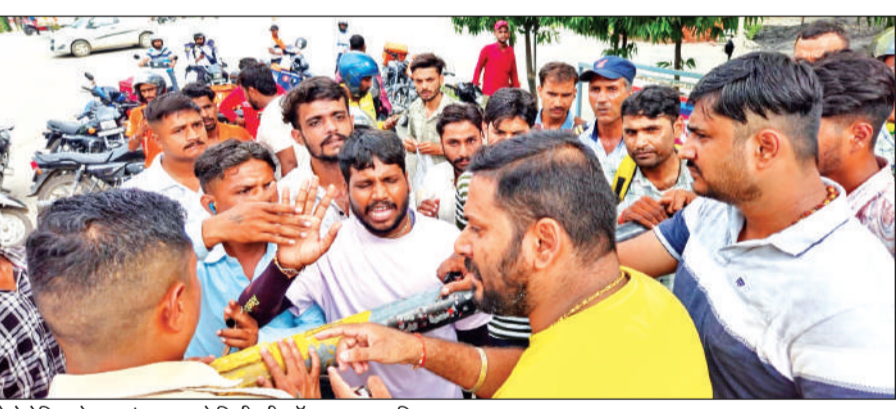
मेट्रोपोलिस गेट पर हंगामा करते डिलीवरी ब्वाँय। ● अमृत विचार

स्विगी डिलीवरी कंपनी का डिलीवरी ब्वाँय धर्मेन्द्र शहर की