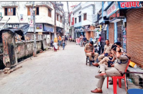
मोहल्ला अल्लूी खां में तैनात पुलिस बल।