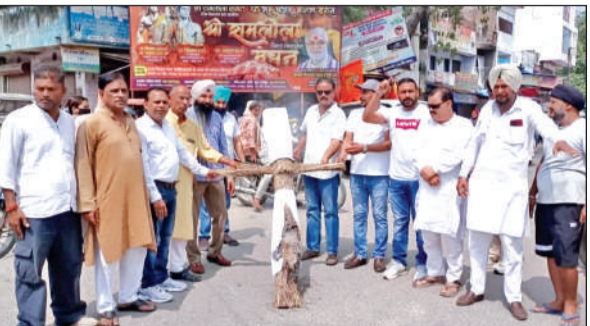
सितारगंज में प्रदेश सरकार का पुतला फूँकते कांग्रेस कार्यकर्ता।