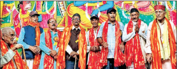
शक्तिधर्म में रामलीला मंचन से पूर्व मंच पर मौजूद सम्मानित वरिष्ठजन ।

खटीमा : सनातन श्री रामलीला पात्र परिषद द्वारा रामलीला मंचन के दूसरे और नवरात्रि के प्रथम