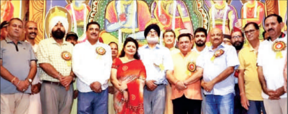
काशीपुर में पर्वतीय रामलीला मंचन के शुभारंभ पर मौजूद अतिथि ।