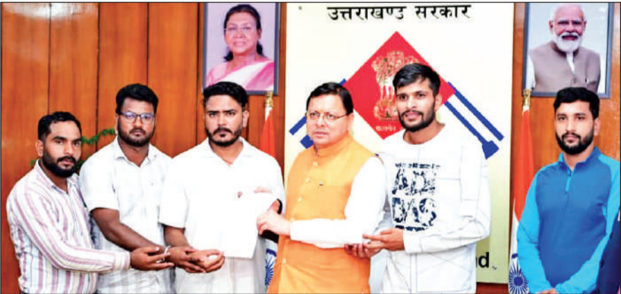
मुख्यमंत्री पुष्कर सिंह धामी को झापन सौंपते प्रतिनिधिमंडल के सदस्य।