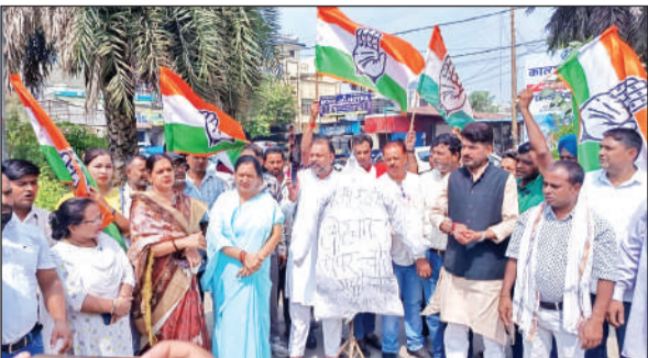
रुद्रपुर में प्रदर्शन के दौरान पुतला दहन करते कांग्रेसी।

आरोप था कि इससे पहले भी भर्ती परीक्षा लीक होने के मामले सामने आ चुके हैं जिससे युवाओं का भविष्य अंधकारमय होता जा रहा है जिसे बर्दाश्त नहीं किया जाएगा। उन्होंने चेतावनी देते हुए