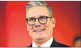
● ब्रिटेन में भारतीय मूल की मंत्री सीमा मल्होत्रा ने किया स्वीकार

ब्रिटेन के प्रधानमंत्री केअर स्टार्मर को घनिष्ठ द्विपक्षीय संबंधों को बढ़ावा देने और भारत-ब्रिटेन मुक्त व्यापार समझौते को अंतिम रूप देने में उनकी भूमिका के लिए 'लिविंग ब्रिज' सम्मान से सम्मानित किया गया है।