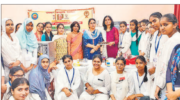
कार्यशाला में उपस्थित शिक्षिकाएं व छात्राएं।