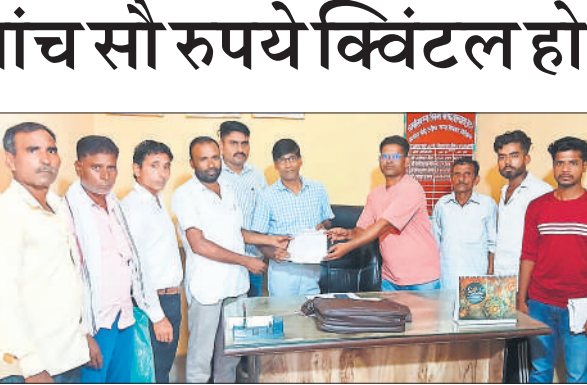
गन्ना विकास निरीक्षक को ज्ञापन देते अभा किसान मजदूर सभा के कार्यकर्ता।

कहा कि यह बाजार कोतवाली से लेकर शगुन तिराहा तथा बड़ाबाजार रामलीला रोड तक फैल जाता है, जिससे भारी परेशानी होती है। बाजार के कारण यातायात बाधित होता है और कई बार सुरक्षा व्यवस्था पर भी असर पड़ता है। अधिशासी अधिकारी ने कहा कि किसी भी निर्णय से पूर्व आसपास के दुकानदारों और