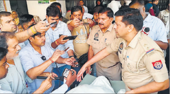
अध्यापिका को अस्पताल लेकर पहुंची पुलिस।