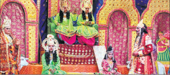
बबराला में रामलीला मंचन करते कलाकार।

मंचन की शुरुआत राजा दशरथ के अश्वमेध यज्ञ के प्रसंग से हुई। इसके बाद श्रृंगार, मंगल गीत और शंखनाद के बीच भगवान श्रीराम जन्म का मंचन किया गया। मंचन में दिखाया गया कि महाराज दशरथ ने श्रृंगी ऋषि से पुत्रकामेष्टि यज्ञ करवाया। यज्ञ से प्रकट अग्निदेव ने खीर प्रदान की, जिसे तीनों रानियों में बांटा गया। चैत्र शुक्ल नवमी को पुनर्वसु नक्षत्र में कौशल्य के गर्भ से भगवान श्रीराम का अवतरण हुआ। साथ ही सीता, लक्ष्मण, भरत और शत्रुघ्न के जन्म के दृश्य भी मंचित किए गए, जिससे पूरा पंडाल धार्मिक वातावरण में सराबोर हो गया। बक्तों ने सामूहिक नृत्य कर श्रीराम जन्मोत्सव की खुशियां मनाई।