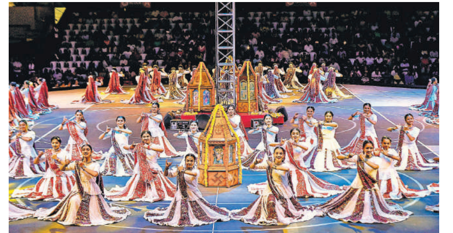
मां दुर्गा की उपासना के लिए नौ दिवसीय नवरात्र शुरु होने के साथ गुजरात के शहरों में गरबा की धूम शुरु हो गई है। नवरात्र उत्सव के पहले दिन सोमवार की रात राजकोट में गरबा करती महिलाएं।