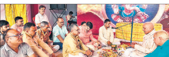
रामलीला महोत्सव में पूजन करते कमेटी के लोग।