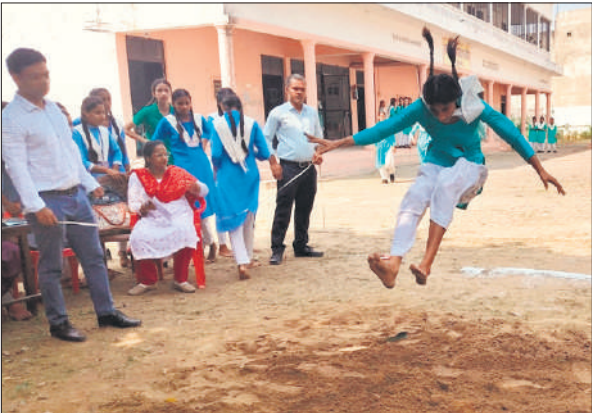
संकुल खेलकूद प्रतियोगिता में लंबी कूद में भाग लेती छात्रा।