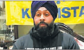
● निज्जर की हत्या के बाद संभाली थी जनमत संग्रह की कमान