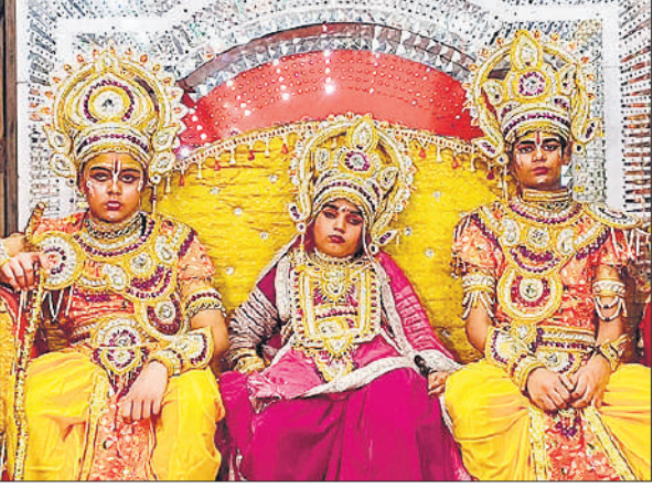
सिंहासन पर विराजे भगवान श्री राम, सीता व लक्ष्मण।

काली मंदिर से निकली श्री राम बरात में सबसे आगे गणेश भगवान की झांकी थी। संतोषी क्लब, अवंतिका नाथ महाकाल की झांकियां आकर्षण का केंद्र रहीं। जगन्नाथ जी के रथ को नगर वासी नंगे पैर खींच रहे थे। नरसिंह भगवान का विराट रूप सभी को अपनी ओर आकर्षित कर रहा था। हनुमान जी, खाटू श्याम की झांकी भी मोहित कर रही थी। अंत में भगवान राम, सीता, लक्ष्मण के