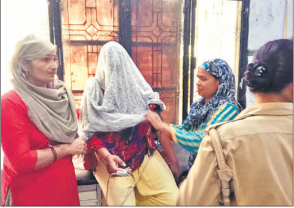
जिला अस्पताल में झुलसी अध्यापिका।