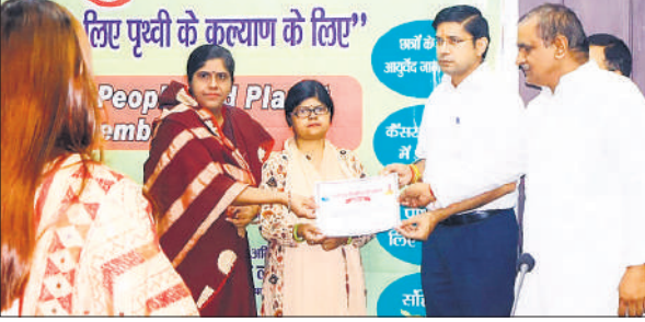
शिक्षिका को सम्मानित करते डीएम व जिला पंचायत अध्यक्ष।