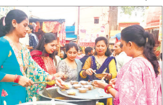
भक्तों को प्रसाद वितरित करती महिलाएं।