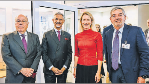
न्यूयॉर्क: यूरोपीय संघ के विदेश मामलों के उच्च प्रतिनिधि काजा क्लॉल्स के साथ जयशंकर।

रूबियो ने संयुक्त राष्ट्र महासभा के उच्च स्तरीय 80वें सत्र के इतर सोमवार सुबह यहां जयशंकर से मुलाकात की। विदेश विभाग द्वारा बैठक के विवरण में कहा गया है कि रूबियो ने दोहराया कि भारत के साथ संबंध अमेरिका के लिए अत्यंत महत्वपूर्ण हैं और उन्होंने व्यापार, रक्षा, ऊर्जा, फार्मास्यूटिकल्स, महत्वपूर्ण खनिजों तथा द्विपक्षीय संबंधों से संबंधित अन्य मुद्दों सहित