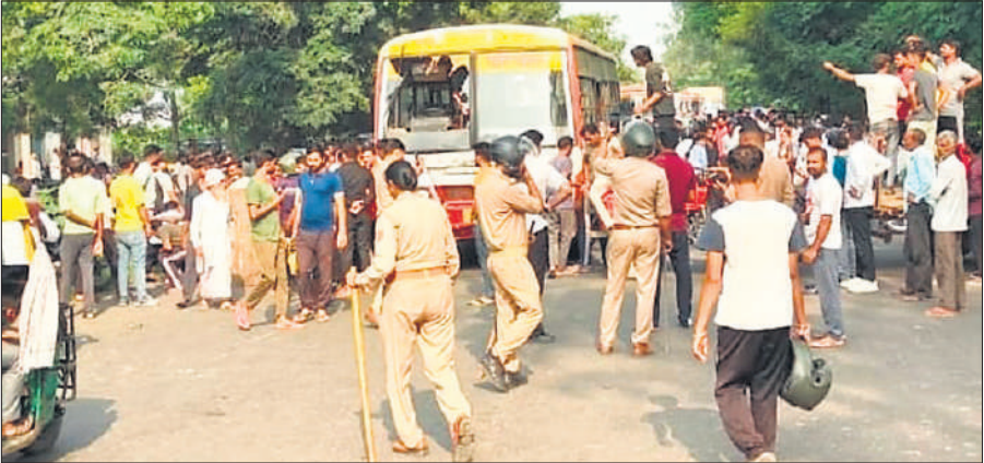
बस में तोड़फोड़ कर आक्रोश व्यक्त करते लोग।