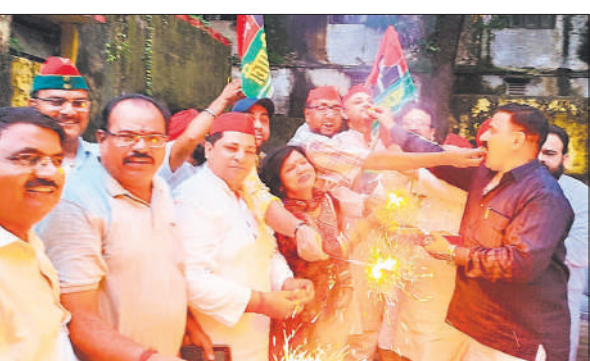
आतिशबाजी करते सपा कार्यकर्ता ।

होगा। हालांकि, पान मसाला, गुटखा और लम्जरी गाड़ियों पर 40 प्रतिशत टैक्स लागू रहेगा। उन्होंने कहा कि इस संशोधन से राजस्व संग्रह में भी वृद्धि होगी। वर्ष 2017 में जहां