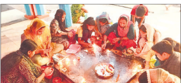
पूजा अर्चना करती श्रद्धालु।