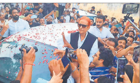
घर पहुंचनेपर आजम खां पर फूल बरसाकर स्वागत करते कार्यकर्ता ।

रामपुर जिले में प्रवेश करते ही मिलक, धमोरा, शहजादनगर सहित शहर में स्वागत हुआ। शाम 6:20 बजे रामपुर के घेर मीरबाज खां टंकी पांच स्थित आवास पर पहुंचे तो समर्थकों ने फूल बरसाकर स्वागत किया। 23 माह से सीतापुर जेल में बंद सपा नेता आजम खां मंगलवार दोपहर को सीतापुर जेल से जमानत पर रिहा होने के वह कार से परिजनों और समर्थकों के साथ रवाना हुए थे। शाम को साढ़े चार बजे रामपुर सीमा में प्रवेश करने के बाद उनके समर्थकों ने कई जगह स्वागत किया। घर पहुंचते ही आजम खां जिंदाबाद और आजम खां संघर्ष करो, हम तुम्हारे साथ नारे लगाए। उसके बाद आजम खां ने हाथ हिलाकर