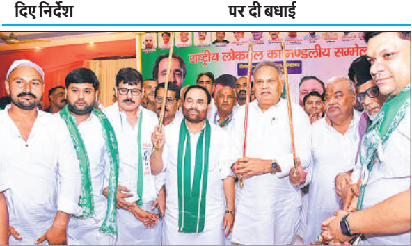
मंडलीय अधिवेशन में अतिथियों को तलवार देकर सम्मानित करते कार्यकर्ता ।

● रालोद के राष्ट्रीय महासचिव संगठन ने मंडलीय सम्मेलन में दिए निर्देश