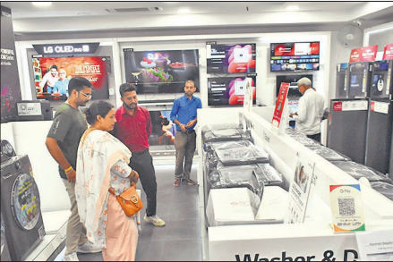
सिविल लाईंस में इलेक्ट्रॉनिक्स शोरूम पर खरीदारी करते लोग।

वाहन, कपड़ा, किराना, इलेक्ट्रिक समेत अन्य बाजार गुलजार नजर आ रहे हैं। हालांकि व्यापारी जीएसटी रिफार्म का असर तीन माह बाद तक नजर आने की बात कर रहे हैं। कारोबारियों के अनुसार जिले में हर साल होने वाले सप्ती कारोबार में जीएसटी की नई दरें लागू होने के बाद ही संभव हो सकेगा।