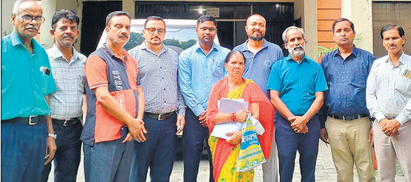
क्षेत्रीय उच्च शिक्षा अधिकारी कार्यालय में ज्ञापन देने पहुंचे पदाधिकारी।