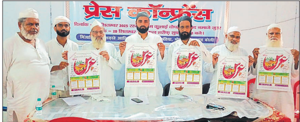
उर्स ए सकलैनी का पोस्टर जारी करते पदाधिकारी।