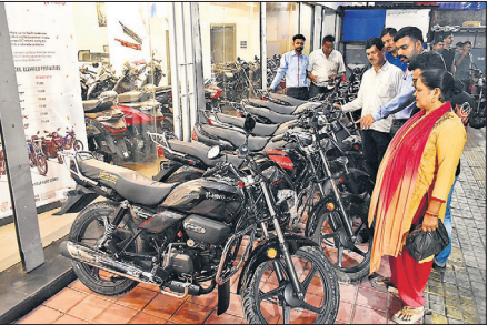
सिविल लाईंस में बाइक शोरूम में ग्राहक।