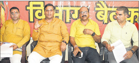
प्रेसवार्ता करते विश्व हिंदू परिषद के पदाधिकारी।