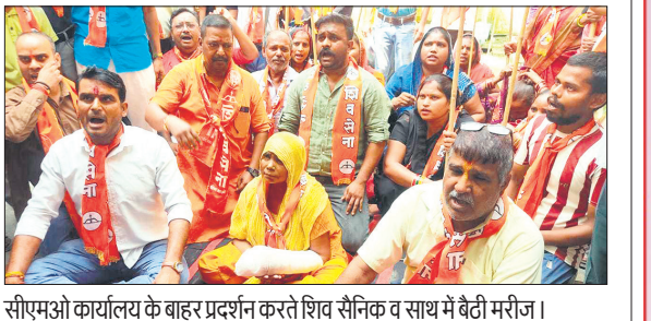
सीएमओ कार्यालय के बाहर प्रदर्शन करते शिव सैनिक व साथ में बैठी मरीज।