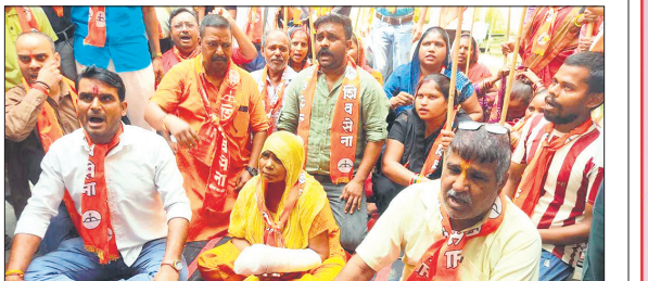
सीएमओ कार्यालय के बाहर प्रदर्शन करते शिव सैनिक व साथ में बैठी मरीज।