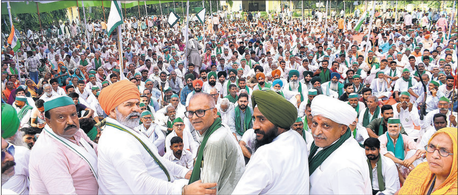
नेहरू युवा केंद्र में महापंचायत में भारतीय किसान यूनियन के राष्ट्रीय प्रवक्ता राकेश टिकैत और अन्य पदाधिकारी।

कांग्रेस नेता राहुल गांधी के वोट चोरी वाले बयान का टिकैत ने समर्थन किया। कहा वोट चोरी नई बात नहीं है, इसकी शुरुआत 2013 में बिहार से हुई थी। इसके