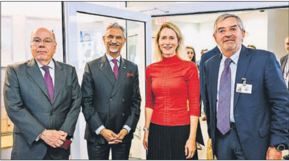
न्यूयॉर्क: यूरोपीय संघ के विदेश मामलों के उच्च प्रतिनिधि काजा क्ल्लास के साथ जयशंकर।

रूबियो ने संयुक्त राष्ट्र महासभा के उच्च स्तरीय 80वें सत्र के इतर सोमवार सुबह यहां जयशंकर से मुलाकात की। विदेश विभाग द्वारा बैठक के विवरण में कहा गया है कि रूबियो ने दोहराया कि भारत के साथ संबंध अमेरिका के लिए अत्यंत महत्वपूर्ण हैं और उन्होंने व्यापार, रक्षा, ऊर्जा, फार्मास्यूटिकल्स, महत्वपूर्ण खनिजों तथा द्विपक्षीय संबंधों से संबंधित अन्य मुद्दों सहित