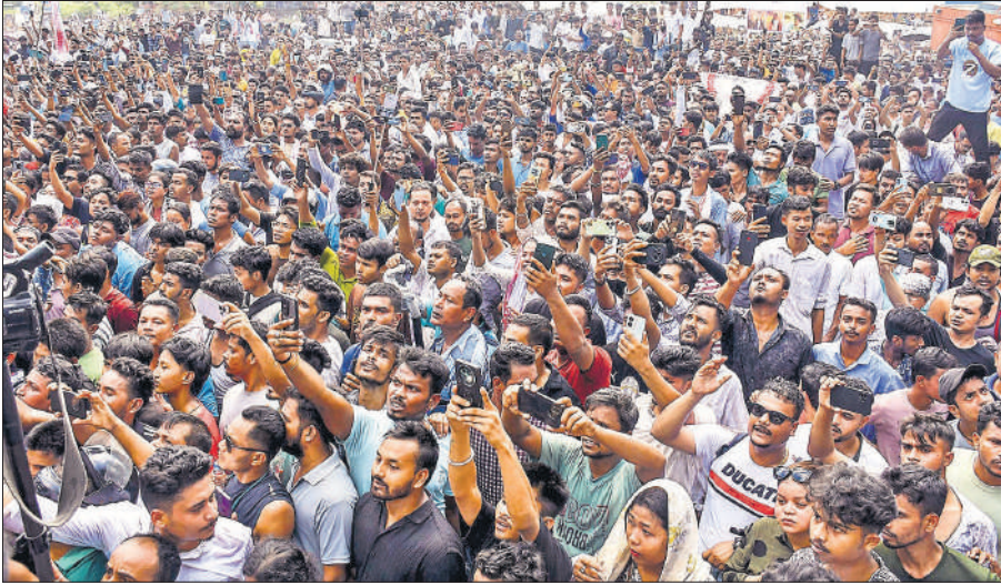
अपने प्रिय गायक जुबिन गर्ग को अंतिम विदाई देने के लिए इकट्ठे हुए प्रशंसक।