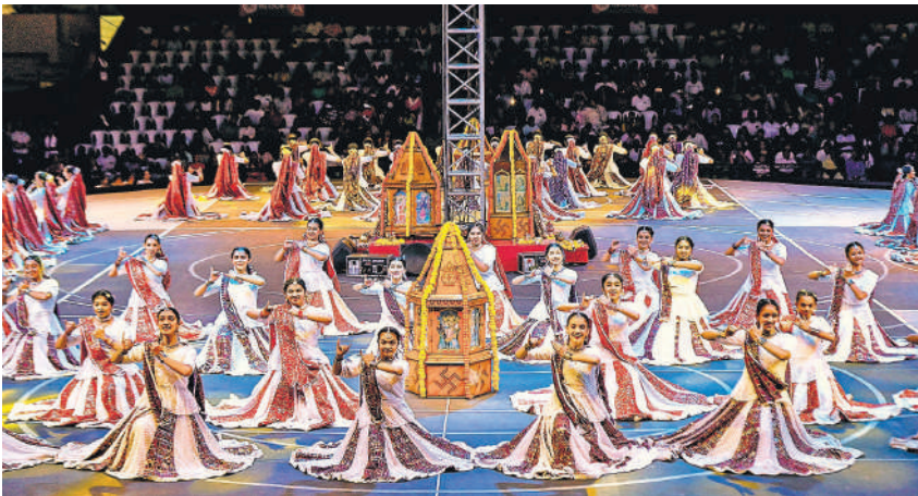
मां दुर्गा की उपासना के लिए नौ दिवसीय नवरात्र शुरु होने के साथ गुजरात के शहरों में गरबा की धूम शुरु हो गई है। नवरात्र उत्सव के पहले दिन सोमवार की रात राजकोट में गरबा करती महिलाएं।