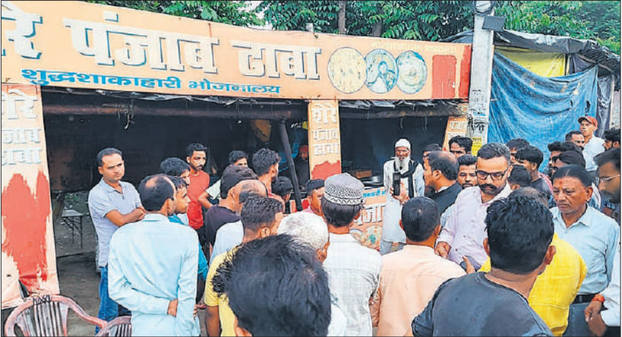
नैनीताल रोड पर मेडिकल कॉलेज के पास स्थित ढाबे पर हंगामे के दौरान मौजूद भीड़

बजरंग दल की टीम ने किया नाशता, बार कोड से पेमेंट किया तो असली नाम आया, संचालक हिरासत में