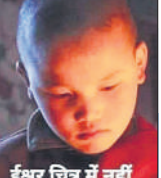
इंशुर चित्र में नहीं जय धयाल ब्लॉगर

एक बहुत बड़ा विचारक था। एक दिन वह सुबह-सुबह अपने गांव के तेली के घर तेल खरीदने गया। उसने देखा कि उसके पीछे ही तेली का कोल्हू चल रहा था। बैल की आंखों पर पट्टियां बंधी थीं और वह बैल कोल्हू को चला रहा था। कोई चलाने वाला नहीं था। उसने उस तेली से पूछा, “कोई चला नहीं रहा है, फिर भी ये बैल चल रहा है, बात क्या है?” उस तेली ने बड़े मतलब की बात कही।