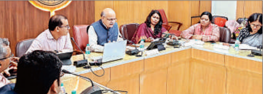
नीति आयोग की बैठक में अधिकारियों से चर्चा करते सीईओ बीवीआर सुब्रमण्यम।

अमृत विचार: नीति आयोग के मुख्य कार्यकारी अधिकारी (सीईओ) बीवीआर सुब्रमण्यम की अध्यक्षता में मंगलवार को योजना भवन ‘उत्तर प्रदेश @ 2047 विजन डॉक्युमेंट’ की समीक्षा बैठक हुई। इसमें दस्तावेज़ के निर्माण की वर्तमान प्रगति और भावी रणनीति पर विस्तृत चर्चा हुई। निर्णय लिया गया कि मुख्य सचिव की अध्यक्षता में एक हाई पावर कमेटी बनाई जाए जो कि इस विजन डॉक्युमेंट को रिव्यू करेगी। बैठक में नीति आयोग के सीईओ सुब्रमण्यम के समक्ष विजन डॉक्युमेंट के निर्माण प्रक्रिया का प्रस्तुतीकरण किया गया। उन्होंने एक संगठित और समन्वित कार्ययोजना का प्रस्ताव रखा तथा कार्यक्षमता बढ़ाने के लिए एक संयुक्त टीम के गठन का सुझाव दिया। इस टीम में क्षेत्रीय एवं सेक्टर विशेषज्ञ, नीति आयोग के प्रतिनिधि तथा राज्य योजना विभाग के सदस्य शामिल होंगे, जिससे नीति-निर्माण में समन्वय मजबूत