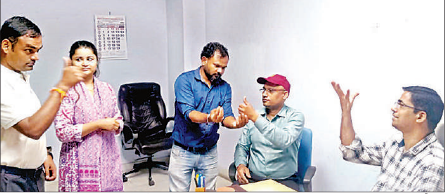
कार्यशाला के दौरान सांकेतिक भाषा बताते विशेषज्ञ।

अमृत विचार: डॉ. शकुंतला मिश्रा राष्ट्रीय पुनर्वास विश्वविद्यालय में अंतर्राष्ट्रीय सांकेतिक भाषा दिवस बधिर शिक्षकों और श्रवण बाधितार्थ मनाया गया। इस अवसर पर श्रवण बाधितार्थ विभाग के अंतर्गत संचालित पीडीसीडी पाठ्यक्रम के सभी शिक्षकों ने मिलकर सांकेतिक भाषा के महत्व और उपयोग के प्रति जागरूकता फैलाने हेतु विभिन्न कार्यक्रम आयोजित किए। सभी विभागों और प्रशासनिक कार्यालयों में कार्यरत स्टाफ को कार्यालयी कार्यों में प्रयुक्त होने वाली बुनियादी सांकेतिक भाषा सिखाई गई। जिससे वे श्रवण बाधित विद्यार्थी एवं व्यक्ति्यों के साथ बेहतर संवाद स्थापित कर सकें।