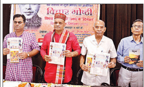
विचार संगोष्ठी में दिनकर पंपलेट का विमोचन करते लोग।