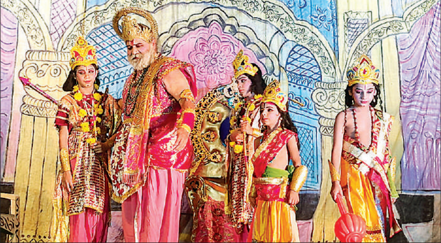
रामलीला का मंचन करते कलाकारों ने दर्शकों को मंत्रमुग्ध कर दिया। लोग अपलक निहारते रहे अपने अराध्य को।

अमृत विचार: श्री ऐशबाग रामलीला समिति के तत्वावधान में चल रही भव्य रामलीला के मंच पर मंगलवार को भगवान श्रीराम के जन्म से लेकर अहिल्या उद्धार तक की कथा का मंचन किया गया। रामलीला की शुरुआत अयोध्या नरेश दशरथ द्वारा पुत्रकामेष्टि यज्ञ से हुआ, जिसके फलस्वरूप माता कौशल्या को श्रीराम, कैकेई को भरत और सुमित्रा को लक्ष्मण व शत्रुघ्न की प्राप्ति होती है। इसके पश्चात श्रीराम की बाल लीलाओं का मार्मिक मंचन हुआ, जिसे देखकर दर्शक भावविभोर हो उठे। गुरु वशिष्ठ से शिक्षा ग्रहण कर श्रीराम, लक्ष्मण के साथ ऋषि