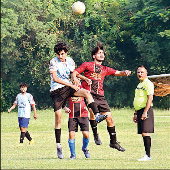
फुटबॉल पर कब्जे का प्रयास करते खिलाड़ी।