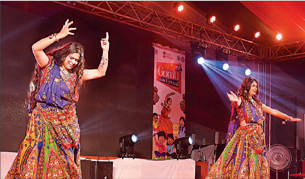
लखनऊ विश्वविद्यालय में चल रहे गोमती पुस्तक मेले का उत्साह सांस्कृतिक कार्यक्रमों ने बढ़ा दिया है। शाम को होने वाले इन कार्यक्रमों में छात्र-छात्राओं के अलावा शहर के लोगों की भीड़ उमड़ रही है। मंगलवार को सांस्कृतिक मंच पर नृत्य करती कलाकारों के साथ युवाओं ने भी खूब कदमताल किया।