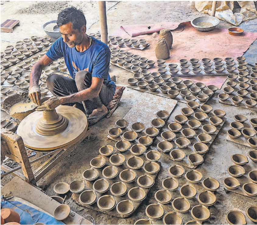
हरियाणा के गुप्तगम में मंगलवार को दीपावाली से पहले एक कुम्हार मिट्टी के दीये बनाता हुआ।