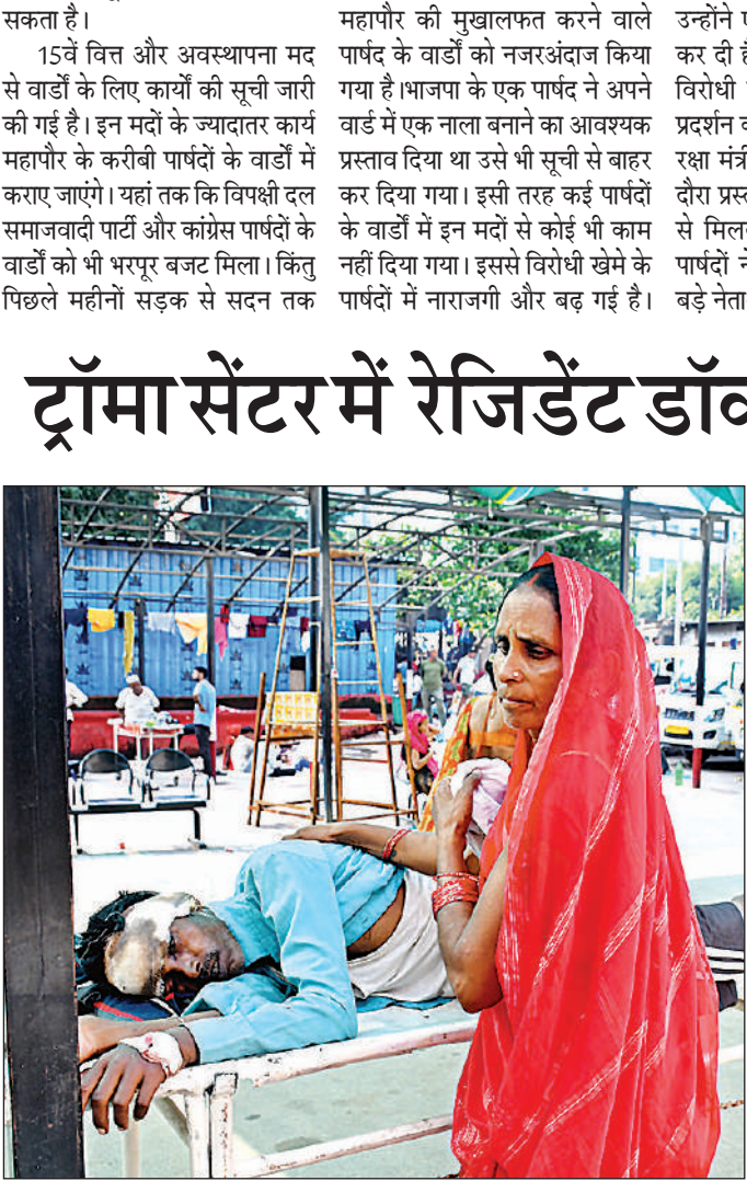
द्रामा सेंटर में रात भर चले हंगामे के कारण मरीजों में ऊहापोह की स्थित रही। सुबह स्थिति सामान्य होने पर स्टूडर पर लेटे मरीज के पास तसल्ली से खड़ी महिला तीमारदार। अमृत विचार

25-30 ई वाउचर जनरेट किए जाते हैं। एक अनुमान के मुताबिक, हर सत्र में करीब 500 ई-वाउचर गर्भवती को वितरित किए जाते हैं। ई वाउचर 30 दिन तक ही वैध होता है। बजट न होने से सितंबर माह में किसी भी सत्र में ई-वाउचर जनरेट नहीं हो पा रहे हैं। ऐसे में गर्भवतियों को दूसरे सरकारी अस्पतालों में रेफर किया जा रहा है। वहां पर पहले से ही अल्ट्रासाउंड की भीड़ है। नतीजा गर्भवती निजी केंद्रों पर शुल्क देकर जांच करवाने को मजबूर हैं। सीएमओ डॉ. एनबी सिंह ने कहा कि निजी केंद्रों से मुफ्त अल्ट्रासाउंड के लिए सीएचसी से मिलने वाले ई-वाउचर जनरेट होने में कुछ दिक्कत बानी हुई है। समस्या का समाधान करने की कोशिश की जा रही है।