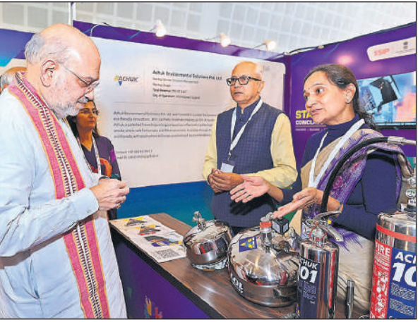
स्टार्टअप कॉन्क्लेव के उद्घाटन अवसर पर गृह मंत्री शाह।

शाह ने कहा, 2014 में हमारे पास सिर्फ 500 स्टार्टअप थे। आज हमारे पास डीपीआईआईटी (उद्योग एवं अंतरिक व्यापार संवर्धन विभाग)