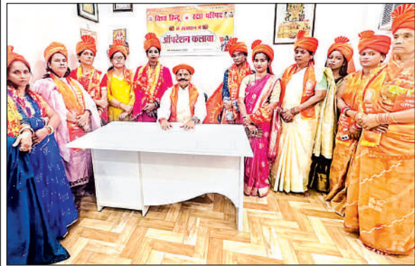
ऑपरेशन कलावा की शुरुआत के मौके पर राष्ट्रीय अध्यक्ष गोपाल राय व महिलाएं।