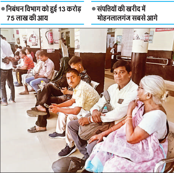
कैसरबाग स्थित निबंधन कार्यालय में रजिस्ट्री कराने का इंतजार करते लोग।

अमृत विचार : आवासीय व व्यावसायिक क्षेत्र में मोहनलालगंज तेजी से आगे बढ़ा है। ज्यादातर लोगों को मकान और कारोबार बनाने के लिए क्षेत्र पसंद आ रहा है। इससे संपत्तियों की खरीद-फरोद बढ़ी है। नवरात्र के दूसरे दिन सबसे ज्यादा रजिस्ट्री मोहनलालगंज में कराई गई। अन्य की संख्या कम रही। नवरात्र के दूसरे दिन सभी 9 निबंधन कार्यालय में 940 बैनामे हुए। इससे विभाग को 13.75 करोड़ की आय हुई। सबसे ज्यादा मोहनलालगंज में आवासीय, व्यावसायिक व कृषि क्षेत्र की 181 रजिस्ट्री कराई गई। कुल 1,85,02,630 के स्टॉप की बिक्री हुई। अन्य आठ निबंधन कार्यालय की संख्या कम रही। इस बार सरोजनी नगर भी संपत्तियों की खरीद और बैनामे में पीछे रहा।