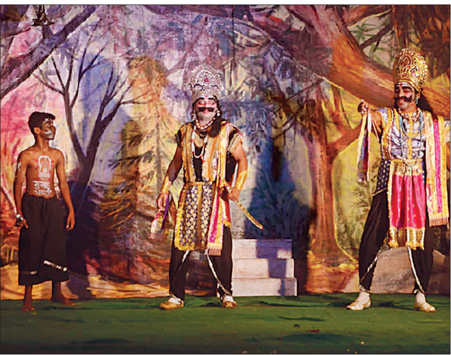
रेलवे रामलीला दशहरा कमेटी द्वारा आयोजित रामलीला का मंचन करते कलाकार।