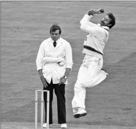
टेस्ट अंपायर हेरोल्ड डिकी बर्ड। (फाइल फोटो)

जीतने के दौरान ब्रिट्स ने लगातार दो नाबाद शतक जड़े और 15 स्थान के फायदे से छठे पायदान पर पहुंच गईं। ब्रिट्स का 2025 में औसत 91.85 है और उन्होंने इस दौरान वनडे मुकाबलों में 94.14 के स्ट्राइक रेट से 643 रन बनाए हैं। सितंबर 2023 की शुरुआत में 73वें स्थान पर रहने वाली दक्षिण अफ्रीका की इस बल्लेबाज ने शानदार सुधार किया है। इस बीच पाकिस्तान की सिदरा अमीन ने भी 10 स्थान की छलांग लगाई है। उन्होंने तीन मैच में नाबाद 121, 122 और नाबाद 50 रन बनाए। अमीन के 636 अंक हो गए हैं जो दाएं हाथ की इस बल्लेबाज के करियर के सर्वोच्च रेटिंग अंक हैं। वह अब 13वें स्थान पर है और शीर्ष 10 में जगह बनाने से सिर्फ 19 अंक पीछे हैं।