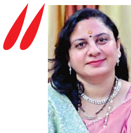
लेखिका: डॉ. निशा शर्मा