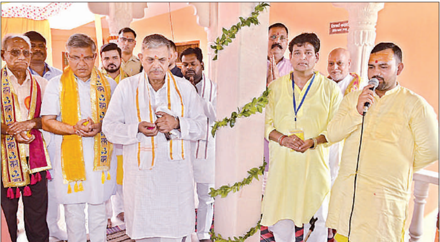
भगवान लक्ष्मी नारायण मंदिर का लोकार्पण करते राष्ट्रीय स्वयंसेवक संघ(आरएसएस) के सर कार्यवाह दत्तात्रेय होसबोले।

अमृत विचार: बाराबंकी जिले के बरेठी स्थित भगवान लक्ष्मी नारायण मंदिर का लोकार्पण मंगलवार को राष्ट्रीय स्वयंसेवक संघ(आरएसएस) के सर कार्यवाह दत्तात्रेय होसबोले द्वारा वैदिक मंत्रोच्चार के बीच संपन्न हुआ। समारोह में वैदिक रीति से पूजा-अर्चना कर मंदिर को विधिवत जनसामान्य के लिए खोल दिया गया। इस अवसर पर होसबोले ने कहा कि मंदिर केवल पूजा उपासना का ही स्थान नहीं, बल्कि सांस्कृतिक चेतना का ऊर्जा केंद्र भी होते हैं। भगवान सर्वत्र विद्यमान हैं, लेकिन मंदिर में जाकर उनकी उपस्थिति का प्रत्यक्ष अनुभव होता है। सनातन धर्म केवल कर्मकांड और पूजा-पाठ के बारे में ही नहीं, बल्कि यह मनुष्य में ईश्वर को देखने, अच्छे आचरण व समाज के कल्याण के बारे में भी काफी कुछ बताता है। इससे पहले कार्यक्रम में मंदिर की आधिकारिक वेबसाइट का