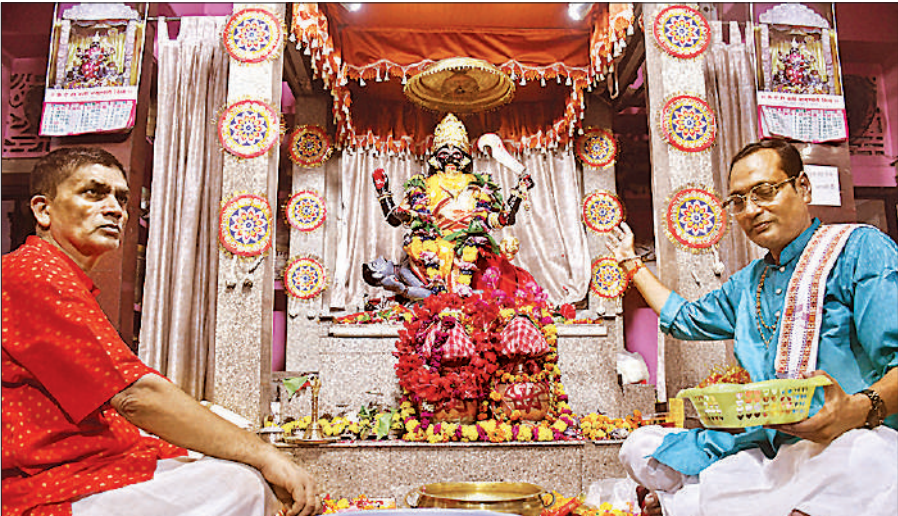
शारदीय नवरात्र पर कैसरबाग क्षेत्र के वसियारी मंडी स्थित काली मां की पूजा करते पुजारी।

मां ब्रह्मचारिणी का स्वरूप और महत्व : देवी ब्रह्मचारिणी को एक तपस्विनी के रूप में जाना जाता है। उनके हाथों में जपमाला और कमंडल रहता है। वह संयम, त्याग, तपस्या और