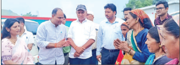
चम्पावत जिले के दूरस्थ गांव मथियाबांज में महिलाओं की समस्याएं सुनते डीएम।