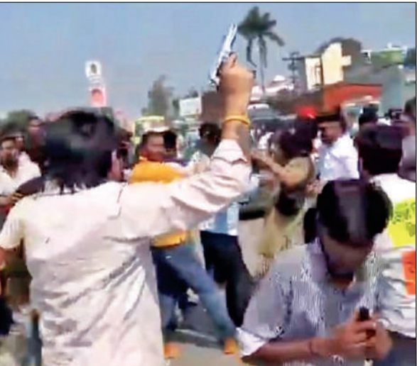
वारदात के दौरान खुलेआम पिस्टल लहराता युवक।