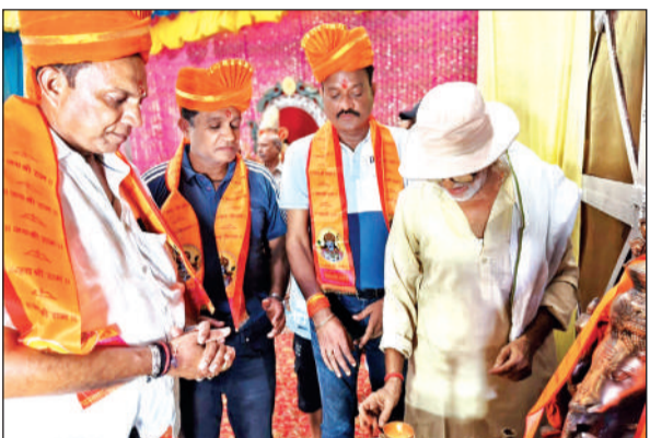
किच्छा में रामलीला मंचन में भगवान श्री गणेश की आरती करते अतिथि।