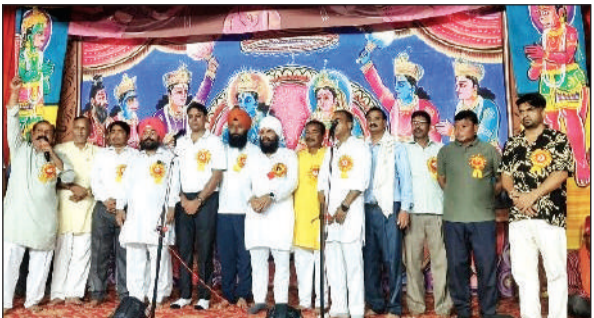
नानकमत्ता में रामलीला का शुभारंभ करते अतिथि। ● अमृत विचार

वे हरियाणा के थाना यमुना नगर में अपनी व परिवार की उपस्थिति दर्ज कराएंगे, उसके बाद एसएचओ यमुनानगर उन्हें व उनके परिजनों को सुरक्षा देंगे और उसके बाद शादी होगी। शादी के दौरान कोई व्यवधान न हो, उस समय यि उनको सुरक्षा दी जाए।