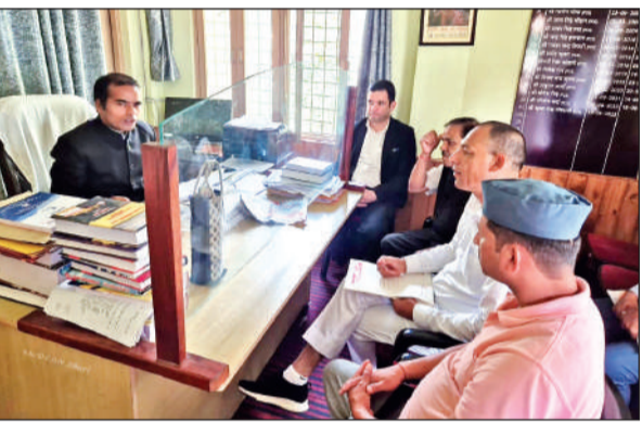
उपजिलाधिकारी धारी को ज्ञापन सौंपते भीमताल के लोग। ● अमृत विचार

की बढ़ोतरी हुई है। एक वर्ष पहले तक शनिवार के दिन सैलानी पहुंचा करते थे, जो अब शुक्रवार को आने लगे हैं। इसकी वजह नगर में बढ़ती वाहनों की भारी भीड़ है। अब सैलानी शुक्रवार रात तक नगर में आते हैं और रविवार को शहरों को वापस लौटते हैं।