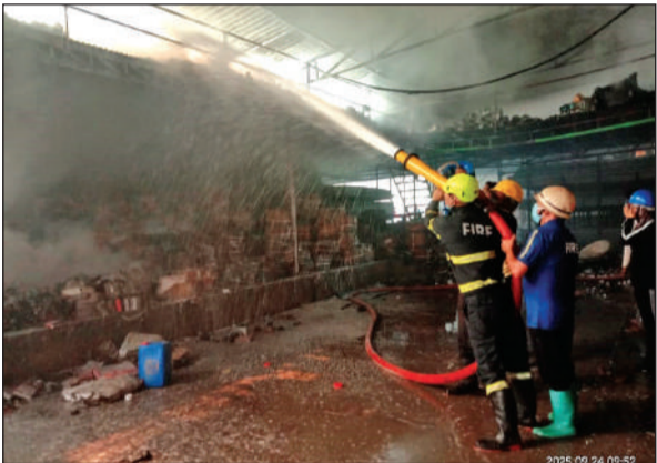
आग बुझाते दमकल कर्मी।