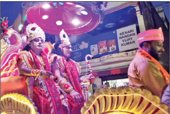
दिनेशपुर में निकली श्री राम बारात। ● अमृत विचार

वे भी उनकी शादी के लिए मंजूर हो गए हैं। कोर्ट ने युवती की माता से भी पूछा कि आपको इनकी शादी से कोई एतराज तो नहीं तो उनके द्वारा कहा गया कि पहले था, अब नहीं। अब इसकी खुशी में हमारी खुशी है। कोर्ट ने युवक को हमाा कि शादी करने से एक दिन पहले