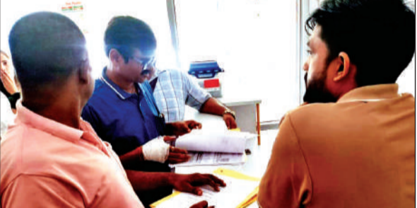
बाजपुर के केलाखेड़ा में अस्पताल में जांच करती संयुक्त टीम।