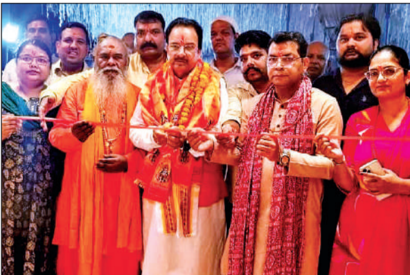
रुद्रपुर में श्री रामलीला का शुभारंभ करते सांसद, विधायक और अन्य।

अमृत विचार: हाईकोर्ट ने प्रेमी प्रसंग के मामले में युवती को उसके परिजनों द्वारा नजरबंद करने संबंधी ऊ्द्यमसिंह नगर निवासी युवक की याचिका पर सुनवाई करते हुए हरियाणा पुलिस को पुलिस सुरक्षा में विवाह कराने के निर्देश दिए हैं। सुनवाई के दौरान युवती को हरियाणा पुलिस द्वारा वीडियो कॉन्फ्रेंसिंग के माध्यम से कोर्ट में पेश किया गया और युवक कोर्ट में व्यक्तिगत रूप से पेश हुआ। कोर्ट ने युवती से पूछा कि क्या वह अपनी पसंद से इसी युवक के साथ शादी करना चाहती है तो युवती ने बयान दिया कि वह करना चाहती है लेकिन उसका प्रेमी उसे वहां से