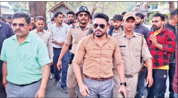
नैनीताल में अभियान चलाते प्रशासनिक अधिकारी।

इस दौरान बताया कि भीमताल विधान सभा के काशतकारों को फल और सब्जी का उचित दाम नहीं मिल पा रहा है। इससे उन्हें आर्थिक क्षति हो रही है। उन्होंने भीमताल विधानसभा में क्षतिग्रस्त हुए मोटर मार्गों की मरम्मत की मांग के साथ ही आपदा के दौरान