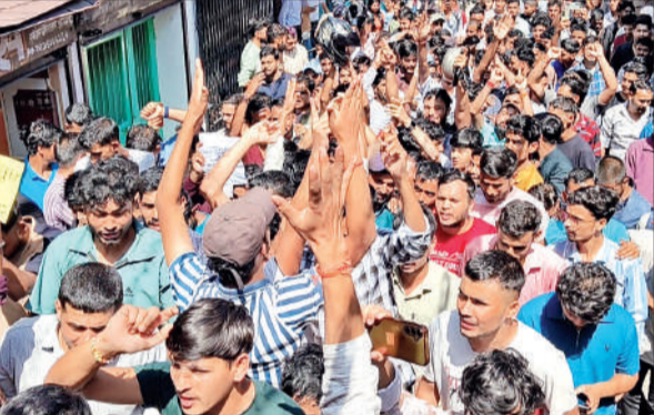
अल्मोड़ा में पेपर लीक मामले में रैली निकालते युवा।

इस दौरान बड़ी संख्या में गांधी पार्क पहुंचे बेरोजगारों ने शहर में विरोध रैली निकाल सीबीआई जांच और परीक्षा को निरस्त करने की मांग उठाई। गांधी पार्क में सुबह 10 बजे युवा बेरोजगार जुटने शुरू हुए। यहां आम सभा में युवाओं ने सरकार के खिलाफ जमकर नारेबाजी की।