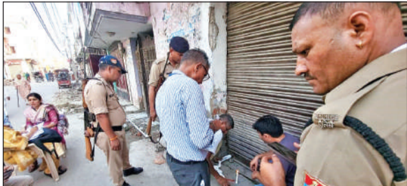
काशीपुर में एक मेडिकल स्टोर सील करती टीम।