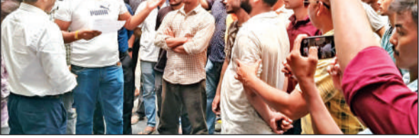
पेपर लीक प्रकरण पर विरोध जताते बेरोजगार युवा। ● अमृत विचार

काशीपुर : ऊर्जा निगम की टीम ने बुधवार को मोहल्ला अल्ली खां में 350 स्मार्ट मीटर लगाए। इस दौरान 13 कनेक्शन काटे गये और दवाई लाख का जुर्माना वसूला गया। इसके अलावा छह ई-रिवशा के रजिस्ट्रेशन कराकर पांच हजार रुपये शुल्क लिया गया।