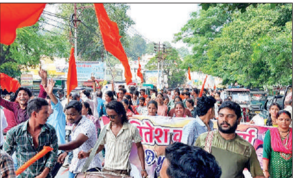
रामनगर में अपने समर्थकों के साथ नामांकन करने जाते छात्र नेता।