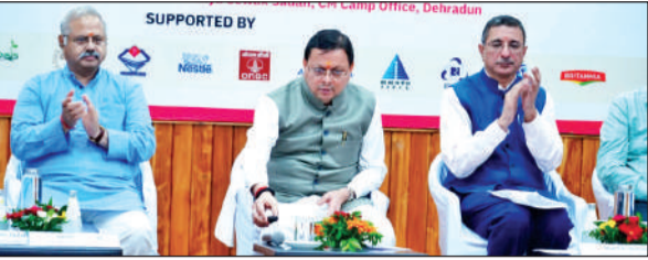
डिजिटल क्लासरूम का वचुंअल शुभारंभ करते सीएम पुष्कर सिंह धामी।

मुख्यमंत्री ने कहा कि आज देश के प्रतिष्ठित कॉर्पोरेट हाउस अपने सोशल रिस्पॉसिबिलिटी इनिशिएटिव के अंतर्गत उत्तराखंड में गुणवत्तापूर्ण शिक्षा, स्वास्थ्य, स्वच्छता एवं पर्यावरण संरक्षण जैसे महत्वपूर्ण क्षेत्रों में योगदान दे रहे हैं। राज्य में आईआईएफसीएल, मैनकाइंड, अवाना फाउंडेशन, टोयटा, नेस्ले,