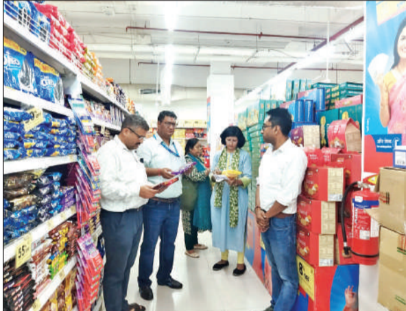
रुद्रपुर के एक प्रतिष्ठान में खाद्य पदार्थों की जांच करते उपायुक्त कुमाऊं मंडल।