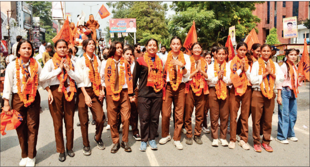
हल्द्वानी में बुधवार को महिला डिग्री कॉलेज की छात्रा प्रत्याशियों ने भी निकाली रैली। ● अमृत विचार

वैध प्रत्याशियों की सूची आज होगी जारी : एमबीपीजी व राजकीय महिला डिग्री कॉलेज सहित कुमाऊं