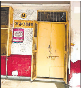
बंद चर्म रोग डॉक्टर का कक्ष।