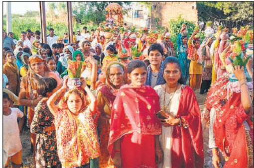
सेंदपुर जसकोली गांव में कलश यात्रा निकालती महिलाएं।