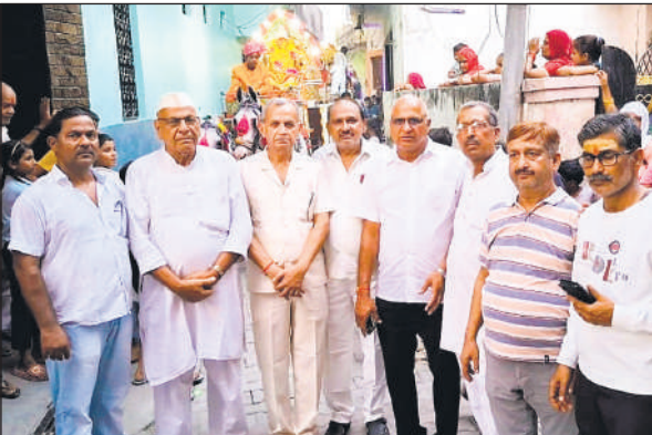
राम बरात में शामिल रामभक्त।