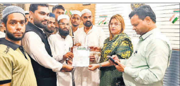
ईओ को ज्ञापन देते भाकियू लोकशक्ति पदाधिकारी।