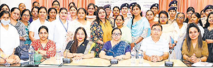
मनन सभागार में आयोजित शिविर में शामिल चिकित्सक व रेलवे की महिला कर्मचारी।