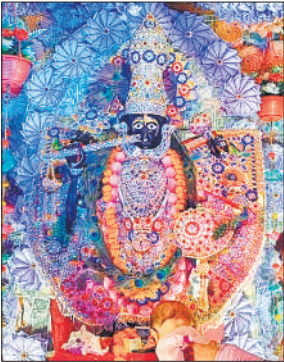
नोटों से सजे सेठ सांवरिया।

श्री राम बारात में सबसे आगे भगवान गणेश की झांकी के आगे श्रद्धालु नतमस्तक होकर चल रहे थे। वहीं माता महाकाली का अखाड़ा अपनी अद्भुत करारव सभी को अर्चभित कर रहा था। 11 लाख के नोटों से सजे सेठ सांवरिया की झांकी सभी को अपनी ओर आकर्षित कर रही थी। बाबा महाकाल का फूल