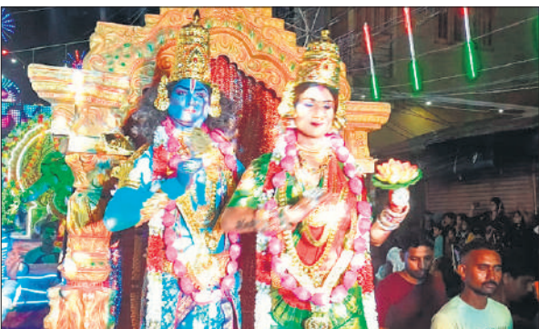
राम बरात में सजी झांकी।