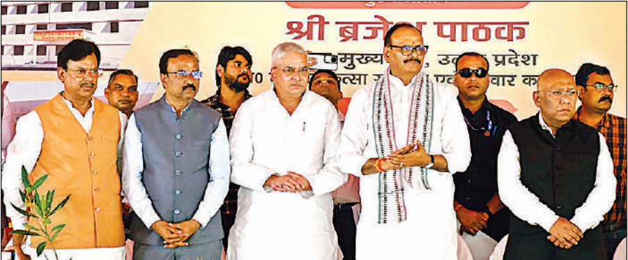
लखनऊ में लोकार्पण व शिलान्यास कार्यक्रम के दौरान उपस्थित उप मुख्यमंत्री ब्रजेश पाठक व अन्य।

उप मुख्यमंत्री बुधवार को इंदिरा नगर स्थित राज्य स्वास्थ्य एवं परिवार कल्याण संस्थान (ट्रेनिंग सेंटर) में चिकित्सा एवं स्वास्थ्य विभाग की 500 करोड़ रुपये मूल्य की 84 नवीन स्वास्थ्य इकाइयों का शिलान्यास एवं लोकार्पण करने के