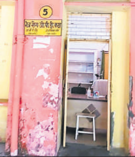
नेत्र रोग ओपीडी में खाली डॉक्टर की कुर्सी।

अमृत विचार : जिला अस्पताल में ओपीडी का समय भले ही सुबह आठ बजे से दोपहर दो बजे तक तय है, लेकिन हकीकत इससे अलग है। डॉक्टरों और स्टाफ की मनमानी का खामियाजा रोजाना सैकड़ों मरीजों को भुगतना पड़ रहा है। मरीज सुबह-सुबह अस्पताल पहुंचकर लाइन में लग जाते हैं, लेकिन निर्धारित समय पर ओपीडी कक्ष नहीं खुलते। डॉक्टर भी नौ बजे तक पहुंचते हैं। इस कारण मरीजों को या तो इंतजार करना पड़ता है या फिर बिना इलाज कराए ही लौटना पड़ता है। बुधवार को अमृत विचार की टीम ने अस्पताल में व्यवस्थाओं की पड़ताल की तो कलई खुली। सुबह 8:11 बजे एआरवी ओपीडी का कमरा नंबर 13 बंद मिला। चर्म रोग विभाग का कमरा नंबर 15 भी बंद था। इसी तरह डेंटल ओपीडी और मानसिक रोग विभाग की ओपीडी के कमरे भी बंद थे। नेत्र रोग विभाग की ओपीडी खुली थी लेकिन इसमें न तो डॉक्टर और न ही इंटर्न थे। इस दौरान कई मरीज और उनके परिजन परेशान होकर भटकते रहे। करीब सवा आठ बजे जब पर्चा बनाने का स्टाफ पहुंचा तो काउंटर पर कतार लग गई। मरीज उम्मीद कर रहे थे कि जल्द ही डॉक्टर बैठ जाएंगे, लेकिन करीब नौ बजे तक अधिकांश चिकित्सक कक्ष में नहीं पहुंचे।