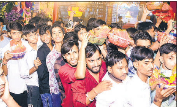
नवरात्र के तीसरे दिन मंदिर में दर्शन के लिए लाइन में लगे श्रद्धालु।

अमृत विचार : शारदीय नवरात्र के तीसरे दिन बुधवार को माता रानी के तृतीय स्वरूप मां चंद्रघंटा की पूजा-अर्चना आस्था व भक्तिभाव से की गई। मंदिरों में सुबह से ही भक्तों की लंबी कतारें लगी रहीं। शाम को भजन-कीर्तन और जयकारों की गूंज से वातावरण भक्तिमय हो गया। देवी दुर्गा का तीसरा रूप चंद्रघंटा कहलाता है। इनके मस्तक पर अर्धचंद्र के आकार का घंटा सुशोभित है। मां सिंह पर सवार रहती हैं और दस भुजाओं में विविध अस्त्र-शस्त्र धारण करती हैं। इन्हें पराक्रम और वीरता की देवी कहा जाता है। माना जाता है कि मां चंद्रघंटा