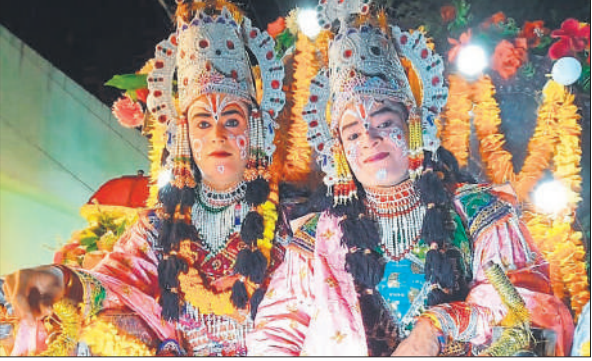
रथ में बैठे राम और लक्ष्मण के स्वरूप।