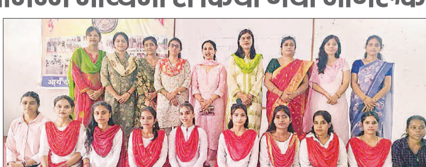
आर्य कन्या महाविद्यालय में जागरूकता कार्यक्रम में मौजूद छात्राएं व शिक्षिका।