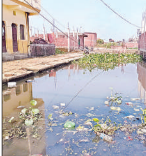
मोहम्मद नगर में फैली गंदगी।