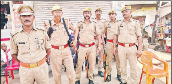
पोनी रोड तिराहे पर मौजूद पीएसी के जवान।

बता दें कि रविवार रात आई लव मोहम्मद के समर्थन में निकाले जा रहे जुलूस को रोकने पर भीड़ ने पुलिस से हाथापाई कर पथराव कर दिया था। इस दौरान कई