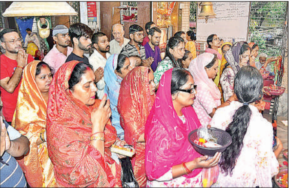
बड़े दुर्गा मंदिर में देवी मां के दर्शन करते भक्त।

गुंजायमान होते रहे। श्रद्धालुओं ने चुनरी, फल-फूल, नारियल सहित अन्य सामान चढ़ाकर मां की आराधना की। मंदिरों में प्रार्थना को लेकर श्रद्धालुओं में सुबह से ही खासा उत्साह दिखा। बड़ी संख्या में महिलाएं भी मंदिरों में पूजा-पाठ करने पहुंचीं।