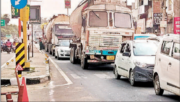
सिविल लाइन चौराहे पर जेब्रा क्रॉसिंग को पार कर खड़े वाहन। अमृत विचार