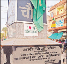
कहराो का अड्डा अलीमिया चौक पर चस्पा आई लव मोहम्मद का पोस्टर।

अमृत विचार। पुलिस अधीक्षक द्वारा व्यवस्था को चाक-चौबंद रखने का भले ही दावा किया जा रहा हो, लेकिन इसका असर अराजक तत्वों पर पड़ता दिखाई नहीं दे रहा है। देश भर में चर्चा का विषय बने आई लव मोहम्मद के बैनर और पोस्टर जिले में भी लगने लगे हैं। बुधवार की सुबह शहर के कहराों के अड्डे समेत कई मुस्लिम बाहुल्य इलाकों में दुकानों और इमारतों में पोस्टर चسपा दिखाई दिए। सबसे अहम बात यह है कि इसकी खबर न भवन स्वामी को लगी और न ही रात्रि गश्त करने वाले पुलिस कर्मियों को रही। आई लव मोहम्मद के पोस्टर लगने की