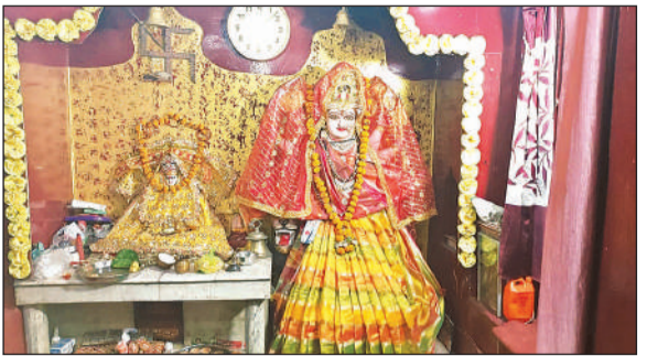
मां चंद्रघंटा के रूप में बिराजी कंचना माता।