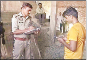
घटना की जानकारी लेती पुलिस।