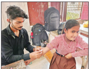
शिविर में बच्ची के स्वास्थ्य की होती जांच।