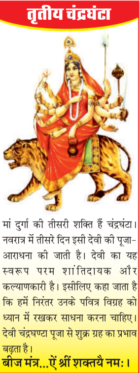
मां दुर्गा को तीसरी शक्ति हैं चंद्रघंटा। नवरात्र में तीसरे दिन इसी देवी की पूजा-आराधना की जाती है। देवी का यह स्वरूप परम शांतिदायक और कल्याणकारी है। इसीलिए कहा जाता है कि हमें निरंतर उनके पवित्र विग्रह को ध्यान में रखकर साधना करना चाहिए। देवी चंद्रघण्टा पूजा से शुरु ग्रह का प्रभाव बढ़ता है।