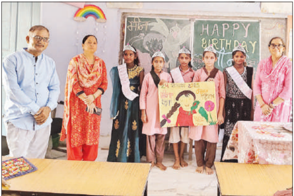
मीना दिवस मनाते शिक्षक व छात्राएं।

पाटन उन्नाव, अमृत विचार। बिहार शानांतर्गत गांव चैनपुर के मजरा मधुकपुर खेड़ा में चौपाल लगाकर बालिकाओं व महिलाओं को मिशन शक्ति फेज 5.0 शक्ति दीदी अभियान के तहत उनकी समस्याओं के बारे में जानकारी की गई तो वहां किसी प्रकार की शिकायत नहीं मिली। इसमें महिलाओं व बच्चों के लिए सरकार द्वारा चल रही योजनाओं में नारी सुरक्षा, नारी सम्मान, कन्या सुमंगला, वृद्धा पेंशन, सीएम सामूहिक विवाह, बीसी सखी, राष्ट्रीय पोषण मिशन व विभिन्न हेल्थलाइन नंबरों के बारे में जागरूक किया गया।