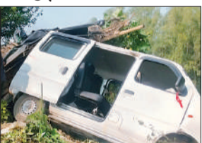
गुमटी में घुसी वैन।