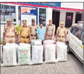
पुलिस के गिरफ्त में तस्कर व बरामद 2 क्विंटल डोडा।