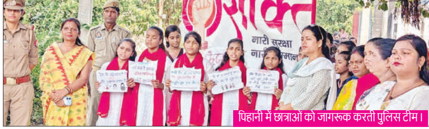
पिहानी में छात्राओं को जागरूक करती पुलिस टीम।