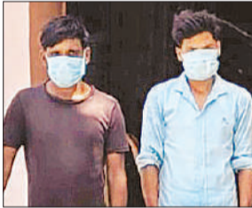
पकड़े गए आरोपी।

अरवल थाना क्षेत्र के एक गांव में दो भाई अपनी बहन से ही लगातार शारीरिक संबंध बनाते रहे। बीती 23 सितंबर को पीड़िता ने पीआरवी को घटना के सम्बंध में सूचना दी। उसके बाद उसने थाने पहुंचकर तहरीर देते हुए घटना की पूरी जानकारी पुलिस को दी। पुलिस