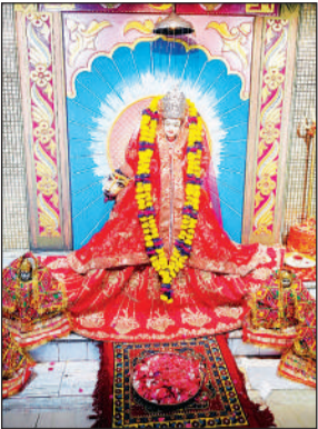
मां पूर्णा देवी धाम में विराजमान मां की मूर्ति।

नवरात्र के तीसरे दिन बुधवार को भक्तों ने मां के चंद्रघंटा स्वरूप की पूजा-अर्चना की। शहर के प्रमुख कल्याणी, दुर्गा, पूर्णादेवी धाम सहित ग्रामीण अंचलों में स्थित देवी मंदिरों के पट पूजन-अर्चन के बाद भोरपहर ही खोल दिए गए थे। भक्त भी सुबह ही मंदिर पहुंचने लगे थे। दोपहर में भीड़ अधिक होने से श्रद्धालुओं को लाइन लगानी पड़ी। देवी मां के जयकारों से सभी मंदिर परिसर