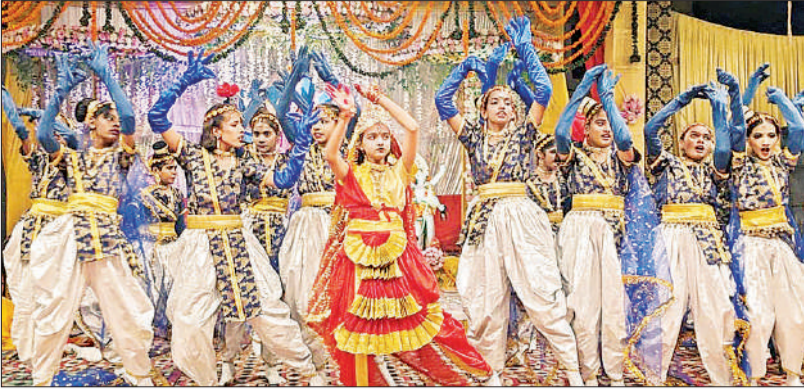
महिषासुर वध लीला का मंचन करतीं दक्ष इंटरनेशनल स्कूल की छात्राएं।