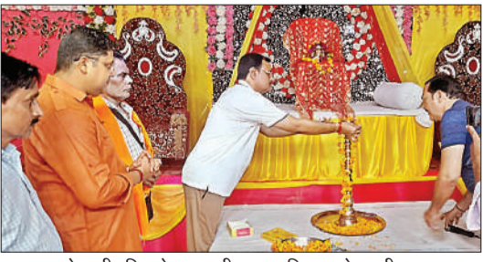
भगवान गणेश की प्रतिमा के समक्ष दीप प्रज्ज्वलित करते एसडीएम।