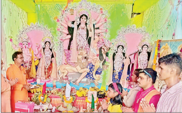
पंजाबी कालोनी में सजाए गए दुर्गा पंडाल में माता की स्तुति करते श्रद्धालु।