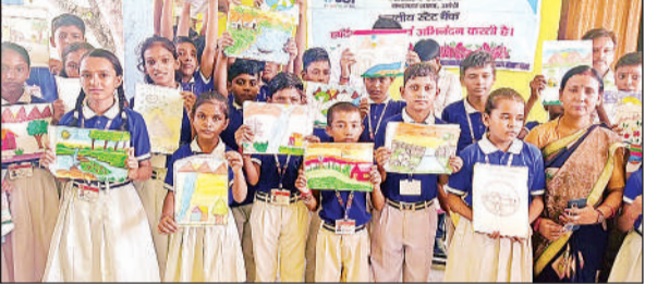
आर्ट प्रतियोगिता में उपस्थित छात्र।