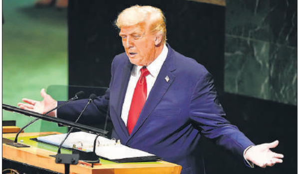
ट्रंप ने मंगलवार को संयुक्त राष्ट्र महासभा के 80वें सत्र को संबोधित किया। फाइल फोटो

ट्रंप ने कहा कि इस घटना के लिए जिम्मेदार लोगों को गिरफ्तार किया जाना चाहिए। इसके बाद जब ट्रंप संयुक्त राष्ट्र महासभा के उच्च स्तरीय 80वें सत्र को संबोधित करने के लिए