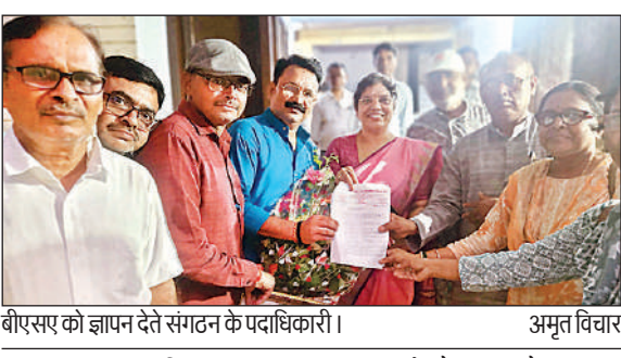
बीएसए को ज्ञापन देते संगठन के पदाधिकारी।