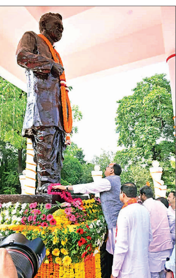
लखनऊ में चारबाग स्थित दीनदयाल वाटिका में पंडित दीनदयाल उपाध्याय की जयंती पर उनकी प्रतिमा पर पुष्पांजलि अर्पित करते उप मुख्यमंत्री ब्रजेश पाठक, साथ में अन्य।

अमृत विचार : अखिलेश यादव ने कहा कि जाति हमारा फर्स्ट इमोशनल कनेक्ट है। बाबा साहब डॉ. भीम राव अम्बेडकर ने संविधान में जो आरक्षण दिया है वह जाति के हिसाब से मिला है। मंडल कमीशन की प्रस्तावना में चर्चा हुई और बात सामने आयी थी कि पिछड़ापन जाति के आधार पर है तभी यह तय हुआ कि आरक्षण जाति के अनुसार मिलेगा। भाजपा पीडीए (पिछड़े, दलित और अल्पसंख्यक) की एकता से घबरा गई है। उन्होंने कहा कि हरिजन एक्ट तो जाति पर ही बना है।