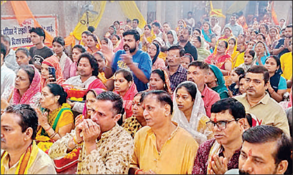
दुर्गा मंदिर में आरती के दौरान उमड़ी भक्तों की भीड़।

से सराबोर कर दिया। नगर के विभिन्न मंदिरोंकूंकंचन नगर स्थित कंचनामाई मंदिर, महेश मार्ग स्थित सिद्धिधात्री मंदिर, डाकतार कॉलोनी का सोमा गौरी मंदिर, गांधीनगर का काली मंदिर, पोनी रोड झंडे चौराहा