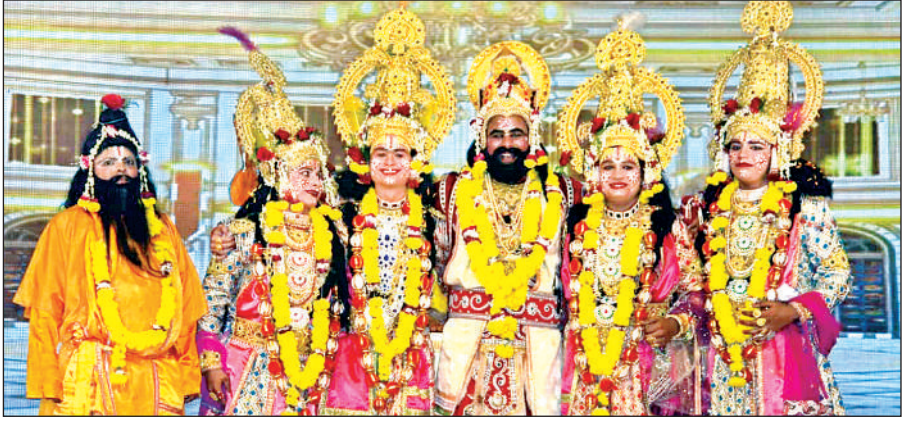
परेड रामलीला में पिता दशरथ के साथ प्रभु राम, लक्ष्मण, भरत और शत्रुघ्न।

प्रभु श्रीराम के साथ ही भरत, लक्ष्मण और शत्रुघ्न ने लिए सात फेरे , आतिशबाजी से खिल उठा मैदान