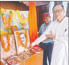
दीनदयाल के चित्र पर पुष्प अर्पित करते पदाधिकारी।