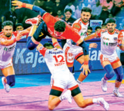
योद्धाज (सफेद) और बेंगलुरु बुल्स के खिलाड़ी।

बेंगलुरु : महिला विश्व कप से पहले भारत को करारा झटका लगा जब बृहस्पतिवार को इंग्लैंड के खिलाफ अभ्यास मैच के दौरान तेज गेंदबाज अरुंधति रेड्डी चोटिल हो गईं। इंग्लैंड की सलामी बल्लेबाज एमी जोन्स को आउट करने वाली इस तेज गेंदबाज ने 13वें ओवर में हीथर नाइट की गेंद पर रिटर्न केच लेने की कोशिश की, पर गेंद उनके बाएं पैर पर लग गई जिसके बाद वह जमीन पर गिर गईं।