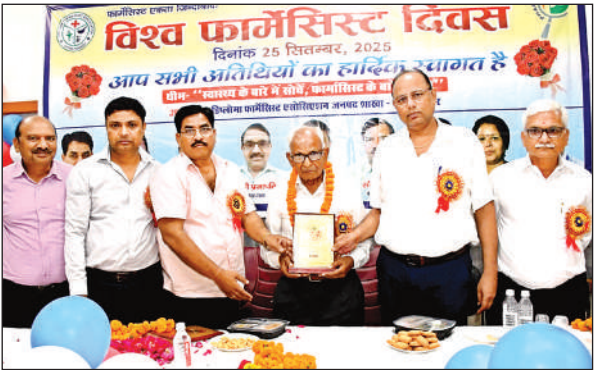
सेवानिवृत्त फार्मासिस्ट को सम्मानित करते डिप्लोमा फार्मेसिस्ट एसोसिएशन के अध्यक्ष और सदस्य।