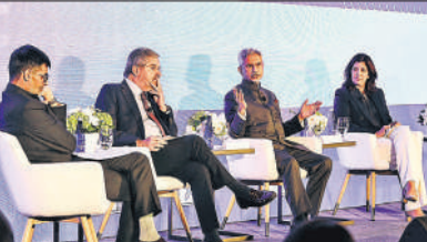
न्यूयॉर्क में आयोजित कार्यक्रम में बोलते जयशंकर।

उनकी यह टिप्पणी व्यापार और शुल्क चुनौतियों के साथ-साथ आग्रजन पर राष्ट्रपति डोनाल्ड ट्रंप के सख्त रुख के बीच आई है, जिसमें एच-1बी वीजा पर 100,000 अमेरिकी डॉलर का नया शुल्क भी शामिल है, जो मुख्य रूप से भारतीय पेशेवरों को प्रभावित करता है। भारतीय इन अस्थायी कार्य वीजा के लाभार्थियों