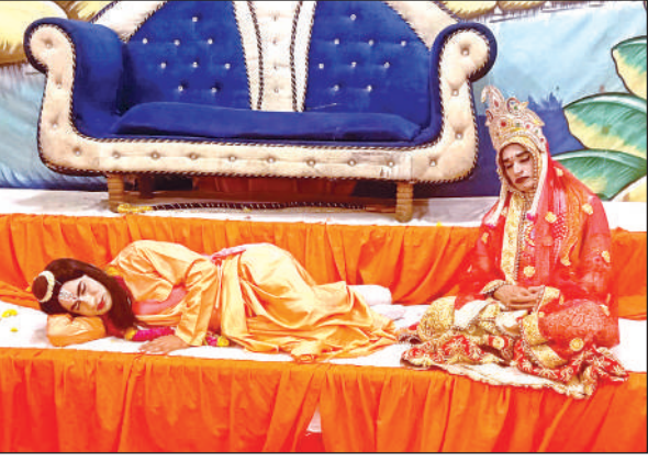
श्रीराम के वियोग में दुखी राजा दशरथ।