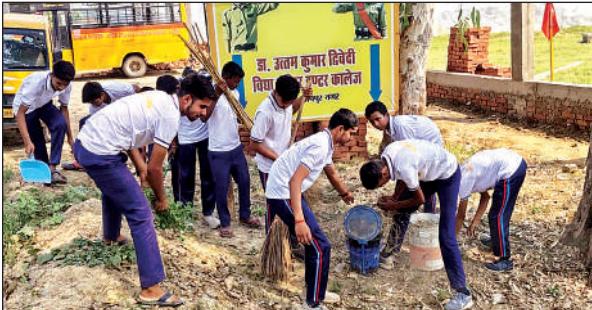
घाटमपुर में स्वच्छता अभियान के अंतर्गत सफाई करते एनसीसी कैडेट्स।

बिल्हौर में भी स्वच्छता ही सेवा पखवाड़े का शुभारंभ: बिल्हौर। बिल्हौर नगर पालिका परिषद द्वारा गुरुवार को स्वच्छता ही सेवा के पखवाड़े का आयोजन किया गया। इस दौरान प्रमुख रूप से उप