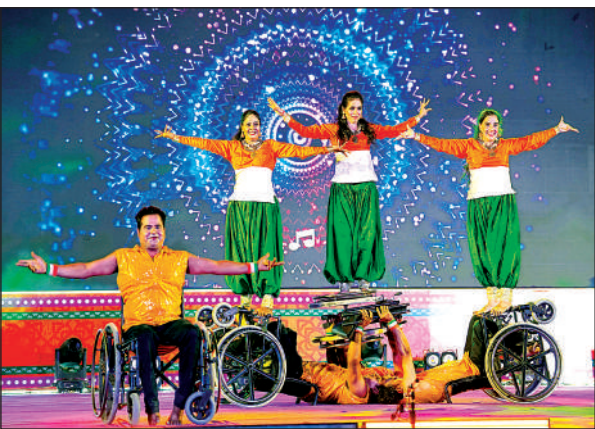
उद्घाटन समारोह के दौरान कलाकार प्रस्तुति देते हुए।