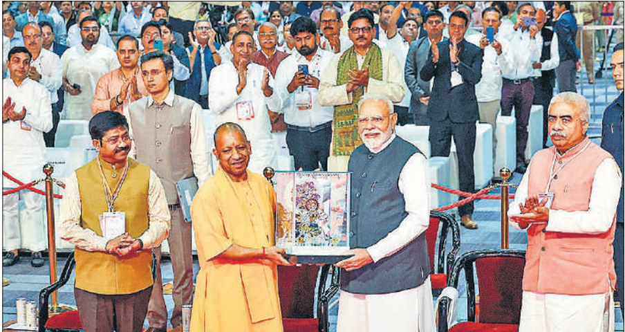
प्रधानमंत्री को फिरोजाबाद के शिल्पियों द्वारा बनाई गई मां दुर्गा की प्रतिमा भेंट करते मुख्यमंत्री योगी आदित्यनाथ।

अमृत विचार : प्रधानमंत्री नरेंद्र मोदी ने गुरुवार को ग्रेटर नोएडा के इंडिया एक्सपो सेंटर एंड मार्ट में यूपी इंटरनेशनल ट्रेड शो के तीसरे संस्करण का उद्घाटन करते हुए कहा कि उत्तर प्रदेश अब निवेश और प्रगति का नया केंद्र बन गया है। उन्होंने देश-दुनिया के निवेशकों से आह्वान किया कि यूपी में दिल खोलकर निवेश करें, क्योंकि मुख्यमंत्री योगी आदित्यनाथ के नेतृत्व में राज्य विकास के नए आयाम गढ़ रहा है। मोदी ने कहा कि डिफेंस, सेमीकंडक्टर और मोबाइल मैन्युफैक्चरिंग में यूपी की बढ़ती भूमिका इसे भारत का मैन्युफैक्चरिंग हब बना रही है। बताया कि देश में बनने वाले 55 प्रतिशत मोबाइल फोन यूपी से निर्मित होते हैं। जल्द ही यहां सेमीकंडक्टर फैसिलिटी भी शुरू होने वाली है, जो आत्मनिर्भर भारत के सपने को नई ऊंचाइयों तक ले जाएगी। प्रधानमंत्री ने कहा कि यूपी