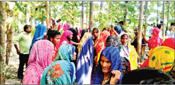
शव मिलने की जगह पर एकत्र भीड़।