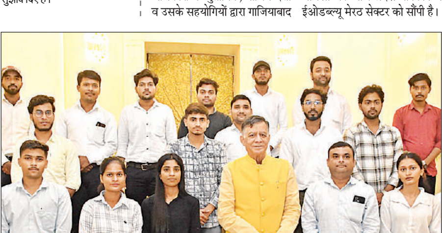
विधानभवन देखने पहुंचे कानपुर के महाराणा प्रताप इंजीनियरिंग कॉलेज के छात्र-छात्राएं विधानसभा अध्यक्ष सतीश महाना के साथ।

अमृत विचार, लखनऊ: मुख्यमंत्री योगी आदित्यनाथ के नेतृत्व में समर्थ उत्तर प्रदेश-विकासित उत्तर प्रदेश @2047 अभियान तेजी से जनभागीदारी का नया कीर्तिमान गढ़ रहा है। प्रदेश के सभी 75 जनपदों में चल रहे संवाद एवं फीडबैक मिशन के तहत अब तक करीब 7 लाख लोगों ने अपने सुझाव साझा दिए हैं। इनमें ग्रामीण क्षेत्रों से लगभग 5.5 लाख और नगरीय क्षेत्रों से 1.5 लाख से अधिक नागरिक जुड़े हैं। यह तथ्य साबित करता है कि आम जनता न सिर्फ इस महाअभियान का हिस्सा बन रही है, बल्कि राज्य के भविष्य की दिशा तय करने में सक्रिय भूमिका निभा रही है। आंकड़ों के अनुसार 31 से 60 वर्ष आयु वर्ग के लोगों ने सर्वाधिक 3.60 लाख सुझाव दिए हैं।