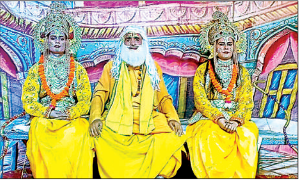
गुरु विश्वामित्र के साथ राम और लक्ष्मण।

रामलीला भवन मेस्टन रोड से प्रभु की बारात निकाली गई। बारात विभिन्न मार्गों से होते हुए रामलीला स्थल पहुंची। यहां वैदिक मंत्रोच्चार के बीच प्रभु राम ने जानकी , भरत ने मांडवी, लक्ष्मण ने उर्मिला और शत्रुघ्न ने श्रुतकीर्ति के साथ सात