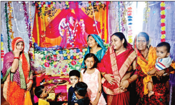
माता के दर्शन करती महिला श्रद्धालु।

दरबार में आए भक्तों ने मैया के जयकारे लगाकर उनके प्रतु अपनी श्रद्धा प्रकट की।