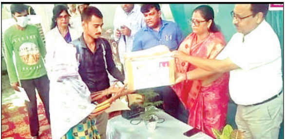
सिकंदरा सीएचसी में गुरुवार को किट बांटते सीएमओ।