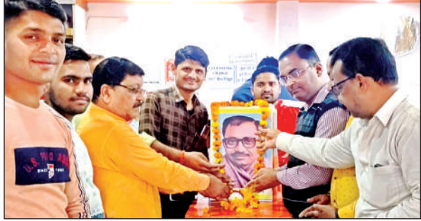
पं. दीनदयाल उपाध्याय के चित्र पर माल्यार्पण करते भाजपाई।