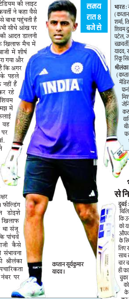
कप्तान सूर्यकुमार यादव।