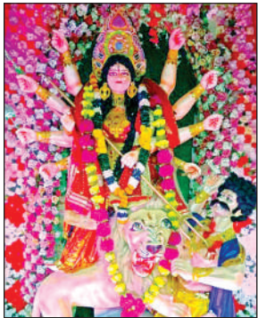
मां की सजी प्रतिमा।

प्रातः काल की बेला में श्रेष्ठ आचार्यों द्वारा मां भगवती का पूजन -अर्चन आरती एवं सांय कालीन बेला में भजन संध्या एवं आरती संपन्न होने के बाद बाल कलाकारों के द्वारा धार्मिक कार्यक्रम रासलीला एवं रंगोली प्रतियोगिता एवं अन्य ज्ञानवर्धक कार्यक्रम संपादित किए जाते हैं। वहीं गुरुवार को माता कूष्मांडा देवी का पूजन अर्चन एवं भजन संध्या के बाद सांयकालीन बेला में लक्ष्मण परशुराम संवाद आयोजित किया गया। इस मौके पर बड़ी संख्या में लोग मौजूद रहे। माताके