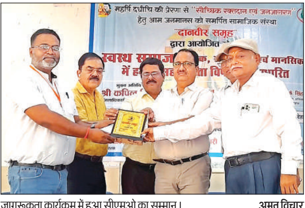
जागरूकता कार्यक्रम में हुआ सीएमओ का सम्मान।

यह बात गुरुवार को सामाजिक संगठन दानवीर समूह के बैनर ईको पार्क में आयोजित जागरूकता कार्यक्रम में जानकारी ने कही। स्वस्थ समाज में हमारी सहभागिता, विषय पर आयोजित कार्यक्रम में