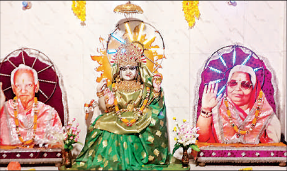
गायत्री मंदिर में मां कूष्मांडा के रूप में विराजी गायत्री माता।