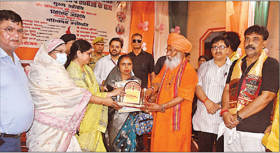
उत्कृष्ट कार्य करने वाली महिला उद्यमी को प्रशस्तिपत्र देते सांसद साक्षी महाराज।