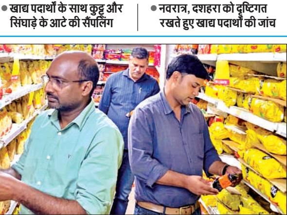
दुकानों पर खाद्य सामग्री की जांच करते अधिकारी।

पूछा। महारानी कैकेयी ने कहा कि वह उनके पुत्र भरत को राजा बना दें और राम को 14 वर्ष के लिए वन भेज दें। राजा ने उन्हें समझाने की कोशिश की पर बात नहीं बनी। जब इस बात की जानकारी प्रभु राम को हुई तो वे स्वतः ही वन जाने को तैयार हो गए। लक्ष्मण जी ने भी उनके साथ जाने का निर्णय लिया। सीता जी भी तैयार हो गईं। प्रभु वन चले तो अयोध्यावासी भी रो पड़े। प्रभु ने किसी तरह उन्हें शांत कराया। प्रभु के वन जाने की सूचना से दशरथ जी दुखी हो गए और उन्होंने पुत्र वियोग में प्राण त्याग दिए।