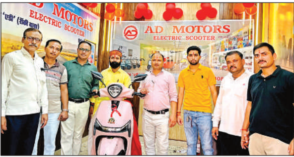
इलेक्ट्रिक स्कूटर के शोरूम के उद्घाटन के अवसर पर मौजूद लोग। अमृत विचार

अमृत विचार। घाटमपुर में नवरात्र के चौथे दिन हवन पूजन के साथ इलेक्ट्रिक स्कूटर के एडी मोटर्स का शुभारंभ हुआ।