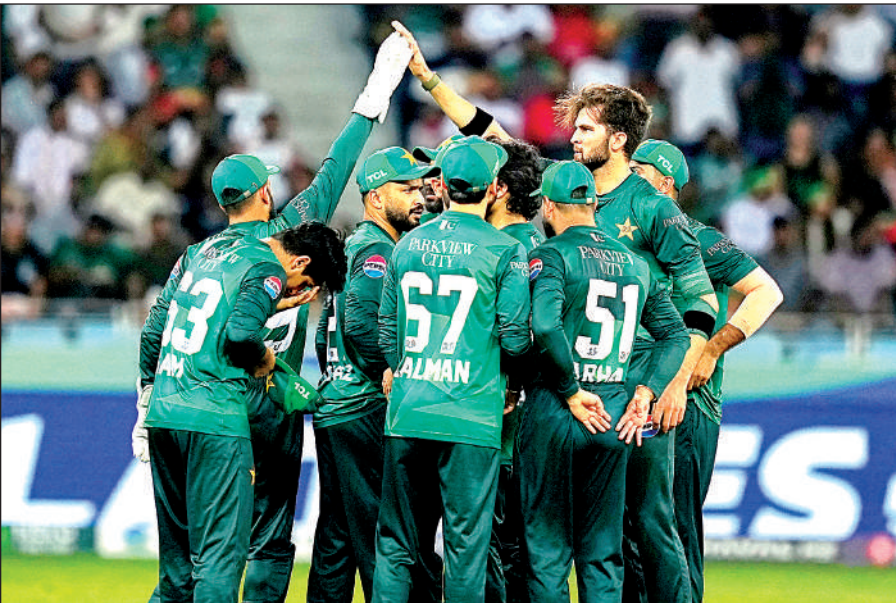
बांग्लादेश के परवेज हसन के आउट होने के बाद पाकिस्तान के शाहीन शाह अफरीदी (दाएं) टीम के साथ जश्न मनाते हुए।

अगरकर ने कहा पडविकल टेस्ट टीम में रहे हैं। हमने इंग्लैंड में करुण से बेहतर की उम्मीद की थी। पडविकल आस्ट्रेलिया में टेस्ट टीम में थे और इंग्लैंड के खिलाफ धर्मशाला में अर्धशतक लगाया था। पिछले तीन चार साल से टीम के साथ लगातार दौरा कर रहे ईश्वरन को अंतिम एकादश में मौका नहीं मिला है और अब तो वह टीम से भी बाहर हैं। अगरकर ने कहा कि इस फैसले के पीछे बहुत कुछ पढ़ने की जरूरत नहीं है। अगले एक साल विदेश दौरा नहीं करना है लिहाजा ईश्वरन का टेस्ट पदार्पण मुश्किल ही लग रहा है।