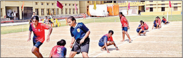
अवध इंटरनेशनल स्कूल में राष्ट्रीय खो-खो प्रतियोगिता में प्रतिभाग करती खिलाड़ी।