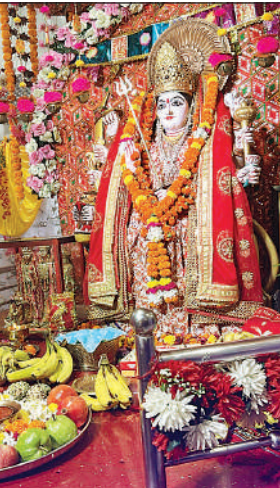
मंदिर में स्थापित प्रतिमा।