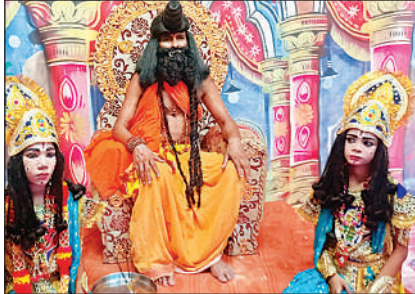
रामलीला में मंचन करते कलाकार।