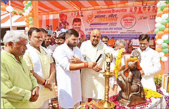
सांसद खेल स्पर्धा का दीप प्रज्वलित कर उद्घाटन करते कैसरगंज सांसद करन भूषण सिंह।

सांसद करन भूषण सिंह ने खिलाड़ियों को शुभकामनाएं देते हुए कहा कि खेल केवल शरीर को