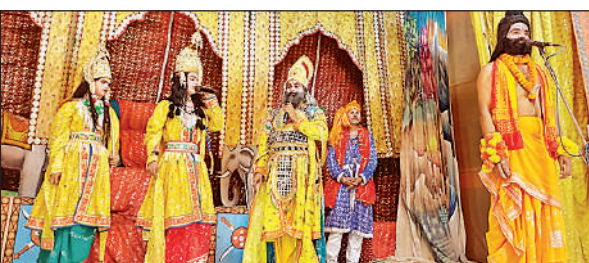
रामलीला में मंचन करते कलाकार।