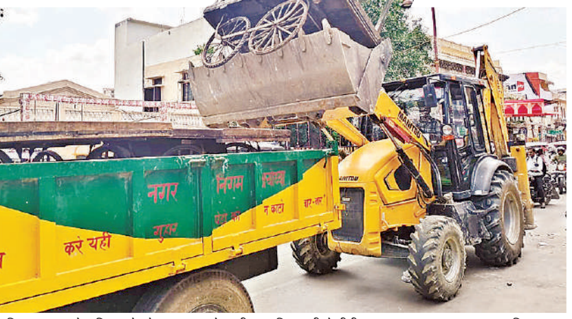
अतिक्रमण हटाओ अभियान के दौरान सामान ले जाती नगर निगम की जेसीबी।