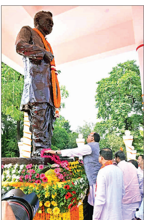
लखनऊ में चारबाग स्थित दीनदयाल वाटिका में पंडित दीनदयाल उपाध्याय की जयंती पर उनकी प्रतिमा पर पुष्पांजलि अर्पित करते उप मुख्यमंत्री ब्रजेश पाठक, साथ में अन्य।

भुगतान के लिए 25 लाख रुपये की रिश्तव मांगी है। आरोप है कि निदेशक और बाबू ने बकाया वेतन जारी करने के लिए सुविधा शुल्क मांगा और 10 लाख रुपए की वसूली पहले ही कर ली। बाकी राशि के लिए लगातार दबाव बनाया जा रहा है। हालांकि, पूरा प्रकरण जांच का विषय है।