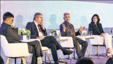
न्यूयॉर्क में आयोजित कार्यक्रम में बोलते जयशंकर।

उनकी यह टिप्पणी व्यापार और शुल्क चुनौतियों के साथ-साथ आव्रजन पर राष्ट्रपति डोनाल्ड ट्रंप के सख्त रुख के बीच आई है, जिसमें एच-1बी वीजा पर 100,000 अमेरिकी डॉलर का नया शुल्क भी शामिल है, जो मुख्य रूप से भारतीय पेशेवरों को प्रभावित करता है। भारतीय इन अस्थायी कार्य वीजा के लाभार्थियों