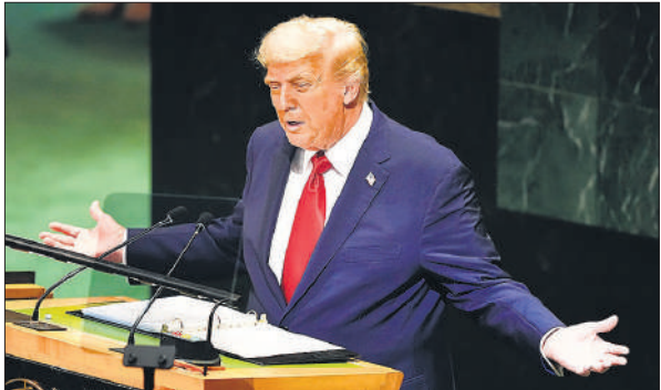
ट्रंप ने मंगलवार को संयुक्त राष्ट्र महासभा के 80वें सत्र को संबोधित किया। फाइल फोटो

ट्रंप ने कहा कि इस घटना के लिए जिम्मेदार लोगों को गिरफ्तार किया जाना चाहिए। इसके बाद जब ट्रंप संयुक्त राष्ट्र महासभा के उच्च स्तरीय 80वें सत्र को संबोधित करने के लिए