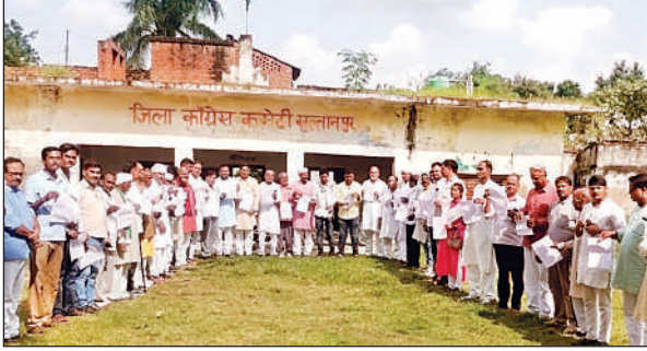
कांग्रेस कमेटी कार्यालय में आयोजित बैठक में बनी रणनीति।