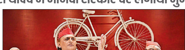
पत्रकारों के साथ वार्ता करते सपा प्रमुख अखिलेश यादव।

सपा प्रमुख पार्टी मुख्यालय में गुरुवार को प्रेस कॉन्फ्रेंस संबोधित कर रहे थे। उन्होंने कहा कि भाजपा सरकार काम नहीं कर रही है। आज कल बाजारों में गंजिंग कर रही है।