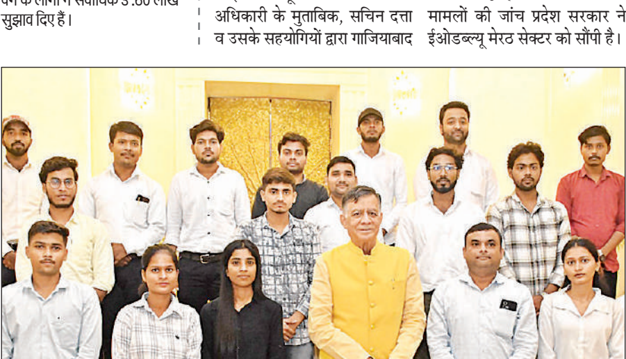
विधानभवन देखने पहुंचे कानपुर के महाराणा प्रताप इंजीनियरिंग कॉलेज के छात्र-छात्राएं विधानसभा अध्यक्ष सतीश महाना के साथ।

अमृत विचार, लखनऊ: मुख्यमंत्री योगी आदित्यनाथ के नेतृत्व में समर्थ उत्तर प्रदेश-विकासित उत्तर प्रदेश @2047 अभियान तेजी से जनभागीदारी का नया कीर्तिमान गढ़ रहा है। प्रदेश के सभी 75 जनपदों में चल रहे संवाद एवं फीडबैक मिशन के तहत अब तक करीब 7 लाख लोगों ने अपने सुझाव साझा दिए हैं। इनमें ग्रामीण क्षेत्रों से लगभग 5.5 लाख और नगरीय क्षेत्रों से 1.5 लाख से अधिक नागरिक जुड़े हैं। यह तथ्य साबित करता है कि आम जनता न सिर्फ इस महाअभियान का हिस्सा बन रही है, बल्कि राज्य के भविष्य की दिशा तय करने में सक्रिय भूमिका निभा रही है। आंकड़ों के अनुसार 31 से 60 वर्ष आयु वर्ग के लोगों ने सर्वाधिक 3.60 लाख सुझाव दिए हैं।