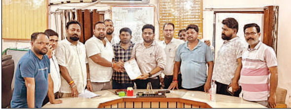
नगर पालिका परिषद गोंडा के प्रभारी अधिशासी अधिकारी को मांग पत्र देते सभासद।

शुरू की। घटना के अनावरण के लिए एसओजी व सर्विलांस समेत पांच पुलिस टीमों को लगाया गया। घटनास्थल का मौका मुआयना, साक्ष्य संकलन, डिजिटल व मैनुअल साक्ष्यों का विश्लेषण किया