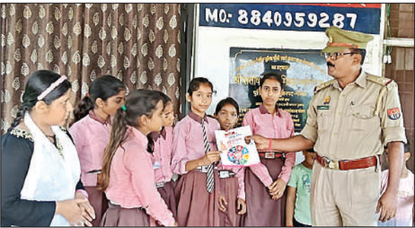
छात्रा को मिशन शक्ति का पोस्टर देते चौकी प्रभारी।