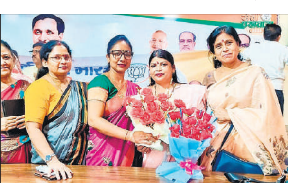
राज्य महिला आयोग की सदस्य का स्वागत करती महिलाएं।