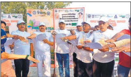
श्रमदान के बाद शपथ लेते सामाजिक संगठनों से जुड़े लोग।