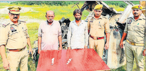
स्वार पुलिस की गिरफ्त में आरोपी।