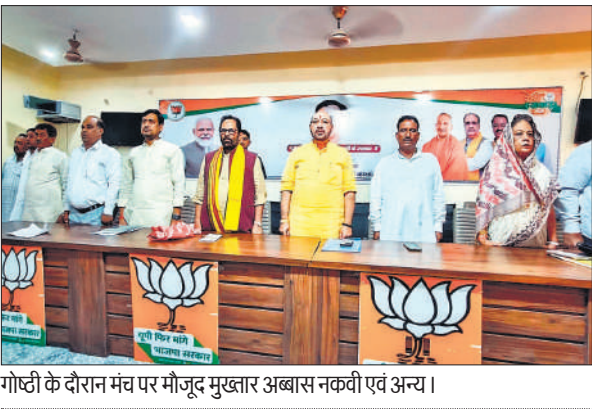
गोष्ठी के दौरान मंच पर मौजूद मुख्तार अब्बास नकवी एवं अन्य।

राम विहार स्थित भाजपा कार्यालय पर गुरुवार को हुई गोष्ठी में पूर्व केंद्रीय मंत्री ने कांग्रेस को निशाने पर लिया। कहा कि सत्तालोलुप अवसरवादी सियासत राजनीतिक व्यवस्था के प्रति लोगों में अविश्वास बढ़ रहा है। राजनैतिक क्षेत्र में अवसरवाद और संवादहीनता बड़ी चुनौती बनती जा रही है। विपक्ष पर कटाक्ष करते हुए कहा कि लोग संविधान की दुहाई और हाइड्रोजन बम की दवंगी से जनदेश के अपराधिक अपमान की अराजकता, उद्‌डटता में जुटे हैं। मोदी सरकार निरन्तरता के साथ तीसरे कार्यकाल में ईमान, इकबाल, ईसाफ के संकल्प के साथ सुशासन के सफल स्फर को आगे बढ़ा रही है। आजादी के बाद पहली गैर-कांग्रेस सरकार है जो बिना कुन्वे के रहम और कांग्रेस के रिमोट के स्थायित्व के साथ सुशासन, सफलता के कीर्तिमान स्थापित कर रही है।