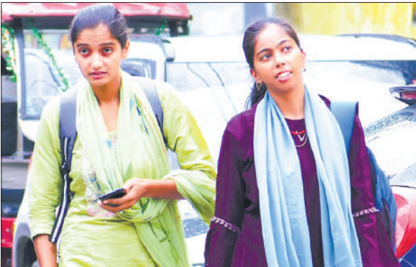
दोपहर में यूनिकली युवतियां।

इस बार मानसून सत्र में अच्छी बारिश होने के बाद उम्मीद थी कि समय से ठंड का अहसास भी होगा। लेकिन सितंबर के दूसरे पखवाड़े में मौसम ने अचानक यू टर्न ले लिया। हर दिन तापमान चढ़ने लगा। तेज धूप और