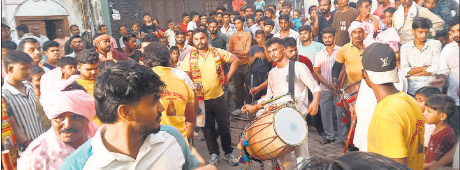
राम बरात में शामिल लोग और बजते ढोल।