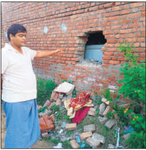
कटी गई दीवार दिखाता मकान स्वामी।

दीवार काटकर लाखों की चोरी, नकदी व जेवरात उड़ाए