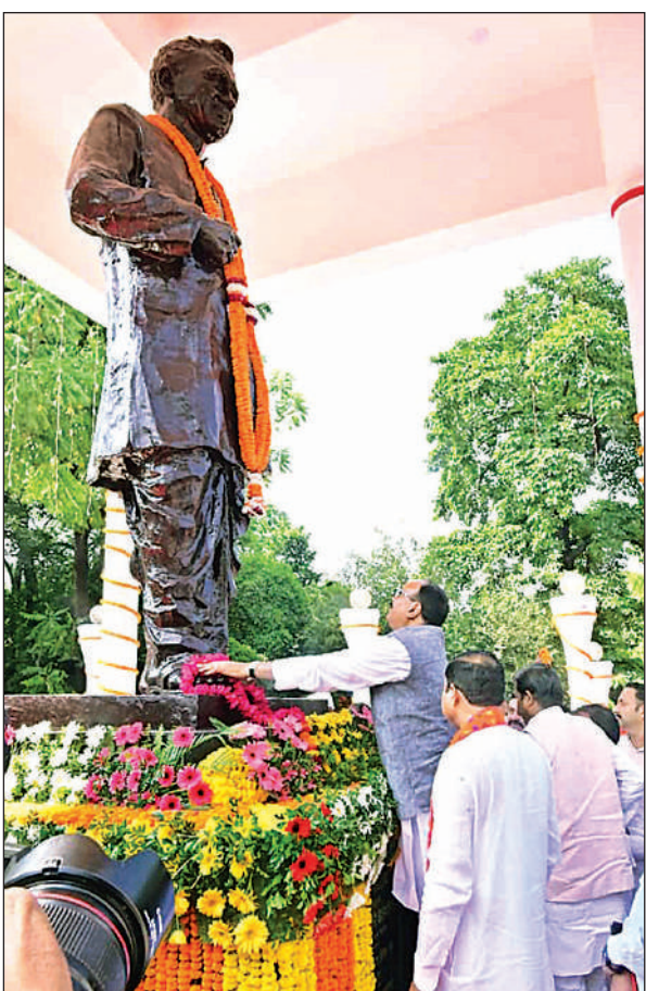
लखनऊ में चारबाग स्थित दीनदयाल वाटिका में पंडित दीनदयाल उपाध्याय की जयंती पर उनकी प्रतिमा पर पुष्पांजलि अर्पित करते उप मुख्यमंत्री ब्रजेश पाठक, साथ में अन्य।

भुगतान के लिए 25 लाख रुपये की रिश्तत मांगी है। आरोप है कि निदेशक और बाबू ने बकाया वेतन जारी करने के लिए सुविधा शुल्क मांगा और 10 लाख रुपए की वसूली पहले ही कर ली। बाकी राशि के लिए लगातार दबाव बनाया जा रहा है। हालांकि, पूरा प्रकरण जांच का विषय है।