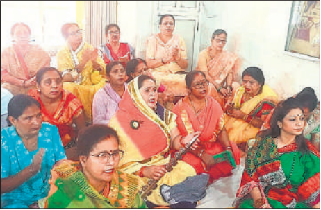
श्री त्रिपुरेश्वरी शक्तिपीठ में भजन गाती महिलाएं।