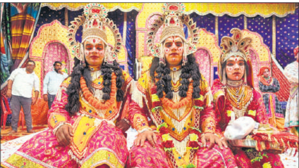
श्री राम विवाह की लीला का मंचन करते कलाकार।