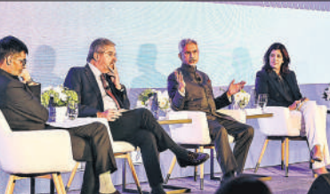
न्यूयॉर्क में आयोजित कार्यक्रम में बोलते जयशंकर।

उनकी यह टिप्पणी व्यापार और शुल्क चुनौतियों के साथ-साथ आग्रजन पर राष्ट्रपति डोनाल्ड ट्रंप के सख्त रुख के बीच आई है, जिसमें एच-1बी वीजा पर 100,000 अमेरिकी डॉलर का नया शुल्क भी शामिल है, जो मुख्य रूप से भारतीय पेशेवरों को प्रभावित करता है। भारतीय इन अस्थायी कार्य वीजा के लाभार्थियों