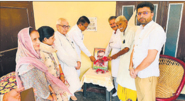
पंडित दीन दयाल उपाध्याय के चित्र पर पुष्प अर्पित करते भाजपाई।

दीनदयाल उपाध्याय की जयंती पर किया पौधरोपण