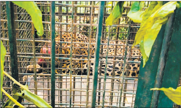
वन विभाग के पिंजरे में कैद तेंदुआ।

थाना क्षेत्र के रतनपुर कला गांव के पास में स्थित ग्रोथ सेंटर में लगातार तेंदुआ दिख रहा था। इससे लोगों का निकलना भी दुश्वार हो गया था। लोग हर दिन दहशत में थे। खेतों पर जाने के अलावा जरूरी काम से भी निकलने से डरते थे। युसूफपुर नगलिया के तीन लोगों को पर तेंदुआ ने हमला कर उन्हें घायल भी कर चुका था। इसके बाद बाद वन विभाग की