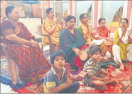
मंदिर में छंद गाती महिलाएं।

अमृत विचार : शारदीय नवरात्र के चौथे दिन श्रद्धालुओं ने मां चंद्रघंटा की पूजा-अर्चना की। इसके बाद आरती व दुर्गा चालीसा के पाठ के साथ ही पूजन किया। दोपहर में माता के छंद गाए। शाम को माता की आरती करके उपवास खोला। शारदीय नवरात्र के चौथे दिन गुरुवार को श्रद्धालुओं ने मां चंद्रघंटा की पूजा-अर्चना की। सबसे पहले माता का रौली से टीका करके पुष्प व फल चढ़ाए। उसके बाद नवरात्र व्रत कथा का पाठ किया। इसके बाद आरती व दुर्गा चालीसा के पाठ के साथ ही पूजन किया। श्रद्धालुओं ने हवन सामग्री के साथ ही धूप, कपूर,