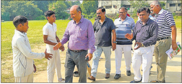
खिलाड़ियों से परिचय करते अतिथि।