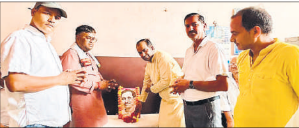
जयंती पर पंडित दीनदयाल को श्रद्धा सुमन अर्पित करते भाजपाई।

कुशल संगठनकर्ता थे पंडित दीनदयाल उपाध्याय