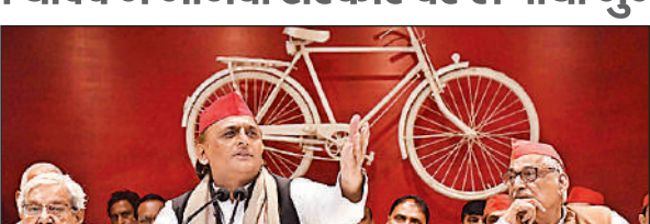
पत्रकारों के साथ वार्ता करते सपा प्रमुख अखिलेश यादव।

सपा प्रमुख पार्टी मुख्यालय में गुरुवार को प्रेस कॉंफ्रेंस संबोधित कर रहे थे। उन्होंने कहा कि भाजपा सरकार काम नहीं कर रही है। आज कल बाजारों में गंजिंग कर रही है।