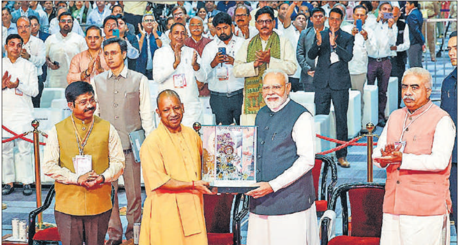
प्रधानमंत्री को फिरोजाबाद के शिल्पियों द्वारा बनाई गई मां दुर्गा की प्रतिमा भेंट करते मुख्यमंत्री योगी आदित्यनाथ।

मोदी ने कहा कि डिफेंस, सेमीकंडक्टर और मोबाइल मैन्युफैक्चरिंग में यूपी की बढ़ती भूमिका इसे भारत का मैन्युफैक्चरिंग हब बना रही है। बताया कि देश में बनने वाले 55 प्रतिशत मोबाइल फोन यूपी से निर्मित होते हैं। जल्द ही यहां सेमीकंडक्टर फैसिलिटी भी शुरू होने वाली है, जो आत्मनिर्भर भारत के सपने को नई ऊंचाइयों तक ले जाएगी। प्रधानमंत्री ने कहा कि यूपी