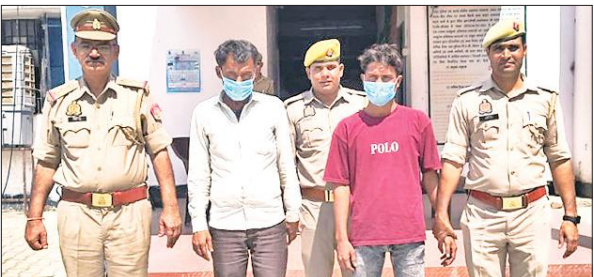
सहसवान पुलिस की गिरफ्त में युवक की हत्या करने के दो आरोपी। ● अमृत विचार

● पुलिस ने 24 सितंबर को मुकदमा तरमीम करके जांच तेज की