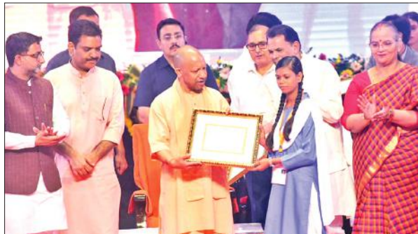
इंदिरा गांधी प्रतिष्ठान में आयोजित समारोह में एक छात्रा को छात्रवृत्ति देते मुख्यमंत्री योगी।

को छोड़ा नहीं जाएगा। योगी ने कहा कि 2017 से पहले छात्रवृत्ति में भारी गड़बड़ियां होती थीं। राशि समय पर नहीं मिलती थी और भेदभाव भी होता था। लेकिन 2017 में भाजपा सरकार