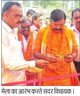
मेला का आरंभ करते सदर विधायक।