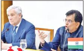
वाणिज्य मंत्री पीयूष गोयल के साथ इटली के उपप्रधानमंत्री एंतोनियो तजानी।

भारत के बीच रणनीतिक, राजनीतिक एवं आर्थिक साझेदारी है। हम आगामी महीनों में मेरी भारत यात्रा के साथ इसे और मजबूत करना चाहते हैं। कहा, मैंने मुक्त व्यापार समझौते को शीघ्र अंतिम रूप देने के लिए इटली के समर्थन की पुष्टि भी की। ईयू भारत का दूसरा सबसे बड़ा साझेदार है।