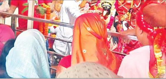
मां काली के मंदिर में पूजा करते श्रद्धालु।

मां भगवती की आराधना के पावन पर्व शारदीय चौथे नवरात्र को मां दुर्गा के चौथे स्वरूप कूष्मांडा देवी का वैदिक विधि-विधान के साथ पूजा अर्चना की गई। शहर से लेकर देहात क्षेत्र के मंदिरों और पूजा पंडालों में सुबह से लेकर देर शाम देवी भक्तों की भीड़ रही। घरों में मां का पूजन