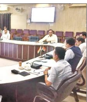
अधिकारियों के साथ चर्चा करते डीएम।

नरीरा से शुक्रवार को 52 हजार क्यूसेक पानी गंगा में छोड़ा गया। जो अब सामान्य की स्थिति में है। अब गंगा काफी नीचे आ रही है। कछला गंगा का जलस्तर 161.43 मीटर उंच मापा गया। जो खतरे के निशान से काफी नीचे है। जिले में राम गंगा और गंगा नदी में 35 दिन तक ऊपर से पानी आया। जिससे बाढ़ ने भारी