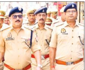
पैदल गश्त करते एसएसपी व अन्य।

पैदल गश्त करके एसएसपी ने लिया सुरक्षा का जायजा