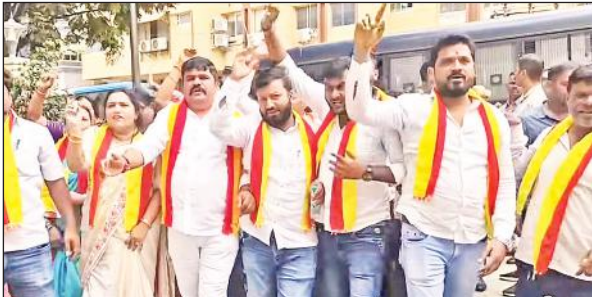
हिंदी दिवस के अवसर पर आयोजित कार्यक्रम का विरोध करते कन्नड़ समर्थक।

सूत्रों के अनुसार, गृह मंत्रालय की राजभाषा समिति ने होटल में एक हिंदी प्रचार सभा आयोजित की थी, जिसमें