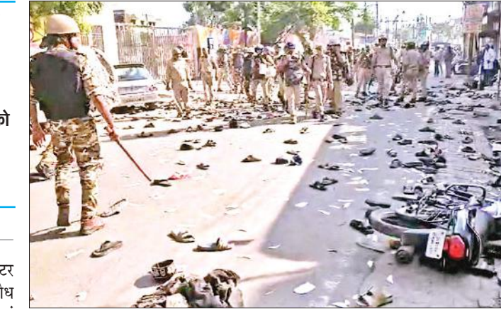
बरेली में जिला पंचायत रोड पर लाठीचार्ज के बाद मची भगदड़ में सड़क पर छूटे लोगों के जूते-चप्पल।

से वंचित रह गए लगभग पांच लाख बच्चों को छात्रवृत्ति देने को मंजूरी दी गई। इस हेतु 647.38 करोड़ की व्यवस्था की गई है। कैबिनेट ने स्थानीय निकायों में लगभग तीन हजार पदों पर भर्ती नीति को मंजूरी दी है। निकायों में कॉर्डर पुनर्गठन के बाद बड़े इन पदों के लिए मानक तय करने का प्रस्ताव भी पारित किया है। इससे हजारों युवाओं को रोजगार के अवसर मिलेंगे। निवेशकों को अनुदान प्रदान करने के प्रस्ताव पर भी मुहर लगाई गई। विभिन्न विभागों के निवेश प्रोत्साहन योजनाओं को मंजूरी दी गई है।