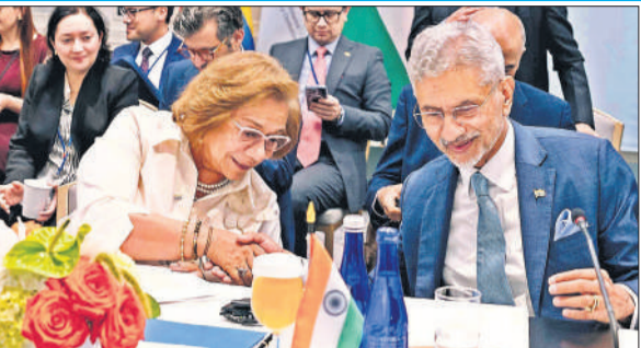
ब्रिक्स की बैठक में उपस्थित विदेश मंत्री जयशंकर।

उन्होंने कहा, एक अशांत विश्व में, ब्रिक्स को शांति स्थापना, संवाद, कूटनीति और अंतरराष्ट्रीय कानून के मालन के संदेश को फैलाना चाहिए। विदेश मंत्री ने कहा, बढ़ते संरक्षणवाद, शुल्क संबंधी अस्थिरता और गैर-