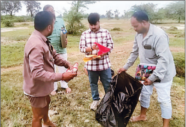
महराजगंज क्षेत्र के जनई गांव स्थित बाग में कुएं में मिली सरकारी दवाओं से भरे बोरे को देखते कर्मचारी।