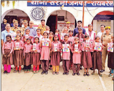
थाने का भ्रमण करने पहुंची छात्राएं। अमृत विचार

दवाओं को सील कर जांच के लिए भेजा जाएगा। जांचोपरांत संबंधित आरोपी के खिलाफ सख्त कार्रवाई की जाएगी।