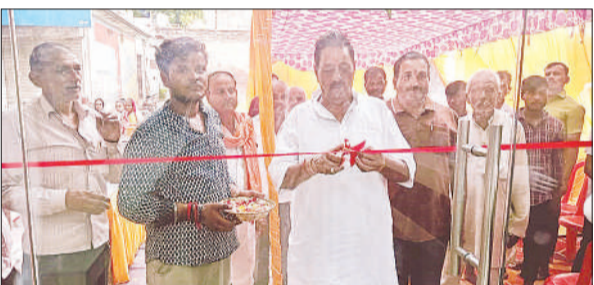
प्रतिष्ठान का उद्घाटन करते चेयरमैन।

बाराबंकी, अमृत विचार : मिशन शक्ति 5.0 के अंतर्गत शनिवार को एमएलसी अंगद कुमार सिंह की अध्यक्षता में कार्यक्रम का आयोजन हुआ। इसमें भाजपा जिलाध्यक्ष अरविंद मौर्या सहित कई जनप्रतिनिधि व अधिकारी उपस्थित रहे। इस अवसर पर दिव्यांगजन सशक्तिकरण विभाग द्वारा 20 दिव्यांगजनों को एम.आर. किट, 4 को व्हीलचेयर, 4 को कान की मशीन व 20 को दिव्यांग पेंशन प्रमाण पत्र प्रदान किए गए।