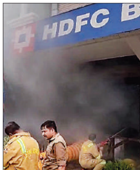
आग बुझाते फायरकर्मी।