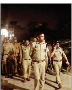
पुलिस फोर्स के साथ पहुंचे एसपी।