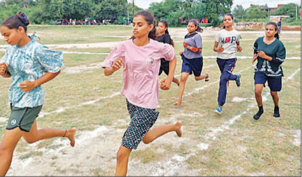
दौड़ प्रतियोगिता में प्रतिभाग करती छात्राएं।