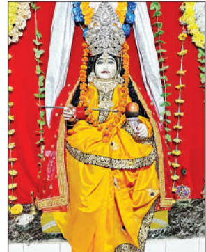
मां स्कंदमाता के रूप में बिराजी अन्नूपूर्णा माता।