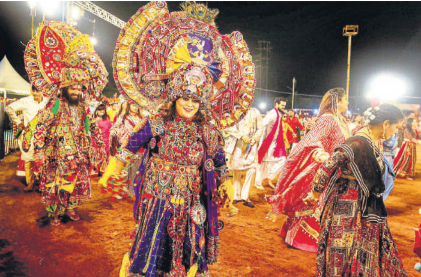
भोपाल में नवरात्रि के अवसर पर गरबा नृत्य का आयोजन किया गया। इस दौरान आकर्षक वस्त्र धारण किए यह कलाकार एजेंसी

बीजिंग। चीन के गांसू प्रांत में शनिवार को 5.6 तीव्रता का भूकंप आने से सात लोग घायल हो गए। सरकारी मीडिया ने यह जानकारी दी। सरकारी समाचार एजेंसी शिन्हुआ ने बताया कि कोई भी व्यक्ति गंभीर रूप से घायल नहीं हुआ है। चीन के भूकंप केंद्र के अनुसार लोंक्शी काउंटी में सुबह 5:49 बजे भूकंप आया, जिसका केंद्र जमीन से 10 किलोमीटर की गहराई पर था। सरकारी प्रसारक सीसीटीवी ने बताया कि आठ मकान तहस-नहस जबकि 100 से अधिक क्षतिग्रस्त हो गए। सरकारी मीडिया की ओर से ऑनलाइन पोस्ट किए गए वीडियो में आपातकर्म मलबा हटाते हुए दिख रहे हैं।