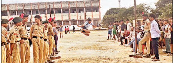
प्रतियोगिता में प्रतिभाग करती छात्रा।