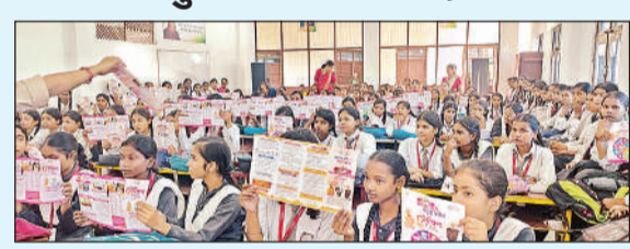
कार्यक्रम में ममता इंटर कॉलेज सेमरी में उपस्थित छात्राएं, शिक्षक और पुलिस।