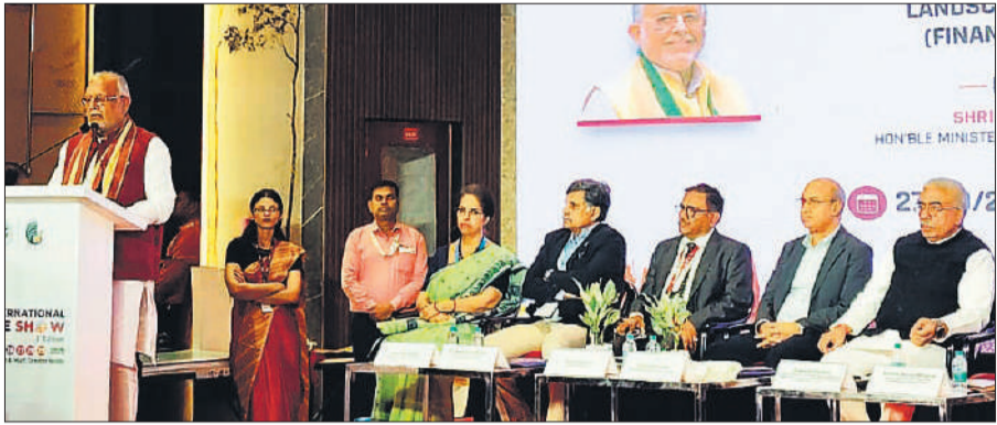
यूपी इंटरनेशनल ट्रेड शो के कार्यक्रम को संबोधित करते वित्त एवं संसदीय कार्य मंत्री सुरेश खन्ना।

खन्ना ने कहा कि यूपी इंटरनेशनल ट्रेड शो प्रदेश ही नहीं बल्कि पूरे देश के उद्यमियों के