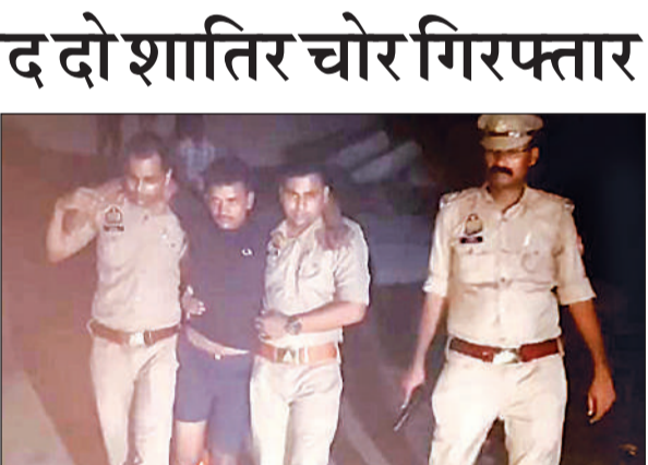
मुठभेड़ में घायल चोरी के आरोपी को ले जाती पुलिस।