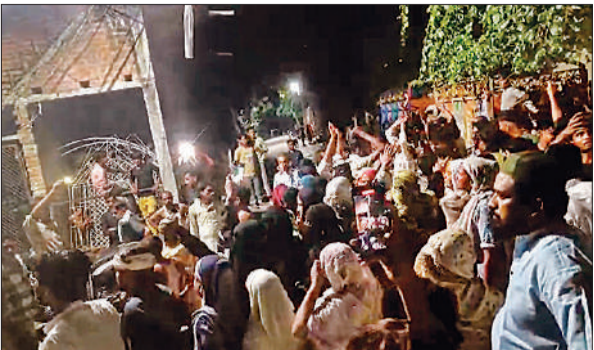
मौके पर हंगामा करते लोग।

थाना क्षेत्र के फैजुल्लागंज में आई लव मोहम्मद लिखकर टांगे गए बैनर