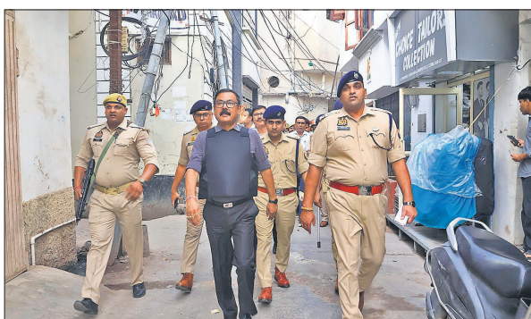
शहर में सुरक्षा व्यवस्था का जायजा लेते डीएम और एसएसपी।

इस दौरान जन जीवन सामान्य पाया गया। दुकानें व स्कूल आदि सामान्य रूप से खुले पाए गए। भ्रमण के समय आमजन और व्यापारियों से बातचीत कर हालातों की भी जानकारी ली। सभी को