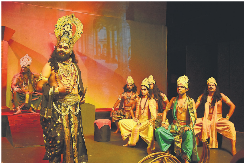
विंडरमेयर थिएटर में रामलीला का मंचन करते कलाकार।