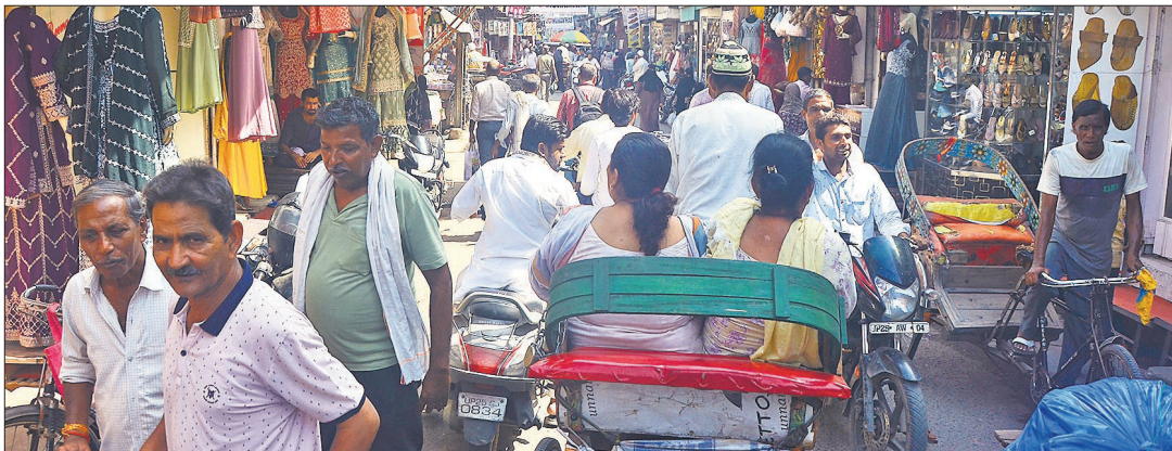
कुतुबखाना - आलमगिरीगंज रोड पर बाजार में दिखी ग्राहकों की भीड़।

दरअसल, शुक्रवार को बवाल के बाद आधा शहर बंद हो गया था। दुकानों के शटर गिर गए थे। शनिवार को बाजार में ग्राहकों की भीड़ दिखा। त्योहारी सीजन के चलते दुकानों पर खरीदारी के लिए लोग पहुंच रहे हैं। पूरे दिन बाजार में ग्राहकों की आवाजाही बनी रही। व्यापारियों ने कहा कि बाजार सामान्य की तरह खुला है। इस्लामिया मार्केट, पंजाबी मार्केट, इंदिरा मार्केट, बड़ा बाजार, कोहाड़ापीर, कुतुबखाना, आलमगिरीगंज और शहामतगंज बाजार में रोज की तरह चहल-पहल दिखा। लोग बिना डरे खरीदारी कर रहे थे। जगह-जगह