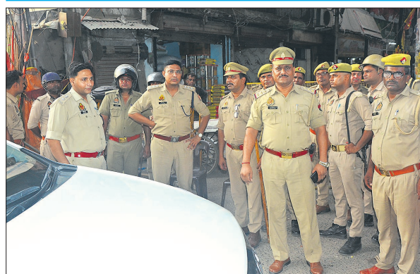
शहामतगंज चौराहे पर तैनात फोर्स।