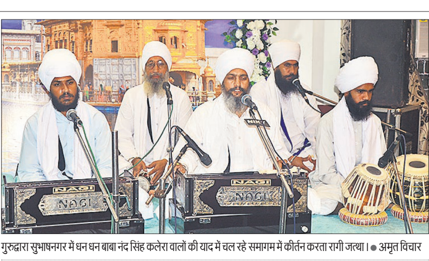
गुरुद्वारा सुभाषनगर में धन धन बाबा नंद सिंह कलेरा वालों की याद में चल रहे समागम में कीर्तन करता रागी जथा।