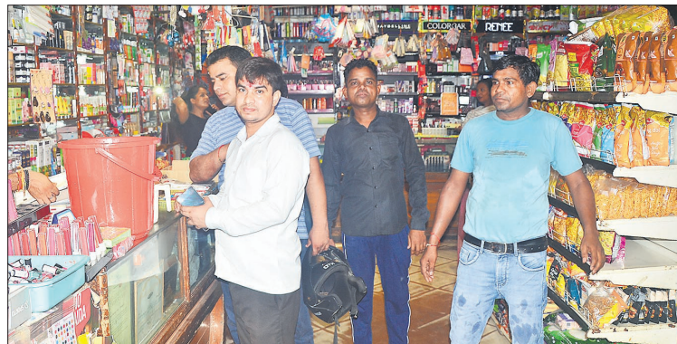
बाजार में एक दुकान पर खरीदारी करते ग्राहक।