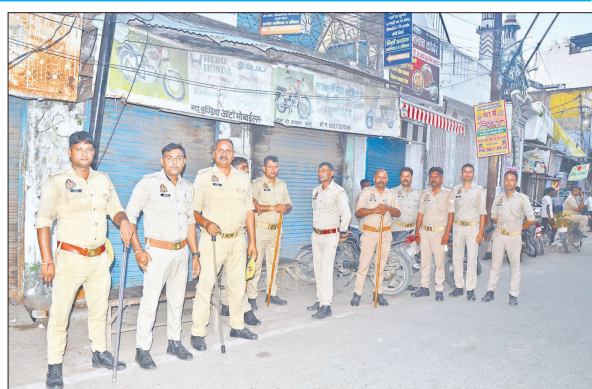
करोलान मस्जिद के पास तैनात फोर्स।