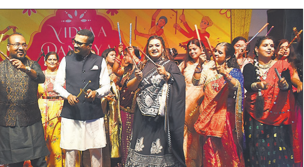
विद्या वर्ल्ड स्कूल में कार्यक्रम में डांडिया खेलते शिक्षक और बच्चे।