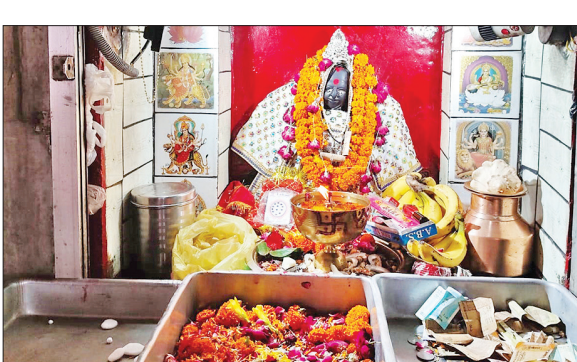
नेकपुर स्थित ललिता देवी मंदिर।