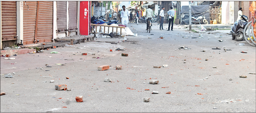
शुक्रवार को शहर में बवाल के बाद सड़क पर बिखरे ईंट-पत्थर।