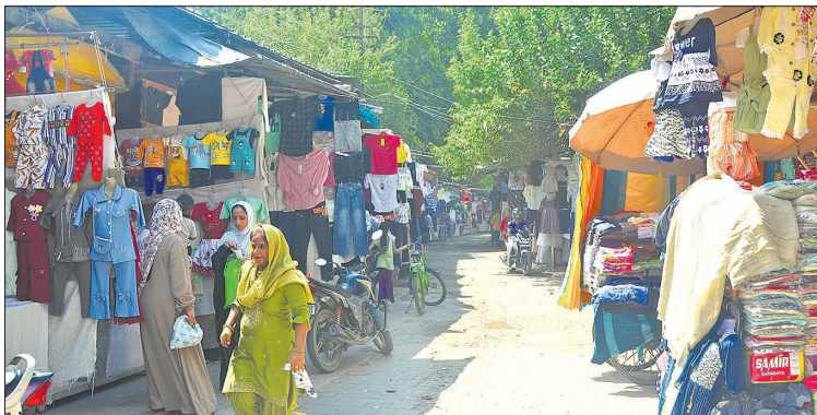
इंदिरा मार्केट भी खुला। दुकानों पर पहुंचते रहे ग्राहक।

शहर का माहौल शांत है, इसलिए सभी बाजार खुले हैं। लोग खरीदारी करने के लिए घरों से निकल रहे हैं। व्यापारियों ने कहा कि सरकार और पुलिस-प्रशासन ने शहर को दंगे की आंच से झुलसने से बचा लिया।