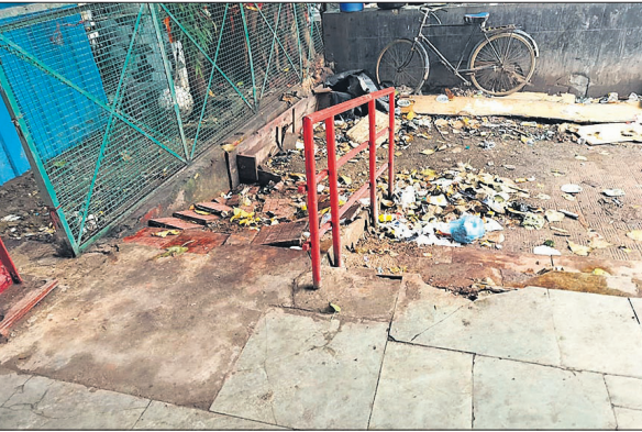
पुराने रोडवेज बस अड्डे पर दिव्यांग रैंप के पास पसरी गंदगी।

अमृत विचार : शहर के पुराना रोडवेज बस अड्डे पर भीषण गंदगी फैली हुई। जहां-तहां गंदगी होने से यात्री परेशान रहते हैं। दिन में हजारों यात्री बसों से सफर करते हैं, लेकिन बस अड्डा परिसर में साफ-सफाई पर ध्यान नहीं दिया जा रहा है। जिससे परिसर में यात्रियों को कई तरह की दिक्कतों का सामना करना पड़ता है। यात्रियों और बसों के आवागमन के लिए बने गेट पर पर ही कचरा पड़ा रहता है। यात्री गंदगी के बीच से गुजर कर बस अड्डे के अन्दर पहुंचते हैं। गेट के पास ही दिव्यांग यात्रियों की सुविधा के लिए बना रैंप भी खस्ताहाल हो चला है। रैंप की टाइलें भी टूटी हैं। रैंप के आसपास भी कचरा फैला रहता है।