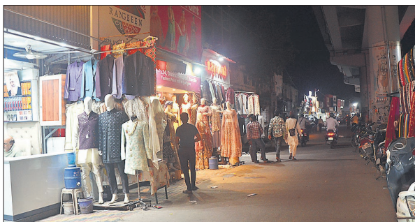
कुतुबखाना पुल के नीचे बाजार में शनिवार रात कम ही लोग नजर आए।

अमृत विचार: शहर में जुमे की नमाज के बाद पुलिस ने उपद्रवियों को लाठीचार्ज करके खदेड़ा था। इसके बाद शहर में डर का माहौल हो गया था। आनन-फानन में लोगों ने अपनी दुकानें बंद कर दी थीं और शहर में सन्नाटा छा गया था। हालांकि शनिवार को हालात ठीक नजर आए। एक दशक पहले शहर के लोग दंगे का दंश झेल चुके हैं। ऐसे में दोबारा से हालात खराब नहीं हो इसको लेकर मुस्लिम बुद्धिजीवी लोगों ने अफवाहों पर ध्यान न देकर शांति बनाए रखने की अपील की है।