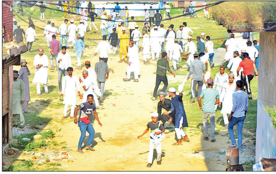
बवाल के दौरान उपद्रवियों ने बच्चों को कर दिया था आगे।