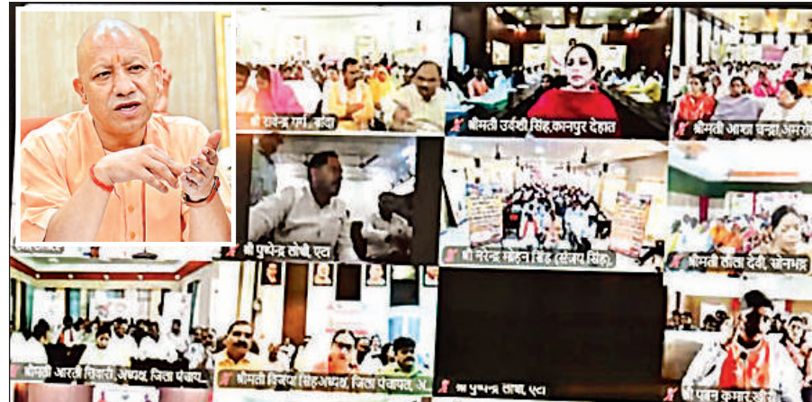
विकसित यूपी@2047 को लेकर पंचायत प्रतिनिधियों से वर्चुअल संवाद करते मुख्यमंत्री योगी आदित्यनाथ ।

‘विकसित यूपी@2047’ संवाद शृंखला के अंतर्गत रविवार को मुख्यमंत्री ने त्रिस्तरीय पंचायत प्रतिनिधियों से वर्चुअल संवाद किया। इस दौरान अभियान से जुड़ी एक वीडियो फिल्म प्रदर्शित की गई और प्रतिनिधियों को क्यूआर कोड व पोर्टल के माध्यम से सुझाव साझा करने की प्रक्रिया से अवगत कराया गया। मुख्यमंत्री ने कहा कि विकसित यूपी@2047 केवल सरकारी कार्यक्रम नहीं, बल्कि सामूहिक चेतना और जनभागीदारी का ऐतिहासिक संकल्प है। उन्होंने स्पष्ट किया कि भारत की आत्मा गांवों में बसती है