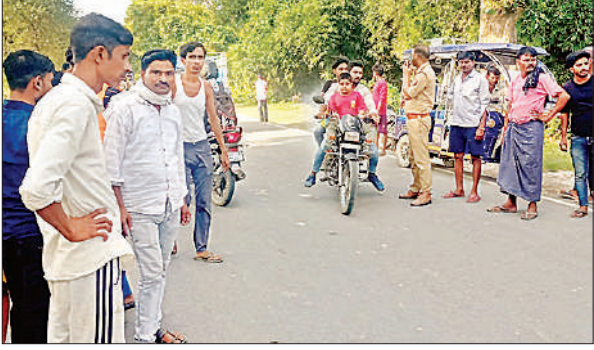
घटनास्थल पर मौजूद लोग।