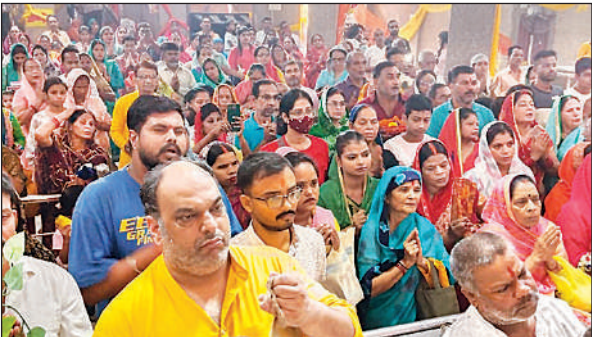
दुर्गा मंदिर में उमड़ी भक्तों की भीड़।