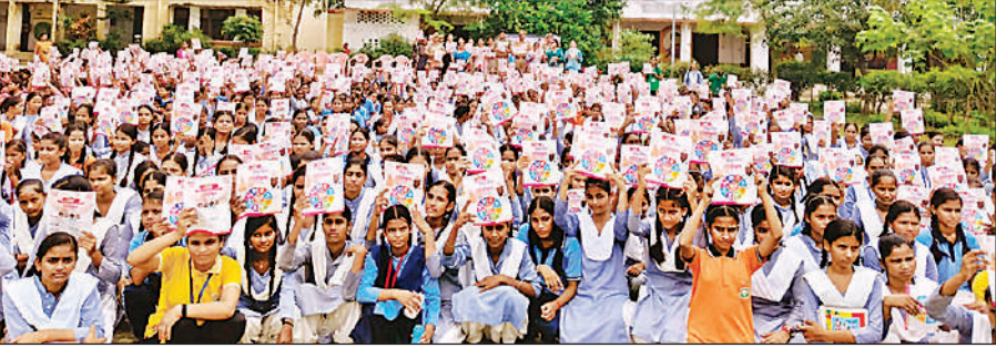
हेल्पलाइन जानकारी कार्यक्रम के दौरान उपस्थित छात्राएं।