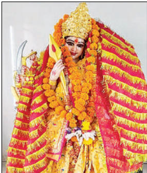
मां कात्यायनी के रूप में बिराजी माता।

दिन भर भजन-कीर्तन से नगर का वातावरण हुआ भक्तिमय