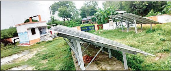
कारीपाकर गांव में करोड़ों खर्च के बाद भी शोपीस बने सोलर पैनल।

अमृत विचार : बिन पानी सब सून ये कहावत अभी भी जनपद के कई गांव में चरितार्थ हो रही है। जल जीवन मिशन शक्ति योजना के तहत बड़ी संख्या में ग्रामीणों को इसका लाभ नहीं मिल रहा है। तीन विकास खण्ड क्षेत्रों में कई गांव ऐसे भी हैं जहां पानी की टंकी अधूरी है, कुछ गांव में घर तक सप्लाई ही नहीं पहुंची है। जल जीवन मिशन शक्ति योजना शासन की बड़ी और महत्वपूर्ण योजना है, ये योजना आमजन को लाभ देने के लिए है। विकास खण्ड पिसावां की बात करें