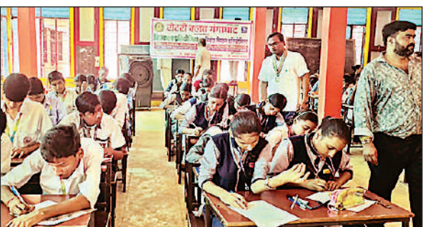
डीएसएम स्कूल में होती निबंध प्रतियोगिता।