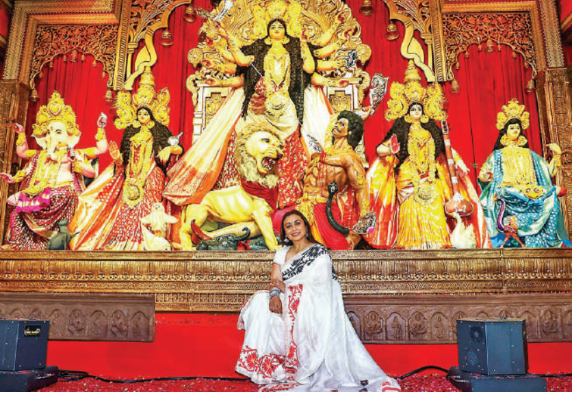
मुंबई में नवरात्रि पर सजाए गए दुर्गा पंडाल में बॉलीवुड अभिनेत्री रानी मुखर्जी ।