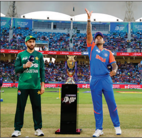
टॉस के दौरान भारतीय कप्तान सूर्यकुमार यादव और पाकिस्तानी कप्तान सलमान आगा।

दुबई में क्रिकेट उत्सव जैसा माहौल ■ दुबई : दुबई अंतर्राष्ट्रीय क्रिकेट स्टेडियम और इसके आसपास का माहौल उत्सव में तब्दील हो गया, जहां भारत बनाम पाकिस्तान एशिया कप फाइनल मैच शुरू होने से कई घंटे पहले ही भारत और पाकिस्तान के प्रशंसक कतारों में लग गए। खेल प्रशंसकों के हंसी-मजाक, गानों और चीयर से माहौल आनंददायक बन गया जिससे मुकाबला खुशनुमा लगने लगा।