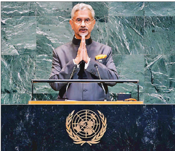
संयुक्त राष्ट्र महासभा में विचार रखते विदेश मंत्री जयशंकर ।

उन्होंने कहा कि भारत आजादी के बाद से आतंकवाद की चुनौती का सामना कर रहा है। जयशंकर के संबोधन के बाद शाम के समय पाकिस्तान ने जवाब देने के अपने अधिकार का इस्तेमाल करते हुए भारत पर आतंकवाद को लेकर झूठे आरोप लगाकर पाकिस्तान की छवि धूमिल करने का आरोप लगाया। पाकिस्तान की प्रतिक्रिया का जवाब देते हुए भारत ने कहा कि यह दर्शाता है कि एक पड़ोसी ने सीमा पार आतंकवाद को बढ़ावा देने की अपनी दीर्घकालिक नीति को स्वीकार कर