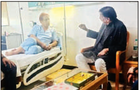
पूर्व सांसद की फेसबुक पर साझा की गई तस्वीर।

अमृत विचार : राज्य सभा के पूर्व सांसद का दावा है कि वे वरिष्ठ सपा नेता आजम खां से दिल्ली में मिले तो उन्होंने कहा है कि उन्हें सीतापुर जेल में धीमा जहर ( स्लो प्वाइजन ) दिया गया। भाजपा के निशान पर वे और उनका परिवार है। हालांकि, इस दावे को सीतापुर कारागार प्रशासन ने एक सिरे से खारिज किया। कारागार अधीक्षक का कहना है कि उपचार