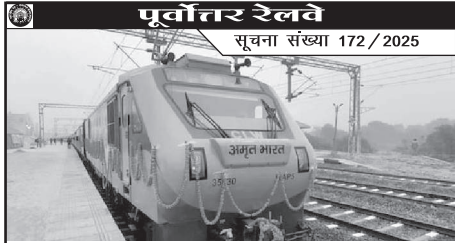
सर्वसाधारण को सूचित किया जाता है कि यात्रियों को सुविधा प्रदान करने हेतु गाड़ी संख्या 15133/ 15134 छपरा–आनन्द विहार (दमिं)–छपरा अमृत भारत एक्सप्रेस (सप्ताह में दो दिन) के संचलन का शुभारम्भ दिनांक 29.09.2025 को छपरा से उद्घाटन विशेष गाड़ी सं. 05133 छपरा–आनन्द विहार को चलाकर किया जाएगा।