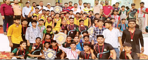
चैंपियन टीम के साथ अतिथिगण।