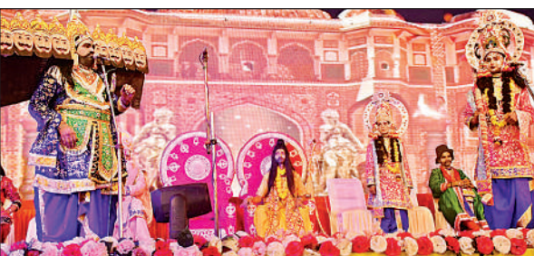
रामलीला का मंचन देखते दर्शक।

झंडेश्वर दुर्गा मंदिर, बिंदानगर का दुर्गा मंदिर, बालुघाट स्थित गायत्री शक्तिपीठ और गंगा विशुनघाट दुर्गा मंदिर सहित अन्य देवी मंदिरों में दिनभर श्रद्धालुओं की भीड़ रही। इसी क्रम में दुर्गा मंदिर में अखंड रामायण पाठ का समापन कर राज्याभिषेक कराया गया, जिसके बाद प्रसाद का वितरण हुआ।