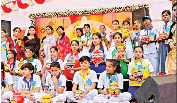
सजे कलशों के साथ प्रतिभागी।