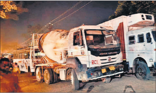
ठाकुरद्वारा-मुरादाबाद रोड पर जाम में फंसे वाहन।