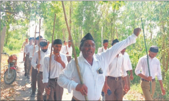
पथ संचलन निकालते स्वयंसेवक।