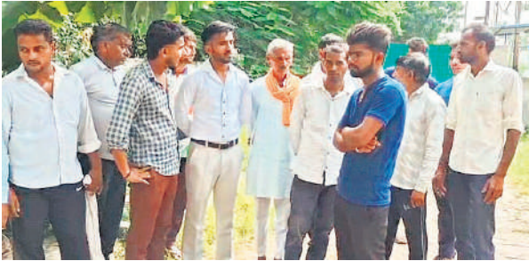
पोस्टमार्टम हाउस पर मौजूद लोग।