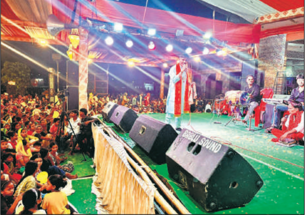
भजन प्रस्तुत करते कलाकार और जागरण में मौजूद लोग

शारदीय नवरात्र पर श्री वासुदेव तीर्थ पर हर वर्ष मां दुर्गा महोत्सव का आयोजन करता है। छठवें दिन मां कात्यायनी की पूजा हुई और रात में जागरण आयोजित किया गया। जागरण में शामिल कलाकारों के भजनों पर श्रद्धालु जमकर झूमे। इस दौरान गायकों की ओर से पेश किए गए प्यारा सजा है देरा द्वार भवानी... भजन पर श्रोतागण ऐसे मंत्रमुग्ध हुए की वह नाचने लगे। श्री अग्रवाल जागरण पार्टी मुरादाबाद के नेतृत्व में कलाकारों द्वारा माता के सुन्दर सुन्दर भजनों