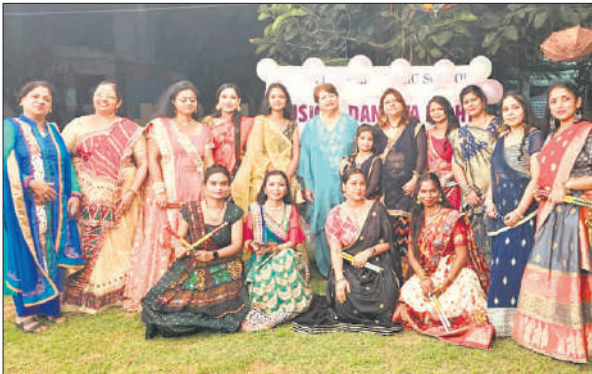
डांडिया के दौरान मौजूद महिलाएं।

हो रहे हैं। निर्णय की आड़ में पूर्व नियुक्त शिक्षकों को परेशान करना न केवल न्याय के विरुद्ध है। मांग है कि सरकार स्पष्ट आदेश जारी कर 2011 से पूर्व नियुक्त शिक्षकों की सेवा सुरक्षा सुनिश्चित करे, जिससे शिक्षकों में व्याप्त असमंजस की स्थिति समाप्त हो सके। सांसद मोहिबुल्लाह नदवी ने कहा कि मैं हमेशा शिक्षकों के साथ खड़ा हूं। हम लगातार शिक्षकों के इस मुद्दे को विभिन्न माध्यमों से रख रहे हैं। आने वाले संसद सत्र में भी इस मुद्दे को सरकार के समक्ष मजबूती के साथ रखने का काम किया जाएगा। संसद सत्र में भी शिक्षकों की आवाज को मजबूती से रखूंगा। आपका पक्ष सरकार तक पहुंचाऊंगा। शिक्षकों