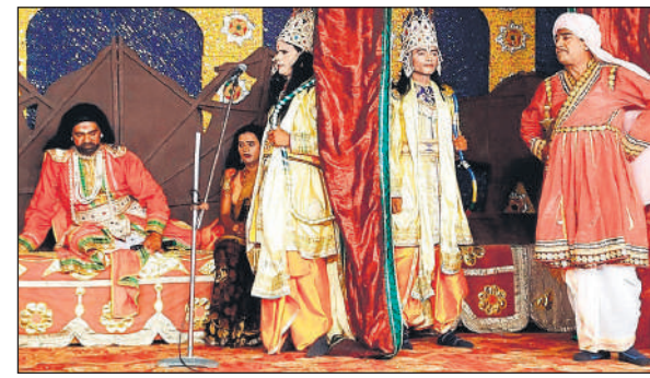
रामलीला के दौरान राम वियोग का मंचन करते कलाकार।