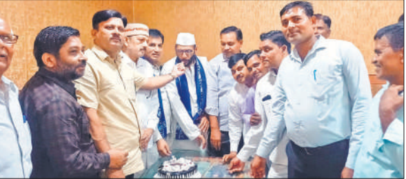
स्थापना दिवस पर केक काटते बसपा कार्यकर्ता।

संभल/ओबरी,अमृत विचार :थाना असमोली क्षेत्र के ग्राम मंसूरपुर माफी में मिशन जागरूकता चौपाल का आयोजन किया गया। महिलाओं और छात्राओं को सुरक्षा, सम्मान और साइबर सुरक्षा जैसे महत्वपूर्ण विषयों पर जानकारी दी गई।