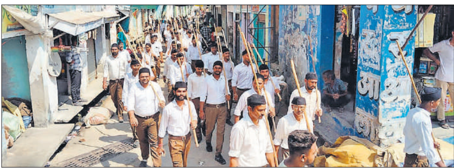
ठाकुरद्वारा के सुरजन नगर में राष्ट्रीयस्वयंसेवक संघ द्वारा पथ संचलन।

पथ संचलन की शुरुआत सुरजन नगर स्थित बंधन बैंकवट हॉल से हुई। वहां से संचलन पुलिस चौकी, बिश्नोई मंदिर, शिव मंदिर, झंडा चौक, ताना माकेट, बस स्टैंड, सैनी होली चौक, भवानीपुर शिव मंदिर, गांधी आश्रम होते हुए पुनः बंधन