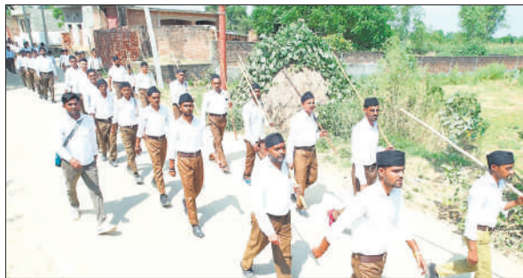
बहजोई के चंदनकटी मौजा में पथ संचलन निकालते स्वयंसेवक।

छलपूर्वक सीता का हरण कर लेता है। रास्ते में जटायु ने सीता की रक्षा के लिए रावण को रोकने का प्रयास किया और वीरगति को प्राप्त हुए।