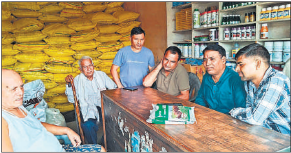
प्रधानमंत्री के मन की बात सुनते भाजपाई।