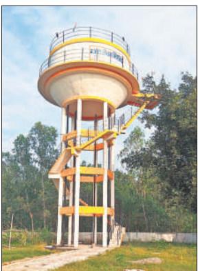
ब्लॉक मिलक के ग्राम देवरी बुजुर्ग में बना ओवरहेड टैंक। ● अमृत विचार

की न तो मरम्मत की जा रही है और न ही रिबोर हो रहे हैं। इसके अलावा