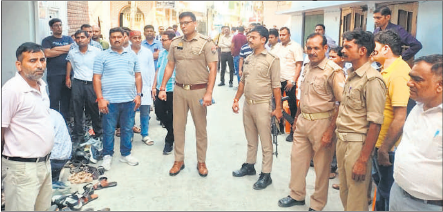
चंदौसी में माध्यमिक शिक्षा मंत्री गुलाब देवी के घर के बाहर मौजूद शिक्षक व तैनात पुलिस।

शिक्षकों के ऑफलाइन स्थानांतरण की सूची जारी न करने से नाराज होकर कई जनपदों के शिक्षकों ने चंदौसी में माध्यमिक शिक्षा मंत्री गुलाब देवी के घर के बाहर धरना शुरू किया है। धरना समाप्त कराने के लिए जहां मंत्री खुद शिक्षकों के बीच पहुंची वहीं पुलिस प्रशासन के जरिये भी प्रयास किये गये। शिक्षक मांग पूरी होने से पहले धरना समाप्त करने को तैयार नहीं हैं। चौथे दिन भी शिक्षक धरने पर डटे रहे। इस बीच रविवार को धरना