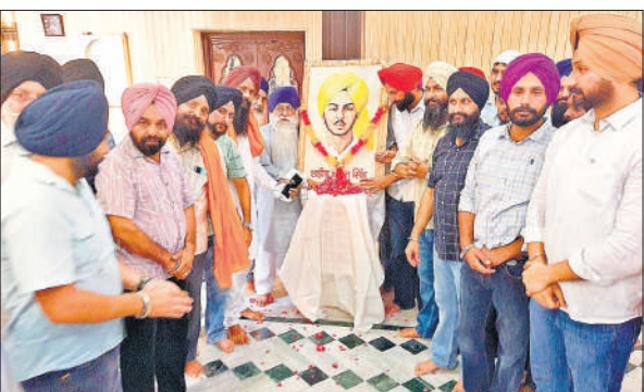
शहीद भगत सिंह के चित्र पर पुष्प अर्पित करते पदाधिकारी