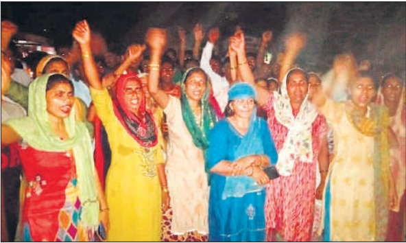
रामू वाला चौराहे पर पुलिस के खिलाफ नारेबाजी करती महिलाएं।