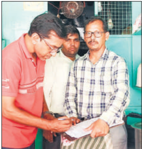
नमूने लेती टीम।