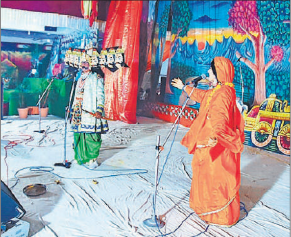
रामलीला मैदान स्थित मंच पर मंचन करते कलाकार।