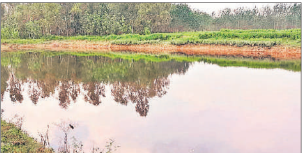
ब्लॉक मिलक में मनरेगा मजदूरों से खोदवाया तालाब।

जिले के चार ब्लॉकों में भू गर्भ स्तर नीचे गिर गया था जिसके चलते चारों ब्लॉकों को डार्क जोन घोषित कर दिया था। जिसके चलते किसानों को बोरांग कराने के लिए भी मनाही कर दी गई थी। लेकिन, जिला अधिकारी जोगिन्दर सिंह के प्रयास से तालाबों की भूमि को कब्जा मुक्त कराकर तालब खोदवाए जा रहे हैं। वर्ष 2024-25 में जिले भर में 250 तालाब खोदवाए गए। तालाबों के खोदवाए जाने से जिले के भू गर्भ में जल स्तर बेहतर हुआ है। वर्ष 2025-26 के लिए जिले को 242