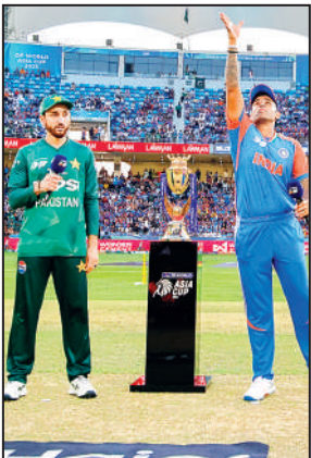
टॉस के दौरान भारतीय कप्तान सूर्यकुमार यादव और पाकिस्तानी कप्तान सलमान आगा।

दुबई : भारत और पाकिस्तान के बीच एशिया कप फाइनल से पहले भी तनाव जारी रहा जब टॉस के समय कप्तानों के इंटरव्यू भारत के रवि शास्त्री और पाकिस्तान के वकार युनुस ने लिए। अंतर्राष्ट्रीय क्रिकेट के इतिहास में पहली बार दो पूर्व खिलाड़ियों ने टॉस के समय इंटरव्यू किए। पाकिस्तानी टीम फाइनल में भारतीय प्रस्तोता शास्त्री से बात नहीं करना चाहती थी। प्रसारकों से पता चला कि टूर्नामेंट में इससे पहले भारत पाकिस्तान मैचों के दौरान टॉस के समय कप्तानों से बात करने वाले शास्त्री को फाइनल में भी टॉस के बाद सूर्यकुमार और सलमान अली आगा से बात करनी थी। पाकिस्तान क्रिकेट बोर्ड ने हालांकि एशियाई क्रिकेट परिषद से तटस्थ प्रस्तोता की तांग की। एसीसी ने जब बीसीसीआई से संपर्क किया तो भारतीय बोर्ड ने साफ तौर पर कहा कि शास्त्री को हटया नहीं जायेगा।