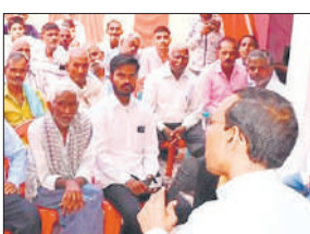
ग्रामीणों को संबोधित करते विधायक।

विधायक ने कहा कि जब वह पढ़ाई कर रहे थे तो देखा कि ग्रामीण क्षेत्रों में सड़कों की व्यवस्था अत्यंत जर्जर थी। उस दौरान ग्रामीणों की समस्याएं देखकर बहुत परेशानी होती थी। तब उन्होंने प्रण लिया कि अगर मौका मिला तो वह विधानसभा की कोई भी ऐसी ग्राम पंचायत नहीं छोड़ेगे जिसमें सड़क दुरुस्त न हो। यह लोगों की मूलभूत सुविधाओं