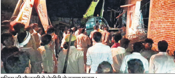
पुलिस की मौजूदगी में जेसीबी से हटाया मलबा।