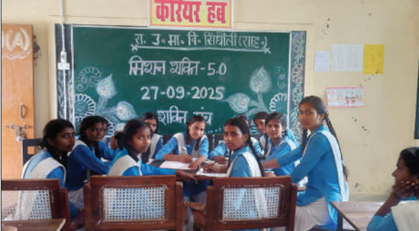
राजकीय उच्च माध्यमिक विद्यालय सिंधौली में गठित छात्राओं का शक्ति मंच ।

उन्होंने बताया की अस्पताल में 100 बेड फेशिलिटी के साथ साथ एक्सरे, अल्ट्रासाउंड व ऑपरेशन की सुविधा भी है। जहां डेंटल, महिला विशेषज्ञ फिजिशियन आदि डॉक्टर प्रतिदिन ओपीडी कर लोगों को सुविधा दे रहे हैं। उन्होंने बताया कि समय समय पर अस्पताल की ओर से ब्लड डोनेशन कैंप व जांच कैंप लगावते रहते हैं।