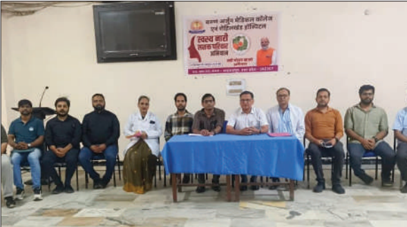
ईट राइट कैम्पेन में मौजूद डॉक्टरों की टीम ।

कार्यक्रम का आयोजन कम्युनिटी मेडिसिन विभाग के तत्वावधान में हुआ, जिसमें सभी संकाय सदस्य, पीजी छात्र एवं मेडिकल कॉलेज के विद्यार्थियों ने सक्रिय भागीदारी करते हुए स्वस्थ आहार और संतुलित पोषण के महत्व पर विस्तृत जानकारी दी।