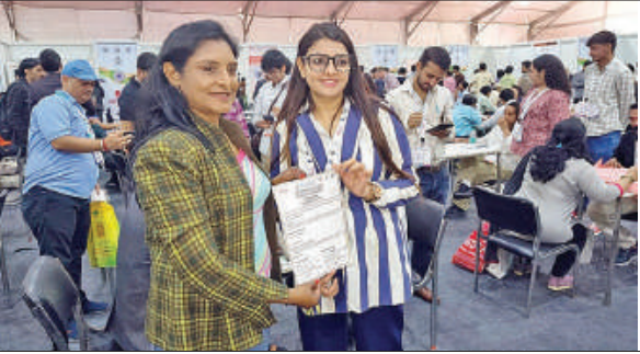
यूपी ट्रेड शो में ऑन द स्पॉट बीबी मीटिंग में एमओयू दिखाती युवा उद्यमी।

यूपीआईटीएस 2025 ने यह साबित किया कि सही नीति और मजबूत नेतृत्व से महिलाएं न केवल अपने सपनों को पूरा कर सकती हैं, बल्कि प्रदेश के विकास में भी भागीदार बन सकती हैं। यहां महिला उद्यमियों ने साबित किया कि वे सिर्फ जॉब सीकर नहीं, बल्कि जॉब क्रिएटर बनकर प्रदेश की अर्थव्यवस्था को नई ऊंचाइयों तक ले जा रही हैं। योगी सरकार की