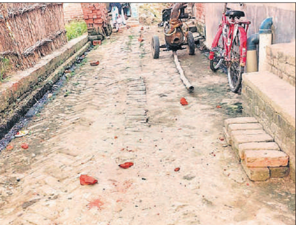
दो पक्षों में हुए पथराव के बाद गली में पड़े पत्थर।

ग्रामीणों का कहना है कि दोनों परिवारों के बीच आए दिन इसी तरह लाठी-डंडे और पत्थर चलने की घटनाएं होती रहती हैं, जिससे पूरा मोहल्ला दहशत और परेशानी में है।