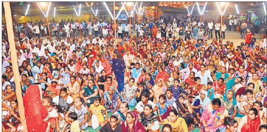
नगर में रामलीला मंचन को देखने उमड़ी कस्बे की भीड़।

सुग्रीव से मित्रता के बाद जब भगवान राम ने सुग्रीव की पीड़ा सुनी कि उसके भाई महाबली बाली ने उसकी पत्नी तारा का हरण कर उसे मार कर महल से निकाल दिया है और वह उससे बचने के लिए किष्कंधा पर्वत पर रह रहा है। मित्र की पीड़ा को सुन भगवान राम ने बाली को ललकारने के लिए सुग्रीव को भेजा। जैसे ही सुग्रीव ने बाली को उसके महल पर जाकर ललकारा तो बाहर आए बाली ने सुग्रीव पर प्रहार कर उस पर हमला कर दिया। इसी बीच भगवान राम ने बाली को प्राप्त वरदान के कारण पेड़ की ओर से बाली पर तीर का प्रहार कर दिया जिस पर मरणासन्न