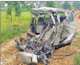
भीषण हादसे में क्षतिग्रस्त हुई वैन।