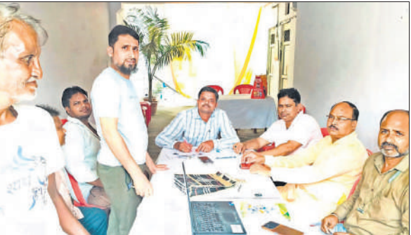
शिविर में व्यापारियों ने नए लाइसेंस बनवाए व पुराने का नवीनीकरण कराया।