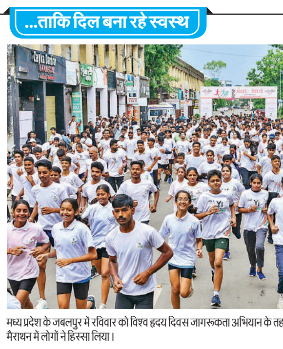
मध्य प्रदेश के जबलपुर में रविवार को विश्व हृदय दिवस जागरूकता अभियान के तहत आयोजित माइल्स फॉर स्माइल मैराथन में लोगों ने हिस्सा लिया।

सम्मान समारोह में मुख्यमंत्री यादव ने मंगेशकर को श्रद्धांजलि देते हुए कहा, भारत रत्न लता मंगेशकर ने अपने स्वर से भारतीय संगीत को नई ऊंचाइयों पर पहुंचाया। उनके नाम पर दिया जाने वाला यह सम्मान अद्वितीय है। यह उन कलाकारों के योगदान को नमन है जिन्होंने गीत-संगीत के क्षेत्र में अमिट छाप छोड़ी है।