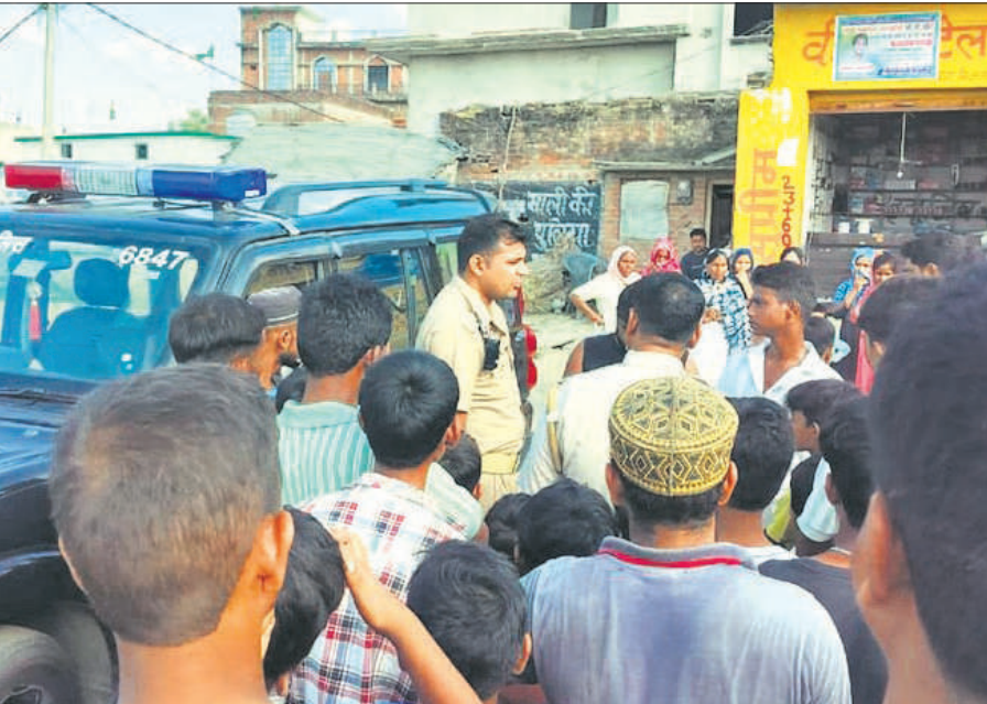
विवाद के बाद गगइया गांव के लोगों को समझाती पुलिस।

दोनों पक्षों ने डायल 112 पर कॉल की। सूचना पर पहुंची पुलिस ने सादिक के दोनों