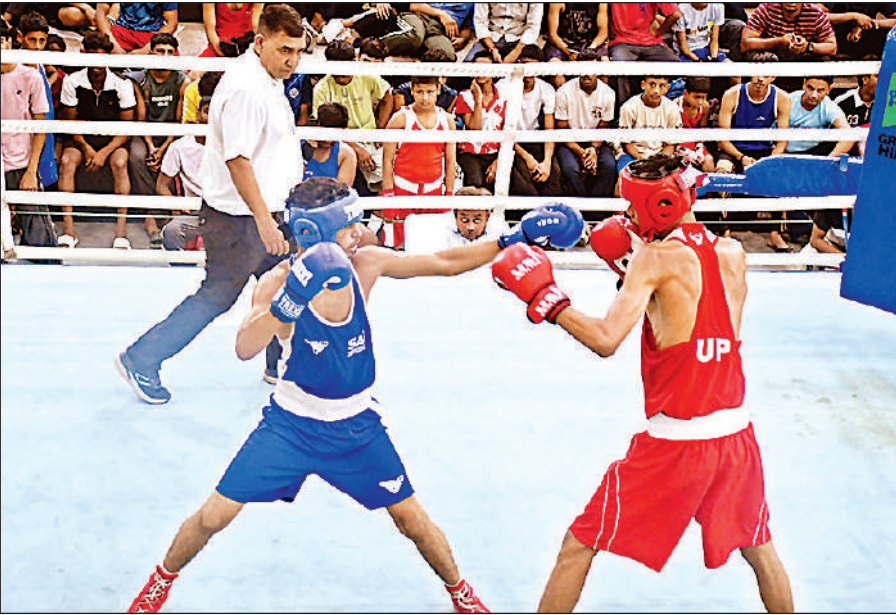
केडी सिंह बाबू स्टेडियम के बोक्सिंग हॉल में प्रादेशिक विद्यालयीय बोक्सिंग प्रतियोगिता में रिंग में अंक के लिए संघर्ष करते खिलाड़ी।