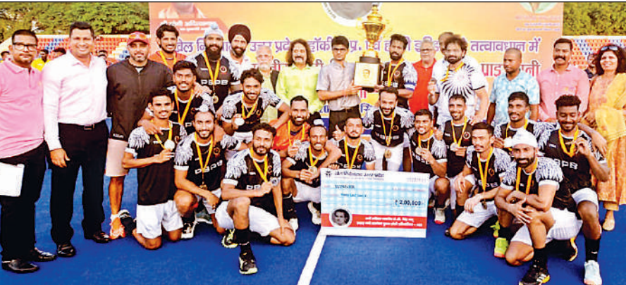
विजेता टीम के कप्तान को ट्रॉफी देते खेल सचिव, साथ में आयोजन समिति के सदस्य और अतिथि।