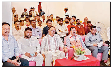
कार्यक्रम में मौजूद उप मुख्यमंत्री ब्रजेश पाठक व अन्य।