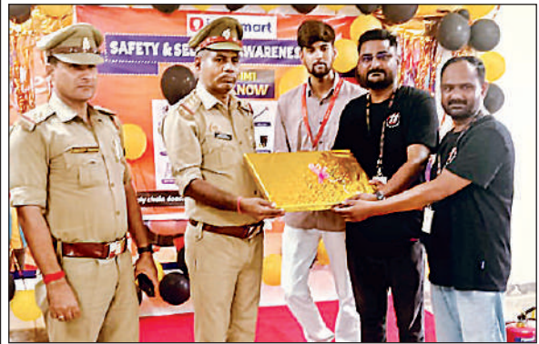
पुलिसकर्मियों को सम्मानित करते वेयरहाउस के लोग।