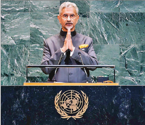
संयुक्त राष्ट्र महासभा में विचार रखते विदेश मंत्री जयशंकर ।

उन्होंने कहा कि भारत आजादी के बाद से आतंकवाद की चुनौती का सामना कर रहा है। जयशंकर के संबोधन के बाद शाम के समय पाकिस्तान ने जवाब देने के अपने अधिकार का इस्तेमाल करते हुए भारत पर आतंकवाद को लेकर झूठे आरोप लगाकर पाकिस्तान की छवि धूमिल करने का आरोप लगाया। पाकिस्तान की प्रतिक्रिया का जवाब देते हुए भारत ने कहा कि यह दर्शाता है कि एक पड़ोसी ने सीमा पार आतंकवाद को बढ़ावा देने की अपनी दीर्घकालिक नीति को स्वीकार कर