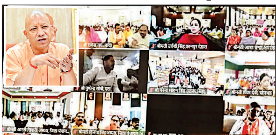
विकसित यूपी@2047 को लेकर ब्लाक प्रमुखों से वर्चुअल संवाद करते मुख्यमंत्री योगी आदित्यनाथ।

‘विकसित यूपी@2047’ संवाद शृंखला के अंतर्गत रविवार को मुख्यमंत्री ने त्रिस्तरीय पंचायत प्रतिनिधियों से वर्चुअल संवाद किया। इस दौरान अभियान से जुड़ी एक वीडियो फिल्म प्रदर्शित की गई और प्रतिनिधियों को क्यूआर कोड व पोर्टल के माध्यम से सुझाव साझा करने की प्रक्रिया से अवगत कराया गया। मुख्यमंत्री ने कहा कि विकसित यूपी@2047 केवल सरकारी कार्यक्रम नहीं, बल्कि सामूहिक चेतना और जनभागीदारी के ऐतिहासिक संकल्प है। उन्होंने स्पष्ट किया कि भारत की आत्मा गांवों में बसती है