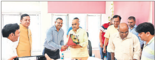
मुख्य अतिथि का स्वागत करते लोग।