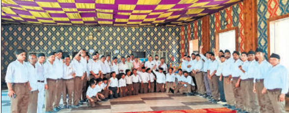
पंथ संचलन के बाद खड़े स्वयंसेवक।