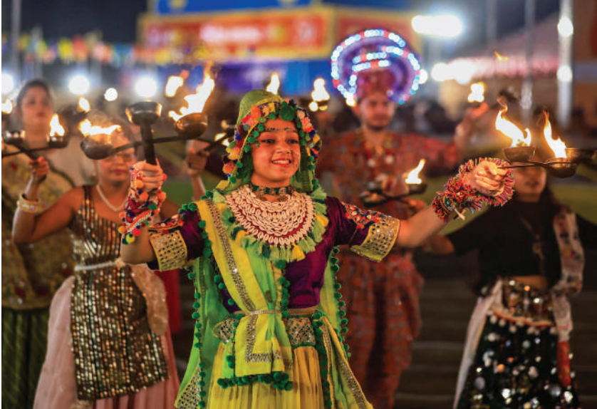
जयपुर में नवरात्रि के अवसर पर गरबा करती युवतियां ।