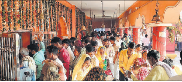
कैला देवी मंदिर में देवी दर्शन के लिए लगी श्रद्धालुओं की भीड़।

इसके साथ ही मुख्यमंत्री ने महिलाओं को आत्मनिर्भर बनाने की दिशा में कार्य करने पर जोर दिया। इस संदर्भ में चेयरमैन द्वारा प्रस्तुत कान्हा गौशाला में गोवंश के गोबर से लकड़ी और अन्य उत्पाद बनाने के प्रस्ताव की मुख्यमंत्री ने सराहना की। मुख्यमंत्री योगी आदित्यनाथ ने चेयरमैन से कहा कि वह जिला प्रशासन से मिल कर सुझाव दें। ऐसी योजनाएं तैयार करने के निर्देश प्रशासन को पहले ही दिए जा चुके हैं।