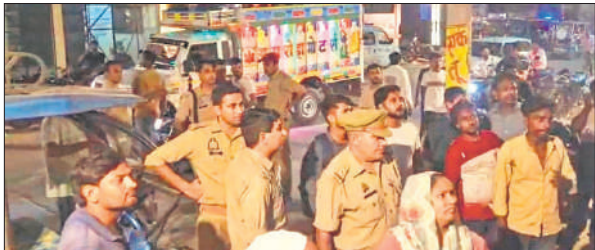
मौके पर मौजूद पुलिस।