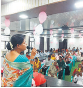
संबोधित करती जिला पंचायत अध्यक्ष।