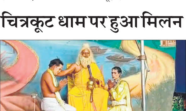
रामलीला का मंचन करते कलाकार।