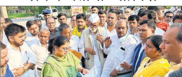
ज्ञापन देते जाटव समाज के लोग।