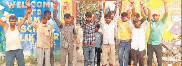
स्कूल में गंदगी को लेकर प्रदर्शन करते अभिभावक।