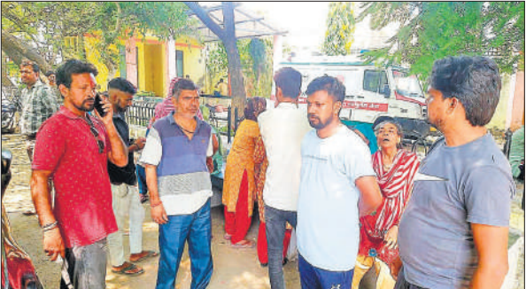
जिला अस्पताल में खड़े परिजन।