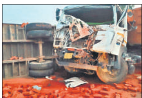
हादसे के बाद क्षतिग्रस्त ट्रक।