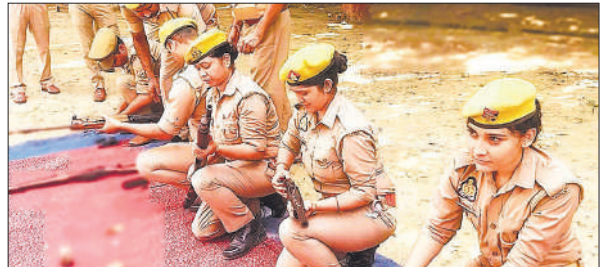
पुलिस लाइन में आधुनिक हथियारों का प्रशिक्षण लेती महिला पुलिस कर्मी।