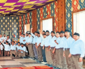
पंथ संचलन के बाद खड़े स्वयंसेवक।