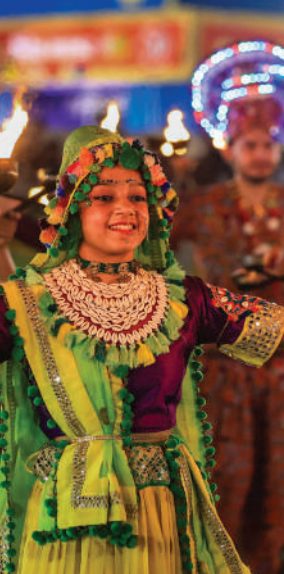
जयपुर में नवरात्रि के अवसर पर गरबा करती युवतियां ।