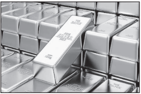
● सोना भी 1,500 रुपये चढ़कर 1,19,500 रुपये के नए शिखर पर

गोयल ने जीएसटी दरों में हालिया कमी को आजादी के बाद का सबसे बड़ा सुधार बताया। उन्होंने कहा कि अब जो भी सामान हम खरीदते हैं उसमें यथासंभव स्वदेशी वस्तु खरीदने का संकल्प लेना चाहिए।