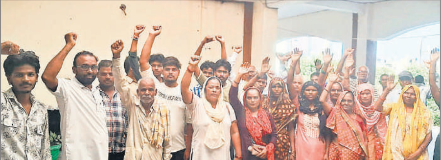
तहसील परिसर में प्रदर्शन करते आक्रोशित लोग।