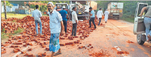
सड़क पर बिखरी ईंटें।