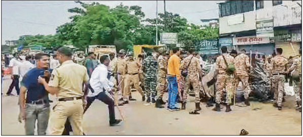
सड़क पर लिखे आई लव मुहम्मद के खिलाफ प्रदर्शन कर रहे लोगों को खदेड़ती पुलिस।

थर्ड अंपायर कहने पर युद्धविराम नहीं करते : कांग्रेस नई दिल्ली। कांग्रेस ने सोमवार को प्रधानमंत्री पर कटाक्ष करते हुए कहा कि उन्हें भारतीय क्रिकेट टीम से यह सीखने की जरूरत है कि जब जीत के करीब हों, तो किसी थर्ड अंपायर के कहने पर अच्छे कप्तान युद्धविराम नहीं करते। कांग्रेस के मीडिया विभाग के प्रमुख पवन खेड़ा ने एक्स पर पोस्ट किया कि मोदी जी, क्रिकेट मैच की तुलना युद्ध से करना ठीक नहीं है। भारतीय टीम से ये सीखने की जरूरत है कि जीत के करीब हों, तो किसी थर्ड अंपायर के कहने पर सीजफायर नहीं करते।