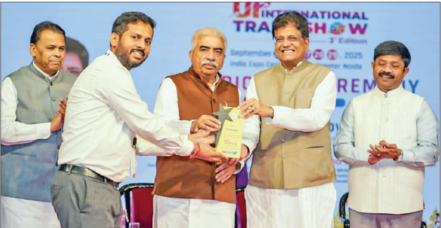
ग्रेटर नोएडा में यूपीआईटीएस के समापन पर प्रतिभागी को सम्मानित करते केंद्रीय मंत्री पीयूष गोयल।

नई दिल्ली। बिजली, वाहन और इन्वर्टर के ट्रांसफॉर्मर बनाने वाली कंपनी अटलांटा इलेक्ट्रिकल्स लिमिटेड का शेयर अपने निर्गम मूल्य 754 रुपये से 14 प्रतिशत की बढ़त के साथ सोमवार को बाजार में सूचीबद्ध हुआ। बीएसई पर शेयर ने 858.10 रुपये पर शुरुआत की जो निर्गम मूल्य से 13.80 प्रतिशत की बढ़त दर्शाता है। बाढ़ में यह 14.54 प्रतिशत बढ़कर 863.70 रुपये पर पहुंच गया। एनएसई पर शेयर 13.66 प्रतिशत के बढ़त के साथ 857 रुपये पर सूचीबद्ध हुआ। कंपनी का बाजार मूल्यंकन 6,323.21 करोड़ रुपये रहा।