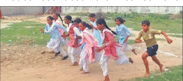
प्रतियोगिता में प्रतिभाग करती छात्राएं।