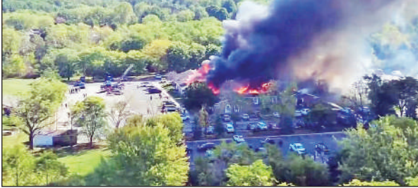
हमले के बाद इमारत में लगी आग।