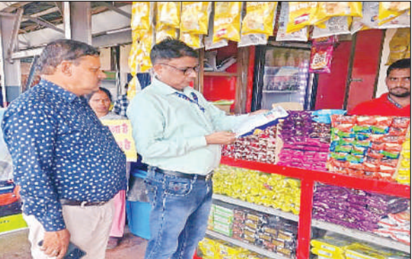
पीलीभीत स्टेशन पर खानपान स्टॉल की जांच करते हुए रेलकर्मी।