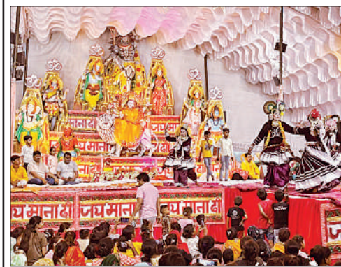
गाड़ी बाजार में आयोजित जगारते में नृत्य प्रस्तुत करते कलाकार।