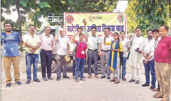
जागरूकता अभियान में मौजूद स्वदेशी जागरण मंच के पदाधिकारी व सदस्य।