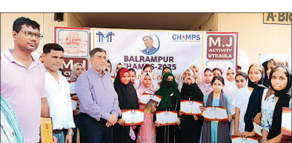
टीएमटी द्वारा सम्मानित किए गए मेधावी।