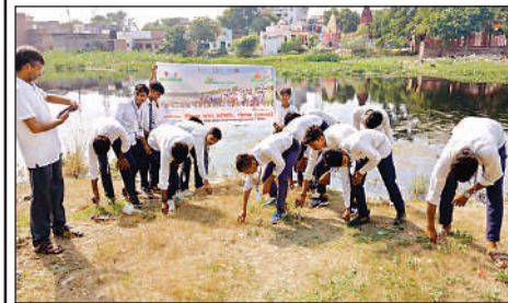
टेढ़ी नदी की सफाई करते युवा।