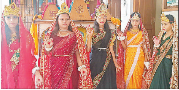
मिशन शक्ति कार्यक्रम में प्रस्तुति देती छात्राएं।