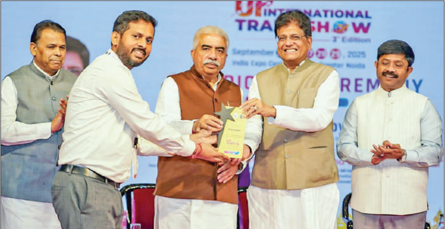
ग्रेटर नोएडा में यूपीआईटीएस के समापन पर प्रतिभागी को सम्मानित करते केंद्रीय मंत्री पीयूष गोयल।

नई दिल्ली। बिजली, वाहन और इन्वर्टर के ट्रांसफॉर्मर बनाने वाली कंपनी अटलांटा इलेक्ट्रिकल्स लिमिटेड का शेयर अपने निर्गम मूल्य 754 रुपये से 14 प्रतिशत की बढ़त के साथ सोमवार को बाजार में सूचीबद्ध हुआ। बीएसई पर शेयर ने 858.10 रुपये पर शुरुआत की जो निर्गम मूल्य से 13.80 प्रतिशत की बढ़त दर्शाता है। बाढ़ में यह 14.54 प्रतिशत बढ़कर 863.70 रुपये पर पहुंच गया। एनएसई पर शेयर 13.66 प्रतिशत के बढ़त के साथ 857 रुपये पर सूचीबद्ध हुआ। कंपनी का बाजार मूल्यंकन 6,323.21 करोड़ रुपये रहा।