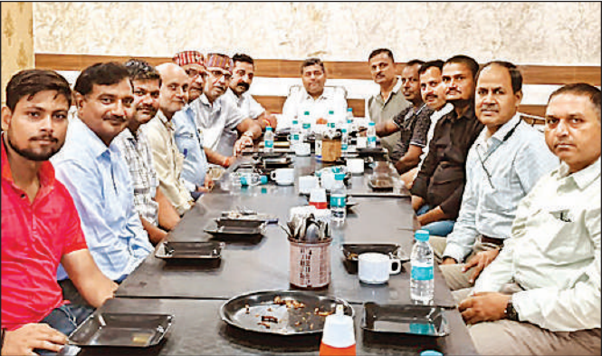
एक होटल में बैठक करते पूर्व सैनिक।