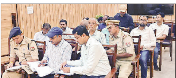
बैठक में मौजूद एआरटीओ साथ में ट्रांस्पॉर्ट यूनियन की पदाधिकारी।

डीएम ने एनएच 128 टंडा-रायबरेली के प्रतिनिधि द्वारा पूर्व में दिए गए निर्देशों के अनुपालन के बारे में स्पष्ट सूचना नहीं प्रस्तुत करने के कारण परियोजना निदेशक को अगले सप्ताह पूर्ण सूचना के साथ उपस्थित होना का निर्देश दिया। अधिशासी अभियंता पीडब्ल्यूडी सचिव जिला सड़क