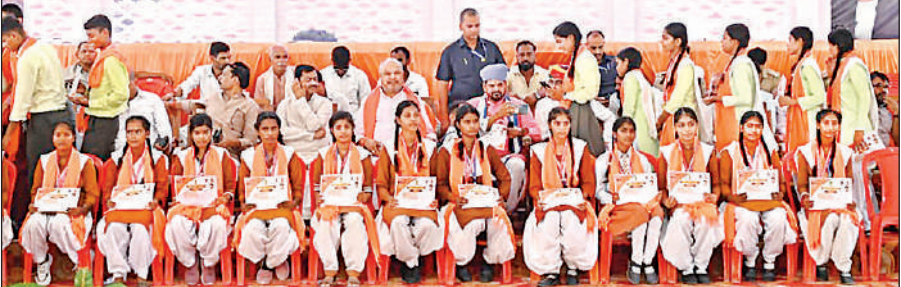
पुरस्कृत प्रतिभाओं के साथ पूर्व सांसद बृजभूषण शरण सिंह।

इस दौरान पूर्व सांसद बृजभूषण शरण सिंह ने छात्रों को संबोधित करते हुए कहा कि मेहनत, लगन और ईमानदारी ही जीवन में स्थायी सफलता दिलाती है। आपकी प्रतिभा ही समाज और राष्ट्र का भविष्य