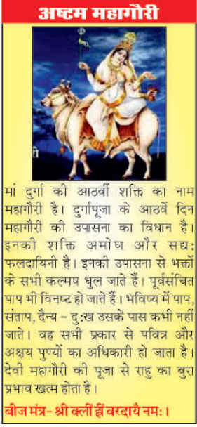
मां दुर्गा की आठवीं शक्ति का नाम महागोरी है। दुर्गापूजा के आठवें दिन महागोरी की उपासना का विधान है। इनकी शक्ति अमोघ और सद्यः फलदायिनी है। इनकी उपासना से भक्तों के सभी कलमप धूल जाते हैं। पूर्वसंचित पाप भी विनष्ट हो जाते हैं। भविष्य में पाप, संताप, दैन्य – दुःख उसके पास कभी नहीं जाते। वह सभी प्रकार से पवित्र और अक्षय पुण्यों का अधिकारी हो जाता है। देवी महागोरी की पूजा से राहु का बुरा प्रभाव खत्म होता है।

बीज मंत्र- श्री क्लीं ह्रीं वरदायै नमः ।