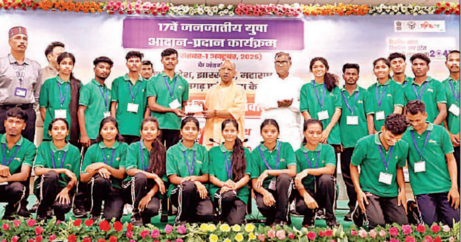
17वें जनजातीय युवा आदान-प्रदान कार्यक्रम में विभिन्न प्रदेशों से आए युवाओं के साथ मुख्यमंत्री योगी।

योगी सोमवार को अपने आवास पर आयोजित 17वें जनजातीय युवा आदान-प्रदान कार्यक्रम में मध्य प्रदेश, झारखंड, महाराष्ट्र, छत्तीसगढ़ और उड़ीसा से आए करीब 200 युवा प्रतिनिधियों को संबोधित कर रहे थे। यह आयोजन 25 सितंबर से शुरू हुआ है, जो पहली अक्टूबर तक चलेगा। मुख्यमंत्री ने युवाओं को प्रधानमंत्री नरेंद्र मोदी के पंच प्रण को जीवन में आत्मसात करने की प्रेरणा दी।