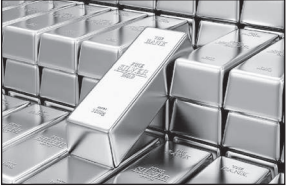
● सोना भी 1,500 रुपये चढ़कर 1,19,500 रुपये के नए शिखर पर

प्रति 10 ग्राम थी। वहीं 99.5 प्रतिशत शुद्धता वाला सोना भी 1,500 रुपये की तेजी के साथ 1,18,900 रुपये प्रति 10 ग्राम के रिकॉर्ड स्तर पर पहुंच गया, जो शनिवार को 1,17,400 रुपये प्रति 10 ग्राम था।