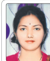
प्रेरणा अवस्थ लेखिका

संपूर्ण संसार में यदि सर्वाधिक शक्तिशाली कोई है, तो वह है मन। मन को किसी ने देखा नहीं है, किंतु मन के अंदर शक्तियों का अपार भंडार विद्यमान है। एक सूक्ति है, 'मन के हारे हार है मन के जीते जीत'। मन के अंदर असीम क्षमताएं एवं संभावनाएं विद्यमान हैं। जिस प्रकार हम पदार्थ के सूक्ष्मतम कण अर्थात् परमाणु को नहीं देख पाते, किंतु उसमें