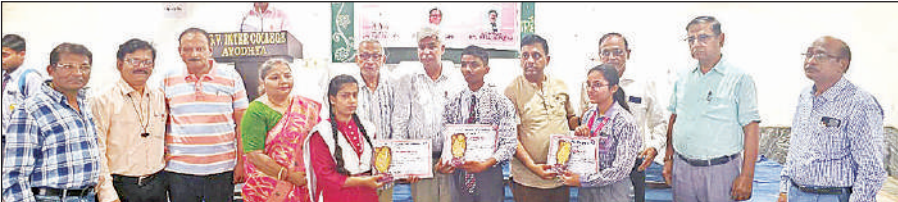
एसएसवी इंटर कॉलेज में आयोजित कार्यक्रम में विजेता प्रतिभागियों को पुरस्कृत करते अतिथि।