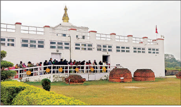
लुम्बिनी स्थित माया देवी मंदिर में दर्शन के लिए कतार में लगे श्रद्धालु।