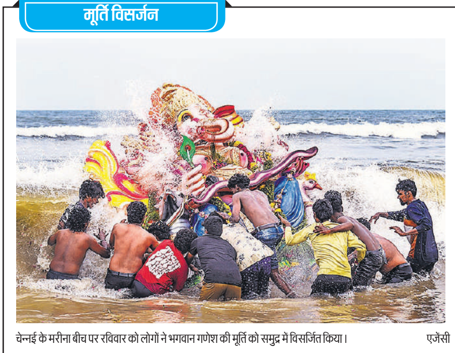
चेन्नई के मरीना बीच पर रविवार को लोगों ने भगवान गणेश की मूर्ति को समुद्र में विसर्जित किया।

चेन्नई। समग्र शिक्षा अभियान (एसएसए) योजना के तहत केंद्र द्वारा धनराशि रोके जाने के खिलाफ 29 अगस्त से अनिश्चितकालीन अनशन कर रहे कांग्रेस सांसद शशिकांत सैंथिल को स्वास्थ्य संबंधी समस्याएं हो गई हैं और वह शनिवार रात से अस्पताल में भर्ती हैं। नेता ने रविवार को यह जानकारी दी। हालांकि, 46 वर्षीय सैंथिल ने कहा कि वह चेन्नई के राजीव गांधी सरकारी जनरल अस्पताल में अपना विरोध तब तक जारी रखेंगे, जब तक कि राज्य को एसएसए योजना के तहत धनराशि जारी नहीं कर दी जाती। पूर्व आईएएस अधिकारी सैंथिल ने कहा, अपने अनशन के तीसरे दिन, मुझे उच्च रक्तचाप के कारण अस्पताल में भर्ती कराया गया। निवृत्तियों की सलाह पर, मुझे अब तिरुवल्लूर सरकारी अस्पताल से चेन्नई के राजीव गांधी सरकारी सामान्य अस्पताल में स्थानांतरित कर दिया गया है।