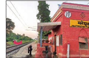
मलेथू कनक हॉल्ट रेलवे स्टेशन।

बीकापुर अयोध्या अमृत विचार: अयोध्या-प्रयागराज रेलखंड पर स्थित चौरैबाजार व मलेथू कनक हॉल्ट रेलवे स्टेशन पर महीनों से ट्रेन टिकट बिक्री का कार्य ठप है। इससे अयोध्या और प्रयागराज की ओर जाने वाले मुसाफिरों को परेशानियों का सामना करना पड़ रहा है। मलेथू कनक स्टेशन पर टिकट बिक्री का कार्य ठेके पर किया जाता है। सात अगस्त को टेंडर की अवधि समाप्त हो जाने के बाद नया टेंडर अभी नहीं हुआ। जिसके चलते टिकट बिक्री का कार्य बाधित है। चौरै बाजार रेलवे स्टेशन के टिकट विक्रेता से