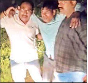
घायल बदमाश को लाते पुलिसकर्मी ।