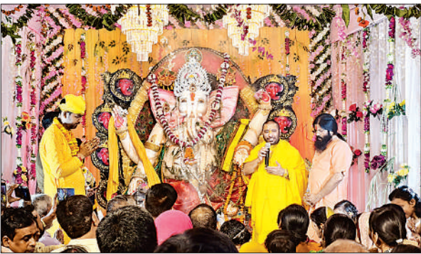
भगवान श्री गणेश की आरती करते श्रद्धालु ।