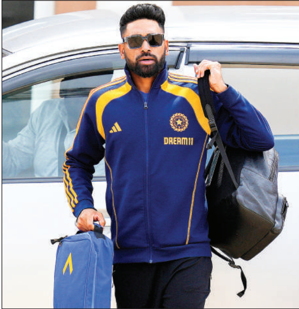
एशिया कप की तैयारी : क्रिकेटर मोहम्मद सिराज रविवार को बेंगलुरु स्थित बीसीसीआई सेंटर ऑफ एक्सीलेंस ग्राउंड पर पहुंचे।

लवलीना ने कहा जब मैंने अपनी अकादमी शुरू करने के बारे में सोचा तो मैंने पेरिस (ओलंपिक) तक खेलने की योजना बनाई थी और उसके बाद मैं संन्यास ले सकती थी, लेकिन पेरिस में नतीजा वैसा नहीं रहा जैसा मैंने सोचा था। अगर मैं वहां पदक जीत लेती तो