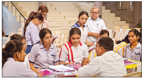
जेबी अकादमी में आयोजित कैंरिअर मेला में प्रतिभाग करते छात्र-छात्राएं।