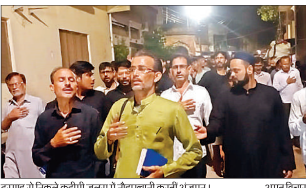
दरगाह से निकले कदीमी जुलूस में नौहाखानी करती अंजुमन।