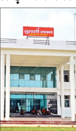
अवध विवि में बना तुलसी भवन।

अयोध्या कार्यालय। अमृत विचार : अवध विश्वविद्यालय में आठ करोड़ रुपये की लागत से निर्मित तुलसी भवन अपनी उपयोगिता साबित करने में विफल साबित हो रहा है। इस भवन में विभिन्न विषयों की कक्षाएं शुरू करने का निर्णय लिया गया था, लेकिन कक्षाएं संचालित नहीं हो पा रही हैं। प्रचेता भवन से तुलसी भवन में शिफ्ट की गई कक्षाओं के लिए न तो उचित व्यवस्था है और न ही समय पर पढ़ाई शुरू हो पाई है। छात्रों का कहना है कि विश्वविद्यालय प्रशासन की लापरवाही के कारण तुलसी भवन में मूलभूत सुविधाओं का अभाव है। छात्रों ने मुख्यमंत्री को पत्र लिखकर