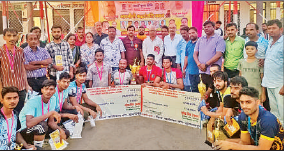
विजेता खिलाड़ियों को किया गया पुरस्कृत।