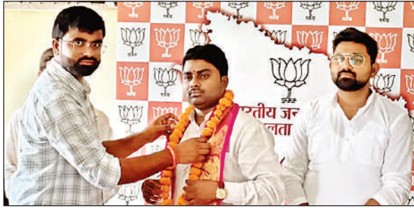
भाजपा कार्यालय पर क्षेत्रीय संयोजक का स्वागत करते जिला संयोजक।