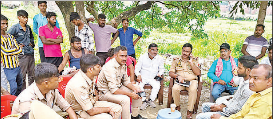
गांव में तैनात पुलिस बल।