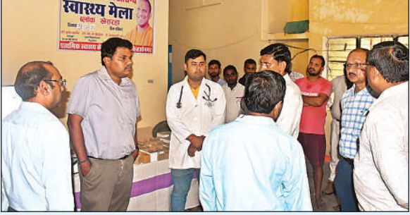
जन आरोग्य मेला का निरीक्षण करते हुए जिलाधिकारी।

सिद्धार्थ नगर , अमृत विचार : जिलाधिकारी डॉक्टर राजा गणपति आर द्वारा प्राथमिक स्वास्थ्य केंद्र कठमौरवा विकासखंड खेसरहा एवं प्राथमिक स्वास्थ्य केंद्र घोसियारी बाजार विकासखंड खेसरहा में आयोजित मुख्यमंत्री जन आरोग्य मेला का निरीक्षण किया गया। निरीक्षण के दौरान जिलाधिकारी द्वारा ओपीडी रजिस्टर को देखा गया। जिलाधिकारी ने ओपीडी रजिस्टर में मरीजों के मोबाइल नंबर दर्ज करने का निर्देश दिया। जिलाधिकारी से संबंधित डॉक्टर को निर्देश दिया कि मरीज का सही दंग से इलाज किया जाए मरीज को कोई परेशानी नहीं होनी चाहिए। जिलाधिकारी द्वारा स्वास्थ्य केंद्र पर