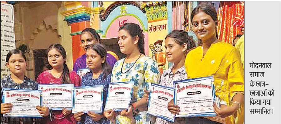
मोदनवाल समाज के छात्र-छात्राओं को किया गया सम्मानित।