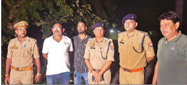
कार्रवाई करने वाली एसटीएफ व पुलिस टीम ।