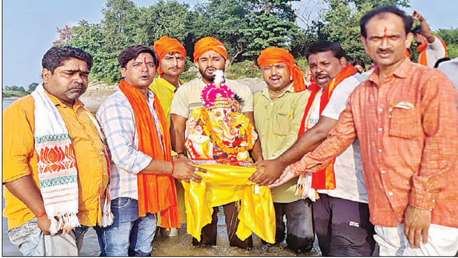
गणेश प्रतिमा विसर्जित करते हुए श्रद्धालु।