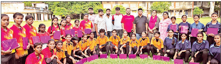
बालिका टेनिसबॉल क्रिकेट प्रतियोगिता की विजेता रही टीबीसीए टीम।