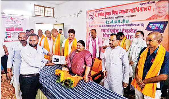
अशोक स्मारक महाविद्यालय में छात्र को टैबलेट प्रदान करती विधायक ।