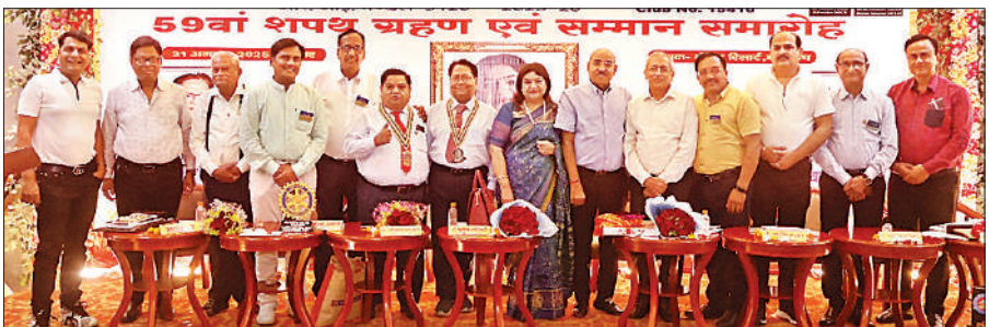
अधिष्ठापन समारोह के दौरान मंच पर मौजूद रोटरी क्लब के पदाधिकारी।