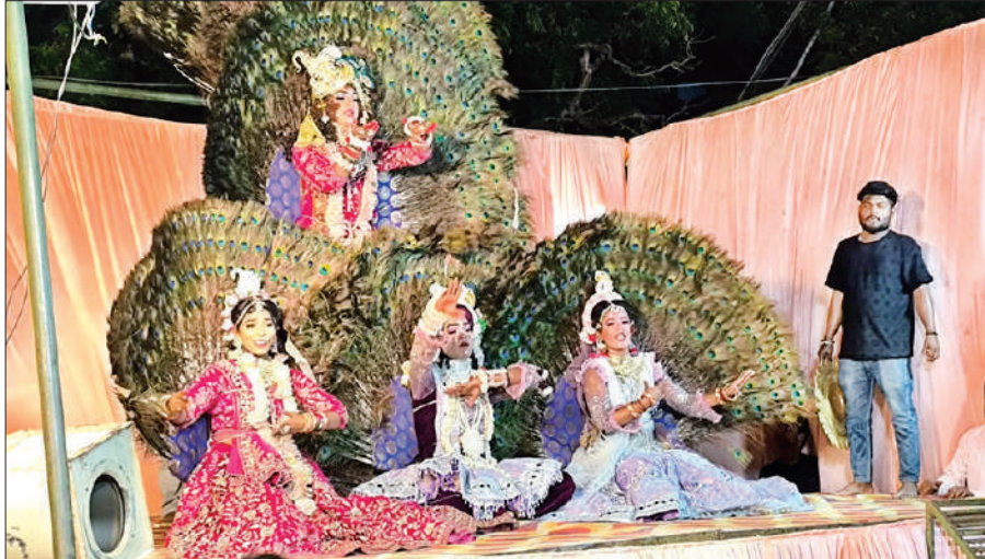
भूमगंज बाजार स्थित दुर्गा पूजा परिसर में आयोजित गणेशोत्सव में राधा-कृष्ण की झांकी प्रस्तुत करते कलाकार।