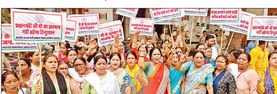
कांग्रेस कार्यालय के बाहर प्रदर्शन करती भाजपा महिला मोर्चा की कार्यकर्ता।