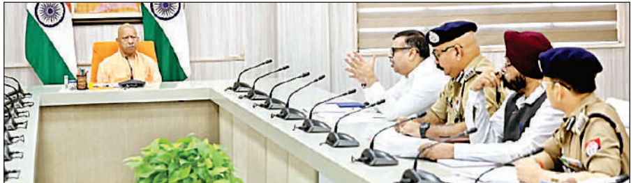
लखनऊ में अपने सरकारी आवास पर कारागार प्रशासन एवं सुधार सेवाओं को लेकर समीक्षा बैठक करते मुख्यमंत्री योगी।

मुख्यमंत्री योगी सोमवार को कारागार प्रशासन एवं सुधार सेवाओं की समीक्षा बैठक में सुप्रीम कोर्ट के निर्देशों के अनुरूप पारदर्शी नीति बनाने को लेकर निर्देश दे रहे थे। उन्होंने कहा कि सुप्रीम कोर्ट के निर्देशों का अनुपालन करते हुए प्रदेश की नीति को अधिक पारदर्शी और प्रभावी बनाया जाना चाहिए। मुख्यमंत्री ने स्पष्ट किया कि पात्र बंदियों की रिहाई स्वतः विचाराधीन होनी चाहिए और इसके लिए उन्हें