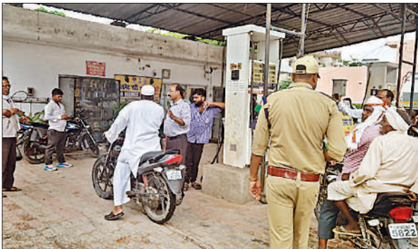
दोपहिया वाहन चालकों को हेलमेट लगाने के लिए जागरूक किया गया।

बहराइच, अमृत विचार : नो हेलमेट नो फ्यूल अभियान सख्ती से चलाया जाएगा। अभियान के पहले दिन पेट्रोल पंपों पर दोपहिया वाहन चालकों को हेलमेट लगाने के लिए जागरूक किया गया। अभियान के प्रथम दिन एआरटीओ (प्रवर्तन) ओ.पी. सिंह ने विभिन्न पेट्रोल पम्पों पर दोपहिया वाहन चालकों को जागरूक किया। वहीं पंप मालिकों को चेतावनी दी कि बिना हेलमेट किसी को पेट्रोल न दें