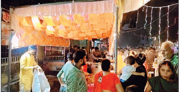
श्री शीतला माता मठिया मंदिर जलालपुर में आयोजित भंडार में प्रसाद वखते भवत।