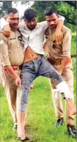
पैर में गोली लगने के बाद आरोपी को टांगकर लाते पुलिसकर्मी ।