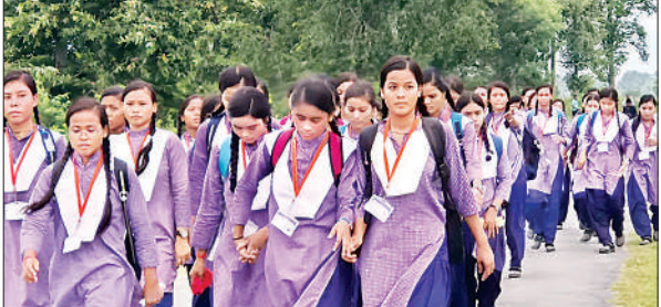
जिला मुख्यालय पर डीएम से पैदल मिलने जाती आश्रम पद्धति विद्यालय की छात्राएं।