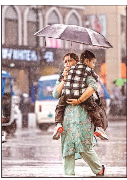
लखनऊ के हजरतगंज क्षेत्र में बारिश के बीच अपने बच्चे को छाता लगाकर भीगने से बचाती महिला।

बैठक में अधिकारियों ने जानकारी दी कि राष्ट्रीय विधिक सेवा प्राधिकरण द्वारा सुझाई गई प्रणाली को प्रदेश में अपनाने पर भी विचार किया जा रहा है, ताकि