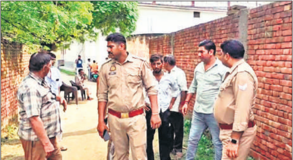
मौके पर पूछताछ करते पुलिसकर्मी।