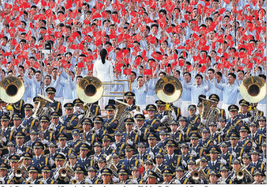
चीन के विजय दिवस पर आयोजित परेड मेंमहिला और पुरुष सैन्य कर्मियों ने सम्मिलित रूप से हिस्सा लिया।

जलालाबाद। संयुक्त राष्ट्र ने पूर्वी अफगानिस्तान में आए भूकंप में हताहतों की संख्या में और वृद्धि की चेतावनी दी है। वहीं, तालिबान प्रशासन ने कहा कि भूकंप में मरने वालों की संख्या 1,400 से अधिक हो गई और 3,000 से ज्यादा लोग घायल हुए हैं। सरकार के प्रवक्ता जबीहुल्ला मुमाहिद ने जो आंकड़े दिए हैं, वे सिर्फ कुनार प्रांत के हैं। रविवार रात आए 6.0 तीव्रता के शक्तिशाली भूकंप ने कई प्रांतों को हिलाकर रख दिया, जिससे भारी तबाही हुई।