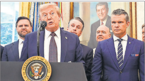
व्हाइट हाउस के ओवल ऑफिस में अपने सहयोगियों के साथ राष्ट्रपति डोनाल्ड ट्रंप।

अमेरिकी राष्ट्रपति ने दावा किया कि उन्हें टैरिफ लगाने की प्रक्रिया और उसके प्रभाव को लेकर दुनिया में सबसे अच्छी समझ है। उन्होंने कहा, मैं टैरिफ को दुनिया के किसी भी दूसरे व्यक्ति से कहीं बेहतर