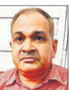
● बरेली विजिलेंस की टीम ने रामपुर के राज्यकर कार्यालय से दबोचा