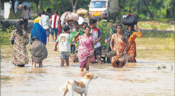
दिल्ली : यमुना की बाढ़ से घिरे इलाके से सुरक्षित स्थानों की ओर पलायन करते लोग ।

उन्होंने कहा कि यह संस्थान पांच विशेष पाठ्यक्रमों के माध्यम से ड्रोन कमांडो और ड्रोन योद्धाओं को तैयार करेगा, जिनमें मानव रहित यान (यूएवी) संचालन, ड्रोन-विरोधी युद्ध और निगरानी एवं खुफिया जानकारी एकत्र करना शामिल है। इस स्कूल में सिमुलेटर और लाइव ड्रोन फ्लाईंग जोन, यूएवी और पेलोड एकीकरण