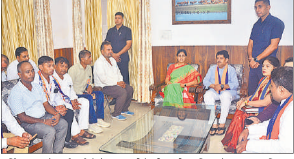
सर्किट हाउस में कार्यकर्ताओं से बात करती केन्द्रीय मंत्री अनुप्रिया पटेल।