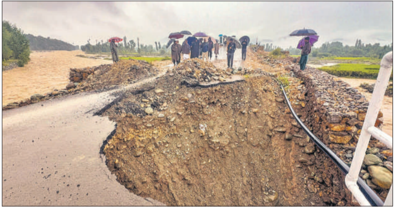
जम्मू-कश्मीर के अनंतनाग में बुधवार को एक और पुल का बड़ा हिस्सा अचानक आई बाढ़ में बह गया ।