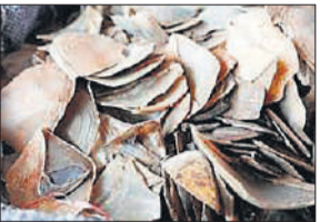
● एसटीएफ, वन्य जीव अपराध नियंत्रण और वन विभाग की संयुक्त टीम ने की कार्रवाई

इनके खिलाफ वन्य संरक्षण अधिनियम सहित अन्य धाराओं के साथ भारतीय वन अधिनियम के तहत रिपोर्ट दर्ज कर कार्रवाई की जा रही है। वन विभाग के विशेषज्ञों के मुताबिक बरामद किए