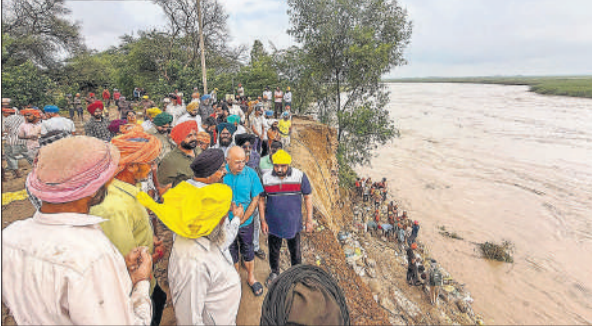
पंजाब में आम आदमी पार्टी नेता मनीष सिसोदिया ने बाढ़ प्रभावित गांव मरार का दौरा किया ।