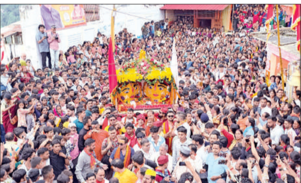
अल्मोड़ा में मां नंदा सुनंदा के दर्शन को उमड़ी श्रद्धालुओं की भीड़।