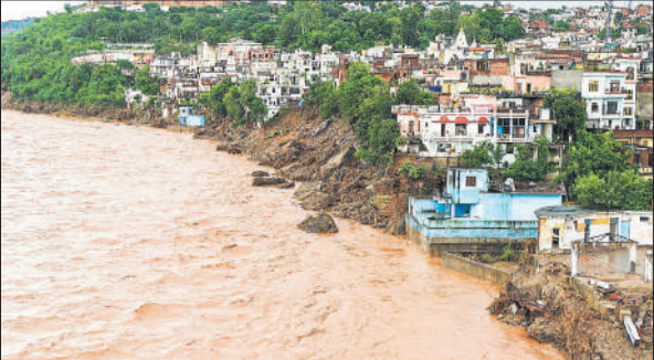
जम्मू में लगातार बारिश की वजह से उफनाई तवी नदी घनी आबादी तक पहुंच गई है ।