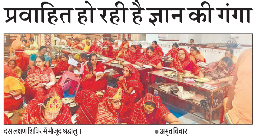
दस लक्षण शिविर में मौजूद श्रद्धालु।