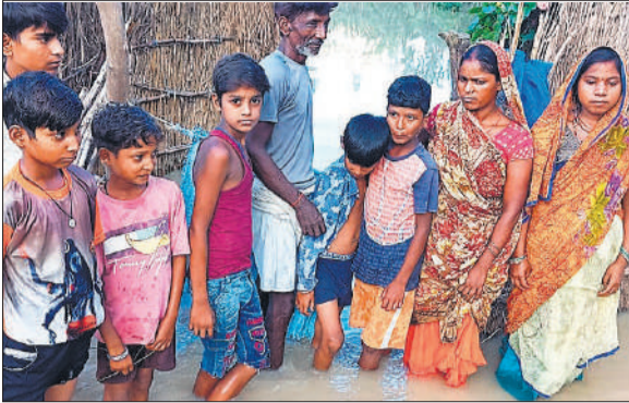
अमीर नगर गांव के घरों में पानी घुसने झोपड़ी के बाहर खड़े लोग।