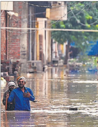
दिल्ली के हालात : कई इलाकों में कमर से ऊपर पानी ।

सात सितंबर तक के लिए बंद कर दिए गए हैं। हिमाचल प्रदेश और जम्मू कश्मीर में भी बारिश रुकने का नाम नहीं ले रही है। हिमालय से निकलने वाली सतलुज, व्यास और रावी नदियां तथा छोटी नदियां पहले से ही उफान पर हैं, जिससे शहर, गांव और कृषि भूमि जलमग्न हो गई है और सामान्य जनजीवन अस्त-व्यस्त हो गया है। पंजाब में बारिश से बाढ़ की स्थिति और बिगड़ गई है। सुबह छह बजे भाखड़ा बांध का जलस्तर 1,677.84 फुट था, जबकि इसकी अधिकतम क्षमता 1,680 फुट है। बांध में 86,822 क्यूसेक पानी का प्रवाह हुआ, जबकि 65,042 क्यूसेक पानी छोड़ा गया।