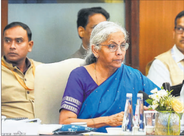
नई दिल्ली में 56वीं जीएसटी परिषद की बैठक में केंद्रीय वित्त मंत्री निर्मला सीतारमण।

मोदी ने स्वतंत्रता दिवस पर जीएसटी रिफॉर्म का ऐलान किया था : प्रधानमंत्री नरेंद्र मोदी ने स्वतंत्रता दिवस पर लाल किले से कहा था कि इस साल दिवाली में बड़ा तोहफा मिलने वाला है। हम नेक्स्ट जेनरेशन जीएसटी रिफॉर्म्स लेकर आ रहे हैं। सामान्य लोगों के लिए टैक्स कम कर देंगे, रोजमर्रा की चीजें सस्ती हो जाएंगी, लोगों को बहुत फायदा होगा।