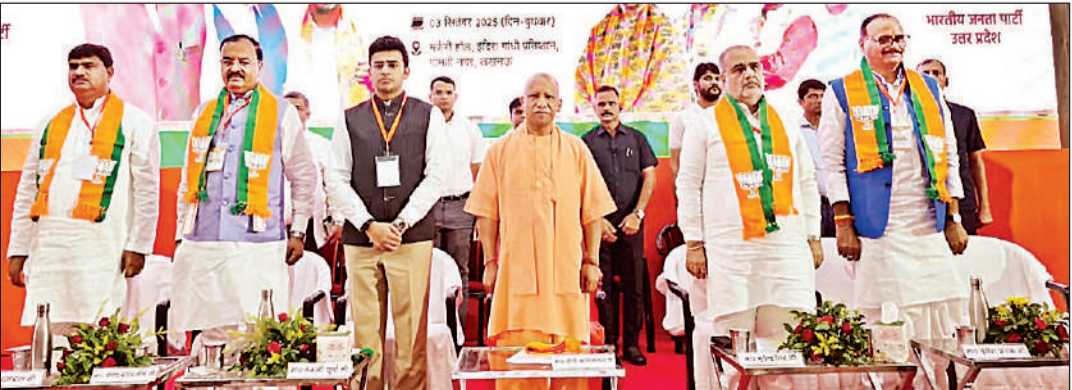
लखनऊ के इंदिरा गांधी प्रतिष्ठान में कार्यशाला के दौरान मुख्यमंत्री योगी, प्रदेश अध्यक्ष भूपेंद्र चौधरी व अन्य।

अमृत विचार: मुख्यमंत्री योगी आदित्यनाथ ने बुधवार को इंदिरा गांधी प्रतिष्ठान में सेवा पखवाड़ा अभियान कार्यशाला को संबोधित किया। मुख्यमंत्री ने एक तरफ पार्टी कार्यकर्ताओं की होसलाअफजाई की, तो उनका मार्गदर्शन भी किया। मुख्यमंत्री ने सेवा पखवाड़ा अभियान ( 17 सितंबर से दो अक्टूबर ) के तहत होने वाले कार्यक्रमों की चर्चा करते हुए अपील की कि दो अक्टूबर को विजयादशमी भी है। यह सभी कार्यक्रम भी अच्छे से हो और पूर्व-न्योहार भी आसानी से मनाए जाएं। योगी ने सेवा पखवाड़े के