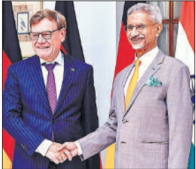
जर्मन समकक्ष वेडकुल के साथ विदेश मंत्री जयशंकर ।

दुनिया में आर्थिक अस्थिरता तथा राजनीतिक अनिश्चितता की चुनौती के बीच भारत और जर्मनी ने विभिन्न क्षेत्रों में द्विपक्षीय सहयोग को प्रगाढ़ बनाने, द्विपक्षीय व्यापार को दोगुना करने और हिन्द प्रशांत क्षेत्र सहित विश्व में नियम आधारित व्यवस्था बनाने पर जोर दिया है। जर्मनी ने यूरोपीय संघ के साथ भारत के मुक्त व्यापार समझौते का भी पुरजोर समर्थन करने के साथ-साथ आतंकवाद पर भी भारत के दृष्टिकोण को साझा करते हुए कहा