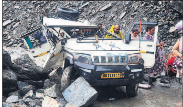
रुद्रप्रयाग में बोल्टर गिरने से बुरी तरह क्षतिग्रस्त हुआ वाहन। ● अमृत विचार

रुद्रप्रयाग जिले में सोमवार सुबह करीब 7:15 बजे केदारनाथ मार्ग पर मुनकटिया स्लाइडिंग जोन में अचानक भूस्खलन होने से पहाड़ी