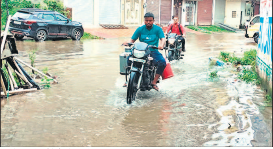
बदायूं में बरसात के पानी के बीच से निकलते बाइक सवार।

रायबरेली में वज्रपात की चपेट में आकर दादी-पोता घायल हो गए। ऊन्हाहार में एक कच्ची कोठरी गिरने से एक मासूम समेत छह लोग दब गए, जिन्हें किसी तरह बाहर निकाला गया। बदायूं के इस्लामनगर थाना क्षेत्र के समदनगर गांव में भी बारिश के चलते मकान की छत गिरने से