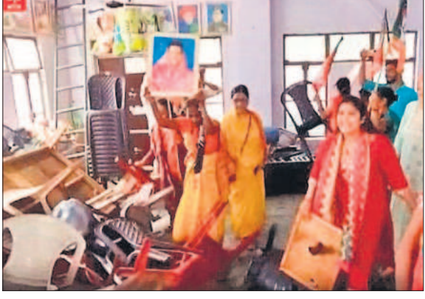
कांग्रेस कार्यालय में तोड़फोड़ करती भाजपा संगठन से जुड़ी महिलाएं।

भाजपा महिला मोर्चा की तमाम महिलाएं विलोबी मैदान में एकत्र हुईं। यहां पर सभा करने के बाद बिहार में राहुल गांधी की यात्रा