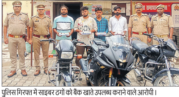
पुलिस गिरफ्त में साइबर ठगों को बैंक खाते उपलब्ध कराने वाले आरोपी।

कई राज्यों से दर्ज साइबर ठगी की शिकायतों में बैंक खाते और मोबाइल नंबर बरेली से जुड़े पाए गए थे। इसके आधार पर आरोपियों की तलाश में पुलिस और साइबर क्राइम सेल को लगाया गया था। मंगलवार रात 8 बजे पुलिस और साइबर क्राइम सेल की टीम ने शोबीपुर चौराहा से डीडीपुरम की ओर जाने वाली बंद पड़ी रेल लाइन के